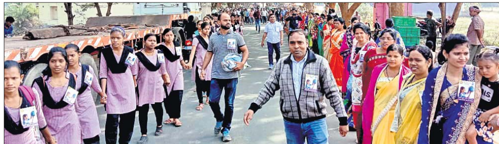
ବଗପଲ୍ଲୀଠାରେ ମାନବ ଶୃଙ୍ଖଳରେ ଛାତ୍ରାଛାତ୍ର, ମହିଳା ଓ ପ୍ରଶାସନିକ ଅଧିକାରୀ।

କନ୍ୟା ସଜନ ପୁରୁଣା ପାଇଁ ସଚେତନତା ଉଦ୍‌ଘୋଷଣାରେ ମଙ୍ଗଳବାର ବଗପଲ୍ଲୀ ବ୍ଲକ୍ ପ୍ରଶାସନ ପକ୍ଷରୁ ମାନବ ଶୃଙ୍ଖଳ ଅନୁଷ୍ଠିତ ହୋଇଥିଲା। ଏ ଉପଲକ୍ଷେ