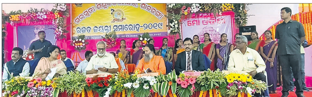
ଉପରେ ରାଜ୍ୟପାଳ, ଜିଲାପାଳ, ଏମ୍ପି, ବିଧାୟକ ଓ ଅନ୍ୟ ଅତିଥି ଉପସ୍ଥିତ ।