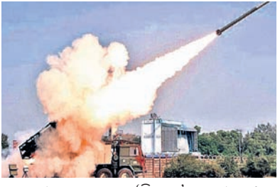
ବହୁମୁଖୀ ରକେଟ ଲକ୍ଷ୍ୟ 'ପିନାକା'ର ପରୀକ୍ଷଣ।

ବାଲେଶ୍ଵର ଜିଲ୍ଲା ଗାନ୍ଧିପୁରସ୍ଥିତ ସମ୍ପଦିତ ପରୀକ୍ଷଣ କେନ୍ଦ୍ର(ଆଇଟିଆର୍) ୩ ନମ୍ବର ଲକ୍ଷ୍ୟପାଦ୍ମ ମଙ୍ଗଳବାର ବହୁମୁଖୀ ରକେଟ ଲକ୍ଷ୍ୟ 'ପିନାକା'ର ୩୫ତମ ପରୀକ୍ଷଣ କରାଯାଇଛି। ଏସବୁ ପରୀକ୍ଷଣ ସଫଳ ହୋଇଥିବା ଆଇଟିଆର୍ ପକ୍ଷରୁ ସୂଚନା ଦିଆଯାଇଛି। ଭାରତୀୟ ବାୟୁସେନାରେ 'ପିନାକା' ରକେଟ ସାମିଲ ହେବା ପରେ କାର୍ତ୍ତିକ ମୁକ୍ତ ସମୟରେ ପ୍ରଥମେ ଏହାର ବ୍ୟବହାର କରାଯାଇଥିଲା। ଭାରତୀୟ ପ୍ରତିରକ୍ଷା ଗବେଷଣା ଉନ୍ନୟନ ମାଜଣା ଓ ଏକାନ୍ତ ଆଦି ଅନ୍ୟାନ୍ୟ ନାତି କରାଯିବା ଲାଗି ନିର୍ଦ୍ଦେଶ ହୋଇଛି।