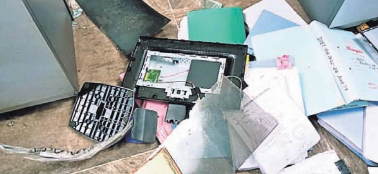
ସୋବା ସଂଘର ସଦସ୍ୟମାନେ କାର୍ଯ୍ୟାଳୟ ପରିସରରେ ଭଙ୍ଗାରୁଜା କରିଛନ୍ତି ।