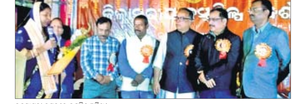
ଉଦ୍‌ଘାଟନା ଉତ୍ସବରେ ଉପସ୍ଥିତ ଅତିଥି।