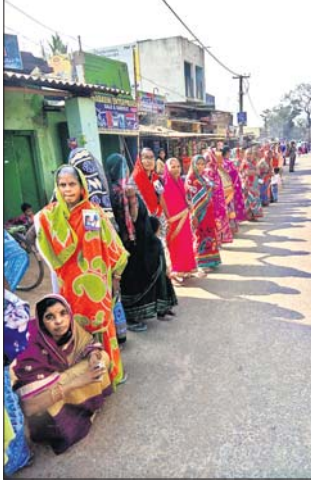
ଭାପୁରଠାରେ ମାନବ ଶୃଙ୍ଖଳ।