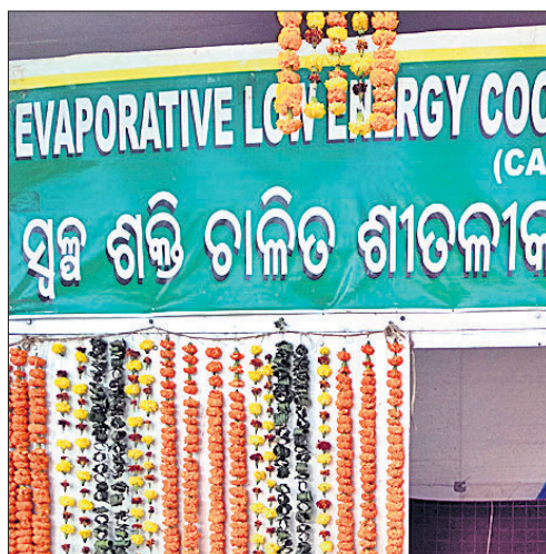
ପଲିଶ୍ରୀ ମେକାରେ ପ୍ରଦର୍ଶିତ ଶୀତଳଭଣ୍ଡାର ବୃହତ୍ ।