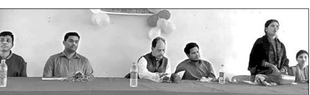
ଉଦ୍‌ଘାଟନା ଉତ୍ସବରେ ଉପସ୍ଥିତ ଅତିଥି ।