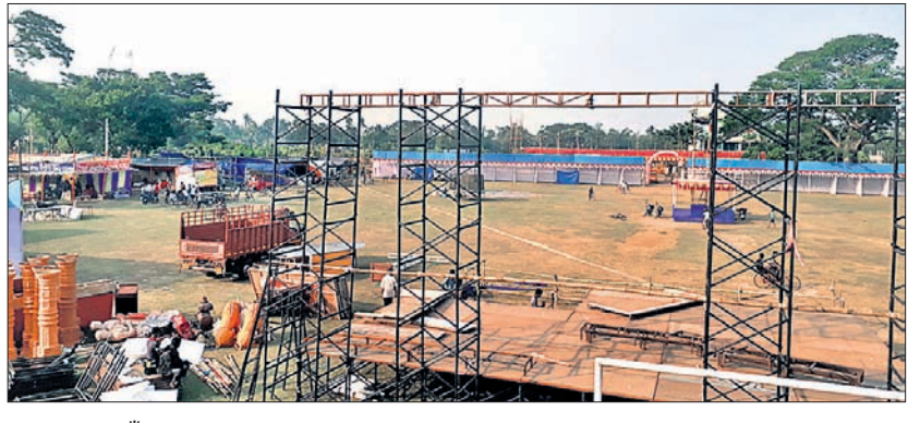
ମହୋତ୍ସବ ପାଇଁ ପ୍ରସ୍ତୁତି କାମ ଆଗେଇ ଚାଲିଛି ।

ଡେରାବିଶ, ୨୫୧୨ (ସ.ପ୍ର.) ଗୁରୁବାରଠାରୁ ଆରମ୍ଭ କରି ଡେରାବିଶ ମହୋତ୍ସବ ଆରମ୍ଭ ହେବାକୁ ଯାଉଛି ।