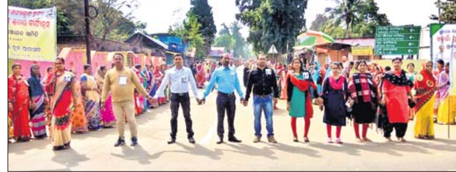
ଓଡ଼ିଶାରେ ମାନବ ଶୃଙ୍ଖଳରେ ସାମିଲ ହୋଇଥିବା ବିଭିନ୍ନ ବର୍ଗର ବ୍ୟକ୍ତି।

୪ ହଜାର ମହିଳା ସ୍ୱୟଂ ସହାୟକ ଗୋଷ୍ଠୀର ସଭ୍ୟ ଯୋଗ ଦେଇଥିଲେ। ବାଲ୍ୟବିବାହ ଓ କନ୍ୟାଭୁଣା ହତ୍ୟା ରୋକିବା ପାଇଁ ମହିଳାମାନଙ୍କୁ ପ୍ରଥମେ ସଚେତନ କରିବା ଲକ୍ଷ୍ୟରେ ମହିଳା ସ୍ୱୟଂ ସହାୟିକା ଗୋଷ୍ଠୀମାନଙ୍କୁ ସାମିଲ କରାଯାଇଛି। ଭାପୁର ବଜାର ପ୍ରାଣୀ ଚିକିତ୍ସାଳୟଠାରୁ ଡାକ୍ତରଖାନା ଚଳନ୍ତ ପର୍ଯ୍ୟନ୍ତ ମାନବ ଶୃଙ୍ଖଳ କରାଯାଇଥିଲା। ରାଜ୍ୟ ଅଜ୍ଞାନତ୍ରୀ କେନ୍ଦ୍ରରେ କର୍ମୀ ନିମିତ୍ତ ପାଟଯୋଗୀ ଓ ଡାକ୍ତରଖାନା ସ୍ୱାସ୍ଥ୍ୟକର୍ମୀଙ୍କ ନେତୃତ୍ୱରେ ମାଆମାନେ ବାଲ୍ୟବିବାହ ଏଥିରେ ବ୍ଲକ୍ ବିଭିନ୍ନ ଗ୍ରାମରୁ ପ୍ରାୟ