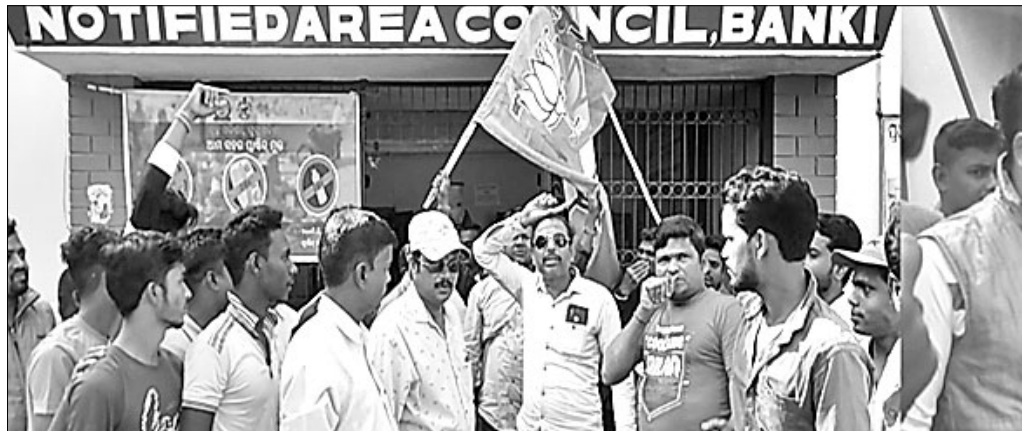
ଭାଙ୍ଗିପାର ପକ୍ଷରୁ ଏନ୍‌ଏସି କାର୍ଯ୍ୟାଳୟ ସମ୍ମୁଖରେ ବିକ୍ଷୋଭ କରାଯାଇଛି।

ବାଙ୍କୀ, ୨୪।୧୨ (ସ.ପ୍ର.) ଏନ୍‌ଏସିର ମନମୁଖ୍ୟ କାର୍ଯ୍ୟ ଚାଲିଥିବା ଅଭିଯୋଗ କରି ଭାଙ୍ଗିପାର ପକ୍ଷରୁ କାର୍ଯ୍ୟାଳୟ ସମ୍ମୁଖରେ ମଙ୍ଗଳବାର ବିକ୍ଷୋଭ ପ୍ରଦର୍ଶନ କରାଯାଇଛି। ଏନ୍‌ଏସି ଅଞ୍ଚଳରେ ରାସ୍ତା ନିର୍ମାଣ ହେଉ ନଥିବା ବେଳେ ବିଭିନ୍ନ ଉନ୍ନୟନ ମୂଳକ କାର୍ଯ୍ୟ ହେଉନାହିଁ ବୋଲି ଭାଙ୍ଗିପାର ପକ୍ଷରୁ ଅଭିଯୋଗ ହୋଇଛି। ଏନେଇ ରାଷ୍ଟ୍ରୀୟ ଭାଙ୍ଗିପାର କୃଷକ ମୋର୍ଚ୍ଚା କାର୍ଯ୍ୟକାରୀ କମିଟି ସଭ୍ୟ