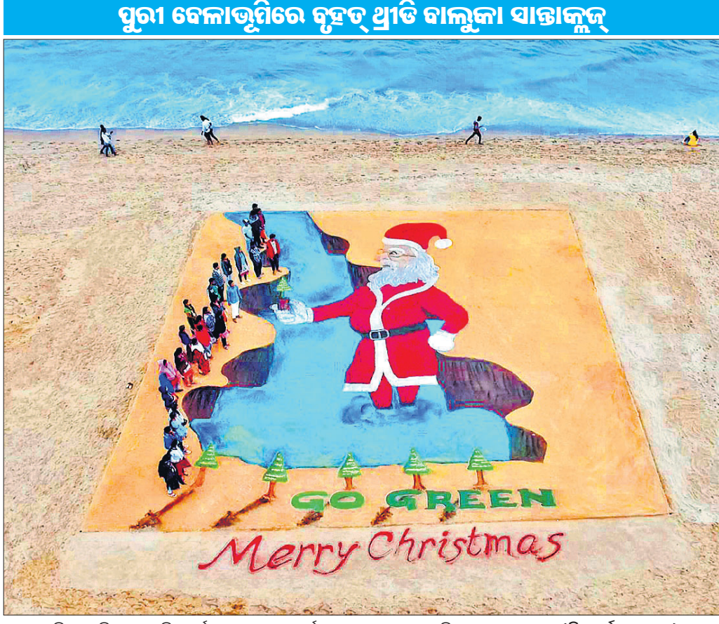
ପବିତ୍ର ବଡ଼ଦିନ ଅବ୍ୟବହୃତ ପୂର୍ବ ମଙ୍ଗଳବାର ପୁରୁଣ ନଗରୀର ପ୍ରସ୍ତୁତ କରିଥିବା ବାଲୁକା କଳା। (ରିପୋର୍ଟ: ପୃଷ୍ଠା-୯)