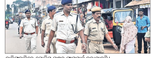
ବରିକାବାଡ଼ିରେ ପୋଲିସ୍ ପକ୍ଷରୁ ଯାତାୟତ କରାଯାଇଛି।

ଭୁବନେଶ୍ୱର, ୨୫ ଡିସେମ୍ବର (ସ୍ପେଶାଲ) କେବଳ ରାଜ୍ୟ ଗୃହ, ଦେଶର ଯେ କୌଣସି ସ୍ଥାନରୁ କାର୍ଡାୟ ଖାଦ୍ୟ ସୁରକ୍ଷା ଆଇନ(ଏନ୍ଏସଏଏ)ରେ ସାମିଲ ହୋଇଥିବା ହିତାଧିକାରୀମାନେ ସେମାନଙ୍କର ରାଶନ ନେଇପାରିବେ।