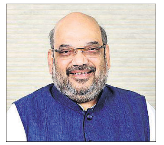
ଜନସଂଖ୍ୟା ରେଜିଷ୍ଟରକୁ ନେଇ ରାଜନୀତି କରନ୍ତୁ ନାହିଁ

ଜାତୀୟ ଜନସଂଖ୍ୟା ପଞ୍ଜିକା (ଏନ୍‌ପିଆର୍) ଏବଂ ଜାତୀୟ ନାଗରିକ ପଞ୍ଜିକା (ଏନ୍‌ଆର୍ସି) ମଧ୍ୟରେ କିଛି ସମ୍ପର୍କ ନାହିଁ। ତେଣୁ ଏନ୍‌ପିଆର୍ସିକୁ ନେଇ ରାଜ୍ୟ ସରକାରଙ୍କୁ ରାଜନୀତି କରନ୍ତୁ ନାହିଁ ବୋଲି ମଙ୍ଗଳବାର ସ୍ୱରାଷ୍ଟ୍ରମନ୍ତ୍ରୀ ଅମିତ୍ ଶାହା କହିଛନ୍ତି। ଏହି ପରିପ୍ରେକ୍ଷାରେ ସେ ଓଡ଼ିଶା ଉପାହରଣ ମଧ୍ୟ ଦେଇଛନ୍ତି।