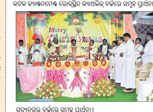
ସତ୍ୟନଗର ଚର୍ଚ୍ଚରେ ସମୂହ ପ୍ରାର୍ଥନା।

ବଡ଼ଦିନ ଅବସରରେ ବୁଧବାର ସକାଳୁ ଚର୍ଚ୍ଚ ପରିସରରେ ଉତ୍ସବ ଆରମ୍ଭ ହେବ। ଏହି ଉପଲକ୍ଷେ ଗଥର ସମୂହ ପ୍ରାର୍ଥନା ଅନୁଷ୍ଠିତ ହେବ। ଶିଶୁ ଯିଶୁଙ୍କ ପାଦ ସ୍ପର୍ଶ କରି ଆଶୀର୍ବାଦ ଲାଭ କରିବେ ଶୁଭାକୁ। ସକାଳ ୧୦ଟାରେ ପ୍ରଥମେ ଲ'ଲିଗରେ ଏବଂ ଅପରାହ୍ନ ୩ଟା ୩୦ ଓ ସନ୍ଧ୍ୟା ୬ଟାରେ ଓଡ଼ିଆରେ ସମୂହ ପ୍ରାର୍ଥନା କରାଯିବ। ଏହାସହ ପ୍ରସ୍ତାବ, ବାଇବେଲ୍ ପାଠ, ବିଦ୍ୟାୟତ୍ତ ମାଧ୍ୟମରେ ଇଶ୍ୱରଙ୍କୁ ଆରାଧନା କରାଯିବ। ସନ୍ଧ୍ୟା ୫ଟାକୁ ରାତି ୯ଟା ପର୍ଯ୍ୟନ୍ତ ସାଂସ୍କୃତିକ କାର୍ଯ୍ୟକ୍ରମ ଆୟୋଜିତ ହେବ। ସେହିଭଳି ଯୁନିଟ୍-୮, ବରପୁରୀ ପ୍ରଭୃତି ସ୍ଥାନରେ ଥିବା ଚର୍ଚ୍ଚରେ ମଧ୍ୟ ବଡ଼ଦିନ ପାଇଁ ସ୍ୱତନ୍ତ୍ର କାର୍ଯ୍ୟକ୍ରମ ଆୟୋଜନ କରାଯାଇଛି।