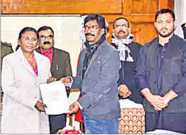
ରାଷ୍ଟ୍ର, ୨୫.୧୨ (ପି.ଟି.)

ସଦ୍ୟ ଅନୁଷ୍ଠିତ ବିଧାନସଭା ନିର୍ବାଚନରେ ବିଜୁ ବିଜୟ ପରେ ଝାଡ଼ଖଣ୍ଡ ମୁକ୍ତି ମୋର୍ଚ୍ଚା (ଜେଏମ୍‌ଏମ୍) କାର୍ଯ୍ୟକାରୀ ଅଧ୍ୟକ୍ଷ ହେମନ୍ତ ସୋରେନ ମଙ୍ଗଳବାର ରାଜ୍ୟପାଳ ଡ୍ରୌପଦୀ ମୂର୍ମୁଙ୍କୁ ଭେଟି ସରକାର ଗଠନ ପାଇଁ ଦାବି ଜଣାଇଛନ୍ତି। ସେ ଆସନ୍ତା ୨୯ ତାରିଖ ଅପରାହ୍ଣ ୧୩ରେ ଝାଡ଼ଖଣ୍ଡରୁ ନୂଆ ମୁଖ୍ୟମନ୍ତ୍ରୀ ଭାବେ ଶପଥଗ୍ରହଣ କରିବେ।