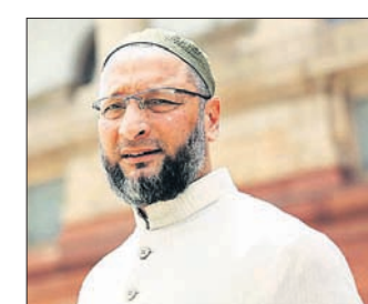
ଅଶାନାଗରିକଙ୍କଠାରୁ ଅଲଗା କରିବା ପରେ ଏନ୍‌ଆର୍ସି କରାଯିବ।

ଦେଶବ୍ୟାପୀ ନାଗରିକମାନଙ୍କ ଜାତୀୟ ପଞ୍ଜିକା, ଯାହାକି ଦେଶରେ ଏନ୍‌ଆର୍ସି ଲାଗୁ କରିବାର ଅନ୍ୟ ନାମ। ଏନ୍‌ପିଆର୍ ଏବଂ ଏନ୍‌ଆର୍ସି ମଧ୍ୟରେ ଥିବା ସମ୍ପର୍କକୁ ବୁଝାଇବା ପଡ଼ିବ। ଏନ୍‌ପିଆର୍ ଦେଶରେ ରହୁଥିବା ସମସ୍ତ ସାଧାରଣ ବାସିନ୍ଦାଙ୍କର ସଂଗୃହୀତ ତଥ୍ୟ। ୨୦୦୩ର ନାଗରିକତ୍ୱ ଏବଂ ଏନ୍‌ଆର୍ସି ନାଗରିକମାନଙ୍କୁ