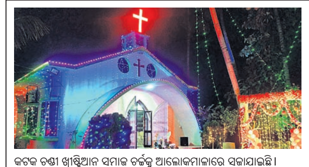
କଟକ ଚଣ୍ଡା ଖ୍ରୀଷ୍ଟିଆନ ସମାଜ ଚର୍ଚ୍ଚକୁ ଆଲୋକମାଳାରେ ସଜାଯାଇଛି।