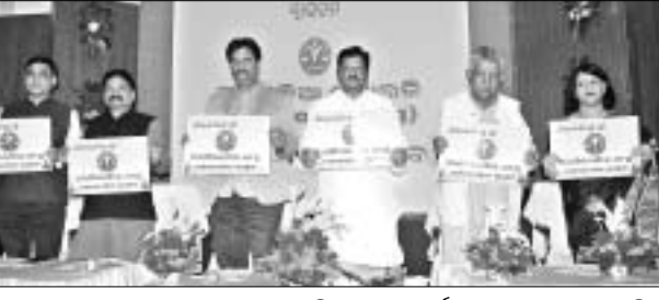
ଆଇନ ମନ୍ତ୍ରୀ ପ୍ରତାପ ଜେନା ଓ ଅନ୍ୟ ଅତିଥି ଡ୍ରେସ୍ ପୋର୍ଟାଲକୁ ଉନ୍ମୋଚନ କରୁଛନ୍ତି