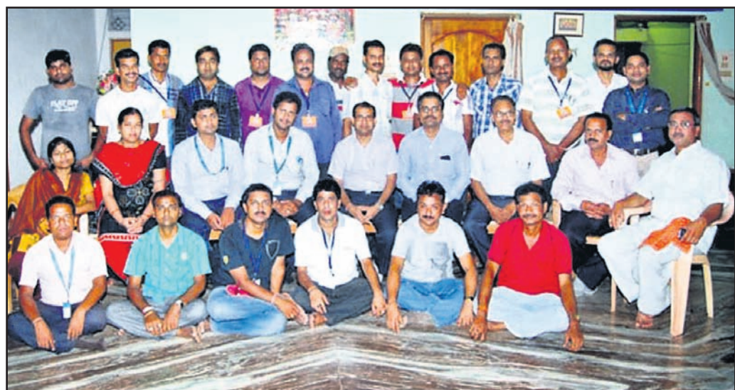
'ଆଶ୍ରୟ' ସଂଗଠନର ସଦସ୍ୟମାନେ।