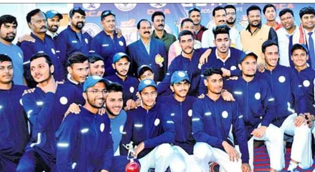
ଅତିଥିକ ସହ ବିଜୟୀ ସୌରାଷ୍ଟ୍ର ଦଳ ।