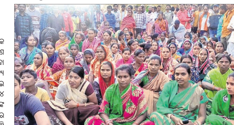
ଅଭିଯୁକ୍ତଙ୍କ ଗିରଫ ଦାବିରେ ଉତ୍ତେଜିତ ଗ୍ରାମବାସୀ ସିହେକେଲା ଥାନା ଘେରାଇ କରିଛନ୍ତି ।

ବଲାଙ୍ଗୀର ଅପିସ/ବନୋପୁଣ୍ଡା, ୨୮.୧୨ (ଡି.ଏନ୍.ଏ.) ବଲାଙ୍ଗୀର ଜିଲ୍ଲା ବନୋପୁଣ୍ଡା ବ୍ଲକ୍ ସିହେକେଲା ଥାନା ଅଧୀନ ଏକ ଗ୍ରାମର ଜଣେ ନାବାଳିକା (୧୨)ଙ୍କୁ ବଳି ଦିଆଯାଇଥିବା ଅଭିଯୋଗ ହୋଇଛି । ଏହି ବଳି ଅନ୍ୟ କେହି ନୁହେଁ, ବରଂ ନାବାଳିକାଙ୍କ ବଡ଼ଭାଇ ତନ୍ତୁ ସାଧନା ପାଇଁ ଦେଇଛନ୍ତି । ଗତ ୨୪ ତାରିଖରୁ ସଂପୂର୍ଣ୍ଣ ନାବାଳିକା ବଡ଼ଭାଇଙ୍କ ସଙ୍ଗରେ ଯାଇ ନିଖୋଜ ହେବା ପରେ ଏହି ସନ୍ଦେହ ଗ୍ରାମବାସୀଙ୍କ ମଧ୍ୟରେ ସୃଷ୍ଟି ହୋଇଛି । ଅନ୍ୟପକ୍ଷେ ନାବାଳିକାଙ୍କ ବଡ଼ଭାଇ ପୂର୍ବରୁ ମଧ୍ୟ ଏକ ବଳି ଅଭିଯୋଗରେ ଗିରଫ ହୋଇ କେଲରେ ଥିଲେ । ଗତ କିଛିମାସ ହେବ ସେ କାମିନୀରେ ଘରକୁ ଫେରିଥିଲେ । ସେ ତନ୍ତୁ ସାଧନା କରନ୍ତି । ଗତ ସୂର୍ଯ୍ୟୋପରାଗ ତଥା ଅମାବାସ୍ୟା ତିଥିରେ ସେ ନିଜ ଭଉଣୀଙ୍କୁ ବଳି ଦେଇଥିବା ଗ୍ରାମବାସୀ ଥାନାରେ ଅଭିଯୋଗ କରିଛନ୍ତି । ଏହାକୁ ନେଇ ଶନିବାର ଗାଁରେ ଉତ୍ତେଜନା ପ୍ରକାଶ ପାଇଥିଲା । ଅଭିଯୁକ୍ତଙ୍କ ଗିରଫ ଦାବିରେ ଗ୍ରାମବାସୀ ଥାନା ଘେରାଇ କରିଥିଲେ । ଶେଷରେ ପୋଲିସ୍ ନାବାଳିକାଙ୍କ ଭାଇଙ୍କୁ