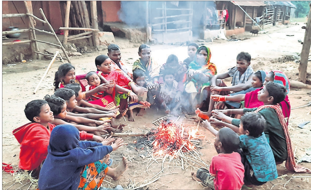
ଦାରିଙ୍ଗବାଡ଼ି ବ୍ଲକ୍ କିରୁକି ପଞ୍ଚାୟତର ଏକ ସାହିରେ ଲୋକେ ଶୀତବାତରୁ ରକ୍ଷା ପାଇବାକୁ ନିଆଁ ଜାଳି ବସିଛନ୍ତି।

ଭୁବନେଶ୍ୱର, ୨୮.୧୨ (ବ୍ୟୁରୋ) ରାଜ୍ୟରେ ଆରମ୍ଭ ହୋଇଛି ପ୍ରବଳ ଶୀତ। ଗାଁ ଗଣ୍ଡାକୁ ଆରମ୍ଭ କରି ସହର ଯାଏ ସବୁଠି ଅରାଜି ହାଡ଼ଜଣା ଶୀତ । ସଞ୍ଜ ନଇଁବା ମାତ୍ରେ ଶୀତ ମାଡ଼ିଆସୁଛି। ଗ୍ରାମାଞ୍ଚଳରେ ରାସ୍ତାଘାଟ ଶୁନଶାନ୍ ହୋଇ ଯାଉଛି। ବେହ ମୁଣ୍ଡ କାଳୁଆ କରି ପକାଇଛି। ଶୀତ ବାତରୁ ରକ୍ଷା ପାଇବା ଲାଗି ଲୋକମାନେ ନିଆଁ ପୋଡ଼ିଥିବା