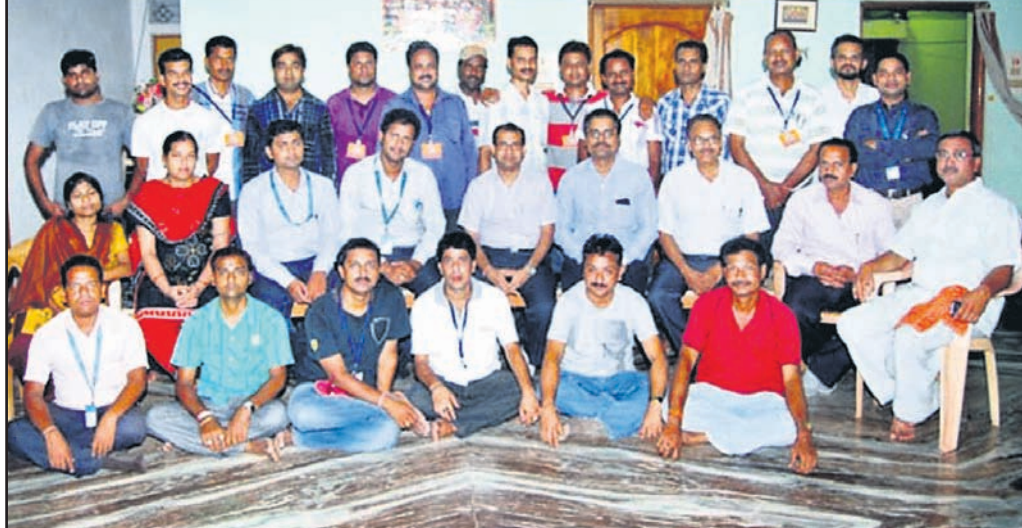
'ଆଶ୍ରୟ' ସଂଗଠନର ସଦସ୍ୟମାନେ।