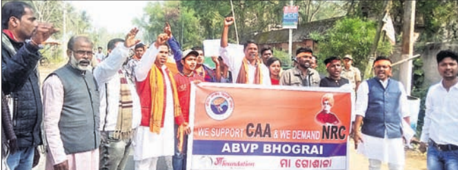
ଏବିଭିପି ପକ୍ଷରୁ ବାହାରିଥିବା ସମର୍ଥନ ଶୋଭାଯାତ୍ରା।