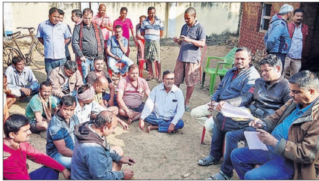
ଚାଷୀଙ୍କ ଦ୍ୱାରା ଅଟକ ୩ ଅଧିକାରୀ।