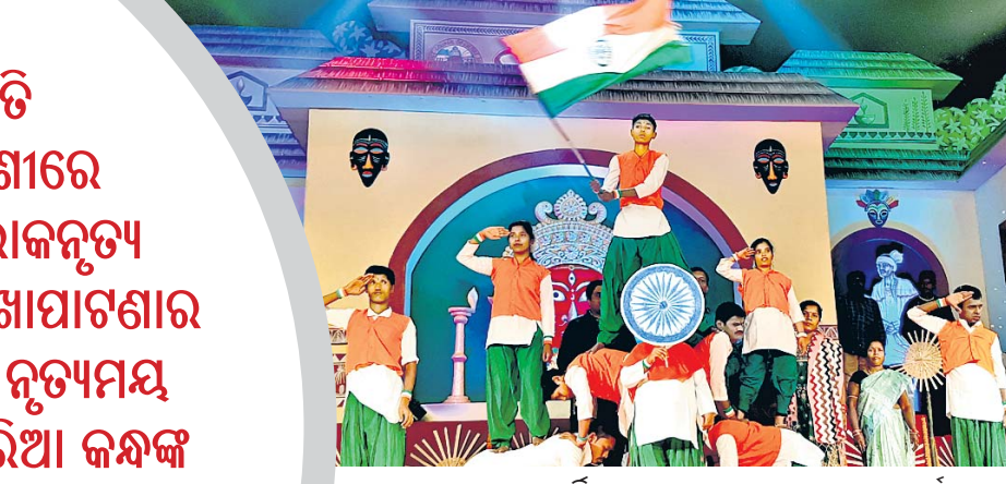
ଜ୍ଞାନବର୍ଦ୍ଧନୀ ଗ୍ରୁପ୍ ପକ୍ଷରୁ ଦେଶାତ୍ମବୋଧକ କାର୍ଯ୍ୟକ୍ରମ ।