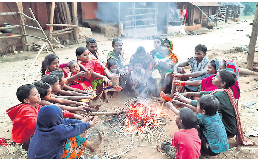
ଦାରିଙ୍ଗବାଡ଼ି ବ୍ଲକ୍ କଲବଲ ପଞ୍ଚାୟତର ଏକ ସାହିରେ ଲୋକେ ଶୀତ ଦାଉରୁ ରକ୍ଷା ପାଇବାକୁ ନିଆଁ ଜାଳି ବସିଛନ୍ତି।