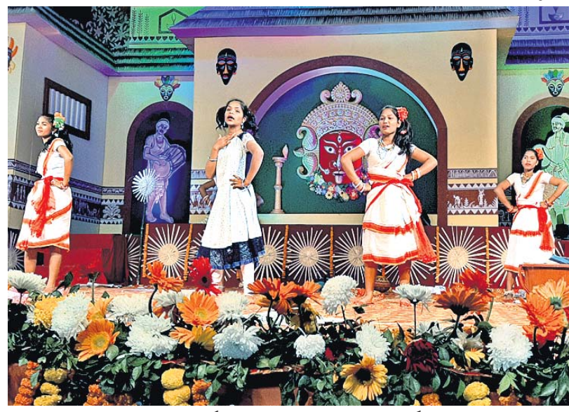
ହାଟପୁରିଗୁଡ଼ା ସର୍ବିୟୁଲ-୩ ପକ୍ଷରୁ ପରିବେଷିତ କାର୍ଯ୍ୟକ୍ରମ ।