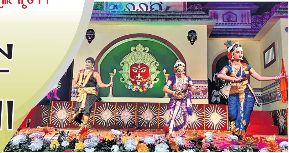
ବିଶାଖାପାଟଣାର ଭରତନାଟ୍ୟମ ନୃତ୍ୟ ।