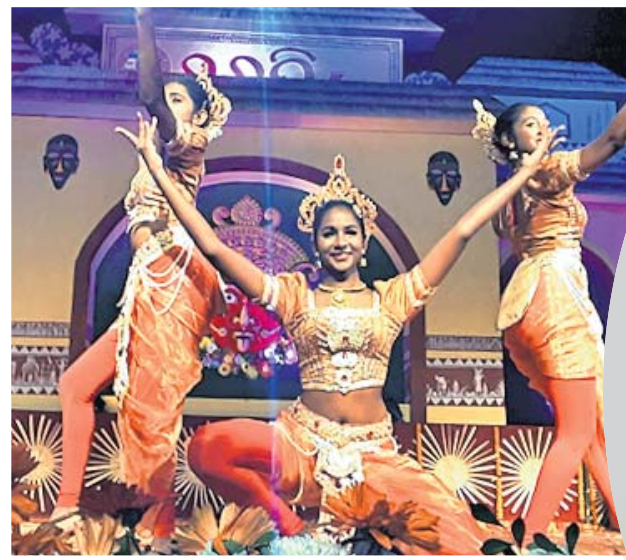
ଶ୍ରୀଲଙ୍କାର ଲୋକନୃତ୍ୟ ।

ଚଳଚ୍ଚିତ୍ର ଚମକ ଚୋରେଇ ନେଇଛି ସଭିଜ୍ଞ ମନ । ଆନମନା କରୁଛି ସବୁ ବର୍ଗର ଦର୍ଶକଙ୍କୁ । ତୃତୀୟ ସନ୍ଧ୍ୟାରେ ଚଳଚ୍ଚି ମଞ୍ଚରେ ଶ୍ରୀଲଙ୍କା କଳାକାରଙ୍କ ନୃତ୍ୟ ଓ ଓଡ଼ିଶାରେ ବିଭୋର ହୋଇଥିଲେ ଦର୍ଶକ । ଭିକ୍ଷୁ ସ୍ଵାଦର ଲୋକନୃତ୍ୟ ବିମୋହିତ କରିଥିଲା ସମସ୍ତଙ୍କୁ । ପରେ ପରେ ବିଶାଖାପାଟଣାର ନୃତ୍ୟଶିଳ୍ପୀମାନେ ଭରତନାଟ୍ୟମରେ ପରିବେଶକୁ ନୃତ୍ୟମୟ କରିଥିଲେ । ସବୁଠୁ ବେଶି ଆକର୍ଷଣୀୟ ଥିଲା ତଙ୍ଗରିଆ କନ୍ଧଙ୍କ ପାରମ୍ପରିକ ଲୋକନୃତ୍ୟ ଓ ରାୟଗଡ଼ାର କାଠପୁତୁଲି ନୃତ୍ୟ ।