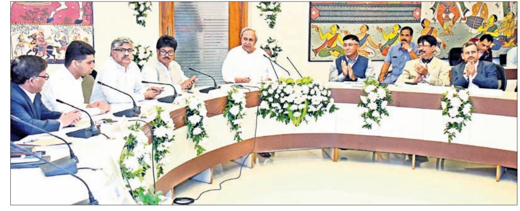
ଇ- ସାର୍ବିକ୍ସକେନ୍, ମୋବାଇଲ ପାଉଡି ଆପ୍ ସେବାର ଶୁଭାରମ୍ଭ ଅବସରରେ ମୁଖ୍ୟମନ୍ତ୍ରୀ ନବୀନ ପଟ୍ଟନାୟକ ଓ ଅନ୍ୟମାନେ।

ଭୂବନେଶ୍ୱର, ୨୮୧୨ (ବ୍ୟୁରୋ) ଜମିଜମା ପାଉଡି କାର୍ଯ୍ୟକ୍ରମ ଆଉ ରାଜ୍ୟ ନିରୀକ୍ଷକଙ୍କ କାର୍ଯ୍ୟାଳୟକୁ ଯିବାକୁ ପଡ଼ିବ ନାହିଁ। ଘରେ ବସି ଲୋକମାନେ ମୋବାଇଲ ଆପ୍ କରିଆରେ ଜମିଜମାର ଖଜଣା ଦେଇ ପାଉଡି ପାଇପାରିବେ। ଏହାଛଡ଼ା ରାଜ୍ୟ ସେବାକୁ ଲୋକାଭିମୁଖୀ କରିବାକୁ ବାସ୍ତୁନୀ, ଆୟ ଏବଂ ଅନ୍ୟାନ୍ୟ ସାର୍ବିକ୍ସକେନ୍ ସବୁ ହିରାଧିକାରୀଙ୍କ ନିକଟ ଯୋଗିତ ତଥ୍ୟ ଆଧାର (ସେଲ୍ଫ ସାର୍ବିକ୍ସକେନ୍)ରେ ପ୍ରଦାନ କରିବାକୁ ମୁଖ୍ୟମନ୍ତ୍ରୀ ନବୀନ ପଟ୍ଟନାୟକ ନିର୍ଦ୍ଦେଶ ଦେଇଛନ୍ତି।