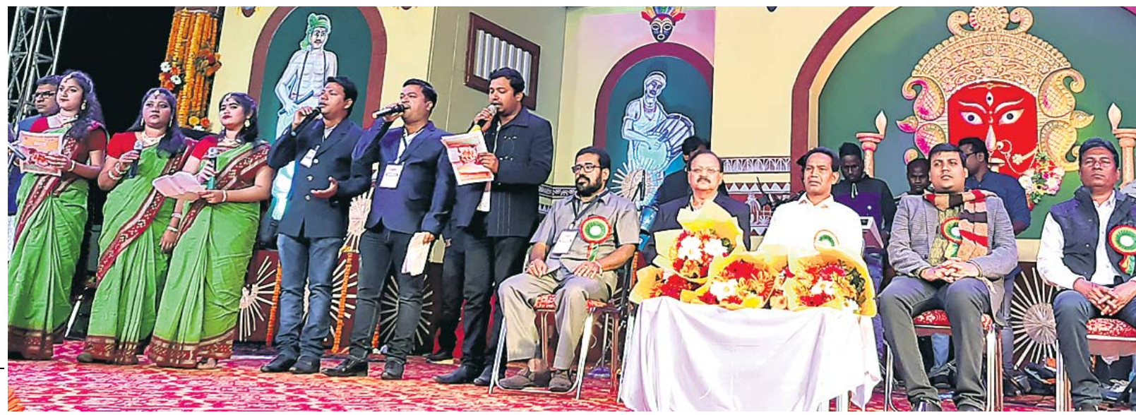
ଚଳଚ୍ଚିତ୍ର ମଞ୍ଚରେ ଉପସ୍ଥିତ ଅତିଥି ।