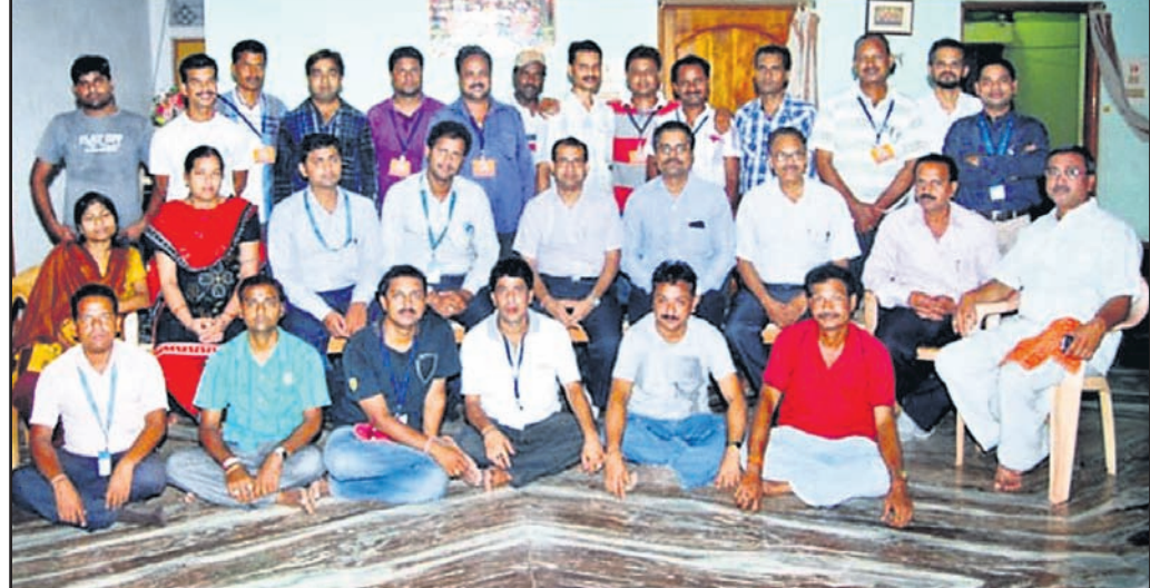
'ଆଶ୍ରୟ' ସଂଗଠନର ସଦସ୍ୟମାନେ।