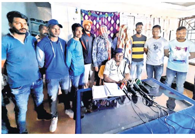
ଗିରଫ ହୋଇଥିବା ଅଭିଯୁକ୍ତମାନେ ।