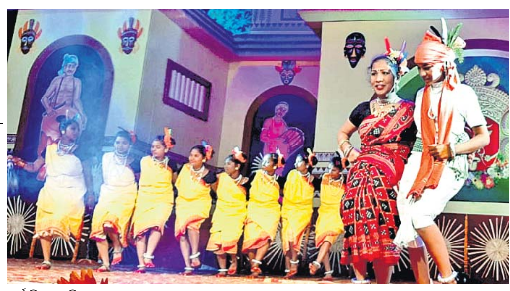
ପାର୍ଵାଲିର ତଙ୍ଗରିଆ କନ୍ଧଙ୍କ ନୃତ୍ୟ ।