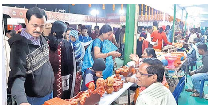
ପଲିଶ୍ରୀ ମେଳା ଖୁଲରେ ଲୋକଙ୍କ ଭିଡ଼ ।

ରାୟଗଡ଼ା ଲୋକ ମହୋତ୍ସବ ଚଳଚ୍ଚିତ୍ର ଅବସରରେ ଆୟୋଜିତ ହୋଇଛି ପଲିଶ୍ରୀ ମେଳା । ଏଠାରେ ୩୦୫ରୁ ଊର୍ଦ୍ଧ୍ଵ ଖୁଲ ଖୋଲିଛି । ସନ୍ଧ୍ୟାରେ ଏଠାରେ ଲୋକଙ୍କ ପ୍ରବଳ ଭିଡ଼ ଜମୁଛି । ରାଜ୍ୟର ବିଭିନ୍ନ ପ୍ରାନ୍ତରୁ ଆସିଥିବା ଏସ୍ପୋର୍ଟ ଗ୍ରୁପର କର୍ମୀମାନଙ୍କ ଦ୍ଵାରା ଅଣାଯାଇଥିବା ହଳଦୀ, ଜିରା, ପାମ୍ପଡ଼, ଆଗର, ସୋରିଷ ପ୍ରଭୃତି ଘରକରଣା ଦ୍ରବ୍ୟ ଚଳଚ୍ଚିତ୍ର ମେଳାରେ ଭଲ ଭିଡ଼ ହେଉଥିବା ଜଣାପଡ଼ିଛି । ମହିଳାମାନେ ଆଗାମୀ ବର୍ଷ ପାଇଁ କନ୍ଧମାନଙ୍କୁ ଆସିଥିବା ହଳଦୀ, ମରିଚଗୁଣ୍ଡ ଆଦି କିଣୁଥିବା ଦେଖିବାକୁ ମିଳିଛି । ଏଠାରେ କୁଟୀର ଶିଳ୍ପ ସାମଗ୍ରୀର ବେଶି ଚାହିଦା ଦେଖିବାକୁ ମିଳିଛି । ହାଟ ତିଆରି ଦ୍ରବ୍ୟ, ଧାନରେ