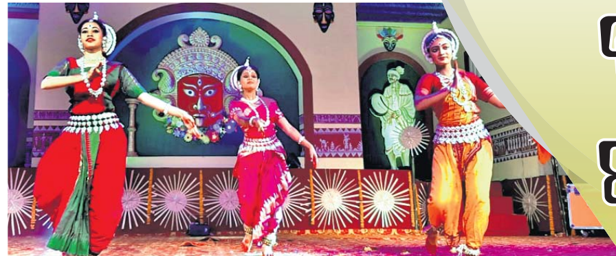
ଭୁବନେଶ୍ଵର କଳାକାରଙ୍କ ଦ୍ଵାରା ଓଡ଼ିଶା ନୃତ୍ୟ ।