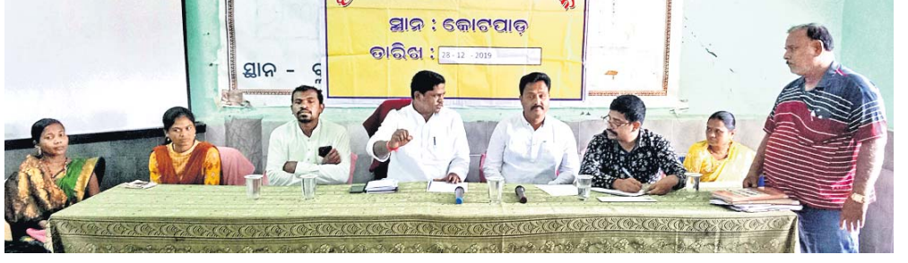
ପଞ୍ଚାୟତ ସମିତି ବୈଠକରେ ଏମ୍ପି ରମେଶ ମାଝିଙ୍କ ସହ ଅନ୍ୟ ଲୋକପ୍ରତିନିଧି ।