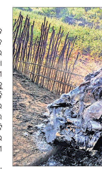
ଘୋଡ଼ିଦେଇଥିବା ଗାଡ଼ି ।

ପୁନିଗୁଡ଼ା, ୨୮୧୨ (ଡି.ଏନ.ଏ) ରାୟଗଡ଼ା ଜିଲ୍ଲା ଅୟାବୋଳା ଥାନା ଅନ୍ତର୍ଗତ ଥୁଆପାଡ଼ି ଗ୍ରାମ ନିକଟରେ ମାଓବାଦୀମାନେ ଘଟାଇଛନ୍ତି ଲଙ୍କାକାଣ୍ଡ । ଶୁକ୍ରବାର ରାତିରେ ଶରଧାପୁରଠାରୁ ଆସିଥିବା ଗ୍ରାମ ପର୍ଯ୍ୟନ୍ତ ଚାଲିଥିବା ପ୍ରଧାନମନ୍ତ୍ରୀ ଗ୍ରାମ୍ୟ ସଡ଼କ ଯୋଜନାର ରାସ୍ତା କାମକୁ ବିରୋଧକରି ମାଓବାଦୀମାନେ ୩ଟି ଗାଡ଼ି ଘୋଡ଼ି ଦେଇଛନ୍ତି। ପରେ ଘଟଣାସ୍ଥଳରେ ବାଂଶଧାରା ଘୁମୁସର ନାଗାବଳୀ ଡିଭିଜନାଲ କମିଟି (ସିପିଆଇ ମାଓବାଦୀ) ପକ୍ଷରୁ ୩ଟି ଘୋଷୁର ଛାଡ଼ି ଯାଇଛନ୍ତି। ଏହି ଘଟଣା ପରେ କ୍ୟାମ୍ପରେ ଥିବା କର୍ମଚାରୀ ଓ ଗ୍ରାମବାସୀ ଭୟଭୀତ ହୋଇପଡ଼ିଛନ୍ତି। ରାତି ୧୦ଟାରେ ୨ ମହିଳା ମାଓବାଦୀଙ୍କ ସମେତ ୧୫ରୁ ଊର୍ଦ୍ଧ୍ଵ ମାଓବାଦୀ ଚିକରପଡ଼ାଠାରେ ଥିବା ଠିକାଦାରଙ୍କ କ୍ୟାମ୍ପରେ ଆସି ପହଞ୍ଚିଥିଲେ। କଟକଡ଼ଙ୍ଗରେ ଥିବା ବକ୍ସାଇଟ୍ ଖଣିକୁ କମ୍ପାନୀକୁ ଚେକିଦେବା ପାଇଁ ୩୦ ଫୁଟ ରାସ୍ତା ନିର୍ମାଣ ହେଉଛି। ଲୋକଙ୍କ ଯିବା ଆସିବା ପାଇଁ ୮ ଫୁଟର ରାସ୍ତା ନିର୍ମାଣ କରିବାକୁ ବାରମ୍ବାର ଜଣାଇଛନ୍ତି। ଠିକାଦାର ଶୁଣୁ ନାହାନ୍ତି। ତେଣୁ