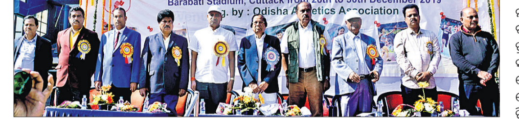
ଉଦ୍‌ଯୋଗୀ ଉପସବରେ ଉପସ୍ଥିତ ଅତିଥିମାନେ।