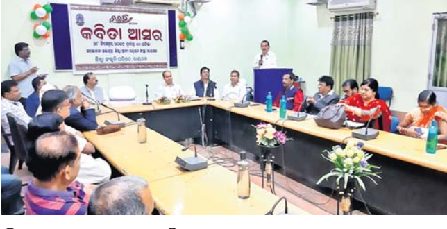
ଜିଲ୍ଲାପାଳ ଉଦ୍‌ଘାଟନ କରିଥିଲେ ।