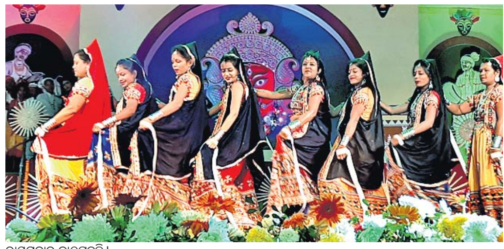
ରାୟଗଡ଼ାର କାଠପୁତୁଲି ।