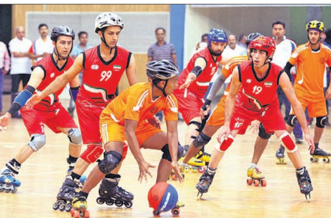
ମ୍ୟାଚ୍ ବେଳର ଏକ ଦୃଶ୍ୟ।

ଆସାମର ଗୁଆହାଟୀରେ ଚାଲିଥିବା ୧୩ତମ ଜାତୀୟ ରୋଲର୍ସ୍କାଟିଂ ଚାମ୍ପିୟନଶିପ୍ରେ ଓଡ଼ିଶା ଦଳ ଚମତ୍କାର ପ୍ରଦର୍ଶନ କରିଛି। ପ୍ରଥମଥରପାଇଁ ଦଳ କ୍ୱାର୍ଟର ଫାଇନାଲରେ ପ୍ରବେଶ କରି ଇତିହାସ ସୃଷ୍ଟି କରିଛି। ପ୍ରତିଯୋଗିତାରେ ଦଳ ଏପର୍ଯ୍ୟନ୍ତ ୨ଟି ମ୍ୟାଚ ଜିତିଥିବାବେଳେ ଗୋଟିଏରେ ପରାଜିତ ହୋଇଛି। ପୁଲ୍ ବିରେ ସ୍ଥାନ ପାଇଥିବା