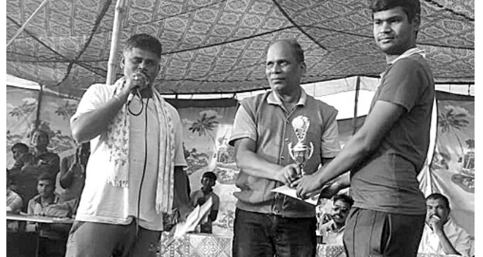
ଅତିଥିଙ୍କୁ ବିଜୟ ପଧାନ ରୁନିମେଣ୍ଟ ଅଫ୍ ଦି ସିରିଜ ପୁରସ୍କାର ଗ୍ରହଣ କରୁଛନ୍ତି।