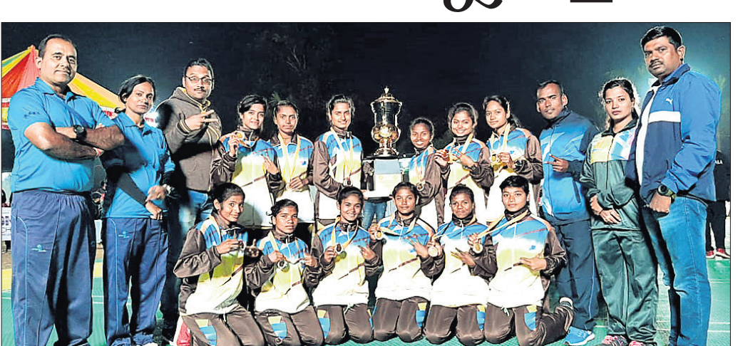
ଦ୍ରୋଞ୍ଜି ବିଜୟୀ ଓଡ଼ିଶା ମହିଳା ଖୋଖୋ ଦଳର ଖେଳାଳି ଓ ସପୋର୍ଟ ସ୍ଟାଫ୍।

ଅପ୍ ଇଣ୍ଡିଆ ସହ ପୁଲିକା କରିଥିଲା। ଏଥିରେ ଓଡ଼ିଶା ୪ ପଏଣ୍ଟ ହାସଲ କରିଥିବା ବେଳେ ଏକ୍ସାମପୋର୍ଟ ଅଥୋରିଟି ଅପ୍ ଇଣ୍ଡିଆ ୮ ପଏଣ୍ଟହାସଲ କରି ବିଜୟୀ ହୋଇଥିଲା। ପରବର୍ତ୍ତୀ ମ୍ୟାଚରେ କୋହ୍ଲାପୁରକୁ ହରାଇ ଓଡ଼ିଶା ତୃତୀୟ ସ୍ଥାନ ଅଧିକାର କରିଥିଲା। ଏହି ମ୍ୟାଚରେ ସମ୍ପିତା