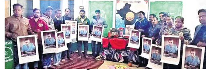
କ୍ୟାଲେଣ୍ଡରକୁ ଉନ୍ମୋଚନ କରାଯାଇଛି।