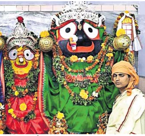
ବାମନଯୋଡ଼ି ଜଗନ୍ନାଥ ମନ୍ଦିରରେ ନବବର୍ଷ ଉପଲକ୍ଷେ ଶ୍ରୀଜୀଉଙ୍କ ବେଶ।

ନିକଟରେ ନୂତନ ନିର୍ମିତ ହସ୍ପିଟାଲର ବାଇକ ଭାରସାମ୍ୟ ହରାଇଥିଲା। ଏଥିରେ ପଛରେ ବସିଥିବା ଡ୍ରମ୍‌ଗଣୀ ୩୦ ଫୁଟ ଦୂରକୁ ଛିଟିକି ପଡ଼ିବା ଯୋଗୁ ମୃତ୍ୟୁ ହୋଇଥିଲା।