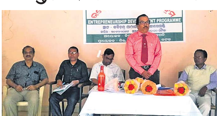
କାର୍ଯ୍ୟକ୍ରମରେ ଜିଲା ଶିଳ୍ପକେନ୍ଦ୍ରର ସାଧାରଣ ପରିଚାଳକ ଓ ଅନ୍ୟମାନେ ଉପସ୍ଥିତ ଅଛନ୍ତି ।