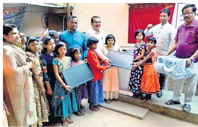
ପିଲାମାନଙ୍କୁ କମ୍ପ୍ୟୁଟର ପ୍ରଦାନ କରାଯାଉଛି ।

ତ.ବେହେରା ପ୍ରତିକ୍ଷେତ୍ର ଯାଉଥିଲେ ହେଲେ । ତାଙ୍କୁ ସ୍ୱାସ୍ଥ୍ୟ ବିଭାଗ ମଜଳଦାର ବଦଳି କରାଯାଉ । ସେହିଭଳି ଗୁଣପୁର ଉପଖଣ୍ଡ ସ୍ୱାସ୍ଥ୍ୟକେନ୍ଦ୍ରରେ ଥିବା ସ୍ତ୍ରୀ ପ୍ରସୂତି ବିଶେଷଜ୍ଞ ବିବାଦୀୟ ପରିସ୍ଥିତିରେ ତେପୁଚେଖାନାରେ ପ୍ରତିରୁଦ୍ଧକୁ ବଦଳି ହୋଇଛନ୍ତି । ତାଙ୍କ ସ୍ଥାନରେ ଗୁଣପୁରକୁ ପଢ଼ୁପୁରକୁ ସମ୍ପଦ ସାଲି ତେପୁଚେଖାନାରେ ଆସିଛନ୍ତି ।