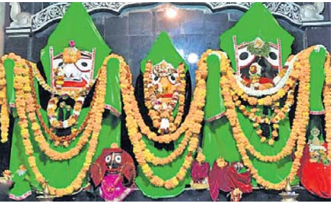
କନ୍ଧପୁର ଜଗନ୍ନାଥ ମନ୍ଦିରରେ ନବବର୍ଷ ପାଇଁ ଶ୍ରୀଜୀଉଙ୍କ ପୂଜାର୍ଚ୍ଚନା ଏବଂ ଦେବଦର୍ଶନ ପାଇଁ ମନ୍ଦିରରେ ଭକ୍ତଙ୍କ ଭିଡ଼।