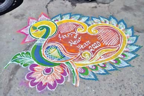
ନବ ବର୍ଷ ଅବସରରେ ଖୋଟି ।