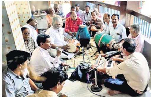
ଉତ୍ତମ ସଂକୀର୍ତ୍ତନ ପାଳନ ।