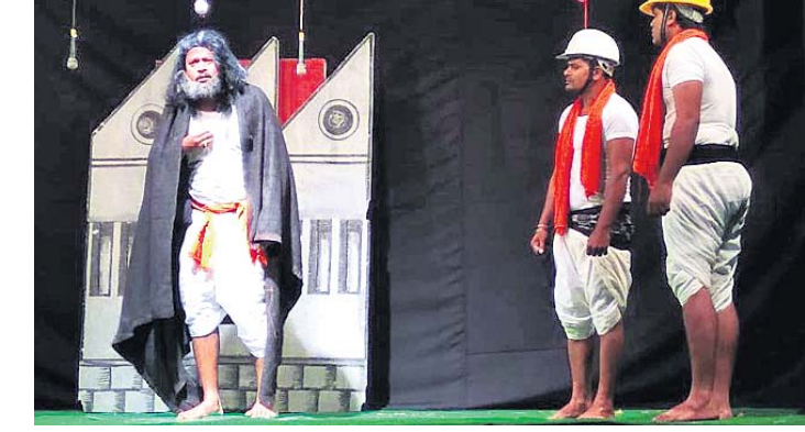
ଉଦ୍‌ଘାଟନା ସମ୍ବନ୍ଧରେ ମଞ୍ଚସ୍ଥ ନାଟକର ଏକ ଦୃଶ୍ୟ ।