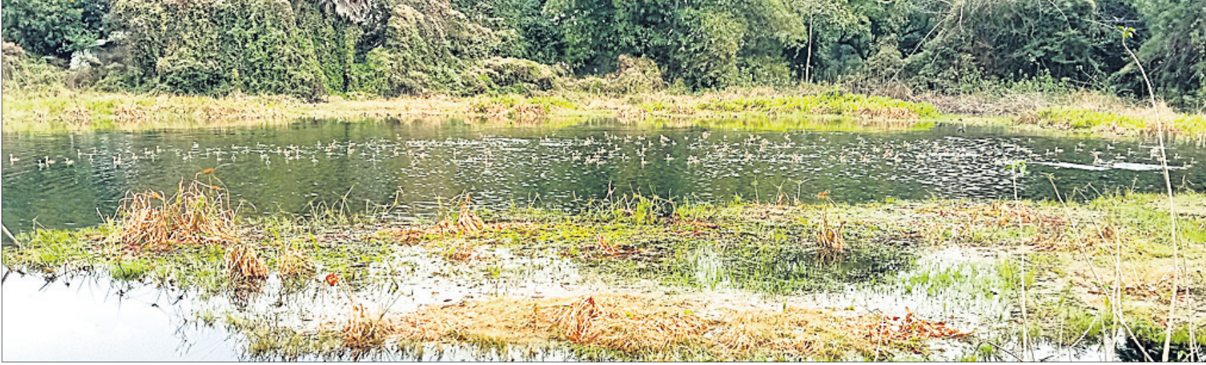
ବଣାପରିଆ ଗାଁ ପୋଖରୀରେ ବିଦେଶୀ ପକ୍ଷୀ