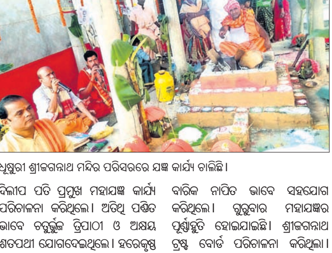
ଧୂସୁରୀ ଶ୍ରୀକରନାଥ ମନ୍ଦିର ପରିସରରେ ଯଜ୍ଞ କାର୍ଯ୍ୟ ଚାଲିଛି।