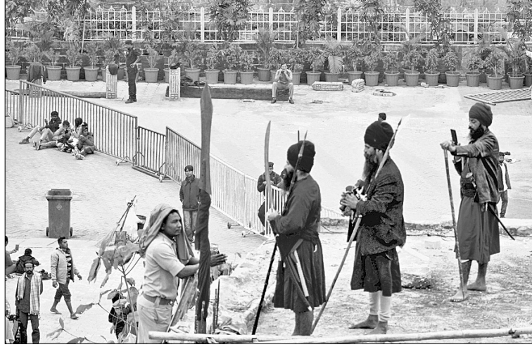
ମଜୁ ମଠ ଛାତ ଉପରେ ଚଢ଼ିଥିବା ଶିଖ୍ ମୁବକମାନଙ୍କୁ ପୋଲିସ୍ କର୍ମଚାରୀ ବୁଝାଖୁଣି କରୁଛନ୍ତି।