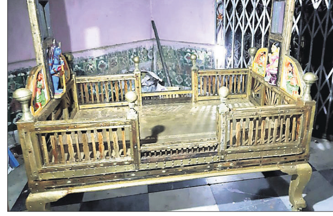
ଆଖଣ୍ଡଳମଣି ମନ୍ଦିରରେ ଥିବା ରତ୍ନପଲଙ୍କ।