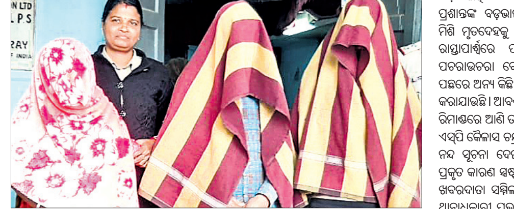
ଗିରଫ ୩ ଅଭିଯୁକ୍ତ।