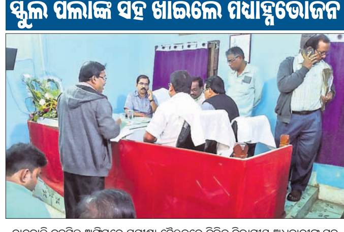
ଚାନ୍ଦବାଲି ତହସିଲ ଅଫିସରେ ସମାକ୍ଷା ଚେକ୍‌ରେ ବିଭିନ୍ନ ବିଭାଗୀୟ ଅଧିକାରୀଙ୍କ ସହ ଆଲୋଚନା କରୁଛନ୍ତି ଜିଲାପାଳ।

ନୋଡାଲ ହାଉସ୍‌କୁ ପରିଦର୍ଶନ ଚେକ୍‌ରେ ବିଭିନ୍ନ ବିଭାଗୀୟ ଅଧିକାରୀଙ୍କ ସହ ଆଲୋଚନା କରୁଛନ୍ତି ଜିଲାପାଳ। ଏହାପରେ ସ୍ୱାସ୍ଥ୍ୟକେନ୍ଦ୍ରରେ ଉପକ୍ରମାପାଳ ଅଫିସରେ କେତେକ ଉନ୍ନୟନକାରୀ କାର୍ଯ୍ୟ ସମାକ୍ଷା କରାଯାଇଥିଲା। ମଧ୍ୟାହ୍ନରେ ଜିଲାପାଳ ଭଦ୍ରକ-ଚାନ୍ଦବାଲି ରାସ୍ତାପାର୍ଶ୍ୱରେ ଥିବା ପାଞ୍ଚପଡ଼ା ଶିବୁରୁଣା ଚେକ୍‌ରେ ବିଭାଗୀୟ ଅଧିକାରୀଙ୍କ ସହ ଆଲୋଚନା କରୁଛନ୍ତି ଜିଲାପାଳ।