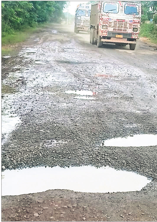
ବିପଦସଙ୍କୁଳ ରାସ୍ତା ।