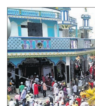
ଉତ୍ସବରେ ଶ୍ରଦ୍ଧାଳୁଙ୍କ ଭିଡ଼।