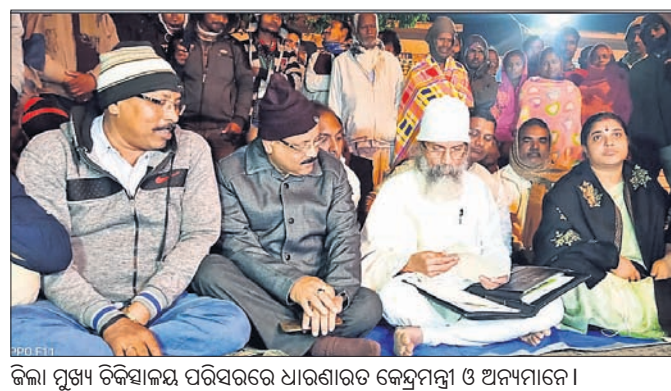
ଜିଲ୍ଲା ମୁଖ୍ୟ ଚିକିତ୍ସାଳୟ ପରିସରରେ ଧାରଣାରତ କେନ୍ଦ୍ରମନ୍ତ୍ରୀ ଓ ଅନ୍ୟମାନେ ।

ଭୁବନେଶ୍ଵର, ୨୧ (ବୁଧବେ): ବାଲେଶ୍ଵର ଜିଲ୍ଲା ମୁଖ୍ୟ ଚିକିତ୍ସାଳୟର ଅବ୍ୟବସ୍ଥା ସମ୍ପର୍କରେ ଉଚ୍ଚପ୍ରମାଣ ତଦନ୍ତ କମିଟି ଗଠନ କରିବାକୁ ନିର୍ଦ୍ଦେଶ ଦେଇଛନ୍ତି ସ୍ଵାସ୍ଥ୍ୟମନ୍ତ୍ରୀ।