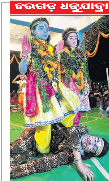
ଗୋପପୁରରେ ଶ୍ରୀକୃଷ୍ଣ କଂସ ପ୍ରେରିତ ରାକ୍ଷସକୁ ବଧ କରୁଛନ୍ତି।

ମଥୁରାଜଗରୀ/ଗୋପପୁର, ୩।୧ ବରଗଡ଼ ଧନୁସାତ୍ରା ମହୋତ୍ସବର ଚତୁର୍ଥ ଦିବସ ଶୁକ୍ରବାର ଉତ୍ସବ ମଥୁରାଜଗରୀ ଓ ଗୋପପୁରର ଦୁଶ୍ୟାଭିନୟ ଚୁଡ଼ିକ ବିରାଜିତ ଥିଲା। ଗୋଟିଏ ପଟେ ଶ୍ରୀକୃଷ୍ଣଙ୍କ ବାଲ୍ୟଲୀଳା, କଂସ ପ୍ରେରିତ ରାକ୍ଷସାଚାର୍ଯ୍ୟ ବଧ ଏବଂ ଅନ୍ୟପଟେ କଂସ ମର୍ମାହତ ଦୁଶ୍ୟାଭିନୟ ଅଭିନୀତ ହୋଇଥିଲା। କଳାକାରଙ୍କ ନିଖୁଣ ଅଭିନୟ ଦେଖିବାକୁ ମଥୁରା ଓ ଗୋପପୁରରେ ବର୍ଷକକ ଭିତ ଜମିଥିଲା। ନନ୍ଦଭବନରେ ନନ୍ଦରାଣୀ, ନନ୍ଦରାଜା ମେଲାଣି ଦେବା ପରେ ଶ୍ରୀକୃଷ୍ଣ ଓ ବଳରାମ ଗୋପ ବାଳକଙ୍କ ଗହଣରେ ଗୋପ ନଗର ପରିକ୍ରମା କରିଥିଲେ। ଗୋପବାସୀ ପ୍ରତି ଘର ସମ୍ମୁଖରେ ଝୋଟି, ପୂର୍ଣ୍ଣ କନ୍ଦସ ଘୁମନ କରି ବେନିଭାଇକୁ ପୂଜାର୍ଚନା କରିଥିଲେ। ଗୋପପୁର ପରିକ୍ରମା ସାରି ଗୋପାଳ ବାଳକଙ୍କ ଗହଣରେ କୃଷ୍ଣ, ବଳରାମ ଗୋପ ମହୋତ୍ସବ ଯାଇଥିଲେ। ସେଠାରେ ଶ୍ରୀକୃଷ୍ଣଙ୍କ ବିଶ୍ୱରୂପ ବର୍ଣ୍ଣନା ଅଭିନୀତ ହୋଇଥିଲା। ଏହାପରେ ସେଠାକୁ କଂସ ପ୍ରେରିତ ପୁତ୍ରନ, ବକା, ଶକଟା, ଦୁଶା, ଧେନୁ, ଷଣ୍ଢା, ଅପାଘୁର ଆଦି ରାକ୍ଷସା ଚାରଣ୍ୟ ପହଞ୍ଚିଥିଲେ। ମାତ୍ର ଶ୍ରୀକୃଷ୍ଣଙ୍କ ଘର୍ଷଣରେ ସେମାନଙ୍କ ନିଧନ ହୋଇଥିଲା। ଅନ୍ୟଦିନ ଭଳି ମହାରାଜ କଂସ ଦିନରେ ମଥୁରା ଭ୍ରମଣରେ ବାହାରିଥିଲେ। ସେ ବାଣିଜ୍ୟକର ଅଧିକାରୀଙ୍କୁ (ସେକ୍ତର୍ୟାକୁ