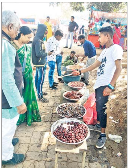
ସାନଘାଗରାରେ ଆଚାର ପସରା।

କେନ୍ଦୁଝର ଜିଲାର ଅନ୍ୟତମ ଆକର୍ଷଣ ସାନଘାଗରା ଜଳପ୍ରପାତରେ ନୂଆବର୍ଷ ଉପଲକ୍ଷେ ପର୍ଯ୍ୟଟକଙ୍କ ଭିଡ଼ ଜମୁଛି। ସାନଘାଗରା ଜଳପ୍ରପାତ ବୁଲିବା ସହ ଭୋଜିଭାଙ୍ଗି କରିବାକୁ ରାଜ୍ୟ ଓ ରାଜ୍ୟ ବାହାରୁ ବହୁସଂଖ୍ୟାରେ ପର୍ଯ୍ୟଟକ ଏଠାକୁ ଆସୁଛନ୍ତି। ପ୍ରାକୃତିକ ଜଳାଳି ଓ ପରିବେଶର ମନୋରମ ଦୃଶ୍ୟକୁ ବୁଲି ଦେଖିବା ସହ କ୍ୟାମେରାରେ ସମସ୍ତେ ସାଙ୍ଗିତ ନେଉଛନ୍ତି ସ୍ମୃତି। ଏହାମଧ୍ୟରେ ବୋଟିଂ ମଜା ଉଠାଉଛନ୍ତି। ତେବେ ଏହାମଧ୍ୟରେ ଦୋକାନ ବଜାର, ମିନାବଜାରରେ ଚାଲିଛି କିଶାବିକା। ଆଚାର, ଚନ୍ଦନକାଠା, ବିଭିନ୍ନ ପ୍ରକାରର ଚଟପଟା ଖାଦ୍ୟ ଆଦି ଏଠାରେ ବିକ୍ରି ହେଉଛି। ବିକ୍ରିହେଉଥିବା ବିଭିନ୍ନ ପ୍ରକାରର ଜଳାଳି ସଂଗୃହୀତ କୋଳି, ଅଁଳା, ଆମ୍ବ, ତେଜୁଳି, ଆମ୍ବୁଳ ଆଦିରେ ପ୍ରସ୍ତୁତ ଆଚାରର ବଜାର ସମଗ୍ର ଖାଦ୍ୟ ଆକର୍ଷଣର କେନ୍ଦ୍ରସ୍ଥ ପାଲଟିଛି। ଏଠାରେ ବିଭିନ୍ନ ଆଚାରର ବେଶ୍ ଚାହିଦା ରହିଛି। ଖଟା,