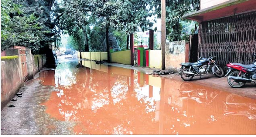
ଲଗାଣ ବର୍ଷା ଯୋଗୁ ରାସ୍ତାରେ ପାଣି ଜମିରହିଛି।