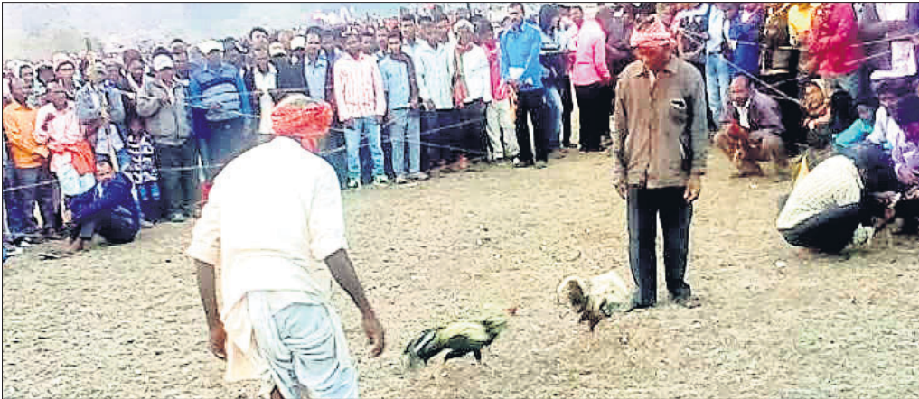
କୁକୁଡ଼ା ଲଢ଼େଇ ଦେଖିବାକୁ ଲୋକେ ଭିଡ଼ ଜମାଇଛନ୍ତି।