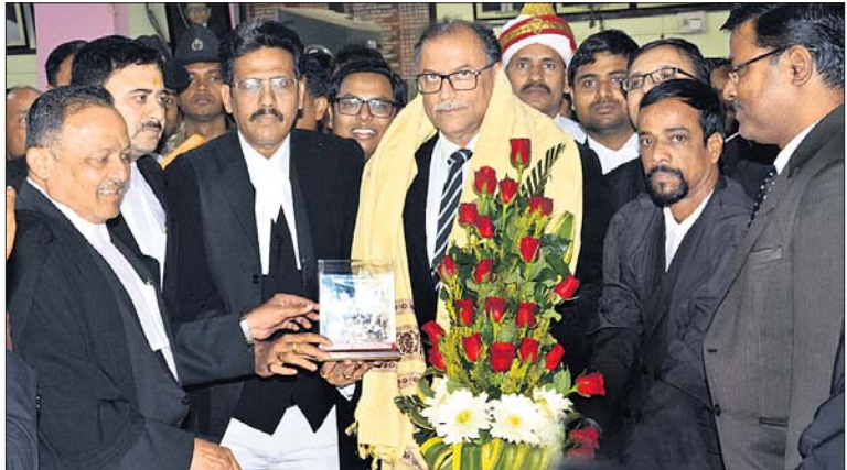
କାର୍ଯ୍ୟକ୍ରମରେ ହାଇକୋର୍ଟ ମୁଖ୍ୟ ବିଚାରପତି ଜଷ୍ଟିସ୍ କେ.ଏସ୍. ଝାବେରାଙ୍କୁ ସମ୍ବର୍ଦ୍ଧିତ କରାଯାଇଛି।

କଟକ ଅଫିସ, ୩।୧: ଓଡ଼ିଶା ହାଇକୋର୍ଟ ମୁଖ୍ୟ ବିଚାରପତି ଜଷ୍ଟିସ୍ କେ.ଏସ୍. ଝାବେରାଙ୍କୁ ହାଇକୋର୍ଟ ବାର୍ ଆସୋସିଏଶନ୍ ପକ୍ଷରୁ ଶୁକ୍ରବାର ବିଦାୟକାଳୀନ ସମ୍ବର୍ଦ୍ଧନା ଦିଆଯାଇଛି।