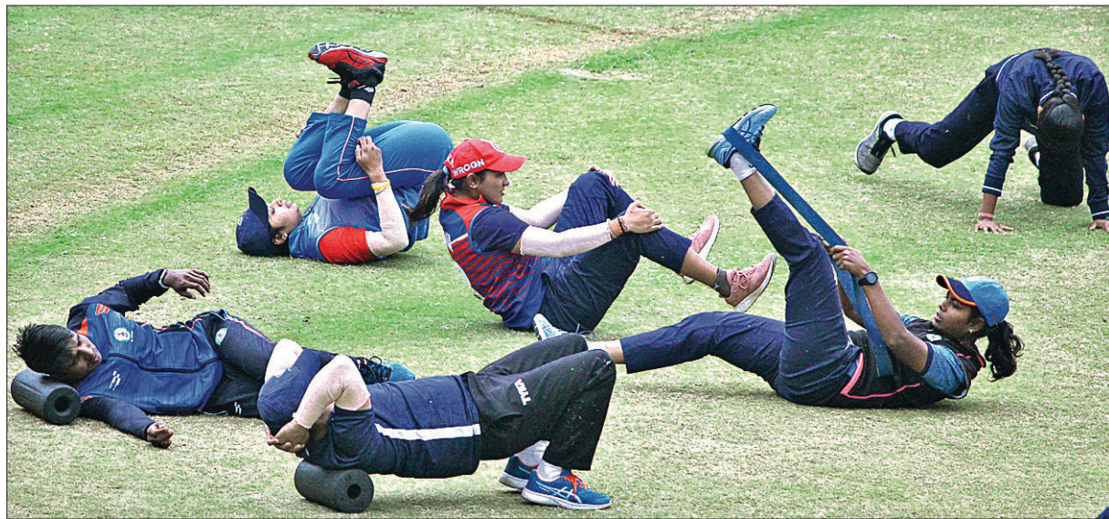
ମହିଳା ଟ୍ୟାଲେଣ୍ଟର ଟ୍ରାଫି କ୍ରିକେଟ ଟୁର୍ନାମେଣ୍ଟ ପାଇଁ ଶୁକ୍ରବାର ବାରବାଟୀ ଷ୍ଟାଡିୟମରେ ଲକ୍ଷିଆ-ଏ ଓ ଲକ୍ଷିଆ-ବି ଖେଳାଳିଙ୍କ ଓ୍ୱାର୍ମଅପ୍ ।