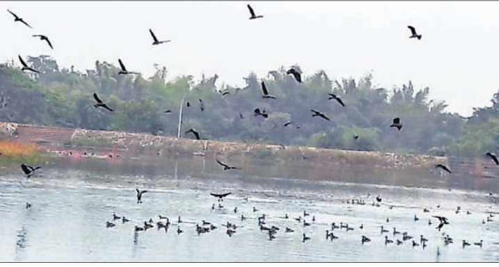
ନାଳଗିରି କୁଳଡ଼ିହା ଅଭୟାରଣ୍ୟ ମଧ୍ୟରେ ଥିବା ଗିରିଆ ଡ୍ୟାମ୍ରେ ନିୟୋଜିତ ଚିମ୍ପ ପକ୍ଷୀଗଣନା କରୁଛନ୍ତି।