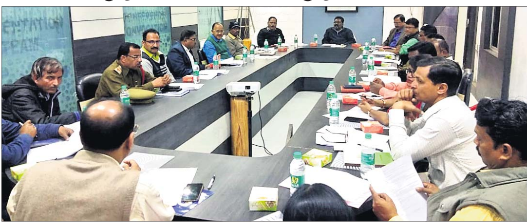
ବୈଠକରେ ଉପସ୍ଥିତ ଅଧିକାରୀମାନେ।

ଓଡ଼ିଶା ଦକ୍ଷିଣ ବିକାଶ କର୍ତ୍ତୃପକ୍ଷ ଏବଂ କେନ୍ଦୁଝର ଜିଲ୍ଲା ପ୍ରଶାସନ ଆନୁକୁଲ୍ୟରେ ଚଳିତ ଜାନୁୟାରୀ ୧୦ ତାରିଖରେ କେନ୍ଦୁଝର ଜିଲ୍ଲା ସଦର ମହକୁମାସ୍ଥ ଓଡ଼ିଶା ଖଣି ଓ ଯାନ୍ତ୍ରିକ ବିଦ୍ୟାଳୟ (ଓଏସ୍‌ଏମ୍‌ସି) ପରିଷଦରେ ନିୟୁତ୍ତମେଳା ଅନୁଷ୍ଠିତ ହେବ। ନିୟୁତ୍ତ ମେଳାର ପରିଚାଳନା ନିମନ୍ତେ ଅତିରିକ୍ତ ଜିଲ୍ଲାପାଳ ଭଦ୍ରକରଣ ପ୍ରଧାନଙ୍କ ଅଧିକାରୀରେ ଗୁରୁବାର ଅପରାହ୍ନରେ ମିନି କନଫରେନ୍ସ ହଲ୍‌ଠାରେ ଏକ ପ୍ରସ୍ତୁତି ବୈଠକ ଅନୁଷ୍ଠିତ ହୋଇଯାଇଛି। ଜିଲ୍ଲାର ୧୮୮୭ ୩୫୫୫ ବୟସ ପର୍ଯ୍ୟନ୍ତ ଶିକ୍ଷିତ ବେକାର ଯୁବତୀ/ଯୁବକଙ୍କୁ ବିଭିନ୍ନ କମ୍ପାନୀ, ଘରୋଇ ଉଦ୍ୟୋଗ ତଥା ଶିଳ୍ପସଂସ୍ଥାରେ ନିୟୁତ୍ତ ଦେବା ନିମନ୍ତେ ଏହି ନିୟୁତ୍ତ ମେଳା ଆୟୋଜନ କରାଯାଉଛି। ସପ୍ତମ ଶ୍ରେଣୀ ପାସ୍‌କୃତ ଶିକ୍ଷାଗତ ଯୋଗ୍ୟତା ଥିବା ଶିକ୍ଷିତ ବେକାର ଯୁବତୀ/ଯୁବକ, ଆଇଟିଆଇ, ଡିପ୍ଲୋମା, ଏଏନ୍‌ଏମ୍/ଜିଏନ୍‌ଏମ୍ ପାସ୍ କରିଥିବା ଆଗ୍ରହୀ ଯୁବତୀ/ଯୁବକମାନେ ଏହି ନିୟୁତ୍ତମେଳାରେ ଅଂଶଗ୍ରହଣ କରିପାରିବେ ବୋଲି କହିଥିଲେ। ସେମାନେ ନିଜ ଅଞ୍ଚଳର