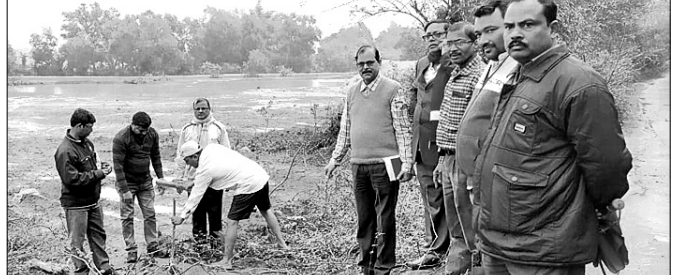
ଆଧିକାରୀମାନେ ଷ୍ଟେଡି ପରିଦର୍ଶନ କରୁଛନ୍ତି।

କଳେଶ୍ୱର, ୩।୧(ସ.ପ୍ର.)- କଳେଶ୍ୱର ରୁକ୍ମ ବିଭାଜନ ଭାବେ ପରିଚିତ ରାଜବଣିଆ ଥାନା କାଳିକାଠାରେ ଆଦର୍ଶ ବିଦ୍ୟାଳୟ ନିର୍ମାଣ ଲାଗି ଜମି ହସ୍ତାନ୍ତର ପ୍ରକ୍ରିୟା ଶେଷ ହୋଇଛି।