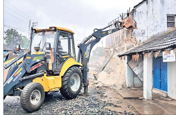
ରାସ୍ତା ପ୍ରଶସ୍ତାବନର ପାଇଁ ଜବରଦଖଲ ଉଦ୍ଧେବ କରାଯାଇଛି।