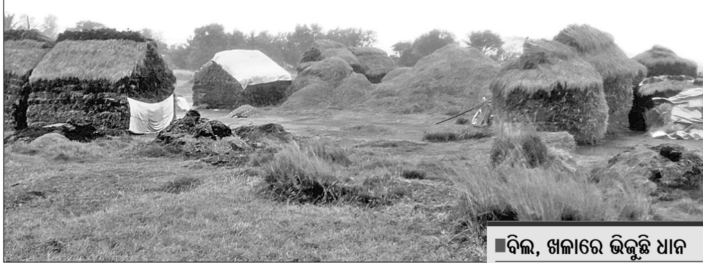
ପଦ୍ମପୁର ଏକ ଖଜାରେ ଧାନ ଓବା ହେଉଛି।

ଭଦ୍ରକ ଜିଲାର ବିଭିନ୍ନ ସ୍ଥାନରେ ଶୁକ୍ରବାର ଦିନଟମାମା ଝିଂଡିପି ବର୍ଷା ଲାଗିରହିଥିଲା। ଫଳରେ ପାଗ କୋହଲା ଅନୁଭୂତ ହୋଇଥିଲା।