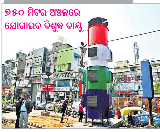
୭୫୦ ମିଟର ଅଞ୍ଚଳରେ ଯୋଗାଇବ ବିଶୁଦ୍ଧ ବାୟୁ

ନୂଆଦିଲ୍ଲୀ: ସମଗ୍ର ଦେଶରେ ବାୟୁ ପ୍ରଦୂଷଣ ସାରା ଦେଶରେ ବଡ଼ ସମସ୍ୟା ହୋଇଥିବାବେଳେ ଦିଲ୍ଲୀର ଛୁଟି ସବୁଠାରୁ ସର୍ବାଧିକ। ପ୍ରଦୂଷଣ ଜନିତ ରୋଗ ଓ ମୃତ୍ୟୁହାର ହ୍ରାସ କରିବାପାଇଁ ରାଜଧାନୀ ଦିଲ୍ଲୀରେ ଗ୍ଲାସ୍ ହୋଇଛି ପ୍ରଥମ ସ୍ମଗ୍ ଟାଓ୍ୱାର। କ୍ରିକେଟ୍ ଷେକାଲି ତଥା ପୂର୍ବ ଦିଲ୍ଲୀ ଏମ୍‌ପି ଗୌତମ ଗମ୍ଭୀରଙ୍କ ସହଯୋଗରେ ଲକ୍ଷପତ୍ନର ବ୍ୟବସାୟୀ ସଂଘ ପକ୍ଷରୁ ଗୁରୁବାର ଦକ୍ଷିଣ ଦିଲ୍ଲୀରୁ ସେଣ୍ଟ୍ରାଲ୍ ମାର୍କେଟ୍‌ରେ ଏହି ଏୟାର ପ୍ୟୁରିଫାଇୟର ଗ୍ଲାସ୍ କରାଯାଇଛି। ଶୁକ୍ରବାର ଗମ୍ଭୀର ଏହାର ଉଦ୍ଘାଟନ କରିଛନ୍ତି। ୨୦୦୯ରୁ ଉଚ୍ଚତା ବିଶିଷ୍ଟ ଏହି ଯନ୍ତ୍ର ଦିନକୁ ୨, ୫୦, ୦୦୦ ରୁ ୬, ୦୦୦୦୦ କ୍ୟୁବିକ ମିଟର ପ୍ରଦୂଷିତ ବାୟୁକୁ ଗ୍ରହଣ କରି ବିଶୁଦ୍ଧ ବାୟୁ ଯୋଗାଇବା ଲକ୍ଷ୍ୟ ରହିଛି। ସେହିପରି ୫୦୦ରୁ ୭୫୦ ମିଟର ଅଞ୍ଚଳ ମଧ୍ୟରେ ପ୍ରଦୂଷିତ ବାୟୁକୁ ବିଶୁଦ୍ଧ ବାୟୁରେ ପରିଣତ କରିବା ଦିଲ୍ଲୀ ପ୍ରଦୂଷଣର ରାଜଧାନୀ ପାଲଟିଥିବାବେଳେ ଏକଲି ଛୁଟିରେ ସ୍ମଗ୍ ଟାଓ୍ୱାର ପ୍ରତିଷ୍ଠା କରିବା ଜରୁରୀ ଥିଲା। ଏହି ବାୟୁ ବିଷୋଧକ ଲାଗିବା ପରେ ପ୍ରଦୂଷଣ କମିଥିବା ଜଣାପଡ଼ିଛି। ତେବେ ଦିଲ୍ଲୀରେ ଅନେକ କାରଣରୁ ବାୟୁ ପ୍ରଦୂଷଣ ବୃଦ୍ଧି ପାଇ ଲୋକଙ୍କୁ ଅଶାନିଷ୍ଟାସୀ କରାଉଥିବାବେଳେ ଏହି ପ୍ରକଳ୍ପ କେତେଦୂର ସଫଳ ହେବ ତାହାକୁ ନେଇ କେତେକ ବିଶେଷଜ୍ଞ ପ୍ରଶ୍ନ ଉଠାଇଛନ୍ତି।