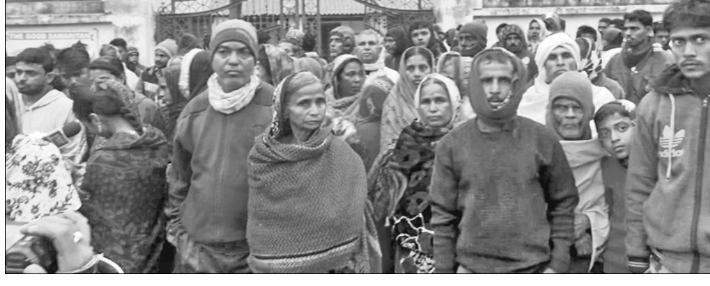
ତିହଡ଼ି ଥାନା ଘେରିଛନ୍ତି ଅନୁତପୁର ଗ୍ରାମବାସୀ।