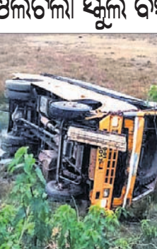
ବାସୁଦେବପୁର, ୩୧ (ଡି.ଏନ.ଏ.)- ଭଦ୍ରକ ଜିଲ୍ଲା ବାସୁଦେବପୁର ବ୍ଲକ୍ କରକାଥପୁର-ବାଲିଚଣ୍ଡା ଯାଏଁ ଗାଡ଼ା ଲାଗୁଥିବା ମାଳାପୋଲ ନିକଟରେ ଶୁକ୍ରବାର ସନ୍ଧ୍ୟାରେ ବାସୁଦେବପୁର ଜିଲ୍ଲା ଯୋଗ ଅଞ୍ଚଳର ଏକ ସ୍କୁଲ ବସ ଭାରସାମ୍ୟ ହରାଇ ରାସ୍ତାକଡ଼କୁ ଓଲଟି ପଡ଼ିଥିଲା।

ଏହି ବସରେ ବାସୁଦେବପୁର ଅଞ୍ଚଳର ୬/୮ ଜଣ ଛାତ୍ର ଥିବାବେଳେ ସେମାନେ ଆହତ ହୋଇଛନ୍ତି। ଗାଡ଼ି ତୁରନ୍ତର ସେଭି ଓକ୍ସିଜେନ ଗ୍ରାମର ଦେହେନ୍ଦ୍ର ମନିକ ଗୁରୁତର ଆହତ ହୋଇଛନ୍ତି। ଆହତମାନଙ୍କୁ ସେଭି ଅନୁସନ୍ଧାନ ଚାଲୁଥିବାବେଳେ ବୈଧିକା କରାଯାଇଛି। ଖବର ପାଇ ବାସୁଦେବପୁର ଥାନା ପୋଲିସ୍ ସଂଗଠାୟମାନେ ସଫଳତା ସହ ସଂଗ୍ରହ କରିଛନ୍ତି।