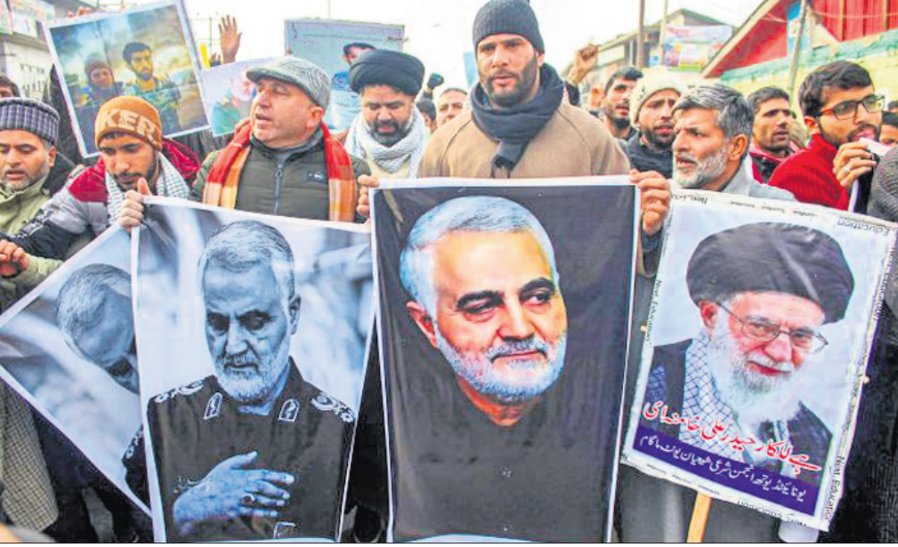
ଶ୍ରୀନଗରରେ ଶିଆ ମୁସଲିମ ସମ୍ପ୍ରଦାୟର ଲୋକେ ଯୋଲୋମାନାଙ୍କ ଫଟୋ ଧରି ଆମେରିକା ବିରୋଧରେ ବିକ୍ଷୋଭ ପ୍ରଦର୍ଶନ କରୁଛନ୍ତି।