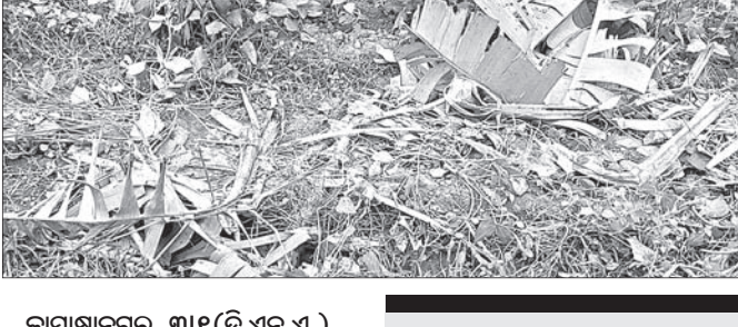
କାମାକ୍ଷାନଗର, ୩୧ (ଡି.ଏନ.ଏ.)

ଡେକାନାଲ ଜିଲ୍ଲା କଳ୍ପାହାଡ଼କୁ ପଶି ଆସିଥିବା ୨୫ରୁ ଊର୍ଦ୍ଧ୍ୱ ହାଡ଼ା ବ୍ୟାପକ ପରିବା ଚାଷ ନଷ୍ଟ କରିଛି।