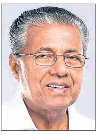
ପ୍ରମୁଖଙ୍କୁ ପତ୍ର ଲେଖିଛନ୍ତି