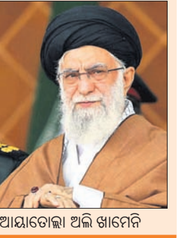
ଆୟାତୋଲ୍ଲା ଅଲି ଖାମେନି

ବିକ୍ଷୋରକ ସ୍ଥିତି ସୃଷ୍ଟି ହୋଇଛି। ସ୍ଥିତି ଉପରେ ନାଟୋ ନକର ରଖୁଥିବା କହିଛି।