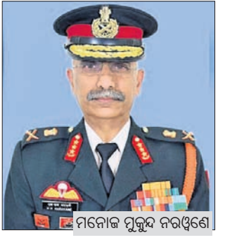
ମନୋଜ ମୁକୁନ୍ଦ ନରସିଂହ

ଭାରତ ମଧ୍ୟକୁ ଅନୁପ୍ରବେଶ କରିବା ଲାଗି ନିୟନ୍ତ୍ରଣ ରେଖା (ଏଲଓସି) ଆରପଟେ ପାଖାପାଖି ୨୫୦ ପାକିସ୍ତାନୀ ଆତଙ୍କବାଦୀ ଅପେକ୍ଷା କରି ରହିଛନ୍ତି। ସେମାନେ ପ୍ରତିଦିନ ଅନୁପ୍ରବେଶ ପାଇଁ ଉଦ୍ୟମ କରୁଥିବା ନୂଆ ସେନାଧ୍ୟକ୍ଷ ଜେନେରାଲ ମନୋଜ ମୁକୁନ୍ଦ ନରସିଂହ ଶୁକ୍ରବାର କହିଛନ୍ତି। ଏଲଓସି ଅପରପାର୍ଶ୍ୱରେ ୨୦ରୁ ୨୫ ଲକ୍ଷ ପର୍ଯ୍ୟନ୍ତ ସକ୍ରିୟ ରହିଛି। ଭାରତୀୟ ସେନା ସେଗୁଡ଼ିକ ଉପରେ କଡ଼ା ନଜର ରଖୁଥିବା ସେନାଧ୍ୟକ୍ଷ କହିଛନ୍ତି। ଗତବର୍ଷ ବାୟୁସେନା ବାଲାକୋଟରେ ଏୟାରଷ୍ଟ୍ରାଇକ୍ କରି ଆତଙ୍କବାଦୀଙ୍କ ଶିବିର ଧ୍ୱଂସ କରିଦେଇଥିଲା। ଏବେ ପାକିସ୍ତାନ ଉକ୍ତି ଶିବିରକୁ ପୁଣିଥରେ ସକ୍ରିୟ କରିଛି। ତେଣୁ ପାକ୍ ପୁଣିଥରେ ଭରତକୁ ନିବିଡ଼ ଭାବେ ନିରୀକ୍ଷା କରିବାକୁ ପଡ଼ିବ ବୋଲି ନୂଆ ସେନାଧ୍ୟକ୍ଷ କହିଛନ୍ତି।