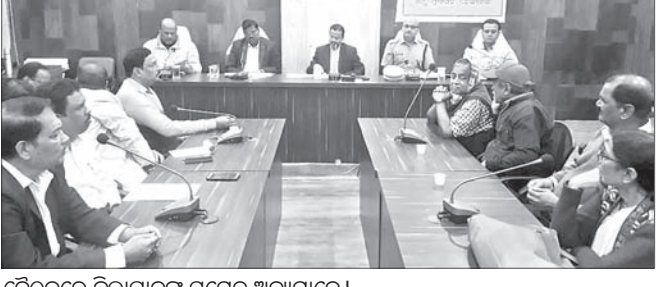
ଭେଟିକାରେ ଜିଲାପାଳଙ୍କ ସମେତ ଅନ୍ୟମାନେ।

ସାଢ଼େ ୮ଟାରେ ଷ୍ଟୁଡିୟଠାରେ ଜିଲାସ୍ତରୀୟ ପରଦେରେ ପତାକା ଭଙ୍ଗୋଡ଼ନ କରାଯିବ। ଏଠାରେ ବିଭିନ୍ନ କ୍ଷେତ୍ରରେ କୃତିତ୍ୱ ଅର୍ଜନ କରିଥିବା ପ୍ରତିଭାଧାରୀ ପୁରସ୍କୃତ ହେବେ।