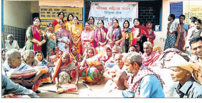
ଶୀତବସ୍ତ୍ର ପାଇଥିବା ବୃଦ୍ଧାବୃଦ୍ଧଙ୍କ ସହ ମହିଳା ମଣ୍ଡଳର ସଦସ୍ୟାମାନେ।