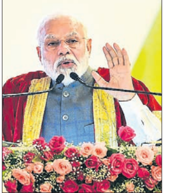
ଭାରତୀୟ ବିଜ୍ଞାନ କଂଗ୍ରେସ ଅଧିବେଶନକୁ ଉଦ୍‌ଘାଟନ କଲେ ପ୍ରଧାନମନ୍ତ୍ରୀ