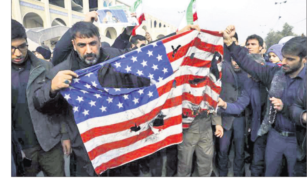
ବାଗଦାଦର କମାଣ୍ଡର ଯୋଲୋମାନାଙ୍କ ହତ୍ୟା ପରେ ତେହେରାନରେ ଆମେରିକା ବିରୋଧୀ ବିକ୍ଷୋଭ।

ବେଙ୍ଗାଲୁରୁ, ୩୧ (ପି.ଟି.)-ପ୍ରଧାନମନ୍ତ୍ରୀ ନରେନ୍ଦ୍ର ମୋଦି ଶୁକ୍ରବାର ବେଙ୍ଗାଲୁରୁରେ ଭାରତୀୟ ବିଜ୍ଞାନ କଂଗ୍ରେସର ୧୦୦ତମ ଅଧିବେଶନକୁ ଉଦ୍‌ଘାଟନ କରିବା ସହ ମୁଖ୍ୟ ବିଜ୍ଞାନିକମାନଙ୍କୁ ଇନୋଭେଟିଭ, ପେଟେଣ୍ଟ, ପ୍ରତ୍ୟୁତ୍ପାଦନ ଓ ପ୍ରସ୍ତୁତ (ନବପ୍ରବର୍ତ୍ତନ, ବିଜ୍ଞାନିକ ଆବିଷ୍କାରର ଅଧିକାର, ଉତ୍ପାଦନ ଓ ସମୃଦ୍ଧ) ଉପରେ ଗୁରୁତ୍ୱ ଦେବା ଲାଗି ପରାମର୍ଶ ଦେଇଛନ୍ତି। ଏହି ୪ ପଦକ୍ଷେପ ଭାରତକୁ ଦ୍ରୁତତର ଅଭିବୃଦ୍ଧି ହାସଲରେ ଆଗେଇନେବ ବୋଲି ସେ କହିଛନ୍ତି। ଭାରତୀୟ ବିଜ୍ଞାନ, ପ୍ରଯୁକ୍ତି ଏବଂ ନବପ୍ରବର୍ତ୍ତନକୁ ଉଚ୍ଚ ସ୍ତରରୁ ନେଇଯିବାର ଆବଶ୍ୟକତା ରହିଛି। ବିଜ୍ଞାନକୁ ସହଜ କରିବା ସହ ସୂଚନା ପ୍ରଯୁକ୍ତିର ବ୍ୟବହାର କରି ପ୍ରଶାସନିକ ନୀତିଗୁଡ଼ିକର ପରାମର୍ଶ ଶ୍ରାବ୍ୟ କରିବାକୁ ସରକାର ପ୍ରତିବଦ୍ଧ। କୃଷିର ବିକାଶରେ ସହାୟକ ହେଲା ଭଳି ଜ୍ଞାନକୌଶଳରେ ତ୍ରାନ୍ତି ଆଣି ଚାଷୀମାନଙ୍କୁ ସହାୟତା କରିବା ଲାଗି ପ୍ରଧାନମନ୍ତ୍ରୀ ବିଜ୍ଞାନିକମାନଙ୍କୁ ଆହ୍ୱାନ ଦେଇଥିଲେ। ଭାରତର ବିକାଶ ବିଜ୍ଞାନ ଓ ପ୍ରଯୁକ୍ତି ସେକ୍ଟରର ସଫଳତା ଉପରେ ନିର୍ଭର କରେ। ତେଣୁ ଦେଶର ବିଜ୍ଞାନ ପ୍ରଯୁକ୍ତି ଓ ଇନୋଭେଟିଭନରେ ବ୍ୟାପକ ପରିବର୍ତ୍ତନ ଆଣିବାକୁ ହେବ ବୋଲି ମୋଦି କହିଥିଲେ।