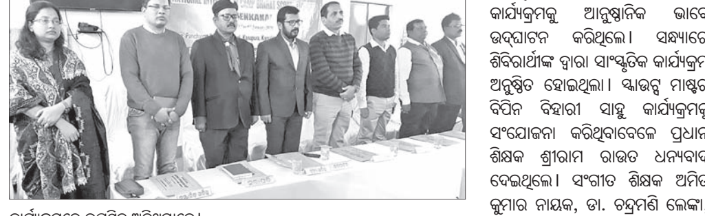
କାର୍ଯ୍ୟକ୍ରମରେ ଉପସ୍ଥିତ ଅତିଥିମାନେ।

କାମାକ୍ଷାନଗର କାନପୁରା ପଞ୍ଚାୟତରାଜ ଉଚ୍ଚ ବିଦ୍ୟାଳୟରେ ଶୁକ୍ରବାର ଜିଲାସ୍ତରୀୟ ୩୫ତମ ଜାତୀୟ ସଂସ୍କୃତି ଶିବିର ଉଦ୍‌ଘାଟିତ ହୋଇଯାଇଛି।