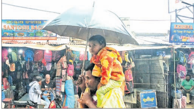
ବର୍ଷା ବେଳେ ଜଣେ ବ୍ୟକ୍ତି କାନ୍ଧରେ ପିଲାଟିକୁ ବସାଇ ଛତାଧରି ଯାଉଛନ୍ତି। ସରକାରୀ କାର୍ଯ୍ୟାଳୟ ଠାରୁ ଆରମ୍ଭ କରି ବେସରକାରୀ କାର୍ଯ୍ୟାଳୟ ପର୍ଯ୍ୟନ୍ତ ଅଧିକାଂଶ ଅଫିସରେ ବହୁ ତେୟାର ଖାଲି ପଡ଼ିଥିବା ପରିଲକ୍ଷିତ ହୋଇଥିଲା। ଏପରି ପାଗ ଆଉ ଗୋଟିଏ ଦିନ ପର୍ଯ୍ୟନ୍ତ ଲାଗି ରହିବ ବୋଲି ପାଣିପାଗ ବିଭାଗ ପକ୍ଷରୁ ଅନୁମାନ କରାଯାଇଛି। ଅନ୍ୟପକ୍ଷରେ ପୌରପାଳିକା ପକ୍ଷରୁ ଖୋଲାଯାଇଥିବା ରାତି ଆଶ୍ରୟ ସ୍ଥଳରେ ବାସହୀନଙ୍କ ଭିଡ଼ ଦେଖିବାକୁ ମିଳିଛି।

ଅଦିନିଆ ବର୍ଷା ସାଙ୍ଗକୁ ଶୁକ୍ରବାର କାଲୁଆ ପବନ ଅନୁଗୋଳକୁ ଥରାଇ ଦେଇଛି। ଶୀତ ସହ ଦିନତମାମ୍ ବର୍ଷା ଲାଗି ରହିଥିବାରୁ ଲୋକେ ବାହାରକୁ ଯିବାରେ ଅସୁବିଧାର ସମ୍ମୁଖୀନ ହୋଇଥିଲେ। ସକାଳୁ ଝିପି ଝିପି ଆରମ୍ଭ ହୋଇଥିବା ବର୍ଷା ପୂର୍ବାହ୍ନ ୧୦ଟା ପରେ ବଢ଼ିଯାଇଥିଲା। ଜିଲାର କିଶୋରନଗରରେ ଶୁକ୍ରବାର ପୂର୍ବାହ୍ନ ୮ଟା ସୁଦ୍ଧା ସର୍ବାଧିକ ୨୪.୮ ମିଲିମିଟର ବର୍ଷା ହୋଇଥିବା ଜିଲ୍ଲା ଆପାତକାଳୀନ ବିଭାଗ ପକ୍ଷରୁ ରେକର୍ଡ କରାଯାଇଛି। ତେବେ ଲଗାଣ ବର୍ଷା ଯୋଗୁ ଦିନତମାମ ଅନୁଗୋଳ ସହରର ରାସ୍ତାରେ କାଁ ଭାଁ ଲୋକେ ଯାତାଯାତ କରୁଥିବା ଦେଖିବାକୁ ମିଳିଥିଲା। ସେହିପରି