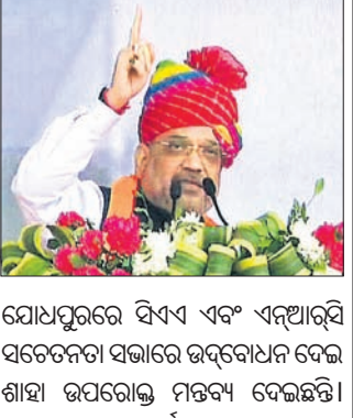
ଯୋଧପୁରରେ ସିଏଏଏ ଏବଂ ଏନ୍‌ଆର୍‌ସି କାହାଣୀ ନାଗରିକଙ୍କୁ ଛଡ଼ାଇନେବା ପାଇଁ ଗୁରୁତ୍ୱ ଦେବା ପାଇଁ କଂଗ୍ରେସର ପୂର୍ବନେତା ଅଧ୍ୟକ୍ଷ ରାଜୁଲ ଆପ୍‌ଗାନ୍‌ସିଆନଙ୍କୁ ନିର୍ଦ୍ଦେଶ ଦେଇଛନ୍ତି। ଯଦି ରାଜୁଲ ଶିକାର ହୋଇ ଭାରତରେ ଶରଣ ନେଇଥିବା ସଂଖ୍ୟାଲଘୁମାନଙ୍କୁ ନାଗରିକଙ୍କୁ ପ୍ରଦାନ କରିବା ଏହି ଆଇନର ଉଦ୍ଦେଶ୍ୟ।