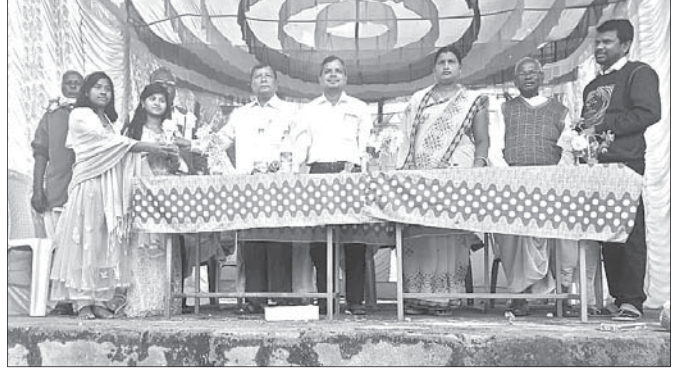
ଜଣେ କୃତୀ ପ୍ରତିଯୋଗୀଙ୍କୁ ପୁରସ୍କୃତ କରାଯାଇଛି।