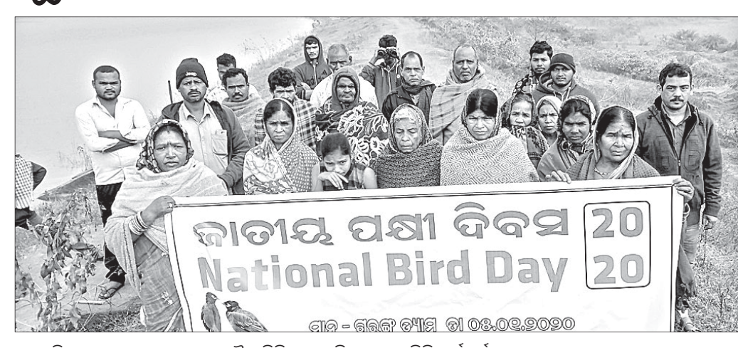
ପକ୍ଷୀ ଦିବସ ପାଳନ ଅବସରରେ ଜୈବ ବିବିଧତା ପରିଚାଳନା ସମିତି କର୍ମକର୍ତ୍ତାଙ୍କ ସମେତ ଅନ୍ୟମାନେ।