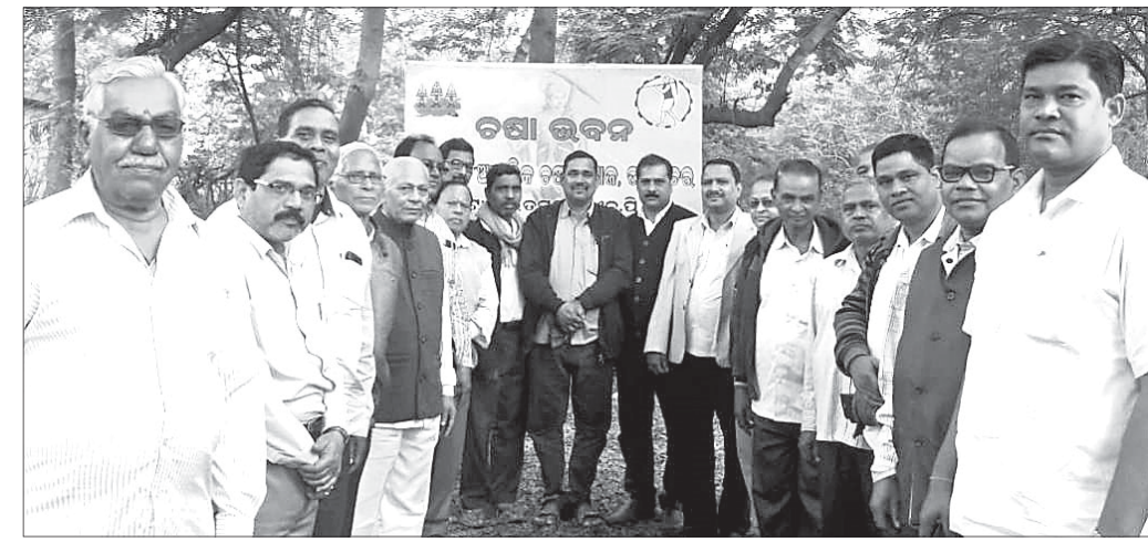
ସମ୍ମିଳନୀରେ ଚଷ୍ମା ସମାଜର କର୍ମକର୍ତ୍ତାମାନେ।