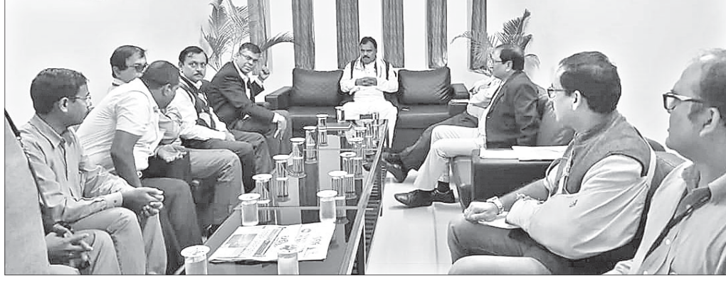
ବୈଠକରେ ଉପବାଚସ୍ପତିଙ୍କ ସମେତ କର୍ମଚାରୀ ଅଧିକାରୀମାନେ।

ରାଷ୍ଟ୍ରସ୍ତରୀୟ ଉଦ୍ଦେଶ୍ୟ ନାଲକୋର ବିଭିନ୍ନ ସମସ୍ୟା ସମାଧାନ କରିବାକୁ ଉଦ୍ଦେଶ୍ୟ ନାଲକୋ ଅଫିସରେ ଅନୁଗୋଳ ବିଧାନ ସଭା ଉପବାଚସ୍ପତି ଉଦ୍ଦେଶ୍ୟ ଉପସ୍ଥାପନ କରିବାକୁ ପଦକ୍ଷେପ ଗ୍ରହଣ କରିବାକୁ ନାଲକୋର ଅଧିକାରୀଙ୍କ ସହ ବୈଠକ ଅନୁଷ୍ଠିତ ହୋଇଛି।