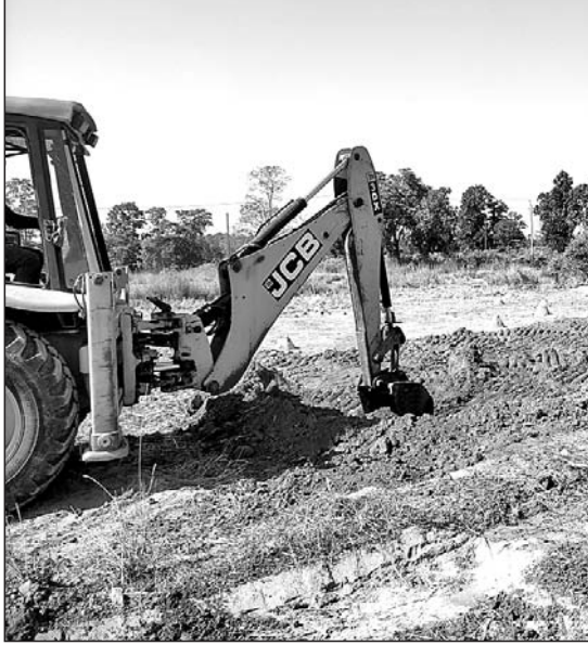
କେସିବି ଓ ଟ୍ରାକ୍ଟର ସାହାଯ୍ୟରେ ଖୋଳ ପଡ଼ିଆ ସମତଳ କରାଯାଇଛି (ବାମ) । ବ୍ଲକ ପ୍ରଶାସନ ପକ୍ଷରୁ କାମର ତଦନ୍ତ କରାଯାଇଛି ।