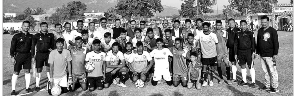
ଉଦ୍‌ଦୀପନା ମ୍ୟାଚର ଖେଳାଳି, ରେଫେରୀ ଓ ଟୁର୍ନାମେଣ୍ଟ ଆୟୋଜକଙ୍କ ସହ ବିଧାୟକ ସୁବାସ ଚନ୍ଦ୍ର ପାଣିଗ୍ରାହୀ ।

ଦେବବଡ଼, ୬।୧ (ଡି.ଏନ୍.ଏ.) ଦେବବଡ଼ ଶୁକ୍ଳିଆପଦା ଭିତର ଗାନ୍ଧୀ ଖେଳ ପଡ଼ିଆରେ ସର୍ବଭାରତୀୟ ୨ୟ ପ୍ରଧାନପାଟ ଜୟ ଫୁଟବଲ ଟୁର୍ନାମେଣ୍ଟ ଯୋଗବାର ଉଦ୍‌ଦୀପିତ ହୋଇଯାଇଛି । ପ୍ରଫୁଲ୍ଲ କୁବ ଜଟଣୀ ଓ ବାଳରାଜା ଫୁଟବଲ କ୍ଲବ ଭଞ୍ଜନଗର ମଧ୍ୟରେ ଉଦ୍‌ଦୀପନା ମ୍ୟାଚ ଅନୁଷ୍ଠିତ ହୋଇଥିଲା । ନିର୍ଦ୍ଦିଷ୍ଟ ସମୟରେ ଖେଳ ବରାବର ରହିବାକୁ ଚାଲିଥିବାର ସହାୟତା ନିଆଯାଇଥିଲା । ଏଥିରେ