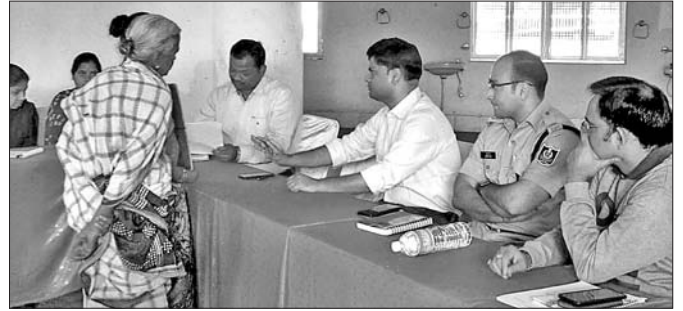
ଜିଲ୍ଲାପାଳ ଶିବିରରେ ଜନ ଅଭିଯୋଗ ଶୁଣାଣି କରୁଛନ୍ତି ।