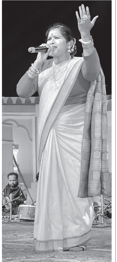
ପଢ଼ିନୀ ଦୋରା ଗୀତ ଗାଉଛନ୍ତି ।