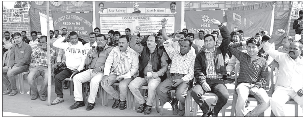
ସୋମବାର ସମ୍ବଲପୁର ଡିଆରଏମ୍ ଅଫିସ ସମ୍ମୁଖରେ ଶ୍ରମିକ ଯୁକ୍ତିଯୁକ୍ତ ପକ୍ଷରୁ ଧାରଣା ଦିଆଯାଇଛି ।

ସମ୍ବଲପୁର, ୬।୧ (ବ୍ୟୁରୋ) ଇସ୍କୋକୋଷ୍ଟ ରେଲକ୍ଷେ ଶ୍ରମିକ ଯୁକ୍ତିଯୁକ୍ତ ପକ୍ଷରୁ ୧୨ ଦିନ ଦାବି ନେଇ ସୋମବାର ସମ୍ବଲପୁର ମଣ୍ଡଳ ରେଳ ପ୍ରବନ୍ଧକଙ୍କ ଅଫିସ ସମ୍ମୁଖରେ ଧାରଣା ଦିଆଯାଇଛି । ଏହାସହ ସେମାନେ ବିଶୋଭ ପ୍ରଦର୍ଶନ କରିଛନ୍ତି । ପୂର୍ବାହ୍ନ ୧୦ଟାକୁ ଅପରାହ୍ନ ୧ଟା ପର୍ଯ୍ୟନ୍ତ ସେମାନେ ଦାବି ପୂରଣ କରିବା ନେଇ ଦ୍ୱାରାଣ ବେଲଥିଲେ । ରେଲକ୍ଷେର ଯତ୍ନକର୍ତ୍ତା, ରେଳ ବୋର୍ଡର ପୁନର୍ଗଠନକୁ ପ୍ରତ୍ୟାହାର କରିବା, ରିମ୍ କର୍ମଚାରୀମାନଙ୍କ କୁଟିମ୍ କ୍ଷେତ୍ରରେ ସାମିଲ କରିବା, ଟ୍ରାକ୍‌ମ୍ୟାନମାନଙ୍କର ପଦୋନ୍ନତି, ସମସ୍ତ କର୍ମଚାରୀଙ୍କ ବକେୟା