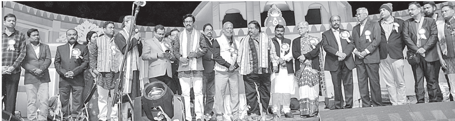
ସୋମବାର ସମ୍ବଲପୁର ଲୋକ ମହୋତ୍ସବ ମଞ୍ଚରେ ଅତିଥି, କର୍ମକର୍ତ୍ତା ଓ ସମର୍ଥକ ବ୍ୟକ୍ତିବିଶେଷ ।