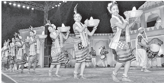
କହିଁ କଳାକାରଙ୍କ ନୃତ୍ୟ ।