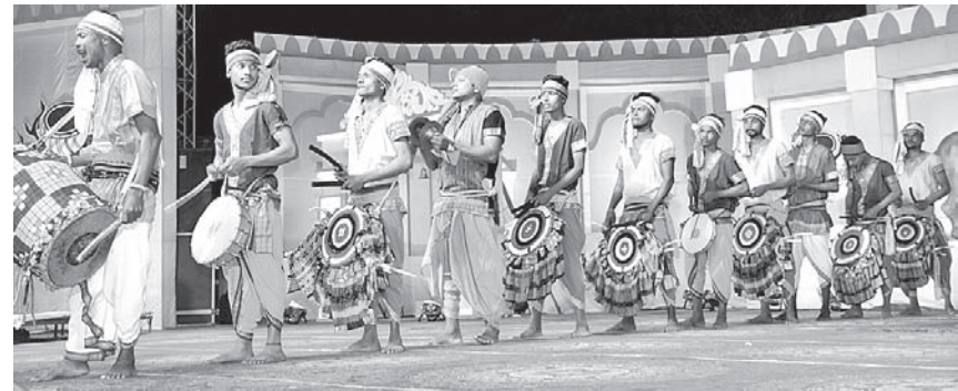
କଳାପରିଷଦ କଳାକାରମାନେ ନୃତ୍ୟ କରୁଛନ୍ତି ।