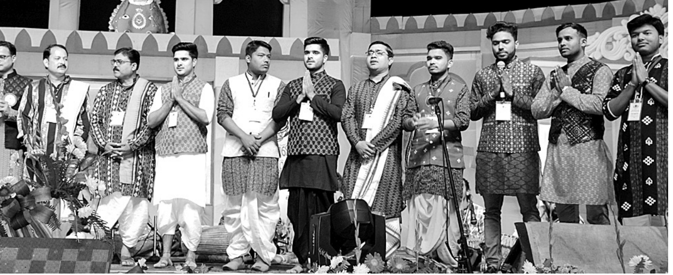
ଜାନୁୟାରୀ ୪ ତାରିଖ ଶନିବାରଠାରୁ ସମ୍ବଲପୁର ଅର୍ଲିଂପାଇକ ପିଏସଡି ପଡ଼ିଆରେ ୩ ଦିନ ଧରି ଚାଲିଥିବା 'ସମ୍ବଲପୁର ଲୋକ ମହୋତ୍ସବ-୨୦୨୦' ଯୋଗବାର ଉଦ୍‌ଦୀପିତ ହୋଇଛି । ଏହି ଅବସରରେ ଶେଷ ସମ୍ପାରେ ମଞ୍ଚରେ ଏକତ୍ରିତ ହୋଇଥିବା ଉଦ୍‌ଦୀପିକା, ଉଦ୍‌ଦୀପକମାନେ ।