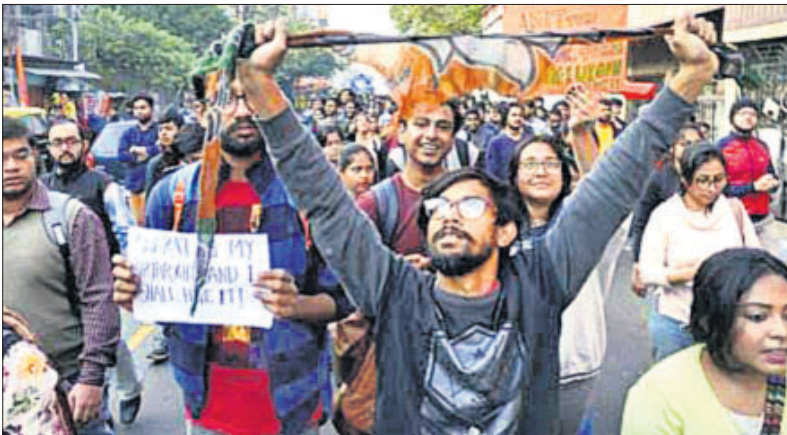
କେଏନ୍‌ୟୁ ହିଂସା ପ୍ରତିବାଦରେ ଯାଦବପୁର ବିଶ୍ୱବିଦ୍ୟାଳୟ ଛାତ୍ରାଛାତ୍ର ବିକ୍ଷୋଭ ପ୍ରଦର୍ଶନ କରୁଛନ୍ତି।