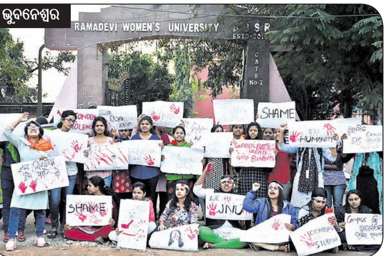
ଭୁବନେଶ୍ୱର ରମାଦେବୀ ମହିଳା ବିଶ୍ୱବିଦ୍ୟାଳୟ ଛାତ୍ରାଙ୍କ ବିରୋଧ।