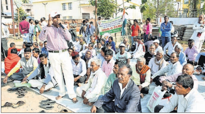
ଜିଲାପାଳଙ୍କ ଅଧିକାରୀଙ୍କ ସାମ୍ମୁଖରେ ପ୍ରତିବାଦ ସଭା।

ଯେ, ଧାନ ପାଚିବା ସମୟରେ ବାତ୍ୟା ବୁଲବୁଲ ଯୋଗୁ ପାଣିରେ ଧାନକେଣ୍ଡା ପଡ଼ି ଅଧିକାଂଶ ଜମିରେ ଫସଲ ନଷ୍ଟ ହୋଇଥିଲା। ଅମଳ ସମୟରେ ଗତ ଡିସେମ୍ବର ୨୬ରେ ବର୍ଷା ହେବା ପରେ କିଛି ପରିମାଣରେ ଫସଲ ସୁରକ୍ଷିତ କରିଥିବାବେଳେ ପୁଣି ଗତ ୩ ଡିସେମ୍ବର ବର୍ଷା ଦୁର୍ଦ୍ଦଶାକୁ ବୃଦ୍ଧି କରିଛି। ଜମିରେ କଟା ହୋଇପଡ଼ିଥିବା ଧାନ କଲେଜ ଓ ଖଜାରେ ଥିବା ଧାନ ଏବେ ଗଜା ହେବାର ବହୁ ଆଶଙ୍କା ରହିଥିବାବେଳେ ମଞ୍ଚରେ ବିକ୍ରି କ୍ଷେତ୍ରରେ ସମସ୍ୟା ସୃଷ୍ଟି ହେବ। ମାଟି ଓଡ଼ା ହେବାରୁ କଟା ହେବାକୁ ଥିବା ଜମିରେ ହାରକେଣ୍ଡର ମେଶିନ ପଶିପାଉ ନ ଥିବା କାରଣରୁ ଧାନ ଅମଳ ଆହୁରି ବିଳମ୍ବ ହେବ। ବହୁ ପରିଶ୍ରମରେ ଉପାର୍ଜିତ ଫସଲ ଅମଳରେ ପ୍ରାକୃତିକ ବିପର୍ଯ୍ୟୟ ବାରମ୍ବାର ଦାଉ ସାଧୁଥିବାରୁ ଦୁର୍ଦ୍ଦଶାର ସମ୍ମୁଖୀନ ହେବାକୁ ପଡ଼ିଛି ବୋଲି ସେମାନେ ପ୍ରକାଶ କରିଛନ୍ତି।