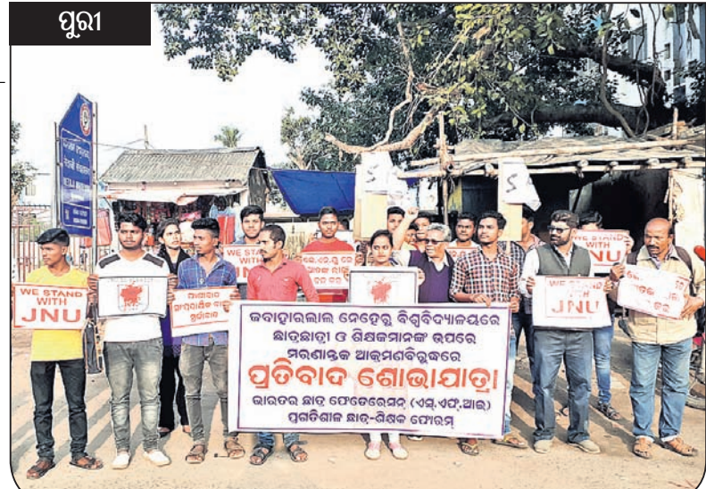
ପୁରୀ ପୁରୀରେ ଏସ୍ୱପ୍ନଆଲ ପକ୍ଷରୁ ବିରୋଧ ଶୋଭାଯାତ୍ରା।