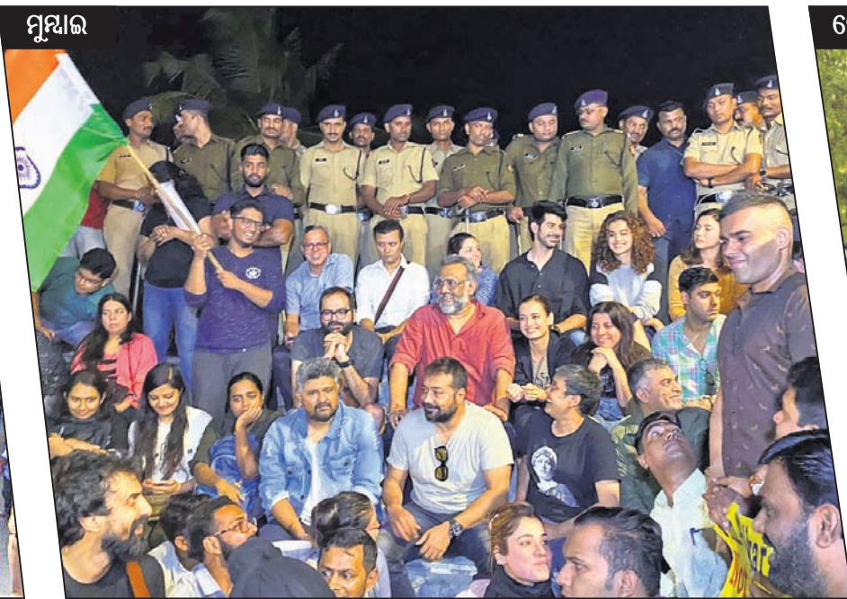
ମୁମ୍ବାଇ ଜେଏନୟୁ ଛାତ୍ରାଛାତ୍ରୀଙ୍କୁ ଆକ୍ରମଣର ପ୍ରତିବାଦ କରୁଥିବା ବଳଭଦ୍ର କଳାକାର, ପିଲା ନିର୍ମାତା।