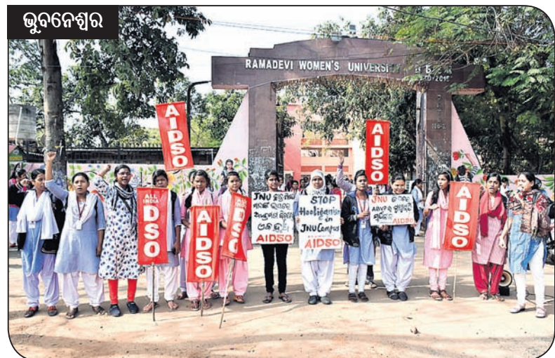
ଭୁବନେଶ୍ୱର ରମାଦେବୀ ମହିଳା ବିଶ୍ୱବିଦ୍ୟାଳୟ ସମ୍ମୁଖରେ ଏଆଇଡିଏସ୍ ପକ୍ଷରୁ ବିରୋଧ ପ୍ରଦର୍ଶନ।