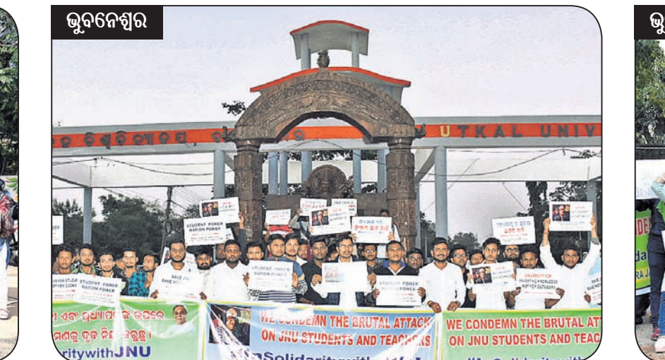
ଭୁବନେଶ୍ୱର ଉତ୍କଳ ବିଶ୍ୱବିଦ୍ୟାଳୟ ସମ୍ମୁଖରେ ବିଜୁ ଛାତ୍ର ଜନତା ଦଳ ପକ୍ଷରୁ ବିରୋଧ।