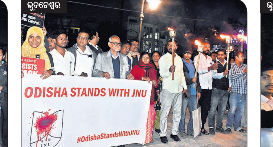
ଭୁବନେଶ୍ୱର ଓଡ଼ିଶା ଖ୍ଯାୟ ଓଡ଼ିଆ ଜେଏନୟୁ ପକ୍ଷରୁ ମାସୁରକ୍ୟାଣ୍ଡନ ଛକରେ ବିରୋଧ ଓ କ୍ୟାଣ୍ଡେଲ ଶୋଭାଯାତ୍ରା।