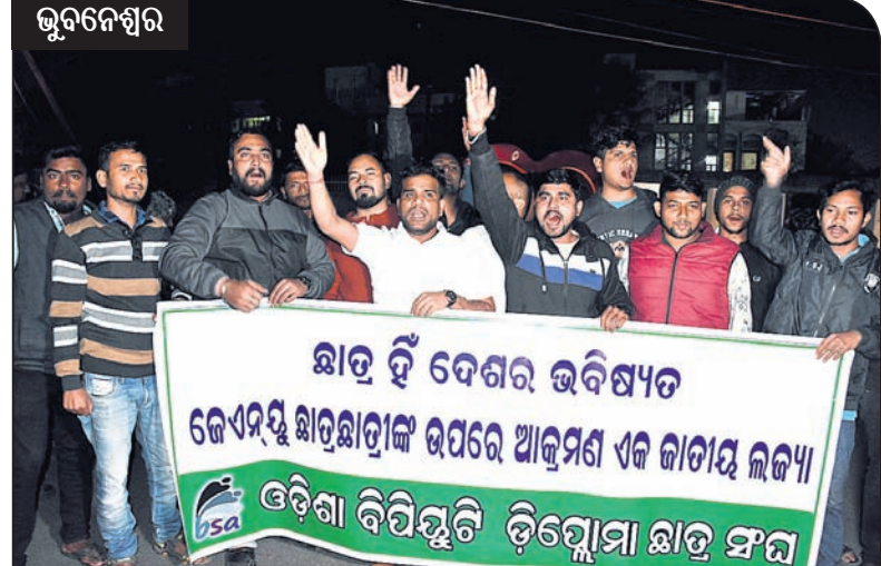
ଭୁବନେଶ୍ୱର ମାସୁରକ୍ୟାଣ୍ଡନ ଛକରେ ଓଡ଼ିଶା ବିପିୟୁଟି ଡିପ୍ଲୋମା ଛାତ୍ର ସଂଘ ପକ୍ଷରୁ ବିରୋଧ।