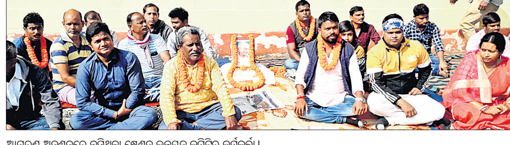
ଆମରଣ ଅନଶନରେ ବସିଥିବା ଷ୍ଟେଶନ ଉନ୍ନୟନ କମିଟିର କର୍ମଚାରୀ।

ଓଡ଼ିଶା ସାମାଜରେ ଥିବା ଲକ୍ଷ୍ମଣନାଥ ରୋଡ଼ ରେଳ ଷ୍ଟେଶନ ଓ ଯାତ୍ରୀକ ବିଭିନ୍ନ ସମସ୍ୟା ପ୍ରତି ଦକ୍ଷିଣ-ପୂର୍ବ ରେଳ କର୍ତ୍ତୃପକ୍ଷ ଦାୟିତ୍ୱ ଧରି ଅଣଦେଖା କରୁଥିବାରୁ ଏହା ପ୍ରତିବାଦରେ ଷ୍ଟେଶନ ଉନ୍ନୟନ କମିଟି ଚରଫତୁ ସୋମବାର ପୂର୍ବାହ୍ନରେ ଆମରଣ ଅନଶନ କରାଯାଇଥିଲା। କମିଟି ପକ୍ଷରୁ ଦିଆଯାଇଥିବା ୬ ଦମ୍ପା ଦାବି ପୂରଣ ନ ହେବା ଯାଏ ଅନିର୍ଦ୍ଦିଷ୍ଟ କାଳ ପର୍ଯ୍ୟନ୍ତ ଆମରଣ ଅନଶନ କରାଯିବ ବୋଲି ଚେତାବନୀ ଦିଆଯାଇଥିଲା। ଏହି ସୂଚନା ପାଇ ଦକ୍ଷିଣ-ପୂର୍ବ ରେଳପଥର ଖଡ଼ଗପୁର ଡିଭିଜନର ଏସିଏମ୍ ସମନାୟକ ସମେତ ଉପରିକ୍ତ କର୍ମଚାରୀମାନେ ଆସି ଅନଶନକାରୀଙ୍କ ସହ ଆଲୋଚନା କରିଥିଲେ। ଦାବି ପୂରଣ ଦିଗରେ କାର୍ଯ୍ୟାନୁଷ୍ଠାନ ପ୍ରତିଷ୍ଠିତ ଦିଆଯିବାରୁ ମଧ୍ୟାହ୍ନ ୧୨ଟା ୫୫ମିନିଟ୍ ସମୟରେ ଅନଶନ ଭଙ୍ଗ ହୋଇଥିଲା। ଏହି ଅନଶନରେ କମିଟିର ସଭାପତି