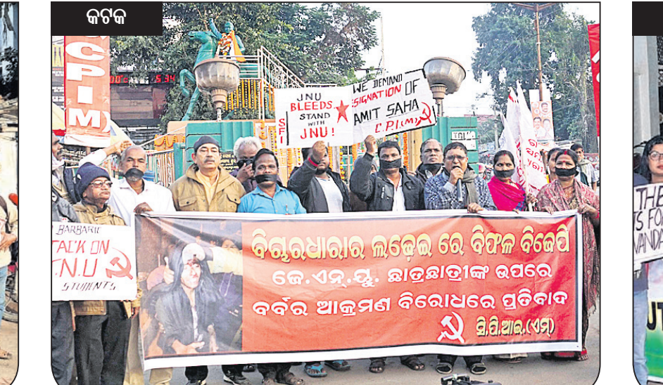
କଟକ କଟକ କଲେଜ ଛକ ନିକଟରେ ସିପିଆଇଏମ୍ ପକ୍ଷରୁ ବିରୋଧ ପ୍ରଦର୍ଶନ।