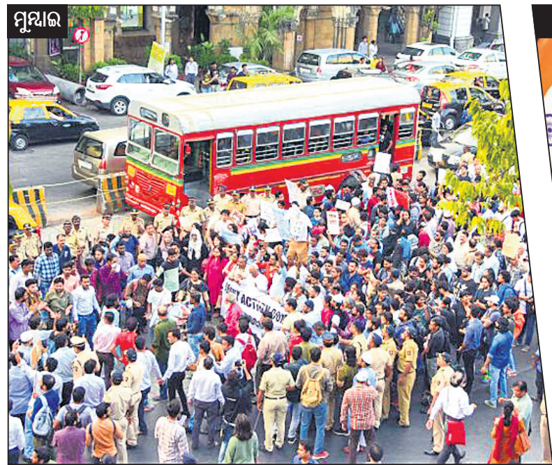
ମୁମ୍ବାଇ ମୁମ୍ବାଇର ହୁମାୟା ଚୌକକୁ ରେଟଡ଼େ ଅଫ ଲାଇଫ୍ ପର୍ଯ୍ୟନ୍ତ ବିରୋଧ ଶୋଭାଯାତ୍ରାରେ ଭାଗ ନେଇଥିବା ଛାତ୍ରାଛାତ୍ରୀ ଓ ସାମାଜିକ କର୍ମୀ।