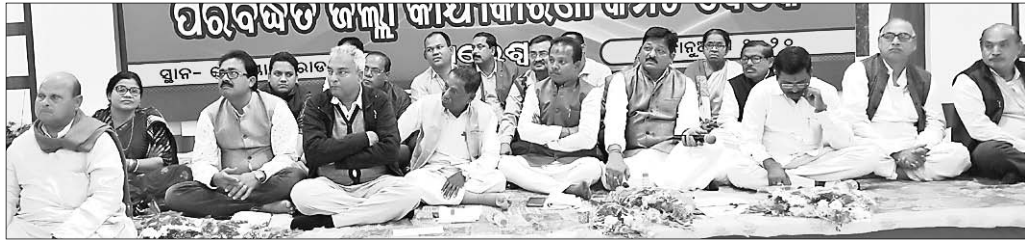
ପରିବର୍ଦ୍ଧିତ କାର୍ଯ୍ୟକାରୀତା ବୈଠକରେ ମନ୍ତ୍ରୀ ଓ ବରିଷ୍ଠ ନେତୃବର୍ଗ ।