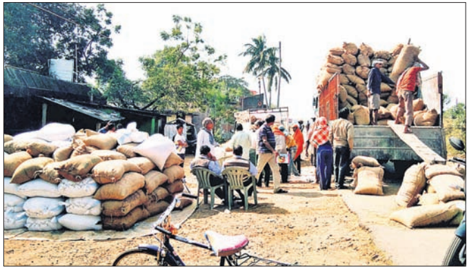
ଧାନମଣ୍ଡିରେ ଚାଷୀ ପ୍ରତିବାଦ କରାଯାଇଛି।

ବିଭିନ୍ନ ମଣ୍ଡିରେ ଧାନକିଣା ବେଳେ କଟନୀଛଟନୀ କରାଯାଇ ଥିବାରୁ ଚାଷୀମାନେ ଏହାକୁ ବିରୋଧ କରୁଛନ୍ତି। ବାଲେଶ୍ୱର ଜିଲ୍ଲା ବାହାନଗା ସେବା ସମବାୟ ସମିତି ପକ୍ଷରୁ ଖୋଲାଯାଇଥିବା ମଣ୍ଡିକୁ ଧାନ ବିକିବାକୁ ଆସୁଥିବା ଚାଷୀ ଏ ନେଇ ଅସନ୍ତୋଷ ବ୍ୟକ୍ତ କରିଛନ୍ତି।