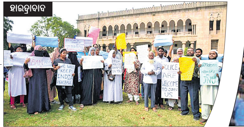
ହାଇଦ୍ରାବାଦ ହାଇଦ୍ରାବାଦ ଓସ୍ମାନିଆ ୟୁନିଭର୍ସିଟି ସମ୍ମୁଖରେ ଛାତ୍ର, ପ୍ରଫେସର ଓ ବିଭିନ୍ନ ଏନଜିଓ ପ୍ରତିନିଧି ପ୍ଲାକାର୍ଡ ଧରି ବିରୋଧ ପ୍ରଦର୍ଶନ କରୁଛନ୍ତି।