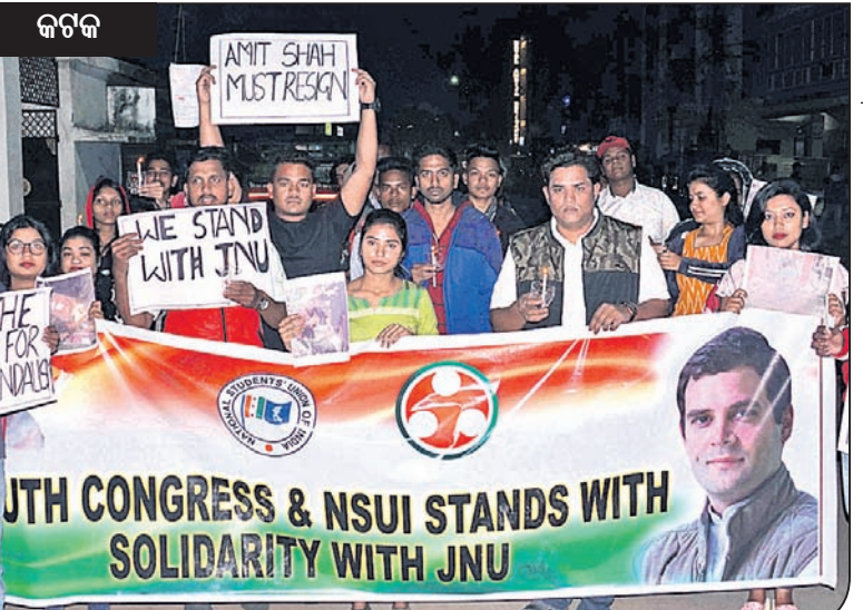
କଟକ କଟକ କଲେଜ ଛକରୁ ଜିଲା, ୟୁଏ ଓ ଛାତ୍ର କଂଗ୍ରେସ ପକ୍ଷରୁ ବାହାରିଥିବା କ୍ୟାଣ୍ଡେଲ ଶୋଭାଯାତ୍ରା।