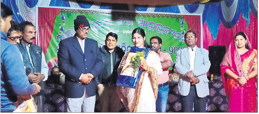
ଉତ୍ସବରେ ଯାତ୍ରା ନାୟିକା ମାମାଙ୍କୁ ସମର୍ପଣ କରାଯାଇଛି।

ବନ୍ଧୁ, ୬।୧(ଡି.ଏନ.ଏ.): ଗ୍ରାମୀଣ ବ୍ୟକ୍ତିତ୍ୱ ପଞ୍ଚାୟତ ବରକୋଣା ସ୍ୱାକ୍ଷରୀରେ ଦେବଦାସୀ ଯୋଜନାରେ ଗ୍ରାମୀଣଙ୍କୁ ସାମାଜିକ ମଧ୍ୟ ଚାହା ଅନ୍ୟାନ୍ୟ ବାକି କରାଯାଉ ନାହିଁ। ବିଦ୍ୟୁତ୍ ଗ୍ରାମୀଣଙ୍କୁ ଏବେ ନଷ୍ଟ ହେବାକୁ ବଢ଼ିଛି। ଉଦ୍ଦେଶ୍ୟମୟ ଯେ, ବରକୋଣା ସ୍ୱାକ୍ଷରୀରେ ଲୋକ ଆପଣାନ୍ତୁ ୧୦୦ କେଜି ଗ୍ରାମୀଣଙ୍କୁ ବିକ୍ରି ବ୍ୟବହାର କରୁଥିବାବେଳେ ଲୋ ଭୋଲକେଣ୍ଡର ସମସ୍ୟାର ସମ୍ମୁଖୀନ ହେଉଛନ୍ତି। ଦେବଦାସୀ ତଳେ ଏହି ସମସ୍ୟା ଦୂର ପାଇଁ ୩୫ ଉପଭୋକ୍ତାଙ୍କ ସହାୟତା ୬୩ କେଜି ଗ୍ରାମୀଣଙ୍କୁ ବ୍ୟାପାର ବ୍ୟବସ୍ଥା କରାଯାଇଥିଲା। ସମସ୍ତ କାର୍ଯ୍ୟ