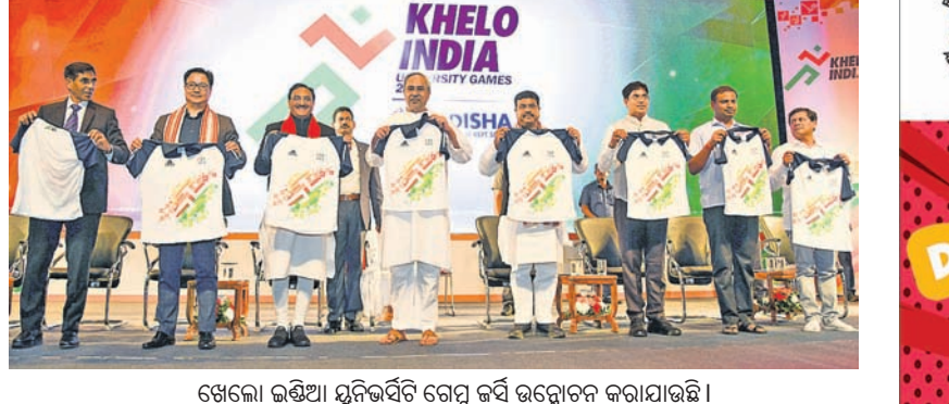
ଖେଲୋ ଇଣ୍ଡିଆ ୟୁନିଭର୍ସିଟି ଗେମ୍ ଜର୍ସି ଉନ୍ମୋଚନ କରାଯାଇଛି ।

ଭୁବନେଶ୍ଵର, ୬।୧ (କ୍ରୀଡ଼ା ପ୍ରତିନିଧି) ଭାରତକୁ ଏକ କ୍ରୀଡ଼ା ମହାଶକ୍ତିରେ ପରିଣତ କରିବା ଲକ୍ଷ୍ୟରେ କେନ୍ଦ୍ର ସରକାରଙ୍କ ପକ୍ଷରୁ କ୍ରୀଡ଼ା ଉନ୍ମୋଚନ ଆରମ୍ଭ ହୋଇଛି । ଏହି ପରିପ୍ରେକ୍ଷାରେ ଖେଲୋ ଇଣ୍ଡିଆ ୟୁନିଭର୍ସିଟି ଗେମ୍ ଆୟୋଜିତ ସର୍ବପ୍ରଥମ ଖେଲୋ ଇଣ୍ଡିଆ ୟୁନିଭର୍ସିଟି ଗେମ୍ ଆୟୋଜିତ ହେଉଥିବାରୁ ପୂର୍ବଦୃଷ୍ଟି ଭାବେ ସରକାରଙ୍କ କ୍ରୀଡ଼ା ମନ୍ତ୍ରାଳୟ ଏବଂ ପୃଷ୍ଠା-୪