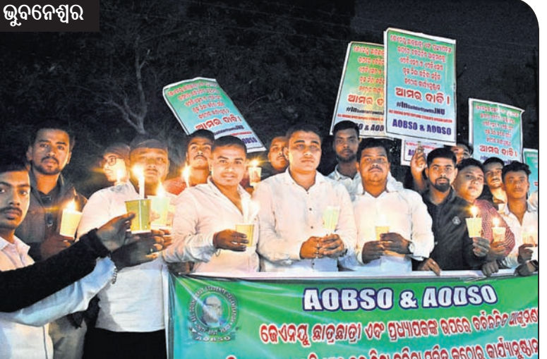
ଭୁବନେଶ୍ୱର ଏଓବିଏସ୍ ଏଫ୍ ଏଓଡିଏସ୍ ପକ୍ଷରୁ ରାଜମହଲ ଛକରେ କ୍ୟାଣ୍ଡେଲ ଶୋଭାଯାତ୍ରା।