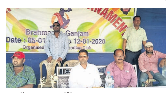
ବ୍ରହ୍ମପୁର ଅଫିସ୍, ୭।୧

ଗୋଷ୍ଠୀଗାନ୍ଧୀ କେନ୍ଦ୍ର ହାଲ୍‌ସ୍କୁଲ ପଡ଼ିଆରେ କେସି ଏକାଦଶୀ କ୍ରିକେଟ ଟୁର୍ନାମେଣ୍ଟରେ ଭାସ୍କର ଏକାଦଶୀ ଶ୍ରୀକାକୁଳମ ବିଜେତା ହୋଇଥିଲା।