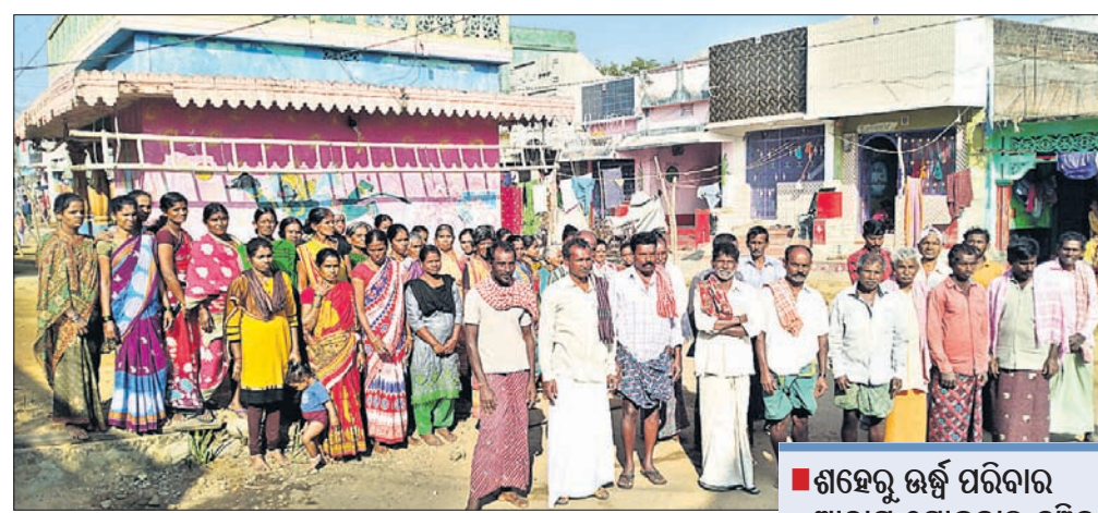
ଅକରବିଜି ଗ୍ରାମର ମହିଳା ଓ ପୁରୁଷମାନେ।

ପ୍ରାୟ ୨୦୦ ବର୍ଷ ତଳର ଗାଁ ଏଠାରେ ପୁରାତନ ସ୍କୁଲ, ଅଜନାମ୍ନି କେନ୍ଦ୍ର, ପୋଖରୀ, ପଙ୍କା ରାସ୍ତା, ପଙ୍କା ଘର ଅଛି। ଓଡ଼ିଶା ସରକାରଙ୍କ ବିଭିନ୍ନ କନସ୍ଟ୍ରକ୍ସନ୍ କାର୍ଯ୍ୟ ଚାଲିଛି।