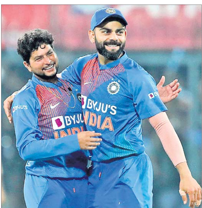
କୃଷ୍ଣାଲ ପେରେରାଙ୍କ ଉଇକେଟ ନେବାପରେ କୁଲଦୀପ ଯାଦବଙ୍କୁ ବିରାଟ କୋହଲିଙ୍କ ଧ୍ୟେୟ।

ସ୍ଥାନୀୟ ହୋଲକର ଷ୍ଟାଡ଼ିୟମରେ ଭାରତ ଓ ଭ୍ରମଣକାରୀ ଶ୍ରୀଲଙ୍କା ମଧ୍ୟରେ ଦ୍ୱିତୀୟ ଟି୨୦ ମ୍ୟାଚ୍ ଖେଳାଯାଇଛି।