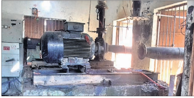
ଖରାପ ହୋଇଥିବା ମୋଟର।