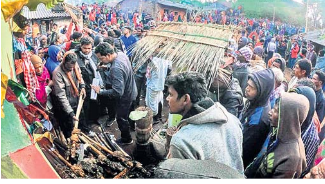
ଚୋକିମରା ପର୍ବରେ ଲୋକଙ୍କ ଭିଡ଼।