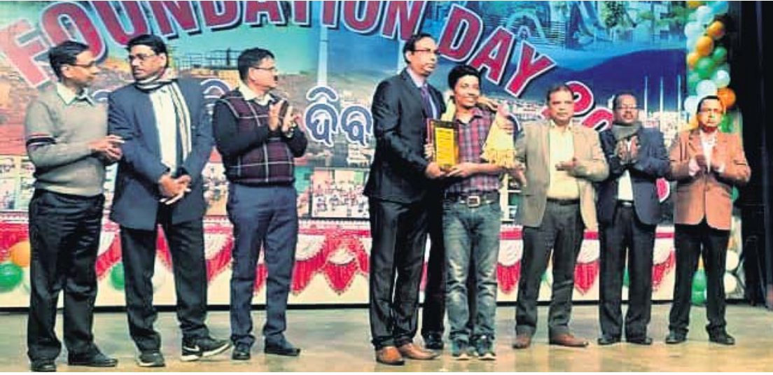
ନାଲକୋ ପ୍ରତିଷ୍ଠା ଦିବସରେ ଜଣଙ୍କୁ ସମ୍ମାନିତ କରାଯାଇଛି ।

ସେମିଲିଗୁଡ଼ା/ଦାମନଯୋଡ଼ି, ୭୧୧(ସ.ପ୍ର./ଡି.ଏନ୍.ଏ.)