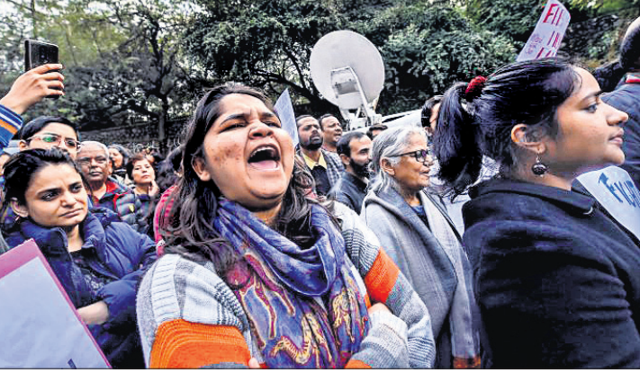
ଦିଲ୍ଲୀର ଜବାହରଲାଲ ନେହେରୁ ବିଶ୍ୱବିଦ୍ୟାଳୟର ଶିକ୍ଷକ ସଂଘ ଏବଂ ଛାତ୍ର ସଂଘ କର୍ମକର୍ତ୍ତା ବିଶୋଭ ଶୋଭାଯାତ୍ରା କରୁଛନ୍ତି।

ଦିଲ୍ଲୀର ଜବାହରଲାଲ ନେହେରୁ ବିଶ୍ୱବିଦ୍ୟାଳୟ (କେଏନ୍ୟୁ)ରେ ଘଟିଥିବା ହିଂସାକୁ ନେଇ ଦେଶବାସୀ ବିଶୋଭ ଜାରି ରହିଥିବାବେଳେ ମଙ୍ଗଳବାର ପୋଲିସ ୨୦ ଜଣଙ୍କ ବିରୋଧରେ ମାମଲା ରୁଜୁ କରିଛି।