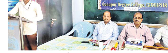
ଛାତ୍ର ବିଶିଷ୍ଟ ଶବ୍ଦର ସମ୍ବନ୍ଧ ପାଠ କରୁଛନ୍ତି।