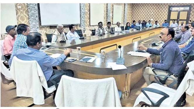
ସାଧାରଣତନ୍ତ୍ର ଦିବସ ପାଇଁ ବସିଥିବା ବୈଠକରେ ଉପସ୍ଥିତ ଅଧିକାରୀମାନେ।