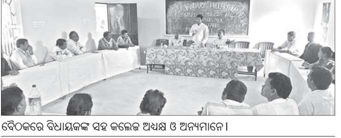
ବୈଠକରେ ବିଧାୟକଙ୍କ ସହ କଲେଜ ଅଧ୍ୟକ୍ଷ ଓ ଅନ୍ୟମାନେ।