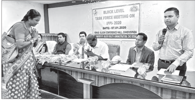
ବୈଠକରେ ଉପସ୍ଥିତ ଏମ୍ପି, ବିଧାୟକଙ୍କ ସମେତ ପ୍ରଶାସନିକ ଅଧିକାରୀମାନେ।

ଛେତିପଦା ପଞ୍ଚାୟତ ସମିତିର ୮ମ ବୈଠକ ମଙ୍ଗଳବାର ରୁକ୍ଷ ସଭାଗୃହଠାରେ ଅନୁଷ୍ଠିତ ହୋଇଯାଇଛି।