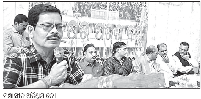
ମଞ୍ଚାସୀନ ଅତିଥିମାନେ ।