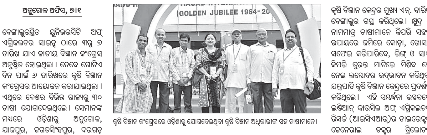
କୃଷି ବିଜ୍ଞାନ କଂଗ୍ରେସରେ ଓଡ଼ିଶାରୁ ଯୋଗଦେଇଥିବା କୃଷି ବିଜ୍ଞାନ ଅଧିକାରୀଙ୍କ ସହ ଚାଷୀମାନେ ।

ଅନୁଗୋଳ ଅଫିସ, ୭।୧ ବେଙ୍ଗାଲୁରସ୍ଥିତ ଯୁନିଭରସିଟି ଅଫ୍ ଏଗ୍ରିକଲଚର ସାଇନ୍ସ ଠାରେ ୩ରୁ ୬ ତାରିଖ ଯାଏଁ ଜାତୀୟ ବିଜ୍ଞାନ କଂଗ୍ରେସ ଅନୁଷ୍ଠିତ ହୋଇଥିଲା । ତେବେ ଗୋଟିଏ ଦିନ ପାଇଁ ୬ ତାରିଖରେ କୃଷି ବିଜ୍ଞାନ କଂଗ୍ରେସର ଆୟୋଜନ କରାଯାଇଥିଲା । ଏଥିରେ ଦେଶର ବିଭିନ୍ନ ରାଜ୍ୟରୁ ୩୦ ଚାଷୀ ଯୋଗଦେଇଥିଲେ । ସେମାନଙ୍କ ମଧ୍ୟରେ ଓଡ଼ିଶାରୁ ଅନୁଗୋଳ, ଯାଜପୁର, ଜଗତସିଂହପୁର, ବରଗଡ଼ ଓ ସମଲପୁର ଜିଲାରୁ ଜଣେ ଜଣେ ଚାଷୀ ଅଂଶଗ୍ରହଣ କରିଥିବାବେଳେ ଅନୁଗୋଳ ଜିଲା ଆଠମଲ୍ଲିକ ରୁକ୍ମିଣୀ