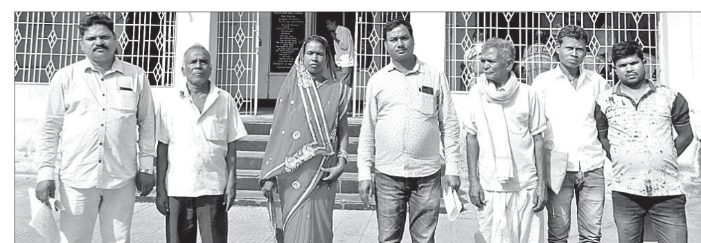
ଜିଲ୍ଲାପାଳଙ୍କୁ ଦାବିପତ୍ର ପ୍ରଦାନ କରିବାକୁ ଆସିଥିବା ଅଞ୍ଚଳବାସୀ।

ତାଳଚେର ବ୍ଲକର ସରପଞ୍ଚା, ଗୁରୁଜାଣୁଲି ଏବଂ ବଡ଼ୋଲ ପଞ୍ଚାୟତର ବିଭିନ୍ନ ମୌଳିକ ସମସ୍ୟାର ସମାଧାନ ସହିତ ବହୁର ଛକରେ ଏକ ଫାଣ୍ଡି ସ୍ଥାପନ ନିମନ୍ତେ ଅଞ୍ଚଳବାସୀ ଯୋଗଦାନ ଜିଲ୍ଲାପାଳଙ୍କ ଜନ ଅଭିଯୋଗ ଶୁଣାଣି ଶିବିରରେ ଦାବି କରିଛନ୍ତି। ସେହିପରି ପରଜଙ୍ଗ ନିକଟ ଜଙ୍ଗଲରୁ ଚାଲିଆସୁଥିବା ହାତୀ ତାଳଚେର ଅଞ୍ଚଳରେ କ୍ରମାଗତ ଭାବେ କ୍ଷୟକ୍ଷତି ଘଟାଉଥିବାରୁ ତାହା ରୋକିବା, ବୃଦ୍ଧିପାଇଥିବା ପ୍ରଫୁଲ୍ଲ ସମସ୍ୟାର ସମାଧାନ ପାଇଁ ବାରମ୍ବାର ପ୍ରଶାସନ ନିକଟରେ ଅଭିଯୋଗ କରାଯାଉଥିଲେ ବି କିଛି ସୁଫଳ ମିଳୁ ନ ଥିବା ଅଞ୍ଚଳବାସୀ ଜିଲ୍ଲାପାଳଙ୍କୁ ଜଣାଇଛନ୍ତି। ତେଣୁ ହାତୀ ଉପଦ୍ରବରୁ ରକ୍ଷା ନିମନ୍ତେ ବ୍ରାହ୍ମଣୀ ନଦୀ କୂଳରେ ସୋଲାର ଫେନସିଙ୍ଗ କରାଯିବା