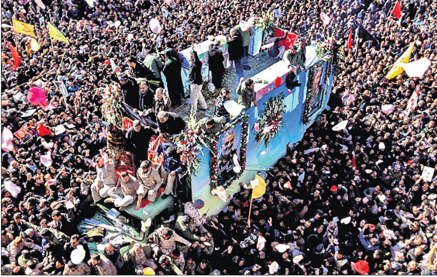
କେମାନ, ୨୧ (ପି.ଟି./ଆଇଏସଏନଏ)

ଆମେରିକାର ରକେଟ ମାଡ଼ରେ ନିହତ ହୋଇଥିବା ଜରାଣ ସେନା କମାଣ୍ଡର କେନେରାଲ କାସିମ ସୋଲେମାନୀଙ୍କ ଶେଷକୃତ୍ୟ ମଙ୍ଗଳବାର ସମ୍ପନ୍ନ ହୋଇଛି। ସୋଲେମାନୀଙ୍କ ସହର କେମାନରେ ଶେଷକୃତ୍ୟ ପୂର୍ବରୁ ତାଙ୍କ ମୃତଦେହକୁ ଶୋଭାଯାତ୍ରାରେ ନିଆଯାଉଥିବାବେଳେ ଦଳାଚକଟା ହୋଇଛି। ଏଥିରେ ୪୦ ଜଣଙ୍କ ମୃତ୍ୟୁ ଘଟିଛି। ଅନ୍ୟ ୪୫ ଜଣ ଆହତ ହୋଇଥିବା ଜରାଣର ସରକାରୀ ଚିକିତ୍ସାଳୟରେ ପ୍ରସାରିତ ହୋଇଛି। ୨୩ ବର୍ଷୀୟ ସୋଲେମାନୀଙ୍କୁ ଜରାଣବାସୀ ଶେଷସମ୍ମାନ ଜଣାଇଛନ୍ତି। ଶୋଭାଯାତ୍ରା ବେଳେ ଉପସ୍ଥିତ ଜନତା ସେମାନଙ୍କ ପ୍ରିୟ ଯୋଦ୍ଧା ବୀରଦ୍ୱର ଗାଥାକୁ