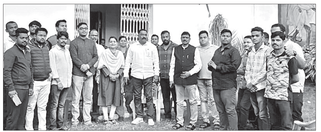
ବୈଠକରେ ଯୋଗଦେଇଥିବା ଜିଲା କଂଗ୍ରେସ ନେତା ଓ କର୍ମୀମାନେ ।

ଅନୁଗୋଳ ଅଫିସ, ୭।୧ ଦେଶରେ ଦେଖା ଦେଇଥିବା ଉତ୍ତମ ଆର୍ଥିକ ମାନ୍ଦାଗ୍ରା, ବହୁଥିବା ବେକାରି, ବେରୋଜଗାରୀ, ନିତ୍ୟ ବ୍ୟବହୃତ ଖାଦ୍ୟ ସାମଗ୍ରୀର ମୂଲ୍ୟ ବୃଦ୍ଧି, ରାଷ୍ଟ୍ରପତି ସାମଗ୍ରୀର ମୂଲ୍ୟ ବୃଦ୍ଧି, ରାଷ୍ଟ୍ରପତି ଉଦ୍ୟୋଗର ଘରୋଇକରଣ ଆଦି ବିରୋଧରେ କେନ୍ଦ୍ରୀୟ ଶ୍ରମିକ ସଙ୍ଗଠନ ଓ ଅନ୍ୟାନ୍ୟ ସ୍ୱାଧୀନ ଫେଡେରେଶନ ପକ୍ଷରୁ ରୁଧିର ଦେଶବ୍ୟାପୀ ଧର୍ମଘଟ ଡାକରା ଦିଆଯାଇଛି । ଏହି ଧର୍ମଘଟକୁ ଓଡ଼ିଶା ପ୍ରଦେଶ କଂଗ୍ରେସ ପକ୍ଷରୁ ସମର୍ଥନ ଦିଆଯାଇଛି ।