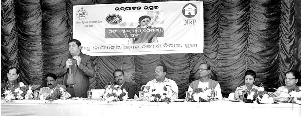
ପୁରୀ ଆୟୁର୍ବେଦ କଲେଜ ପରିସରରେ 'ସଖା' (ୱାନ ଷ୍ଟାଫ୍ ସେଣ୍ଟର) କେନ୍ଦ୍ର ଉଦ୍ଘାଟନ କାର୍ଯ୍ୟକ୍ରମରେ ଯୋଗଦେଇଥିବା ଅତିଥିମାନେ।