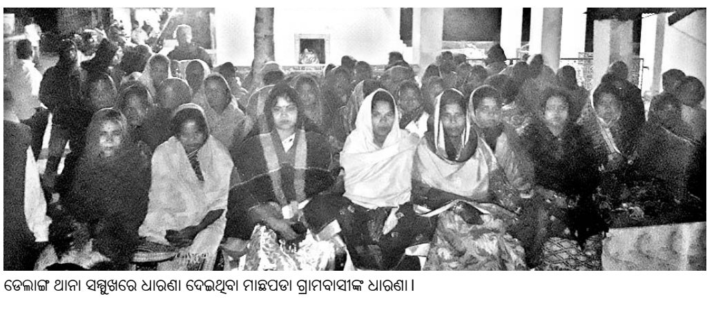
ଡେଲାଇ ଆନା ସମ୍ମୁଖରେ ଧାରଣା ଦେଇଥିବା ମାଛପତା ଗ୍ରାମବାସୀଙ୍କ ଧାରଣା।

ଶ୍ରୀକ୍ଷେତ୍ର ପୁସ୍ତକ ମେଳାରେ ଜମୁଛି ଭିଡ଼। ପଠନ ବୁକ୍ସରେ ପୁରସ୍କୃତ ଛାତ୍ରୀଛାତ୍ରମାନେ। ପଠନ ବୁକ୍ସରେ ପୁରସ୍କୃତ ଛାତ୍ରୀଛାତ୍ରମାନେ।