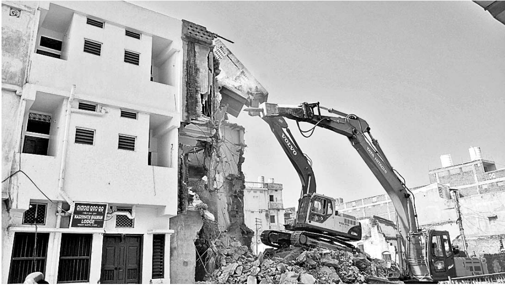
ଶ୍ରୀମନ୍ଦିର ପଶ୍ଚିମ ଦ୍ୱାରରେ ଥିବା କୋଠା ଭଙ୍ଗାଯାଇଛି।

ଶ୍ରୀମନ୍ଦିର ପୁରୁ କୋଠା ଖୋଲିବା ପାଇଁ ଉଦ୍ଦେଶ୍ୟ ପ୍ରକ୍ରିୟା ଆରମ୍ଭ କରାଯାଇଛି। ମଙ୍ଗଳବାର ଶ୍ରୀମନ୍ଦିର ପଶ୍ଚିମଦ୍ୱାରରେ ଥିବା ୪ଟି ଘରୋଇ ପୁରୁ କୋଠା ଭଙ୍ଗାଯାଇଛି। ରୁଧିରୀ ଭାରତ ବନ୍ଦ ଠାକୁରାଣୀ ଯୋଗୁଁ ଉଦ୍ଦେଶ୍ୟ ପୂର୍ଣ୍ଣ ରହିବ। ରୁଧିରୀରଠାରୁ ପୁରୁ କୋଠା ଖୋଲିବା ହେବ ବୋଲି ଜଣାପଡ଼ିଛି।