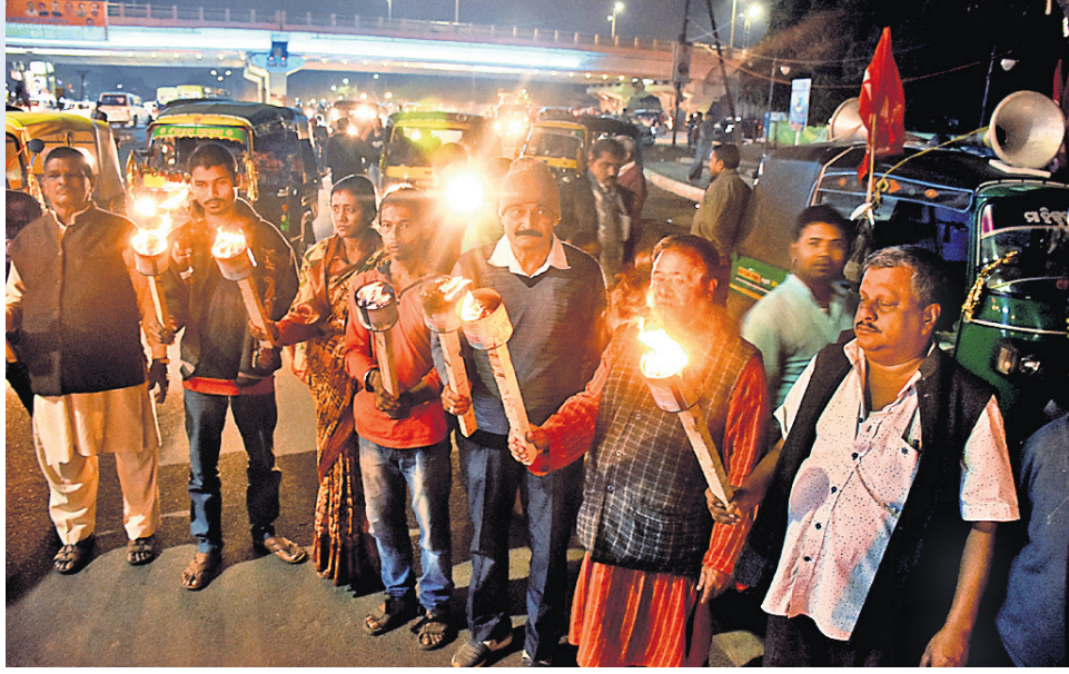
ଭୁବନେଶ୍ୱର ରାଜମହଲ ଛକରେ ପିପିଆଇର ମଣ୍ଡାଳ ଶୋଭାଯାତ୍ରା।