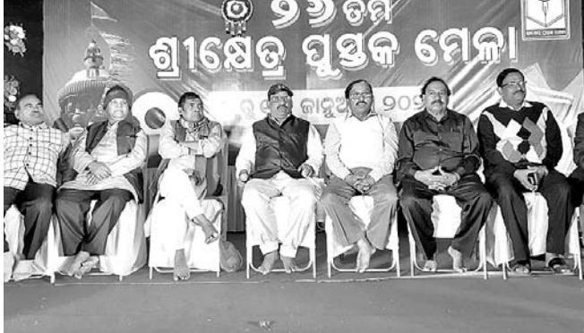
ପୁରୀ ଶ୍ରୀକ୍ଷେତ୍ର ପୁସ୍ତକ ମେଳାରେ ବୋଧୂତକ ଆଲୋଚନାଚକ୍ରରେ ମହାସଭା ଅତିଥିମାନେ।