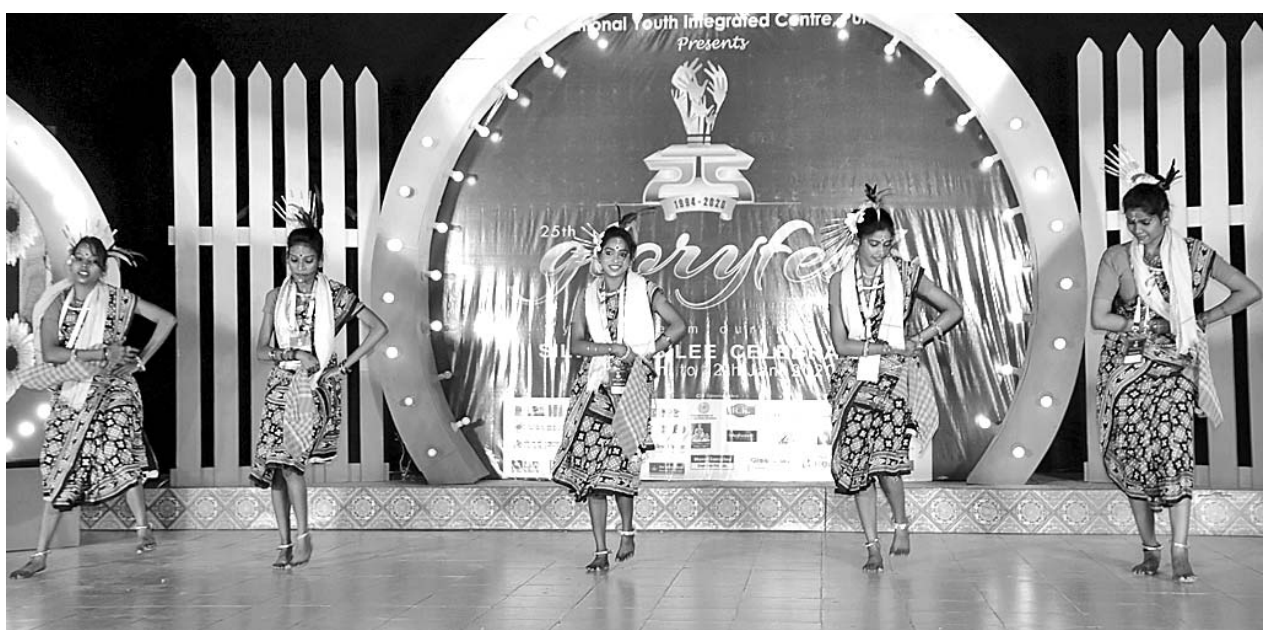
ଗ୍ଲୋରିଫେସ୍ଟ ରୌପ୍ୟ ଜୟନ୍ତୀ ଉତ୍ସବରେ ମଙ୍ଗଳବାର ବିତାମ ଦିବସରେ ପୌରସଦନ ମଞ୍ଚରେ କଳାକାରମାନେ ନୃତ୍ୟ ପରିବେଷଣ କରୁଛନ୍ତି।