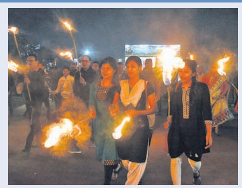
ବନ୍ଦକୁ ସଫଳ କରିବା ପାଇଁ ନିବେଦନ କରି ସିଆଇଟିୟୁ ପକ୍ଷରୁ ଭୁବନେଶ୍ୱରରେ ଆୟୋଜିତ ମଶାଳ ଗୋଷାଯାତ୍ରା।