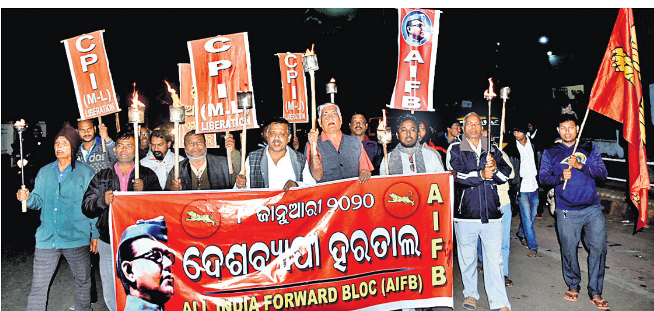
ଭାରତ ବନ୍ଦକୁ ସମର୍ଥନ କରିବା ପାଇଁ ଅଲ୍ ଭିଡିଆ ଫରୱାଡ୍ ବ୍ଲକ୍ ପକ୍ଷରୁ ମଙ୍ଗଳବାର ଭୁବନେଶ୍ୱର ଏକି ଛକକୁ ବାହାରିଥିବା ମଣ୍ଡାଳ ଶୋଭାଯାତ୍ରା।

ଆଜି କ'ଣ କେଉଁଠି ପ୍ରସ୍ତରେ କୌଣସି କାର୍ଯ୍ୟକୁଳ୍ମ ନାହିଁ। କେବଳ ଦେଖିବାକୁ ଚାହୁଁଥିଲେ ସମ୍ପୂର୍ଣ୍ଣ ବିରକ୍ଷଣୀ ସହ ନିକଟତ୍ର ପ୍ରତିନିଧି କିମ୍ବା ଧରିତ୍ରୀ ପୁସ୍ତକ କାର୍ଯ୍ୟାଳୟ ସହ ଯୋଗାଯୋଗ କରନ୍ତୁ।