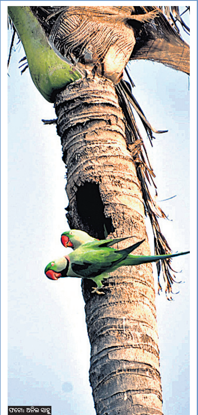
ପୂରୀ ଗୋପାଳାପୁର ଗ୍ରାମର ଏକ ନଡ଼ିଆ ଗଛରେ ଦୁଇଟି ଶୁଆ ବସା ବାନ୍ଧୁଛନ୍ତି।