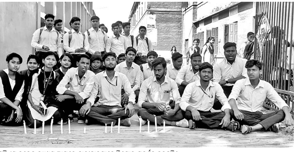
ଏସ୍‌ସିଏସ୍ କଲେଜ କ୍ୟାମ୍ପସ ଆଗରେ ଛାତ୍ରୀଛାତ୍ରମାନେ ବିଶୋଭ ପ୍ରଦର୍ଶନ କରୁଛନ୍ତି।

ପ୍ରଦର୍ଶନରେ ଛାତ୍ରୀଛାତ୍ରମାନେ ନୃତ୍ୟ ପରିବେଷଣ କଲେ। ପ୍ରଦର୍ଶନରେ ଛାତ୍ରୀଛାତ୍ରମାନେ ନୃତ୍ୟ ପରିବେଷଣ କଲେ। ପ୍ରଦର୍ଶନରେ ଛାତ୍ରୀଛାତ୍ରମାନେ ନୃତ୍ୟ ପରିବେଷଣ କଲେ।