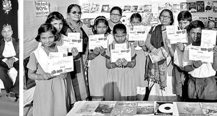
ପଠନ ବୁକ୍ସରେ ପୁରସ୍କୃତ ଛାତ୍ରୀଛାତ୍ରମାନେ।

ଶ୍ରୀକ୍ଷେତ୍ର ପୁସ୍ତକ ମେଳାରେ ଜମୁଛି ଭିଡ଼। ପଠନ ବୁକ୍ସରେ ପୁରସ୍କୃତ ଛାତ୍ରୀଛାତ୍ରମାନେ। ପଠନ ବୁକ୍ସରେ ପୁରସ୍କୃତ ଛାତ୍ରୀଛାତ୍ରମାନେ।