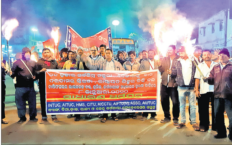
ଭାରତ ବନ୍ଦ ତାକରାକୁ ସମର୍ଥନ ଜଣାଇ ଟ୍ରେଡ୍ ୟୁନିୟନ ପକ୍ଷରୁ ପୂରୀ ସହରରେ ମଙ୍ଗଳବାର ଆନ୍ଦୋଳିତ ମଣ୍ଡାଳ ଶୋଭାଯାତ୍ରା।