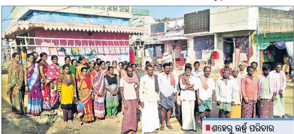
ଅନ୍ତରାଳିକା ଗ୍ରାମର ମହିଳା ଓ ପୁରୁଷମାନେ।

ପ୍ରାୟ ୨୦୦ ବର୍ଷ ତଳର ଗାଁ ଏଠାରେ ପୁରାତନ ସ୍କୁଲ, ଅଙ୍ଗନଓଡ଼ି କେନ୍ଦ୍ର, ପୋଖରୀ, ପକ୍ଷୀ ରାସ୍ତା, ପକ୍ଷୀ ଘର ଅଛି।