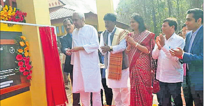
ଆଦାନୀ-କିସ୍ ଆବାସିକ ବିଦ୍ୟାଳୟର ଉଦ୍‌ଘାଟନ କରାଯାଇଛି। ଆଦାନୀ-କିସ୍ ଆବାସିକ ବିଦ୍ୟାଳୟର ଉଦ୍‌ଘାଟନ କରାଯାଇଛି।

ଆଦାନୀ-କିସ୍ ଆବାସିକ ବିଦ୍ୟାଳୟର ଉଦ୍‌ଘାଟନ କରାଯାଇଛି। ଆଦାନୀ-କିସ୍ ଆବାସିକ ବିଦ୍ୟାଳୟର ଉଦ୍‌ଘାଟନ କରାଯାଇଛି। ଆଦାନୀ-କିସ୍ ଆବାସିକ ବିଦ୍ୟାଳୟର ଉଦ୍‌ଘାଟନ କରାଯାଇଛି।