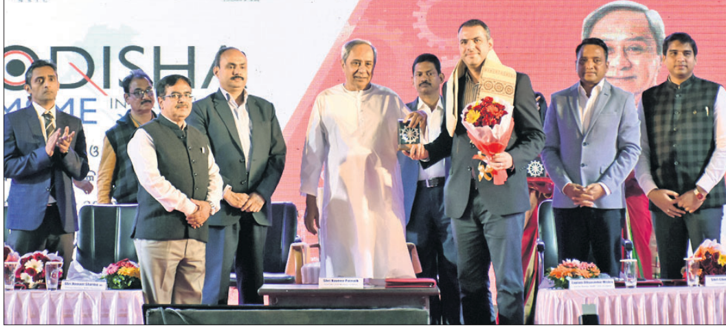
କାର୍ଯ୍ୟକ୍ରମ ଅବସରରେ ଜଣେ ବିଦେଶୀ ପ୍ରତିନିଧିଙ୍କୁ ମୁଖ୍ୟମନ୍ତ୍ରୀ ନବୀନ ପଟ୍ଟନାୟକ ସମର୍ଥନ କରୁଛନ୍ତି।

ବହୁ ପ୍ରାଚୀନ ସମୟରୁ ଓଡ଼ିଶା ଉଦ୍ୟୋଗ ବିକାଶକୁ ପ୍ରାଥମିକତା ଦେଇଆସିଛି। ପୂର୍ବ କାଳର ଏହି ଐତିହ୍ୟ ଏବେ କଳିଙ୍ଗ ଏବଂ ଉତ୍କଳ ବ୍ରାହ୍ମଣ ନାମରେ ପରିଚିତ। ଓଡ଼ିଆମାନେ ସେମାନଙ୍କ ଉଦ୍ୟମୀ ଗୁଣ ପାଇଁ ବୟନ, ଖାଦ୍ୟ ପ୍ରକ୍ରିୟାକରଣ, ସ୍ୱଚ୍ଛତା ପ୍ରଭୃତି ଏବଂ ହସ୍ତଶିଳ୍ପ କ୍ଷେତ୍ରରେ ନିଜର ସ୍ୱତନ୍ତ୍ରତା ବଜାୟ ରଖିଛନ୍ତି। ରାଜ୍ୟ ଏହାର ପ୍ରାକୃତିକ ସମ୍ପଦ ସହ ଗତ କିଛି ବର୍ଷ ଧରି ଶିଳ୍ପ କ୍ଷେତ୍ରରେ ବୃତ୍ତ ଅଭିବୃଦ୍ଧି ହାସଲ କରି ପାରିଛି। ଏହାକୁ ଅଗ୍ରାଧିକାର ଦେଇ ରାଜ୍ୟରେ ଶିଳ୍ପ ପ୍ରତିଷ୍ଠା ପାଇଁ ଉପଯୁକ୍ତ ପରିବେଶ, ଭିଜିଟିଭି ଏବଂ ଶିଳ୍ପ ନୀତି ଭଳି ବିଭିନ୍ନ ପୁରୁଧା ପ୍ରୟୋଗ ସରକାର ଯୋଗାଇ ଦେଉଛନ୍ତି ବୋଲି ସ୍ଥାନୀୟ ପ୍ରଦର୍ଶନୀ ପରିଷଦର ସଭାପତି ଆରମ୍ଭ ହୋଇଥିବା ଏମ୍‌ଏସ୍‌ଏମ୍‌ଲ ଟ୍ରେଡ୍ ଫେୟାରର ପ୍ରତିଷ୍ଠାପତ୍ର ଦେବା ଭବିଷ୍ୟତ ନୂଆ ଆହ୍ୱାନକୁ ଯୁବ ଉଦ୍ୟୋଗୀଙ୍କୁ ଆକର୍ଷିତ କରିବା ଲାଗି ନୂଆ ପ୍ରୟୋଗ ସୃଷ୍ଟି କରିବ। ନୂଆ ଭବିଷ୍ୟତ ନୂଆ ଆହ୍ୱାନକୁ ଯୁବ ଉଦ୍ୟୋଗୀଙ୍କୁ ଆକର୍ଷିତ କରିବା ଲାଗି ନୂଆ ପ୍ରୟୋଗ ସୃଷ୍ଟି କରିବ। ନୂଆ ଭବିଷ୍ୟତ ନୂଆ ଆହ୍ୱାନକୁ ଯୁବ ଉଦ୍ୟୋଗୀଙ୍କୁ ଆକର୍ଷିତ କରିବା ଲାଗି ନୂଆ ପ୍ରୟୋଗ ସୃଷ୍ଟି କରିବ।