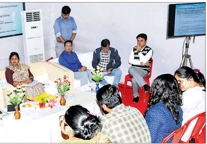
କର୍ମଶାଳାରେ ଆଇଆର୍‌ସିଟିସି ଏବଂ ଓରମାସ୍ ଅଧିକାରୀଙ୍କ ସହ ଶିଳ୍ପୀ ଓ କାରିଗରମାନେ।

ଭୁବନେଶ୍ୱର, ୮୧(ବୁଧବୋ): ରାଉଥା, ଚାରକସିଉ ଆରମ୍ଭ କରି ତରଫ, ମାଣିଆବନ୍ଧ ପର୍ଯ୍ୟନ୍ତ। ଏଣିକି ସବୁକିଛି ମିଳିବ ଆଇଆର୍‌ସିଟିସି ଷ୍ଟେସନାଲରେ। ଓଡ଼ିଶା ମଧ୍ୟଦେଶ ଟ୍ରେନ୍‌ରେ ଯାତ୍ରା କରୁଥିବା ଲୋକ ଓଡ଼ିଶାର ହସ୍ତଶିଳ୍ପ, ହସ୍ତତନ୍ତ ସହ ପାରମ୍ପରିକ ଓଡ଼ିଆ ଖାଦ୍ୟର ମଜା ନେଇପାରିବେ।