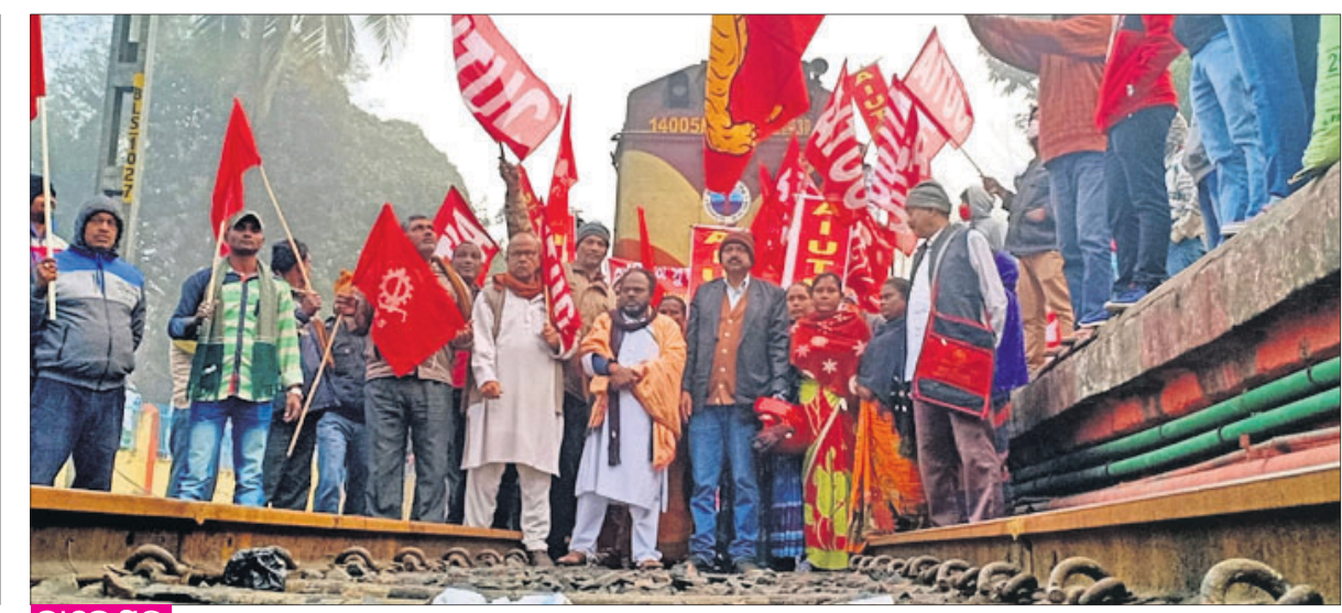
କେନ୍ଦୁଝର ବଡ଼ବିଲ ଷ୍ଟେସନରେ ଆନ୍ଦୋଳନକାରୀମାନେ ବଡ଼ବିଲ-ପୁରା ଇଣ୍ଟରସିଟି ଏକ୍ସପ୍ରେସକୁ ଅଟକାଇଛନ୍ତି ।