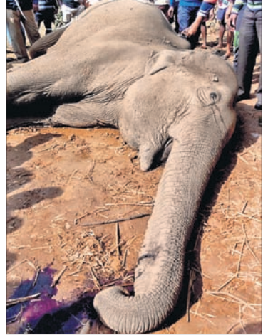
ବିଶ୍ୱା ବନବିଭାଗ ପକ୍ଷରୁ କୁଦାହୁଡ଼ାଙ୍ଗ ଜଙ୍ଗଲରେ ମାଈହାତୀ ମୃତ।

କୁଦାହୁଡ଼ାଙ୍ଗ ଜଙ୍ଗଲରେ ମାଈହାତୀ ମୃତ। ୩ ଦିନରେ ଦୁଇ ହାତୀଙ୍କ ଜୀବନ ଗଲା। କୁଦାହୁଡ଼ାଙ୍ଗ ଜଙ୍ଗଲରେ ମାଈହାତୀ ମୃତ।