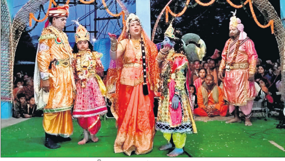
ଗୋପପୁରର ମଥୁରାକୁ ଶ୍ରୀକୃଷ୍ଣ, ବଳରାମଙ୍କୁ ବିଦାୟ ଦେବେ ଦୃଶ୍ୟ ।

ମଥୁରାରେ କୃଷ୍ଣ, ବଳରାମ। ମଥୁରାରେ କୃଷ୍ଣ, ବଳରାମ। ମଥୁରାରେ କୃଷ୍ଣ, ବଳରାମ। ମଥୁରାରେ କୃଷ୍ଣ, ବଳରାମ।