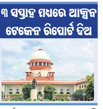
୩ ସପ୍ତାହ ମଧ୍ୟରେ ଆକ୍ରମ ଟେକେନ ରିପୋର୍ଟ ଦିଆ

କେନ୍ଦ୍ର ସରକାରଙ୍କୁ ସୁପ୍ରିମକୋର୍ଟଙ୍କ ନିର୍ଦ୍ଦେଶ ଖଣି ଅଞ୍ଚଳକୁ ଫୁଲ, ପନିପରିବା ଚାଷୋପଯୋଗୀ କର। କେନ୍ଦ୍ର ସରକାରଙ୍କୁ ସୁପ୍ରିମକୋର୍ଟଙ୍କ ନିର୍ଦ୍ଦେଶ ଖଣି ଅଞ୍ଚଳକୁ ଫୁଲ, ପନିପରିବା ଚାଷୋପଯୋଗୀ କର।