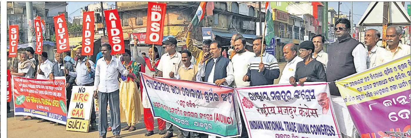
ଗଞ୍ଜାମ ଜିଲ୍ଲା ବିନାପହଣ୍ଡି ଗାନ୍ଧି ଛକଠାରେ ଆନ୍ଦୋଳନକାରୀମାନେ ରାସ୍ତା ଅବରୋଧ କରିଛନ୍ତି ।