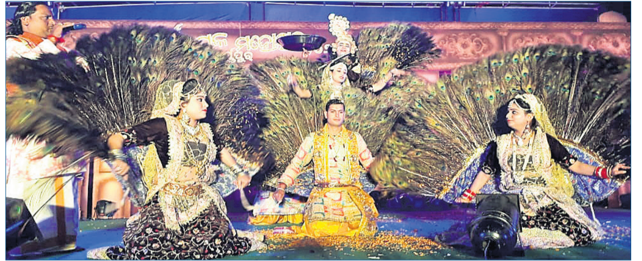
ଉତ୍ତରପ୍ରଦେଶ ମଥୁରାର କଳାକାରମାନେ ମୟୂରୀ ନୃତ୍ୟ ପ୍ରଦର୍ଶନ କରୁଛନ୍ତି ।