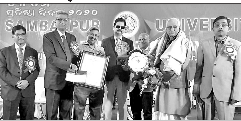
ସମ୍ବଲପୁର ବିଶ୍ୱବିଦ୍ୟାଳୟ ପରିସରରେ ପ୍ରତିଷ୍ଠା ଦିବସ ଅବସରରେ ଅତିଥି ଓ ସମ୍ମାନିତ କବି ।