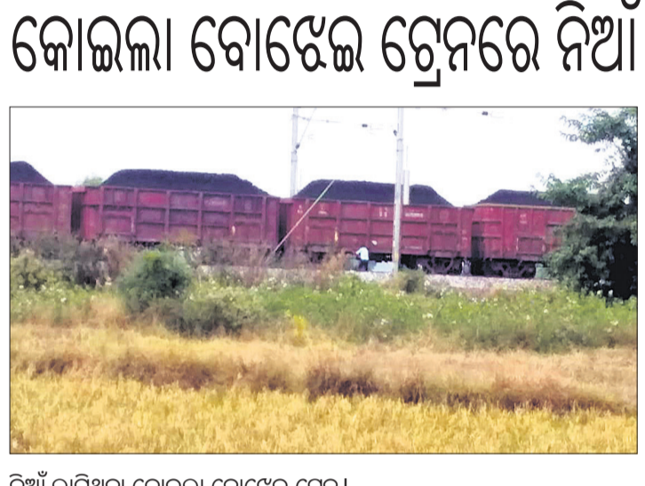
ନିଆଁ ଲାଗିଥିବା କୋଇଲା ବୋଝେଇ ଟ୍ରେନରେ ନିଆଁ