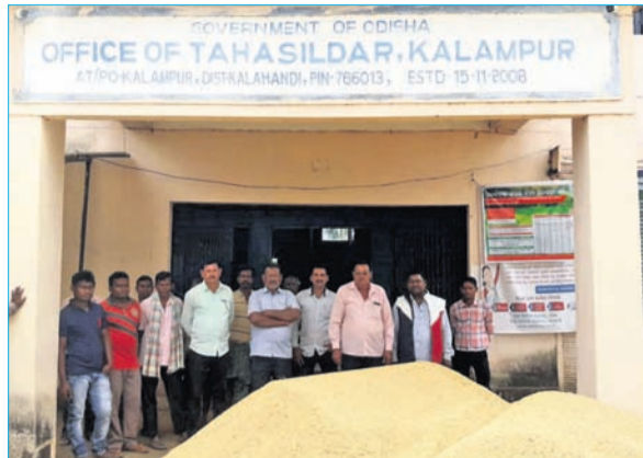
କଲମପୁର ତହସିଲ କାର୍ଯ୍ୟାଳୟ ସମ୍ମୁଖରେ ଚାଷୀମାନେ ଧାନ ଗଦାକରି ବିକ୍ରେୟ ପ୍ରଦର୍ଶନ କରୁଛନ୍ତି।

ତହସିଲ କାର୍ଯ୍ୟାଳୟ ସମ୍ମୁଖରେ ଧାନ ଗଦା କରି ଧାରଣା