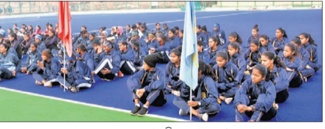
ଅନ୍ତର୍ଜାତୀୟ ମହିଳା ଫୁଟବଲ ଟ୍ରଫିରେ ଉଭୟ ଦଳର ଖେଳାଳିଙ୍କର ସମାବେଶ।

ଭୁବନେଶ୍ୱର, ୯।୧ (କ୍ରୀଡ଼ା ପ୍ରତିନିଧି)- ଭାରତୀୟ ଶିଶୁ ବିକାଶ କର୍ମାଳୟ ଦ୍ୱାରା ଆୟୋଜିତ ସର୍ବଭାରତୀୟ ଆନ୍ତଃ ବିଶ୍ୱବିଦ୍ୟାଳୟ ମହିଳା ଫୁଟବଲ ଟ୍ରଫି ଆରମ୍ଭ ହୋଇଛି।