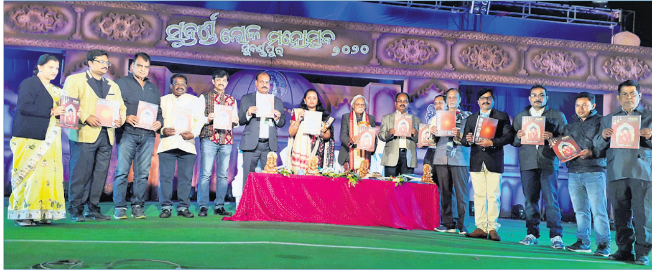
ସ୍ମରଣିକା ଶାନ୍ତସରକୁ ଅତିଥି ବୃନ୍ଦ ଉନ୍ମୋଚନ କରୁଛନ୍ତି । ପାର୍ଶ୍ୱରେ ସମ୍ପାଦକାୟ ମଣ୍ଡଳୀର ସଭ୍ୟସଭ୍ୟ ବୃନ୍ଦ ।