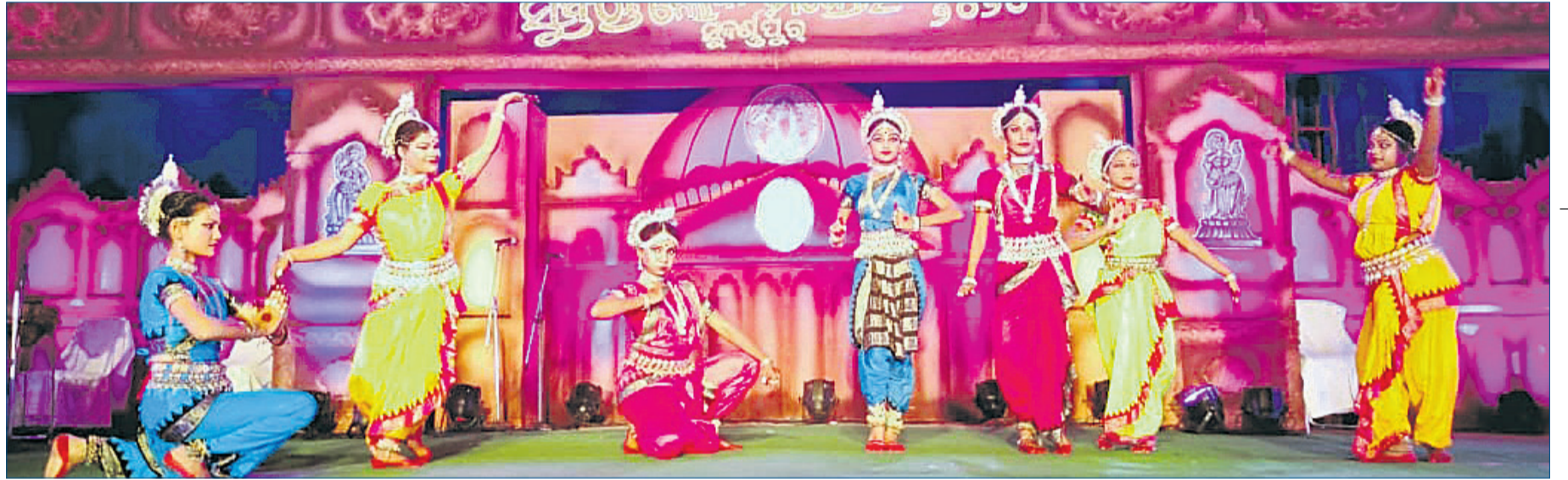
ସଙ୍ଗୀତ ମହାବିଦ୍ୟାଳୟ ସୁବର୍ଣ୍ଣପୁରର କଳାକାରମାନେ ଓଡ଼ିଶୀ ନୃତ୍ୟ ପରିବେଷଣ କରୁଛନ୍ତି ।