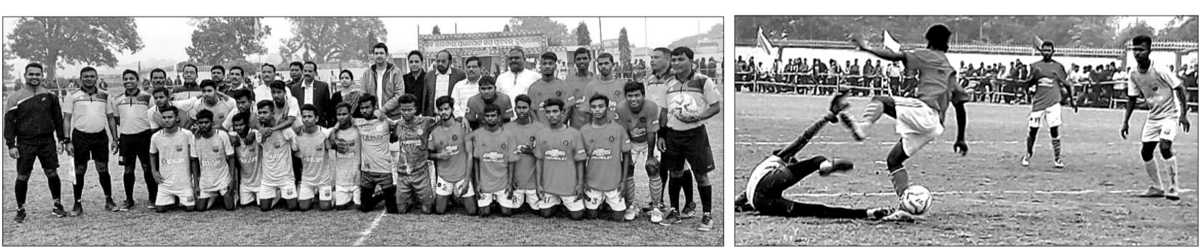
ଅତିଥି, ଡେଫିଣ୍ଡି ଓ କୁବର ସଦସ୍ୟମାନଙ୍କ ସହ ଖେଳାଳି (ବାମ) । ପ୍ରଧାନପାଟ୍ କପ୍ ଫୁଟବଲ ଚୂନାମେଣ୍ଟର ଏକ ରୋମାଞ୍ଚକର ମୁହୂର୍ତ୍ତ ।

ପ୍ରଧାନପାଟ୍ ଫୁଟବଲ କ୍ଳବ ଆନୁକୁଲ୍ୟରେ ଗୁଣାୟ ଉଦ୍ଘାଟନା ସ୍ମୃତିମନ୍ଦିର ଗତ ସୋମବାର ଠାରୁ ଆରମ୍ଭ ହୋଇଥିବା ସର୍ବଭାରତୀୟ ପ୍ରଧାନପାଟ୍ କପ୍ ଫୁଟବଲ ଚୂନାମେଣ୍ଟ ପୂର୍ଣ୍ଣ 'ବି' ପ୍ରଥମ ମ୍ୟାଚରେ ଗୁରୁବାର ଦେବଗଡ଼ ଫୁଟବଲ କ୍ଳବକୁ ୧-୦ ଗୋଲରେ ପରସ୍ତ କରି କୋଲକାତାର ସୁଗୁଳି ଫୁଟବଲ ଏକାଡେମୀ ବିଜୟୀ ହୋଇଛି । ମ୍ୟାଚରୁ ରେଫରୀ ଭାବେ ଅଶ୍ୱିନୀ କୁମାର ବେରିନ୍ଦା, ଅରୁଣ