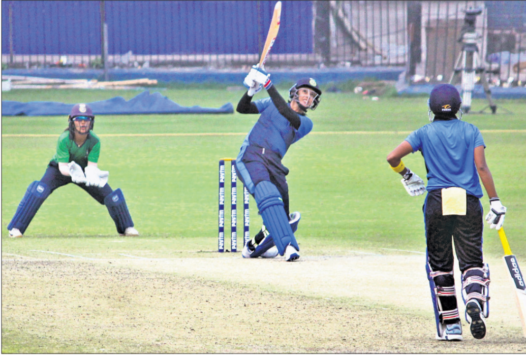
ଭାରତୀୟ କ୍ରିକେଟ ସଂଘର ଦ୍ୱିତୀୟ ସିନିୟର ମହିଳା ଟି୨୦ ଫ୍ୟାଲୋଟ୍ସର ଟ୍ରଫିରେ ଇଣ୍ଡିଆ-ବି ଓ ଇଣ୍ଡିଆ-ସି ଦଳ ଫାଇନାଲରେ ପ୍ରବେଶ କରିଛନ୍ତି।