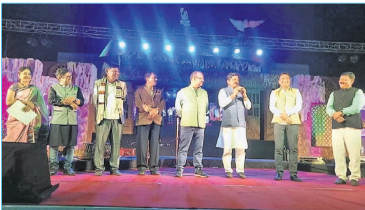
ଉଦ୍‌ଯାପନା ସମାରୋହରେ ଯୋଗଦେଇଥିବା ଅତିଥିବୃନ୍ଦ (ବାମ)। ସାଂସ୍କୃତିକ କାର୍ଯ୍ୟକ୍ରମ।