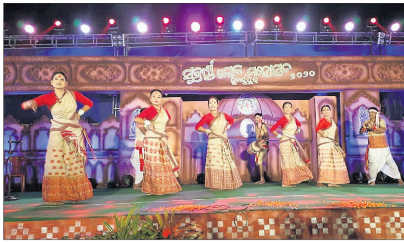
ଆସାମର କଳାକାରଙ୍କ ଦ୍ଵାରା ନୃତ୍ୟ ପରିବେଷଣ।

ସୁବର୍ଣ୍ଣପୁର ହେଉଛି କଳା, ସାହିତ୍ୟ ଓ ସଂସ୍କୃତିର ପ୍ରାଣକେନ୍ଦ୍ର। ଏକ ପ୍ରାଚୀନ ଗୌରବୋଜ୍ଞ ସଭ୍ୟତା, ସଂସ୍କୃତିର ବାହକ। ଆଜି ବି ତାର ସ୍ଵାକ୍ଷର ରହିଛି ବିନିକା ପାପକ୍ଷୟ ଘାଟ ନିକଟବର୍ତ୍ତୀ ତାରାପୁରଗଡ, ଚନ୍ଦଲିପାଟଣା ପୂଜାଠୁକୁରିର ପ୍ରସିଦ୍ଧ ଶିଳାଚିତ୍ର, ଯଉଁରାଭଉଁରା ନିକଟବର୍ତ୍ତୀ ଗୁମ୍ଫାରେ ଦୃଷ୍ଟିଗୋଚର ପ୍ରାଚୀନ ଶିଳାଖଣ୍ଡ ମଧ୍ୟରେ। ଏଠାରେ ଲୋକ ମହୋତ୍ସବ ପାଇଁ ଯାଏ ଲୋକକଳା, ସାହିତ୍ୟ ଓ ସଂସ୍କୃତିର ମିଳନ କ୍ଷେତ୍ର।