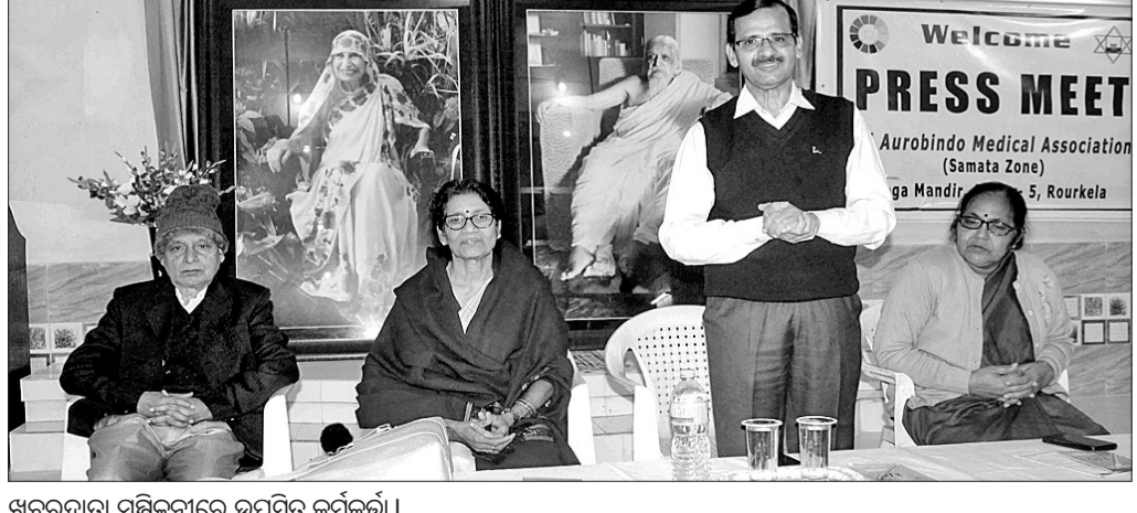
ଖବରଦାତା ସମ୍ମିଳନୀରେ ଉପସ୍ଥିତ କର୍ମକର୍ମୀ।

ରାଉରକେଲା ଅଫିସ୍, ୯।୧ ଆସନ୍ତା ୧୧ରୁ ଦୁଇ ଦିନିଆ ସପ୍ତମ ମଣ୍ଡଳ ସ୍ତରୀୟ ସ୍ୱାସ୍ଥ୍ୟ ସମ୍ମିଳନୀ ସେକ୍ଟର- ୫ ଶ୍ରୀ ଅରବିନ୍ଦ ଯୋଗ ମନ୍ଦିର ପରିସରରେ ଆରମ୍ଭ ହେବ। ଏଥିରେ କର୍ମକର୍ତ୍ତା ଓ ସଂସ୍କୃତ ଶ୍ରୀକ୍ଷେତ୍ର ସଚେତନତା କର୍ମଶାଳାରେ ବହୁ ଉପାୟମାନ ଡାକ୍ତର ଓ ସାମାଜିକ କାର୍ଯ୍ୟକର୍ତ୍ତା ଭାଗ ନେଇ ସମ୍ମୋଧିତ କରିବେ ବୋଲି ଖବରଦାତା