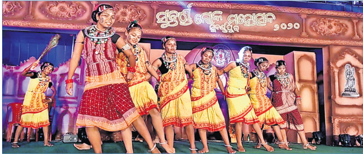
ଗଜପତି ବନ୍ଦେ ମାତରମ୍ ତ୍ୟାଗୁ ଗୁପ୍ତର ଆଦିବାସୀ ନୃତ୍ୟ ।