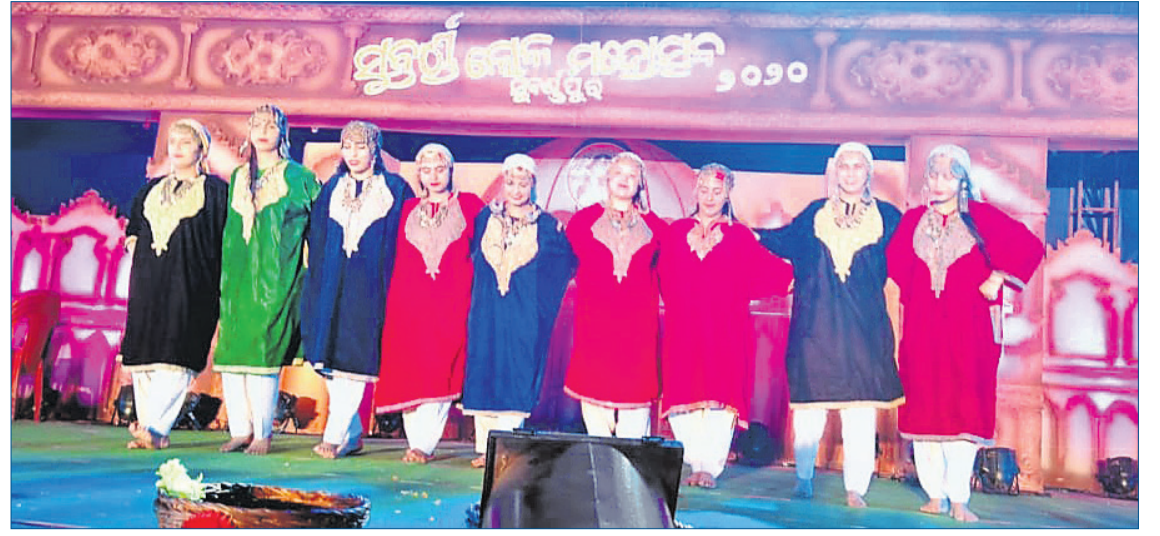
କଣ୍ଠୀରର ମୁଦତାମାନେ ପାରମ୍ପରିକ ନୃତ୍ୟ ପରିବେଷଣ କରୁଛନ୍ତି ।