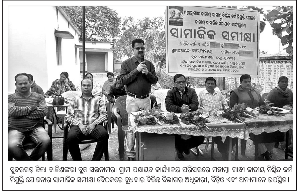
ସୁନ୍ଦରଗଡ଼ ଜିଲା ବାଲିଶଙ୍କରା ବ୍ଲକ ସରକାରୀ ଗ୍ରାମ ପଞ୍ଚାୟତ କାର୍ଯ୍ୟାଳୟ ପରିସରରେ ମହାତ୍ମା ଗାନ୍ଧୀ ଜାତୀୟ ନିଷ୍ଠିତ କର୍ମ ନିମ୍ନୁତ୍ତି ଯୋଜନାର ସାମାଜିକ ସମାକ୍ଷା ଯେତେବେଳେ ହୁଏବାର ବିଭିନ୍ନ ବିଭାଗର ଅଧିକାରୀ, ବିଡ଼ି ଏବଂ ଅନ୍ୟମାନେ ଉପସ୍ଥିତ।