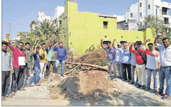
ଗଛ କଟାଯାଇଥିବା ସ୍ଥାନରେ ସବୁଜ ବାହିନୀ ଓ ବିଭିନ୍ନ ସଂଗଠନର ବିକ୍ଷେପ ପ୍ରଦର୍ଶନ ।

ସହ ଆଗାମୀ ଦିନରେ ବେପାରୀ ଉପରେ ବୃକ୍ଷକଟା ଗଲେ ସଂଗଠନ କାଟାଯିବ