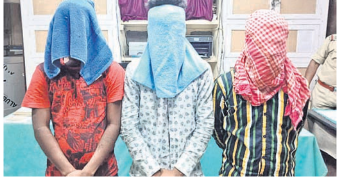
ଗିରଫ ୩ ଲୁଚେରା ।

ଅଧିକା, ୯୧୧(ଡି.ଏନ.ଏ.): ଅଧିକା ବନାଞ୍ଚଳର ଝାଡ଼ବନ୍ଧ ପଞ୍ଚାୟତ ଅନ୍ତର୍ଗତ ଆଦିବାସୀ ଅଧିକାରୀଙ୍କୁ ଶିକ୍ଷଣ ପ୍ରଦାନ କରାଯାଇଥିଲା ।