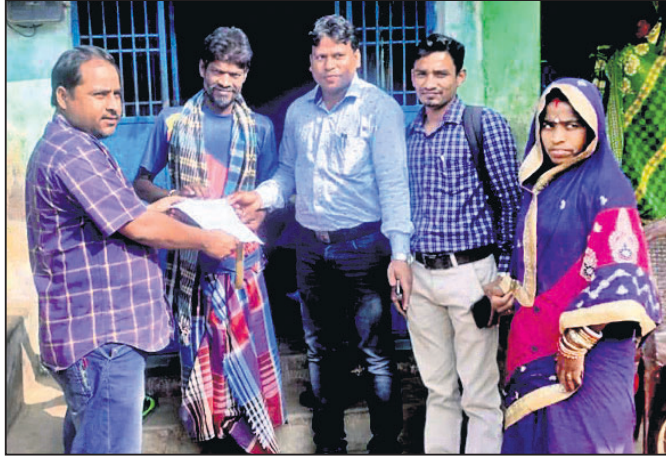
ଛତ୍ରପୁର ବିଡ଼ିଓ ଜଣେ ହିତାଧିକାରୀଙ୍କୁ କାର୍ଯ୍ୟାଦେଶ ଦେଉଛନ୍ତି।

ଗଞ୍ଜାମ ଜିଲ୍ଲା ବାହ୍ୟ ମଳମୁକ୍ତ ଯୋଜନା ହୋଇଥିଲେ ମଧ୍ୟ ଏବେ ଲୋକେ ଖୋଲାରେ ଶୈତ ହେଉଛନ୍ତି। ଏହାକୁ ସମ୍ପୂର୍ଣ୍ଣ ବନ୍ଦ କରିବା ପାଇଁ ବିଜିନ ପଦକ୍ଷେପ ନିଆଯାଉଛି। ପାଇଖାନା ନିର୍ମାଣ ପାଇଁ ନୂତନ ଭାବେ ପଞ୍ଜୀକୃତ ୧୯,୪୭୪ ହିତାଧିକାରୀଙ୍କୁ ରୁଧିରାଠାରୁ ସମସ୍ତ କ୍ଷେତ୍ରରେ କାର୍ଯ୍ୟାଦେଶ ପ୍ରଦାନ ଆରମ୍ଭ ହୋଇଛି। ସ୍ୱେଚ୍ଛାଳ ଗ୍ରାମଭିତରେ ଗୁରୁତ୍ୱ ଦେଇ ସମସ୍ତ ପଞ୍ଜୀକୃତ ହିତାଧିକାରୀଙ୍କୁ କାର୍ଯ୍ୟାଦେଶ ପ୍ରଦାନ ପାଇଁ ବିଡ଼ିଓମାନଙ୍କୁ ତିଆରିକରି ପିଡି ସିକାର୍ଯ୍ୟ ଶଙ୍କର ସ୍ୱାଇଁ ନିର୍ଦ୍ଦେଶ ଦେଇଛନ୍ତି। ମାର୍ଚ୍ଚ ୩୧ ସୁଦ୍ଧା କିଛି ସମସ୍ତ ପାଇଖାନା ନିର୍ମାଣ କାର୍ଯ୍ୟ ସାରିବ ତାହା ଉପରେ ଧ୍ୟାନ ଦେବାକୁ