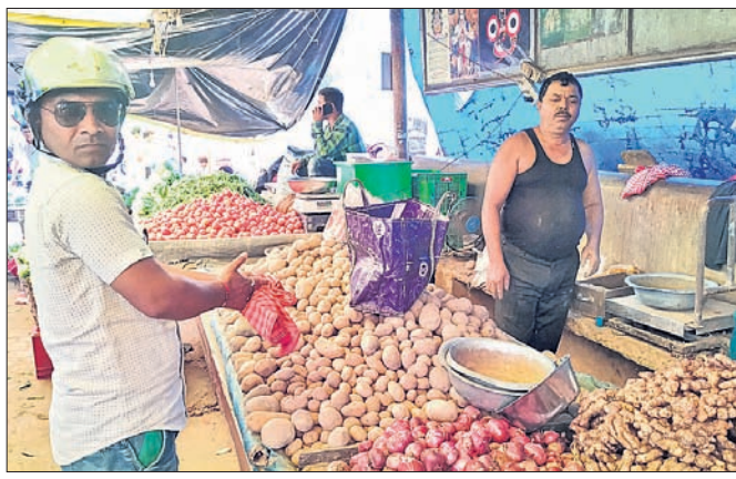
ବ୍ରହ୍ମପୁର ଅଫିସ, ୯୧୧

'ଆଳୁ' ଏକ ମୁଖ୍ୟ ପରିବା । କେହି ଏହାକୁ ରୋଷେଇ ଘରର ରନ୍ଧା ବୋଲି କୁହନ୍ତି । କିନ୍ତୁ ବର୍ତ୍ତମାନ ସମୟରେ ଏହାର ଦର ଶୁଣିଲେ ମାତ୍ର ଉଡ଼ିଶାବାସୀଙ୍କ ମୁଣ୍ଡବିନ୍ଧା ହେଉଛି ।