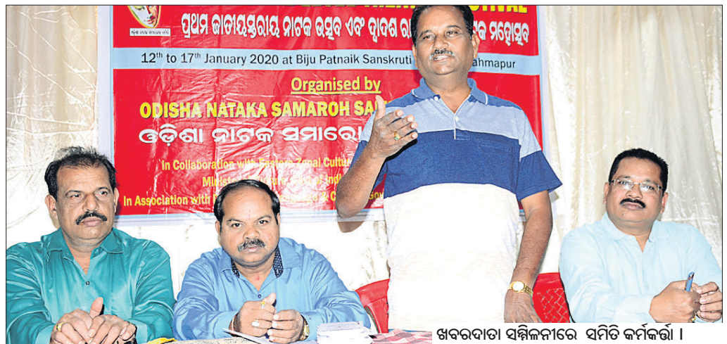
ଖବରଦାତା ସମ୍ମିଳନୀରେ ସମିତି କର୍ମକର୍ମୀ।

ଓଡ଼ିଶା ନାଟକ ସମାବେଶ ସମିତି ପକ୍ଷରୁ ପ୍ରଥମ ଜାତୀୟସ୍ତରୀୟ ନାଟକ ମହୋତ୍ସବ ଆୟତ୍ତ ହେବ।