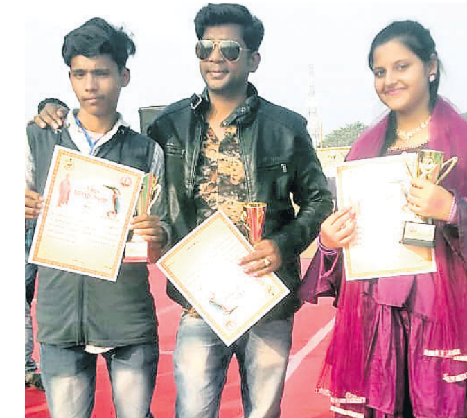
ଜାତୀୟସ୍ତରରେ ଭାଗନେବାକୁ ମନୋନୀତ ହୋଇଥିବା ୩ ପ୍ରତିଯୋଗୀ ।

ଛୋଟ ବେଳୁ ନୃତ୍ୟ ପ୍ରତି ଆଗ୍ରହ ତାଙ୍କୁ ପହଞ୍ଚାଇଛି ଜାତୀୟସ୍ତରରେ । ମାତ୍ର ୧୪ ବର୍ଷ ବୟସରେ ସେ ନିଜକୁ ଜାତୀୟସ୍ତରରେ ପ୍ରତିଯୋଗିତାରେ ଭାଗନେବାକୁ ଯୋଗ୍ୟ ବିବେଚିତ