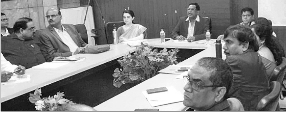
ସମୀକ୍ଷା ବୈଠକରେ ମନ୍ତ୍ରୀ ନବ କିଶୋର ଦାସ ଓ ବିଭାଗୀୟ ଅଧିକାରୀମାନେ ।

ସ୍ଵାସ୍ଥ୍ୟ ଓ ପରିବାର କଲ୍ୟାଣ ମନ୍ତ୍ରୀ ନବ କିଶୋର ଦାସଙ୍କ ଅଧ୍ୟକ୍ଷତାରେ ଭୁବନେଶ୍ଵର ଏକ ସମୀକ୍ଷା ବୈଠକ ଅନୁଷ୍ଠିତ ହୋଇଥିଲା ।