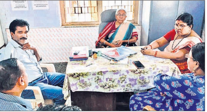
ରାଜ୍ୟ ଶିଶୁ ମଙ୍ଗଳ କର୍ମିଣୀର ସଦସ୍ୟ ସଚିବ ଉତ୍କଳ ବାଳାଶ୍ରମରେ ଆଲୋଚନା କରୁଛନ୍ତି।

ସହ ଘଟଣାର ଖୋଜତା କରିଥିଲେ। ଅନ୍ତରାଳ ନିର୍ଦ୍ଦୋଷ ଭାବରେ ବାଳାଶ୍ରମର ପୁଅପରିଷେଷେ ସମ୍ପୂର୍ଣ୍ଣ ଉଦ୍ଧାରଣ ହୋଇଥିଲା।