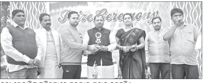
କୃତୀ ଖେଳାଳିଙ୍କୁ ଅଭିଭୂତାରେ ପୁରସ୍କାର ପ୍ରଦାନ କରୁଛନ୍ତି।