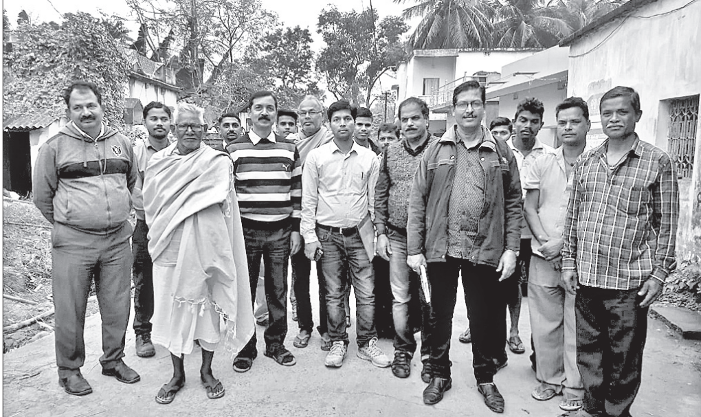
ଗ୍ରାମବାସୀଙ୍କ ସହ ଭାରତୀୟ ମୂଢିକା ଓ ଭୂମି ସର୍ବେକ୍ଷଣ ସଂସ୍ଥା ହାଲଦ୍ରାବାଦର ଅଧିକାରୀ।