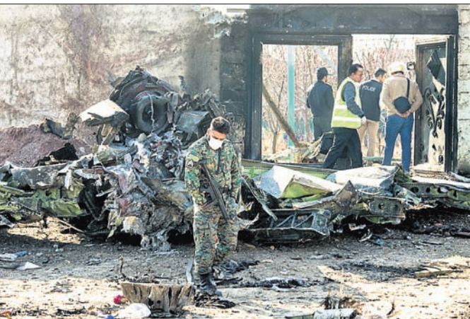
ଦୁର୍ଘଟଣାସ୍ଥଳରେ ବିକାଡ଼ି ହୋଇ ପଡ଼ିଛି ବୋଇଲ୍ ୭୩୭-୮୦୦ର ଭଗ୍ନାବଶେଷ।

ଭାରତ ରାଜଧାନୀ ଦେହରାଜ ନିକଟରେ ଯୁକ୍ତେନର ଯାତ୍ରୀବାହୀ ବିମାନ ଦୁର୍ଘଟଣାଗ୍ରସ୍ତ ହୋଇ ୧୭୬ ଜଣଙ୍କ ମୃତ୍ୟୁ ଘଟିବା ପରେ ଅନେକ ପ୍ରଶ୍ନବାଚୀ ସୃଷ୍ଟି ହୋଇଛି। କୌଣସି ମିଶାଇଲ ଆକ୍ରମଣରେ ଏହା ଖସି ପଡ଼ିଥିବା ଆଶଙ୍କା ପ୍ରକାଶ ପାଇଥିବାବେଳେ ବିମାନ ଦୁର୍ଘଟଣାର ପ୍ରକୃତ କାରଣ ଖୋଜିବା ପାଇଁ ତନାୟନା ଆରମ୍ଭ ହୋଇଛି। କାରଣ ଏହି ବିମାନ ଉଡ଼ାଣର କିଛି ସମୟ ପରେ ଦୁର୍ଘଟଣାଗ୍ରସ୍ତ ହୋଇଥିଲା। ଦୁର୍ଘଟଣା ପୂର୍ବରୁ ବିମାନଟି ଏୟାରପୋର୍ଟ ଆଡ଼କୁ ଫେରିଆସିଥିଲା ବୋଲି ଜରାଜନ ଅଧିକାରୀମାନେ କହିଛନ୍ତି। ବିମାନର ଦୁଇ ଡାକ୍ତା ରେକର୍ଡର (ଲ୍ୟାନ୍‌ବୁକ୍) ମିଳିଛି। କିନ୍ତୁ ତାହା ନଷ୍ଟ ହୋଇଯାଇଥିବା କୁହାଯାଉଛି। ଜରାଜନରେ ଥିବା ଆମେରିକୀୟ ଦୁଇଟି ସେନାଘାଟି ଉପରେ ଭାରତ ମିଶାଇଲ