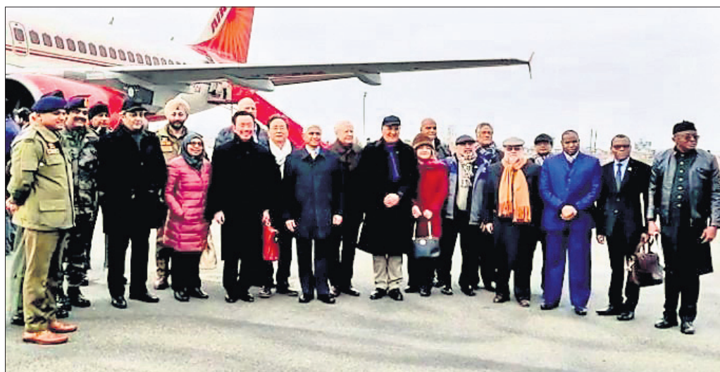
ଶ୍ରୀନଗର ବିମାନବନ୍ଦରରେ ବିଦେଶୀ ପ୍ରତିନିଧି।