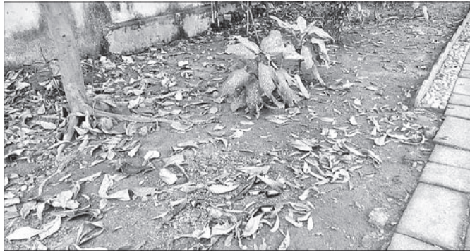
ପାର୍କରେ ପଡ଼ିଥିବା ସିରପ୍ ବୋତଲ

ଅନୁଗୋଳ ସହରରେ ସିରପ୍ ନିଶା କାରବାର ବେଶ୍ ବଢ଼ିଯାଇଛି। ସହରରେ ଥିବା ବିଭିନ୍ନ ପାର୍କରେ ଦୈନିକ ପୁଲା ପୁଲା ସିରପ୍ ବୋତଲ ପଡ଼ୁଥିବା ଦେଖିବାକୁ ମିଳୁଛି। ଶସ୍ତ୍ରା ହେଉଥିବାବୁ ବିଶେଷକରି ମୁକ୍ତ ପିଢ଼ି ଏହି ନିଶା କାଳରେ ପଡ଼ୁଥିବା ବର୍ତ୍ତା ହେଉଛି। କିନ୍ତୁ ଏ ନେଇ ଅନୁଗୋଳ ପୋଲିସ୍ ନିକଟରେ କୌଣସି ସୂଚନା ନ ଥିବାରୁ ପାର୍କକୁ ଯାଉଥିବା ବରିଷ୍ଠ ନାଗରିକମାନେ ଅଧିକାଂଶ ପ୍ରକାଶ କରୁଛନ୍ତି।