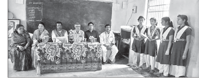
ଶିଶୁମନ୍ଦିର ଅତିରିକ୍ତ ଶ୍ରେଣୀ ଗୃହ ଉଦ୍ଘାଟନୀ କାର୍ଯ୍ୟକ୍ରମରେ ଏମ୍ପିଇ ସହ ଅନ୍ୟମାନେ।