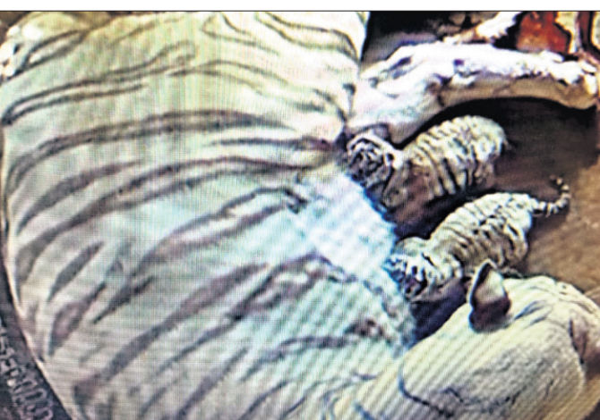
ବାରଙ୍ଗ, ୯।୧ (ବି.ଏନ୍.ଏ.)