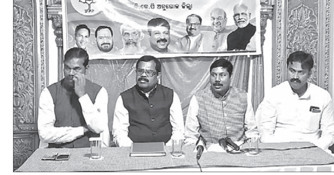
ଖବରଦାତା ସମ୍ମିଳନୀରେ ଭାଜପା ନେତାମାନେ।