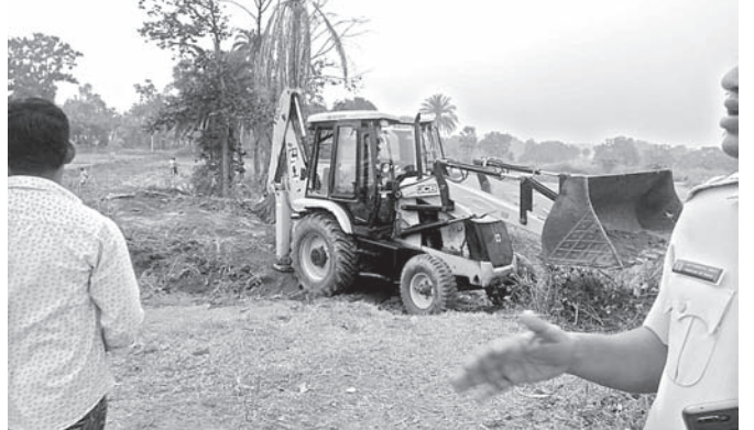
କେସିବି ଲଗାଇ ପ୍ରଶାସନ ଉଚ୍ଛେଦ କରୁଛି।

ଅନୁଗୋଳ ଜିଲ୍ଲା ଛେଡ଼ିପଦା ବ୍ଲକ୍ ପାତ୍ରପଡ଼ା ପଞ୍ଚାୟତ ବରମଳିହାସାହିର ଜନସାଧାରଣ ଯାତାୟାତ ପାଇଁ ଥିବା ରାସ୍ତାକୁ ଜବରଦଖଲ କରାଯାଇଥିବା ଅଭିଯୋଗ ହୋଇଥିଲା। ଗୁରୁବାର ଉଚ୍ଚ ସରକାରୀ ଜବରଦଖଲକୁ ଛେଡ଼ିପଦା ତହସିଲ ପକ୍ଷରୁ ଉଚ୍ଛେଦ କରାଯାଇଛି। ଘଟଣାରୁ ପ୍ରକାଶ, ବରମଳିହାସାହିର ଜନସାଧାରଣଙ୍କ ଦୈନିକ ଯାତାୟାତ ରାସ୍ତାକୁ ୬ ମାସ ହେବ କେତେକଣ ବ୍ୟକ୍ତି ଜବରଦଖଲ କରିଥିଲେ। ଏ ନେଇ ଶତାଧିକ ବସ୍ତି ବାସିନ୍ଦା ତହସିଲ