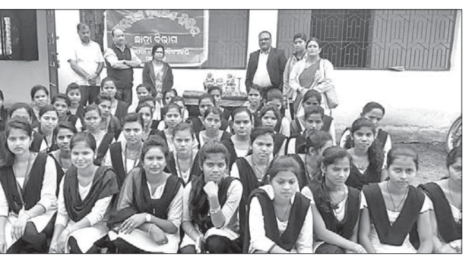
ପ୍ରତିଯୋଗିତାରେ ଭାଗ୍ୟଶାଳୀ ଛାତ୍ରୀମାନଙ୍କୁ ପ୍ରଶଂସା ଦେଉଛନ୍ତି।

ଆଠମାଲିକ ବୁକ୍ ଠାକୁରଗଡ଼ ମୁକ୍ତ ତିନି କଲେଜରେ ଛାତ୍ରଙ୍କୁ ଆତ୍ମରକ୍ଷା କୌଶଳ ଶିବିର ଗୁରୁବାର ଉଦ୍ଘାଟିତ ହୋଇଯାଇଛି। ଏଥିରେ ୫୦ରୁ ଊର୍ଦ୍ଧ୍ୱ ଛାତ୍ର ଆଂଶଗ୍ରହଣ କରିଥିଲେ।