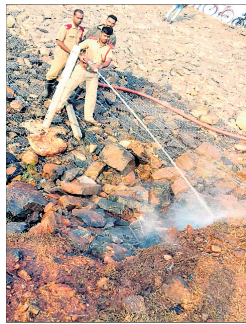
ଅଗ୍ନିଶମ ବାହିନୀ ନିଆଁ ଲିଭାଇଛନ୍ତି ।

କେନ୍ଦ୍ରାପଡ଼ା ଜିଲ୍ଲା ରାଜନଗର ବ୍ଲକ୍ ବଙ୍ଗୋପସାଗର ତଟବର୍ତ୍ତୀ ପେଣ୍ଟ ଗ୍ରାମ ନିକଟରେ ସମୁଦ୍ର କୁଆଁରକୁ ପ୍ରତିହତ କରିବା ପାଇଁ ନିର୍ମାଣ କରାଯାଇଥିବା ଜିଓ ସିକ୍ସଟିଜ୍ ଖାଲରେ ଗୁରୁବାର ମଧ୍ୟ ଧର ପାଇଁ ଅଗ୍ନିକାଣ୍ଡ ଘଟିଛି ।