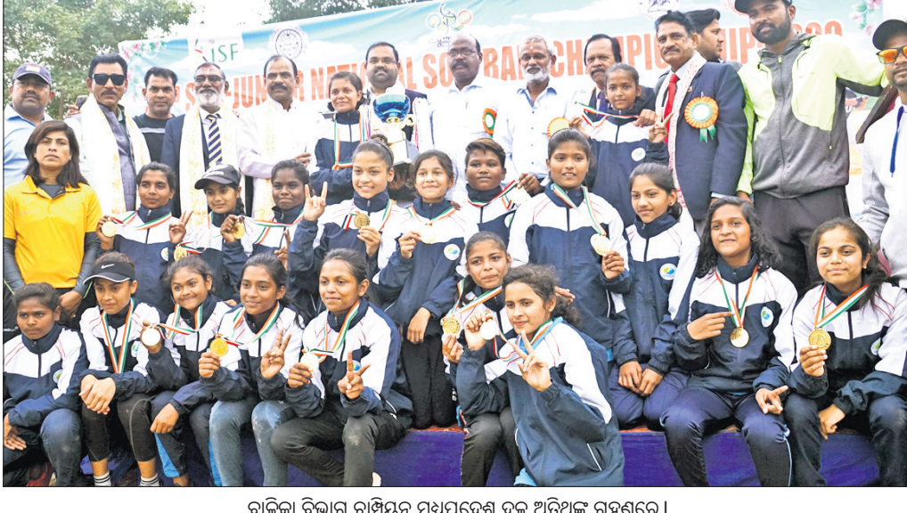
ବାଲିକା ବିଭାଗ ଚାମ୍ପିୟନ ମଧ୍ୟପ୍ରଦେଶ ଦଳ ଅତିଥିକ ରହଣରେ ।