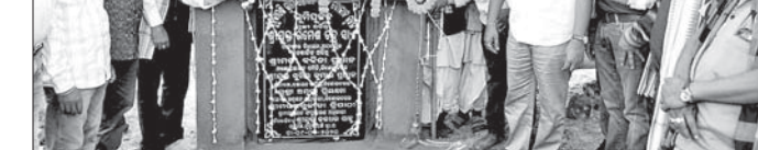
ନୂତନ ଦୋକାନ ଗୃହ ପାଇଁ ଭୂମିପୂଜନ ଉତ୍ସବରେ ବିଧାୟକଙ୍କ ସହ ଅନ୍ୟମାନେ।

କିଶୋରନଗର ବୁକ୍ ଠାକୁରପାଣି ପଞ୍ଚାୟତର ନୂତନ ରାସ୍ତା ନିର୍ମାଣ ପାଇଁ ଗୁରୁବାର ଭୂମିପୂଜା କରାଯାଇଛି। ପୂର୍ବ ବିଭାଗ ପକ୍ଷରୁ ୧ କୋଟି ୨୧ ଲକ୍ଷ ଟଙ୍କା ବ୍ୟୟରେ ଶିଖରପଡ଼ା ଶିଶୁ ମନ୍ଦିର ୨ କି.ମି. ରାସ୍ତା, ଆନନ୍ଦପୁଣ୍ଡାଠାରୁ ଜୁଣବଣିଆ ୩ କି.ମି. ରାସ୍ତା ୨ କୋଟି ଟଙ୍କା ବ୍ୟୟରେ ନିର୍ମାଣ ପାଇଁ ଭୂମିପୂଜା କରାଯାଇଛି।