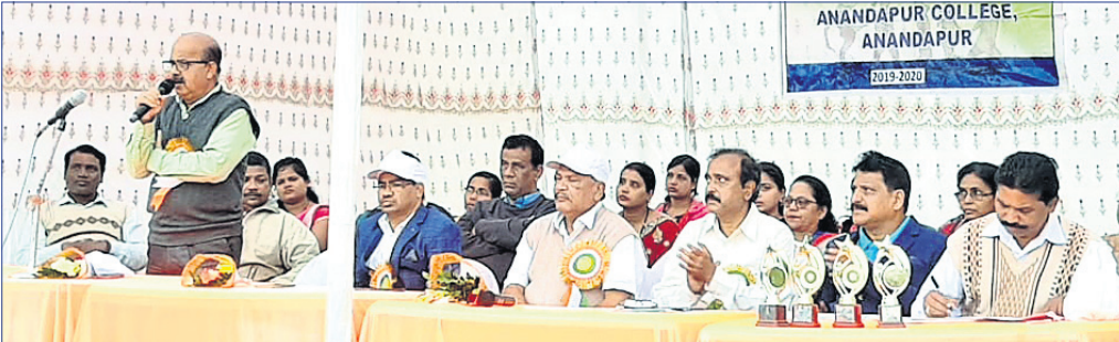
ବାର୍ଷିକ କ୍ରୀଡ଼ା ଉତ୍ସବରେ ଉପସ୍ଥିତ ଅତିଥି ଓ ଅନ୍ୟମାନେ।

ଆନନ୍ଦପୁର, ୯।୧(ସ.ପ୍ର.) ଦୁଇ ଦିନ ଧରି ଅନୁଷ୍ଠିତ ହେଉଥିବା ଆନନ୍ଦପୁର ମହାବିଦ୍ୟାଳୟ ବାର୍ଷିକ କ୍ରୀଡ଼ା ଗୁରୁବାର ଅପରାହ୍ନରେ ଉଦଘାଟିତ ହୋଇଯାଇଛି।