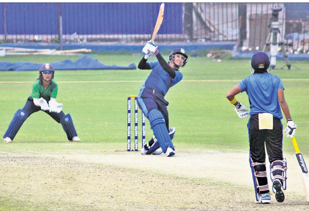
ଭାରତୀୟ ସ୍ୱାଧିନତାରେ ଚାଲିଥିବା ସିନିୟର ମହିଳା ଟି୨୦ ଚ୍ୟାଲେଞ୍ଜର ଟ୍ରଫିରେ ଇଣ୍ଡିଆ-ବି ଓ ଇଣ୍ଡିଆ-ସି ଦଳ ପାଇନାଲରେ ପ୍ରବେଶ କରିଛନ୍ତି।