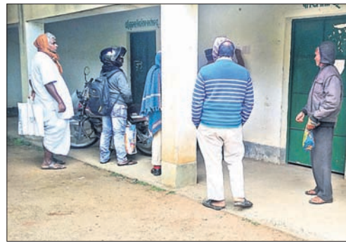
ଲକ୍ଷ୍ମୀବିଳୟରେ ଚାଷୀଙ୍କ ଭିଡ଼।

ଉତ୍ତେଜିତ ଦେଖାଦେଇଥିଲା। ବିଳୟରେ କର୍ମଚାରୀ ପହଞ୍ଚିବାକୁ ବିବାଦ ଦେଖାଦେଇଥିଲା। ୧୨୦୮ ଚାଷୀ ମଧ୍ୟରେ ୧୨୦ ଜଣ ଚାଷୀଙ୍କୁ ଟୋକନ ଦେବା ଆଦେଶ ହୋଇଛି। କିନ୍ତୁ ଲକ୍ଷ୍ମୀବିଳୟ ୧୦ ଜଣଙ୍କ ଆସିଥିବା କହିଥିବାରୁ ଅସନ୍ତୋଷ ଦେଖାଦେଇଛି। ବର୍ଷା ଆସିବାକୁ ଚାଷୀ ମାନେ ବହୁ ଅନୁରୋଧ କରିଥିଲେ। ପରେ ଟୋକନ ନ ପାଇ ଅନେକ ନିରାଶ ହୋଇ ଫେରିଥିଲେ। ପ୍ରଶାସନ ଚାଷୀ ମାନଙ୍କ ସୁବିଧା ପାଇଁ ବ୍ୟାପକ ପଦକ୍ଷେପ ନିଆଯାଉଥିବା ନେଇ ଦାବି କରୁଥିବା ବେଳେ ଏଭଳି ବହୁ ଲକ୍ଷ୍ମୀବିଳୟ ଅବ୍ୟସ୍ତା ଦେଖାଦେଉଥିବାରୁ ଚାଷୀ ଅସନ୍ତୋଷ ବୃଦ୍ଧି ହେଉଛି।