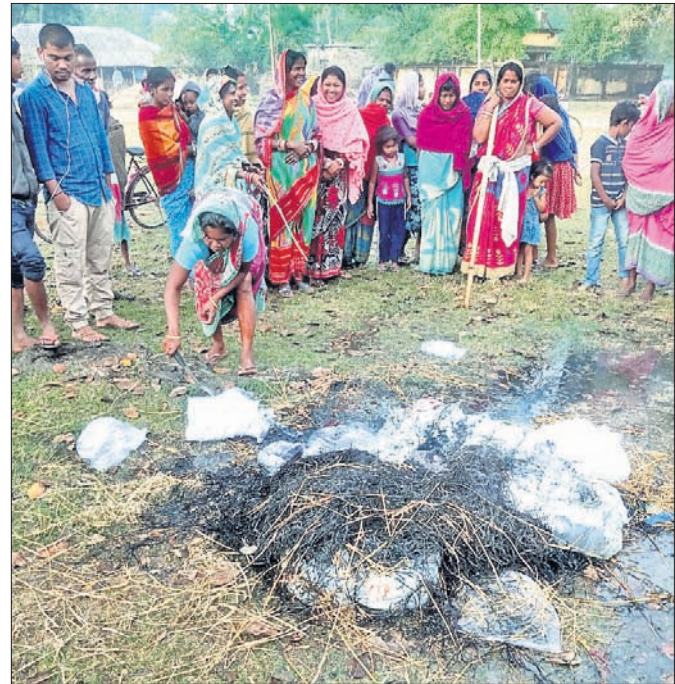
ମହିଳାମାନେ ଚୋରା ମଦକୁ ପୋଡ଼ୁଛନ୍ତି।