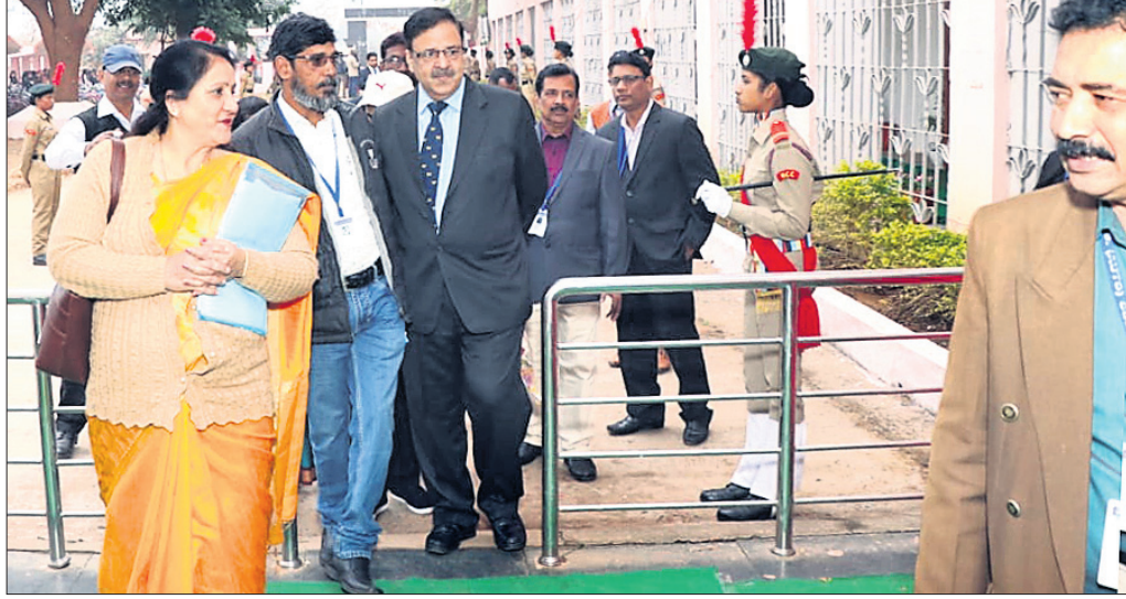
ୟୁଜିସି ପ୍ରତିନିଧି ଦଳ କଲେଜର ସ୍ଥିତି ଅନୁଧ୍ୟାନ କରୁଛନ୍ତି।

ବିଶ୍ୱବିଦ୍ୟାଳୟ ଅନୁଦାନ ଆୟୋଗ (ୟୁଜିସି)ର ଏକ ଉଚ୍ଚସ୍ତରୀୟ ପ୍ରତିନିଧି ଦଳ ୨ ଦିନିଆ ଗସ୍ତରେ ଆସିଧରଣୀଧର ସ୍ୱୟଂଶାସିତ ମହାବିଦ୍ୟାଳୟ ପରିଦର୍ଶନ କରିଛନ୍ତି।