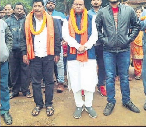
ଦେବତାଗୋଧା ଓଷାରେ ବିଧାନସଭା ଯୋଗଦେଇ ମାଝି ଓ ଅନ୍ୟମାନେ।

କେନ୍ଦୁଝର ସଦର ବ୍ଲକ୍ ଅନ୍ତର୍ଗତ ବରଦାପାଳ ପଞ୍ଚାୟତ ମହାନ ବିପ୍ଳାବ ଧରଣୀଧର ଉତ୍ସାହୀ ଲକ୍ଷ୍ମଣ ମାରିଚି ଗାଁ ଉପର କୁମୁଡ଼ିଗା ଗ୍ରାମରେ ଦେବତାଗୋଧା ଓଷା ଗୁରୁବାର ଅନୁଷ୍ଠିତ ହୋଇଯାଇଛି।