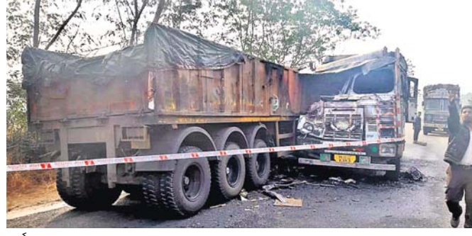
ଦୁର୍ଘଟଣାସ୍ଥଳରେ ଟ୍ରକ୍ ଧକ୍କା ହୋଇଛି

ରାଜଗଡ଼ାର ପିତାମହଲକ୍ଷ୍ମୀ ଦୁର୍ଗାମନ୍ଦିର ନିକଟରେ ଗୁରୁବାର ଭୋରରେ ଟ୍ୟାକ୍ସର ଓ ଟ୍ରକ୍ ଧକ୍କା ହୋଇଛି । ଟ୍ରକ୍ ଉପରେ ରାସ୍ତା ଉପରେ ଟ୍ୟାକ୍ସରଟି ଜଳିଯାଇଛି । ଏଥିରେ କେହି ମୃତ୍ୟୁ ହୋଇନାହିଁ । ଖବରପାଇଁ ଅଗ୍ନିଶମ କର୍ମଚାରୀ ଘଟଣାସ୍ଥଳରେ ପହଞ୍ଚି ନିଆଁକୁ ଆୟତ୍ତ କରିଥିଲେ । ଦୁର୍ଘଟଣା ପରେ ଘଟଣାସ୍ଥଳରେ ୪ ଘଣ୍ଟା ଧରି ଟ୍ରାଫିକ୍ ସମସ୍ୟା ସୃଷ୍ଟି ହୋଇଥିଲା । ଟ୍ୟାକ୍ସର (ନମ୍ବର ପି ବି ୦୨ ସି ସି ୧୩ ୧୩) ଟି ପେରକସାଇଡ଼ ନେଇ