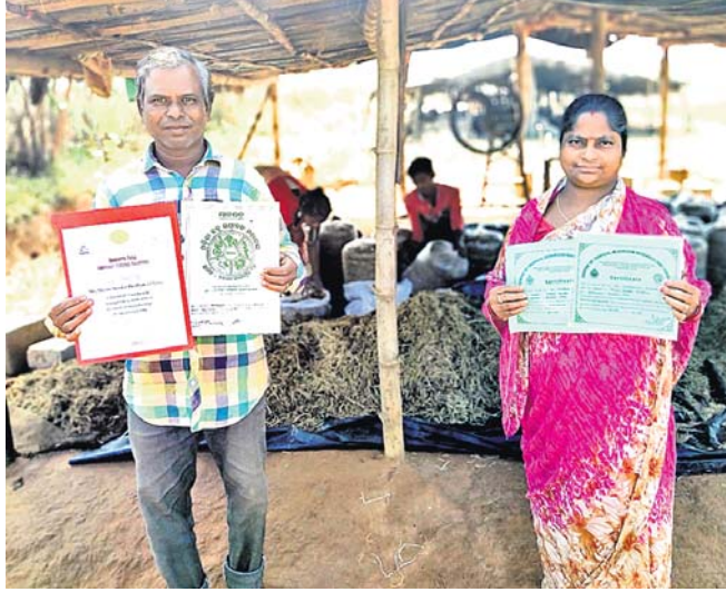
ଛତୁ ଚାଷର ଉତ୍ସାହୀତ କେନ୍ଦ୍ରରେ ସମ୍ବଳାୟକ ଶ୍ୟାମ ।

କଳ୍ପଚକ୍ର ମହାଜିର ପ୍ରତିକୃତି ଚାଷର ସମସ୍ତ ଅଂଶକୁ ଆକର୍ଷଣ କରିବା ପାଇଁ ଉତ୍ସାହୀତ କରୁଛି । ଏହାପାଇଁ କଳ୍ପଚକ୍ର ମହାଜିର ସମସ୍ତ ସଭ୍ୟମାନଙ୍କୁ ଛତୁ ଚାଷ ପାଇଁ ଆକର୍ଷଣ କରିବା ପାଇଁ ଉତ୍ସାହୀତ କରୁଛି ।