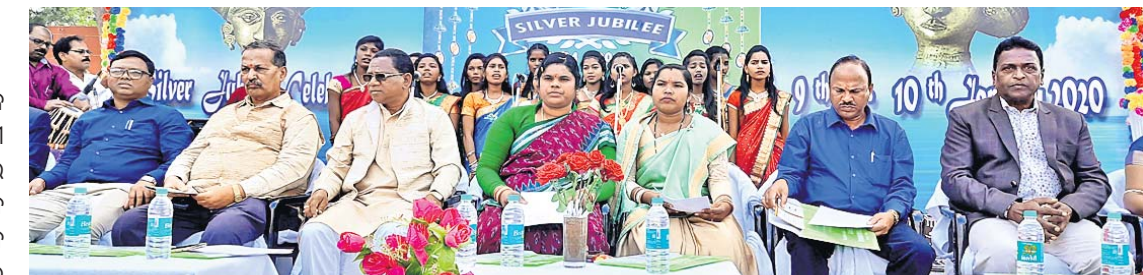
ରୌପ୍ୟ ଜୟନ୍ତୀର ଉଦ୍ଘାଟନା ମଞ୍ଚରେ ମନ୍ତ୍ରୀ ପରିଚାଳନା କର୍ମକ୍ଷମତା ବିକାଶ ପ୍ରକଳ୍ପର ଅନୁଷ୍ଠାନିକ କାର୍ଯ୍ୟକ୍ରମର ଉଦ୍ଘାଟନା କରାଯାଇଛି ।

ପଦାଳି ଗାଙ୍ଗୋଶ୍ୱରୀ ଉଚ୍ଚ ମାଧ୍ୟମିକ ବିଦ୍ୟାଳୟର ଉଚ୍ଚ ମାଧ୍ୟମିକ ବିଦ୍ୟାଳୟର ଉଦ୍ଘାଟନା କରାଯାଇଛି । ଏହାପାଇଁ କଳ୍ପଚକ୍ର ମହାଜିର ସମସ୍ତ ସଭ୍ୟମାନଙ୍କୁ ଛତୁ ଚାଷ ପାଇଁ ଆକର୍ଷଣ କରିବା ପାଇଁ ଉତ୍ସାହୀତ କରୁଛି ।