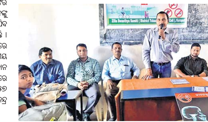
ସଚେତନତା ଶିବିରରେ ମଞ୍ଚାସୀନ ଅତିଥି ।

କୋରାପୁଟ ଜିଲ୍ଲାର ବିକାଶ ନିଗମରେ ପଞ୍ଚାୟତ ଚାଷୀଙ୍କ ସମାଜିକ କର୍ମକ୍ଷମତା ବିକାଶ ପ୍ରକଳ୍ପର ଅନୁଷ୍ଠାନିକ କାର୍ଯ୍ୟକ୍ରମର ଉଦ୍ଘାଟନା କରାଯାଇଥିଲା । ଏହାପାଇଁ କଳ୍ପଚକ୍ର ମହାଜିର ସମସ୍ତ ସଭ୍ୟମାନଙ୍କୁ ଛତୁ ଚାଷ ପାଇଁ ଆକର୍ଷଣ କରିବା ପାଇଁ ଉତ୍ସାହୀତ କରୁଛି ।