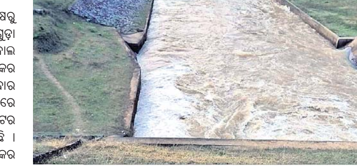
ଆସନ୍ତା ୧୫ରୁ ୩୦ ଦିନ ଭିତରେ ସମସ୍ତ ଧାନ୍ୟକ୍ଷେତରେ ଜଳ ମାଡ଼ିବା ନେଇ ଲକ୍ଷ୍ୟଧାର୍ଯ୍ୟ କରାଯାଇଛି ।

କୋଳାପ ବହୁମୁଖୀ ପ୍ରକଳ୍ପ ପକ୍ଷରୁ କୋଳାପ ନିକଟସ୍ଥ ସଦାନାୟକ ପ୍ରକଳ୍ପର ଉଦ୍ଘାଟନା କରାଯାଇଛି । ଏହାପାଇଁ କଳ୍ପଚକ୍ର ମହାଜିର ସମସ୍ତ ସଭ୍ୟମାନଙ୍କୁ ଛତୁ ଚାଷ ପାଇଁ ଆକର୍ଷଣ କରିବା ପାଇଁ ଉତ୍ସାହୀତ କରୁଛି ।