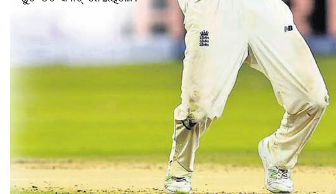
ବେନ୍ ଷ୍ଟୋକ୍ସ ଟେଷ୍ଟରେ ୫ଟି କ୍ୟାଚ୍ ନେଇ ରେକର୍ଡ କରିଛନ୍ତି

୯୦୧୯ ଟେଷ୍ଟ ମ୍ୟାଚରେ ୨୩୫ଟି କୌଣସି ଖେଳାଳି ଗୋଟିଏ ଇନିଂସରେ ୫ଟି କ୍ୟାଚ୍ ନେବାର ରେକର୍ଡ ରହିଛି। ଗତବର୍ଷ ଲଣ୍ଡନରେ ଅନୁଷ୍ଠିତ ଆଇସିସିଏଲ୍ ବିପକ୍ଷ ଟେଷ୍ଟର ଗୋଟିଏ ଇନିଂସରେ ଇଂଲଣ୍ଡ ଅଧିନାୟକ ଜୋ ରୁଟ୍ ୫ଟି କ୍ୟାଚ୍ ନେଇଥିଲେ।