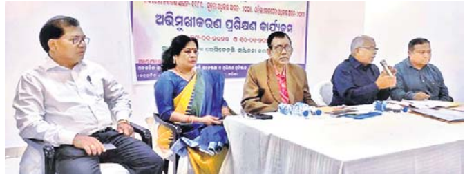
କାର୍ଯ୍ୟକ୍ରମରେ ମଞ୍ଚାଧୀନ ଅଟିଥିଲେ