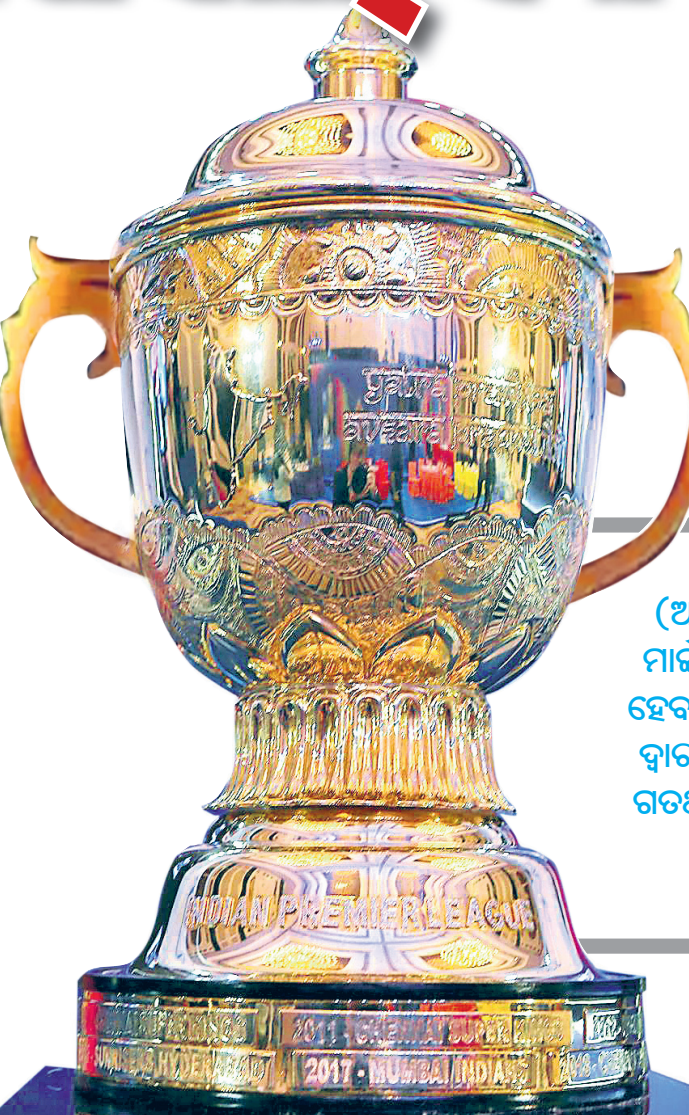
ଆଇପିଏଲ୍ ୧୩ର ଟ୍ରୋଫି

ଇଣ୍ଡିଆନ୍ ପ୍ରିମିୟର ଲିଗ୍ ସଂସ୍କରଣ- ୧୩ ଫର୍ମାଟ- ଟି୨୦ ଦଳ ସଂଖ୍ୟା- ୮ ମ୍ୟାଚ୍ ସଂଖ୍ୟା- ୬୦ ଚୁନାମେଣ୍ଟ ଫର୍ମାଟ- ରାଉଣ୍ଡ ରବିନ୍ ଓ ନକ ଆଉଟ ଗଡ଼ପଥର ଚାମ୍ପିୟନ- ମୁୟାଲ ଇଣ୍ଡିଆନ୍ ସଫଳତମ ଦଳ- ମୁୟାଲ ଇଣ୍ଡିଆନ୍ (୪ ଥର ବିଜେତା)