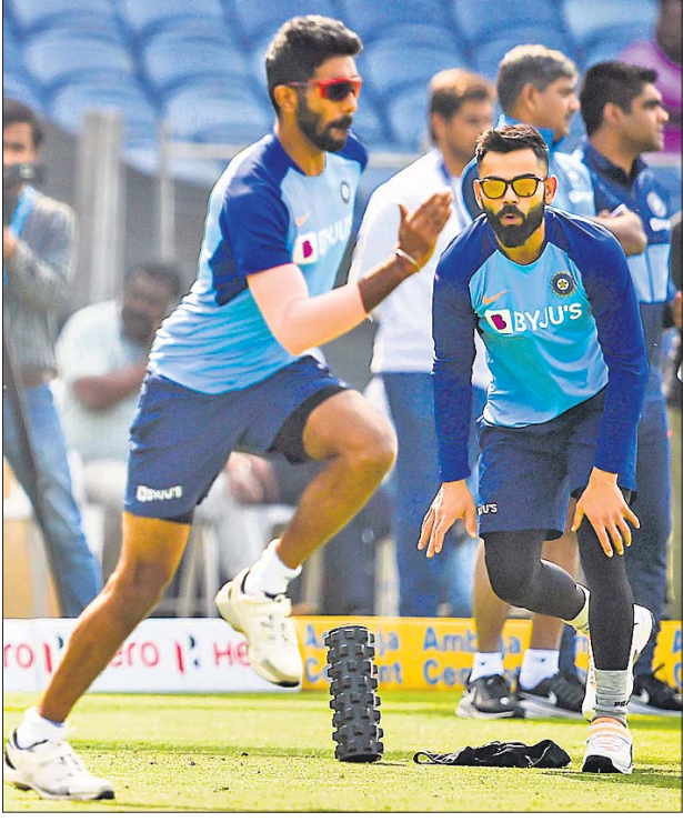
ପ୍ରଥମ ଡୌରା ଲେଖାରୁ ପୁଣି ବ୍ୟାଟ୍ମ୍ୟାନି ଉପରେ ଅଧିନାୟକ ବିରାଟ କୋହଲିଙ୍କ ଟାକ୍ସ ନକର।