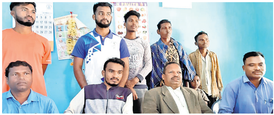
ଓଡ଼ିଶା କୋୟା ସମାଜ ଓ ଆଦିବାସୀ ମହାସଂଘର ଖବରଦାତା ସମ୍ମିଳନୀ।