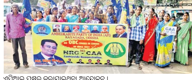
ଏପିଆଇ ପକ୍ଷରୁ କରାଯାଇଥିବା ଆନ୍ଦୋଳନ