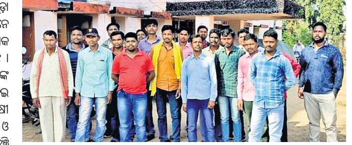
ପ୍ରଶାସନକୁ ଭେଟିବାକୁ ଆସିଥିବା ଚାଷୀମାନେ ।

କୋରପୁଟ ଜିଲ୍ଲା କୁନ୍ତୁରା ବ୍ଲକ୍ ରାଣୀଗୁଡ଼ା ଓ ବାରବେନା ପଞ୍ଚାୟତର ଚାଷୀମାନେ ନିଜ ଖିରିଏ ଧାନ ମଣ୍ଡିରେ ବିକିବାକୁ ଏକ ସଫାସାଧୁ ଏକ ମାସ ହେବାକୁ ଯାଇଛି । କିନ୍ତୁ ଏଯାବତ୍ ଧାନ ବିକା ଟଙ୍କା ସେମାନଙ୍କ ବ୍ୟାଙ୍କାକାଉଣ୍ଡରେ ଜମା ହୋଇନାହିଁ ।