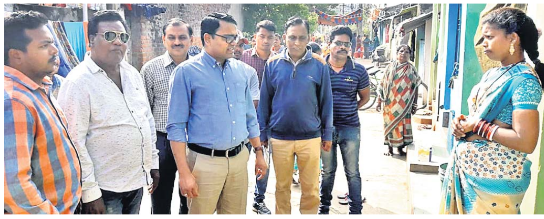
ଉପଜିଲାପାଳ ଜଣେ ମହିଳାଙ୍କଠାରୁ ସମସ୍ୟା ପଚାରି ବୁଝିଛନ୍ତି

ରାଜଗଡ଼ା ଜିଲା ରାଜଗଡ଼ା ଉପଜିଲାପାଳ ଡ. ସିଦ୍ଧେଶ୍ଵର ବଳିରାମ ବନ୍ଦର ରୁଧିରା ପୌର ପରିଷଦ ଅଧୀନ ବିଭିନ୍ନ ଓଡ଼ିଆ ଭୂମିରେ ତଦାରଖ କଲେ ଉନ୍ନୟନ କାର୍ଯ୍ୟ ତଦାରଖ କଲେ ଉନ୍ନୟନ କାର୍ଯ୍ୟ