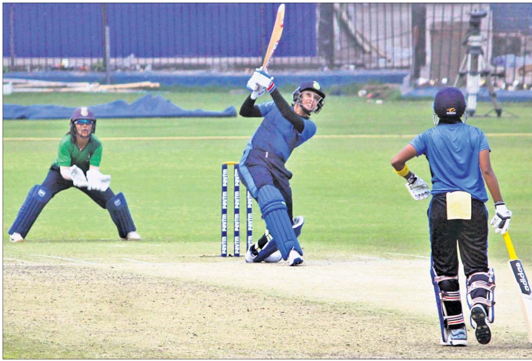
ବାରବାଟୀ ସ୍ଵାଭିମ୍ଭମରେ ଚାଲିଥିବା ଚ୍ୟାଲେଞ୍ଜର ଟ୍ରଫିରେ ଇଣ୍ଡିଆ-ବି ଓ ଇଣ୍ଡିଆ-ସି ଦଳ ପାଇନାଲରେ ପ୍ରବେଶ କରିଛନ୍ତି।

କଟକ ଅଫିସ, ୯୧୧... ବାରବାଟୀ ସ୍ଵାଭିମ୍ଭମରେ ଚାଲିଥିବା ସିନିୟର ମହିଳା ଟି୨୦ ଚ୍ୟାଲେଞ୍ଜର ଟ୍ରଫିରେ ଇଣ୍ଡିଆ-ବି ଓ ଇଣ୍ଡିଆ-ସି ଦଳ ପାଇନାଲରେ ପ୍ରବେଶ କରିଛନ୍ତି।