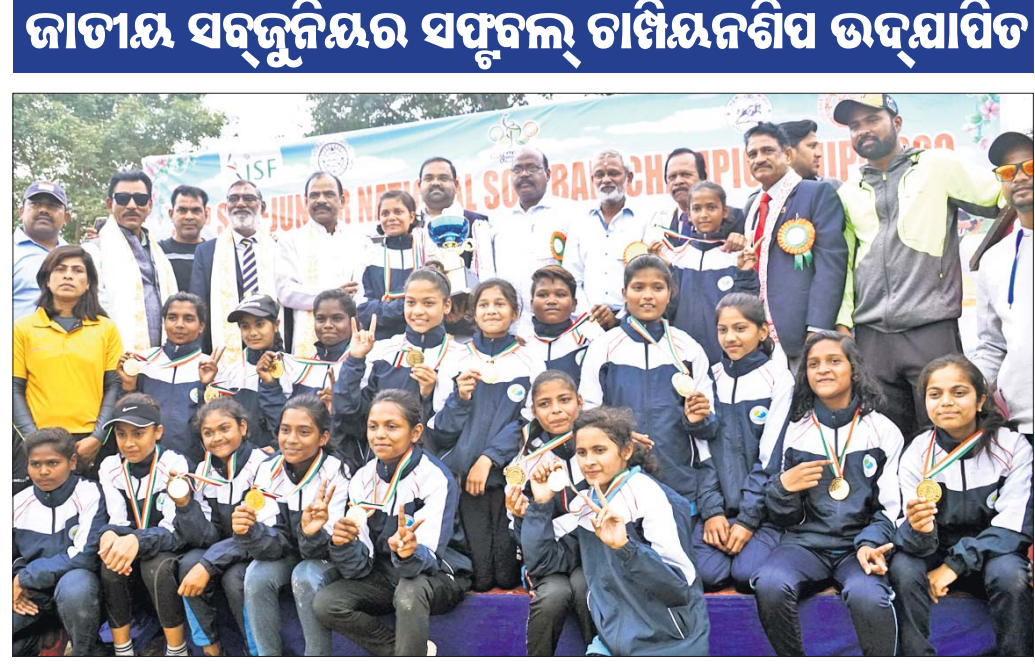
ବାକିକ ବିଭାଗ ଚାମ୍ପିୟନ ମଧ୍ୟପ୍ରଦେଶ ଦଳ ଅତିଥିକ ରାହଗରେ।