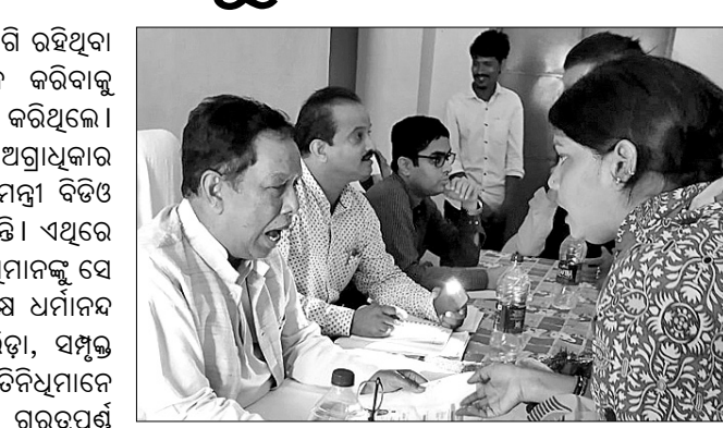
ମନ୍ତ୍ରୀ ଜଣେ ହିତାଧିକାରୀଙ୍କ ସମସ୍ୟା ପଚାରି ରୁଝୁଛନ୍ତି।