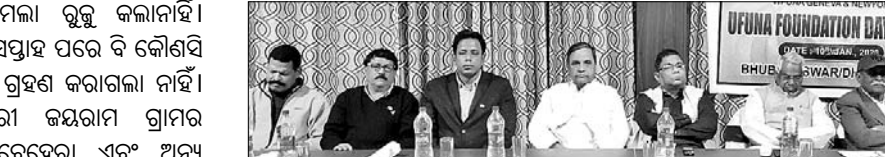
ଉତ୍ତୁନାର ପ୍ରତିଷ୍ଠା ଦିବସରେ ଅତିଥିମାନେ।