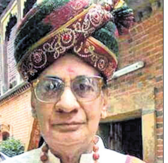
ଭୁବନେଶ୍ୱରର ଏକ ଘରୋଇ ହସ୍ପିଟାଲରେ ଭର୍ତ୍ତି କରାଯାଇଥିଲା। ଏହାପରେ ତାଙ୍କୁ ସେ କ୍ରମାଗତ ଅସୁସ୍ଥ ରହି ଟିକିଆଧୀନ ଥିଲେ।

ପାରଳାଖେମୁଣ୍ଡି, ୧୦/୧ (ସ.ପ୍ର.) ପାରଳା ମହାରାଜା ଗୋପୀନାଥ ଗଜପତି ନାରାୟଣ ଦେବଙ୍କ ଶୁକ୍ରବାର ସକାଳେ ୭୭ ବର୍ଷ ବୟସରେ ପରଲୋକ ଘଟିଛି। ଦୀର୍ଘଦିନ ଧରି ସେ ଅସୁସ୍ଥ ଥିବାବେଳେ ଭୁବନେଶ୍ୱରର ଏକ ଘରୋଇ ଡାକ୍ତରଖାନାରେ ଭୋର ୪ଟା ୨୦ରେ ଶେଷନିଶ୍ୱାସ ତ୍ୟାଗ କରିଛନ୍ତି। ୨୦୧୬ରେ ମହାରାଜା ଅସୁସ୍ଥ ହେବା ପରେ ପ୍ରଥମେ ତାଙ୍କୁ ଚେନାଇସ୍ଥିତ ଏକ ଘରୋଇ ହସ୍ପିଟାଲରେ ଭର୍ତ୍ତି କରାଯାଇଥିଲା। ଟିକିଆ ପରେ ତାଙ୍କ ସ୍ୱାସ୍ଥ୍ୟାବସ୍ଥାରେ ସୁଧାର ଆସିଥିଲା। ପରେ ପୁଣି ଅସୁସ୍ଥ ହେବା ଯୋଗୁ ୨୦୧୭ ଜାନୁୟାରୀରେ