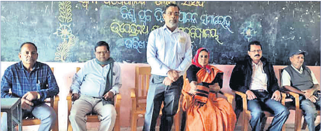
ବିଷ୍ଣୁ ଯୁବ ଦିବସ ସମାରୋହରେ ମହାସାଧନ ଅତିଥି।