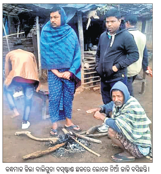
କନ୍ଧମାଳ ଜିଲା ବାଲିଗୁଡ଼ା ବସ୍ତାଞ୍ଚଳ ଛକରେ ଲୋକେ ନିଆଁ ଜାଳି ବସିଛନ୍ତି।

ଭୁବନେଶ୍ଵର, ୧୨।୧ (ବୁଧବାର) ରାଜ୍ୟରେ ପୁଣି ଲେଉଟିଲା ଶୀତ। ଅଦିନିଆ ବର୍ଷା ମାଟି ଭିଜାଇ ଚାଲିଯିବା ପରେ ଶୀତ ମାଡ଼ି ଆସିଛି। ଅସହ୍ୟ ଥଣ୍ଡାରେ ଅତୁଟି ସାରା ଓଡ଼ିଶା। ରବିବାର ୧୩ ସହରରେ ତାପମାତ୍ରା ୧୦ ଡିଗ୍ରୀ ଠିକ୍ ରହିଥିଲାବେଳେ ସୋନପୁର ପୁଣିଥରେ ସବୁଠାରୁ ଥଣ୍ଡା ସହର ପାଲଟିଛି। ସୋନପୁରରେ ସର୍ବନିମ୍ନ ତାପମାତ୍ରା ୪.୮ ଡିଗ୍ରୀ ରେକର୍ଡ କରାଯାଇଛି। ସେହିପରି ପୁଲ୍ଲବାଣୀରେ ସର୍ବନିମ୍ନ ତାପମାତ୍ରା ୫ ଡିଗ୍ରୀ ରହିଥିବାବେଳେ ଅନୁଗୋଳରେ ୬, ଚିତ୍ତଲାଗଡ଼ରେ ୬.୫, ଦାରିଙ୍ଗପାଡ଼ିରେ ୭.୨, ଝାରସୁଗୁଡ଼ାରେ ୮.୫, କେନ୍ଦୁଝରରେ ୮.୮, କୋରାପୁଟରେ, ବଲାଙ୍ଗୀର ଓ ସମ୍ବଲପୁରରେ ୯, ଭବାନୀପାଟଣାରେ ୯.୩, ସୁନ୍ଦରଗଡ଼ରେ ୯.୫ ଓ ବାଲେଶ୍ଵରରେ ୯.୮ ରେକର୍ଡ କରାଯାଇଛି। ତେବେ କଟକରେ ସର୍ବାଧିକ ୧୦.୨ ଡିଗ୍ରୀ ଓ ଭୁବନେଶ୍ଵରରେ ୧୧.୩ ଡିଗ୍ରୀ ତାପମାତ୍ରା ରହିଥିଲା। ଆସନ୍ତା ୫ଦିନ ପର୍ଯ୍ୟନ୍ତ ଏହିଭଳି ଶୀତ ଜାରି ରହିବ ବୋଲି ଭୁବନେଶ୍ଵର ଆଞ୍ଚଳିକ ପାଣିପାଗ କେନ୍ଦ୍ର ପକ୍ଷରୁ ସୂଚନା ଦିଆଯାଇଛି। ତେବେ ଭୁଜବିନ ପର୍ଯ୍ୟନ୍ତ ରାତି ସମୟରେ ସର୍ବନିମ୍ନ