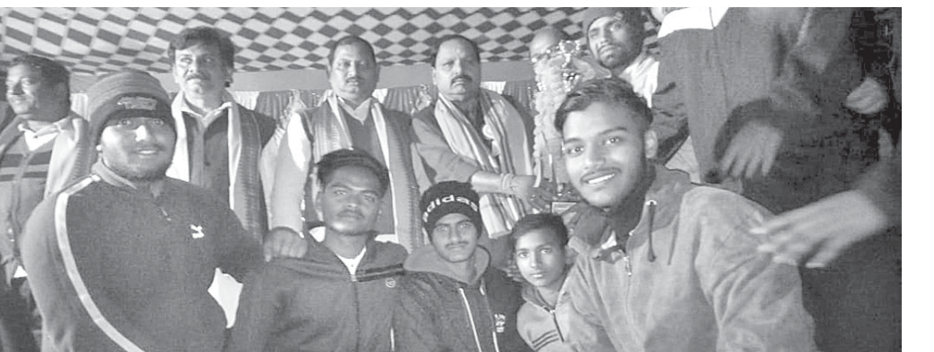
ଅତିଥିଙ୍କ ଗହଣରେ ଚାମ୍ପିୟନ ଦଳର ଖେଳାଳିମାନେ।

ପାଳଲହଡ଼ା, ୧୨୧୧(ଡି.ଏନ.ଏ.) ପାଳଲହଡ଼ା ଷ୍ଟାଡ଼ିୟମରେ ଯୁଥ ଫର ପାଳଲହଡ଼ା କ୍ଲବ ଅନୁକୂଳ୍ୟରେ ଚାଲିଥିବା ପ୍ରଥମ ଚ୍ୟାଲେଞ୍ଜର୍ସ କପ କ୍ରିକେଟ ଚୁର୍ଣ୍ଣାମେଣ୍ଟ ରବିବାର ଉଦ୍‌ଘାଟିତ ହୋଇଯାଇଛି। ଫାଇନାଲ ମ୍ୟାଚରେ ରାଉରକେଲା ଏକାଦଶକୁ ହରାଇ ଫ୍ରେଣ୍ଡ୍ସ କ୍ଲବ ତାଳଚେର ଚାମ୍ପିୟନ ହୋଇଛି। ରାଉରକେଲା ଏକାଦଶ ପ୍ରଥମେ ବ୍ୟାଟିଂ କରି ୧୮୪