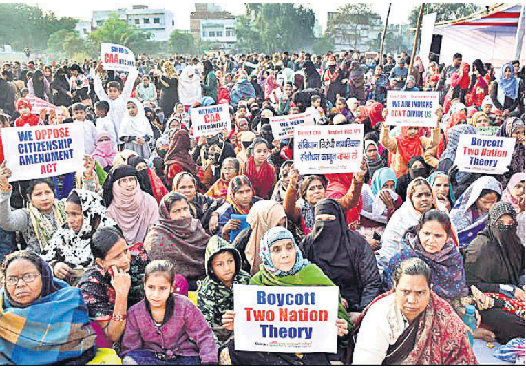
ଗୟାରେ ରବିବାର ମହିଳାମାନେ ସିଏଏ ଏବଂ ଏନଆରସି ବିରୋଧରେ ବିକ୍ଷୋଭ ପ୍ରଦର୍ଶନ କରୁଛନ୍ତି।