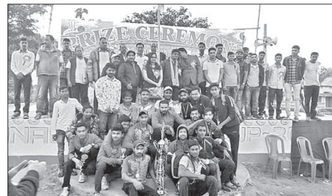
ଅତିଥିଙ୍କ ଗହଣରେ ଚାମ୍ପିୟନ ଦଳର ଖେଳାଳିମାନେ।

ଅନୁଗୋଳ ଜିଲ୍ଲା କଟିହାଁ କ୍ଲବ ପବିତ୍ରନଗର ମିନିଷ୍ଟାଡ଼ିୟମରେ ଚାଲିଥିବା ପବିତ୍ରନଗର କପ-୨୦୨୦ କ୍ରିକେଟ ଚୁର୍ଣ୍ଣାମେଣ୍ଟ ରବିବାର ଉଦ୍‌ଘାଟିତ ହୋଇଯାଇଛି। ଫାଇନାଲ ମ୍ୟାଚରେ ସମ୍ବଲପୁର ଏମ୍‌ସିସି ହରାଇ ଭଦ୍ରକ ରେଲୱେ