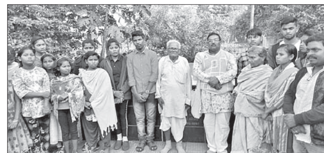
ବାଜିରାଉତ ଛାତ୍ରାବାସରେ ଉପସ୍ଥିତ ଅଭିଯାତ୍ରୀ ଦଳ।