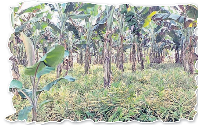
କଦଳୀ ଫସଲ ମଧ୍ୟରେ ହୋଇଥିବା ଅଦା ଚାଷ।