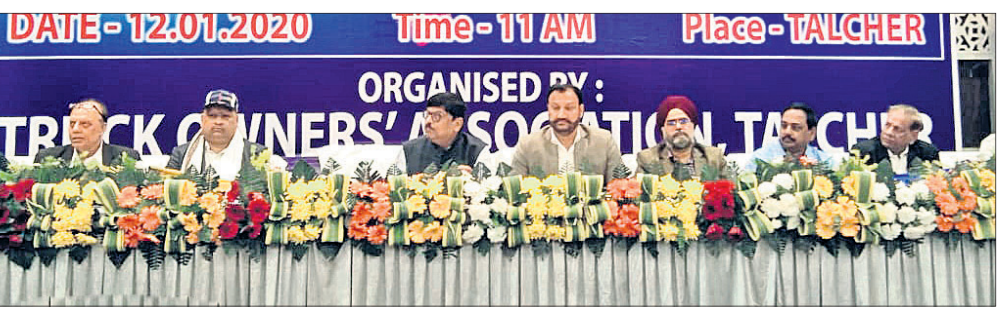
ସମ୍ମିଳନୀରେ ମଞ୍ଚାସୀନ ଅତିଥିମାନେ।