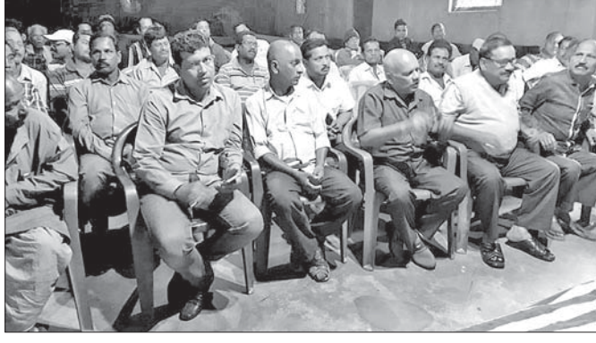
ବୈଠକରେ ଉପସ୍ଥିତ ବିଦ୍ୟୁତ୍ ଉପଭୋକ୍ତାମାନେ।