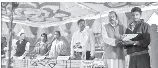
ଏମପି କଣେ କୃତୀ ହାତକୁ ପୁରସ୍କୃତ କରୁଛନ୍ତି।