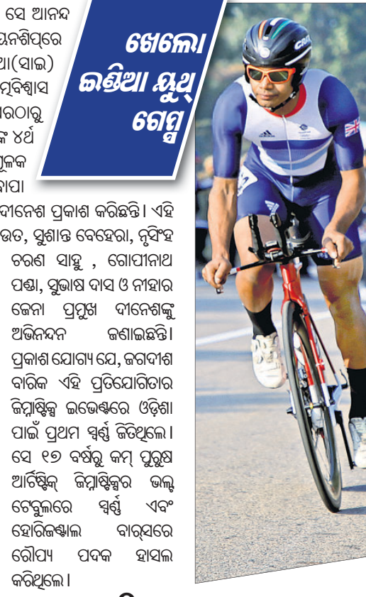
ଖେଳୋ ଇଣ୍ଡିଆ ଯୁଥ୍ ଗେମ୍ସ