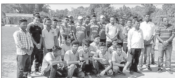
ଉଦ୍‌ଘାଟନ ଉତ୍ସବରେ ଖେଳାଳିମାନେ।