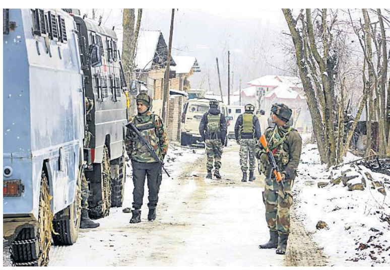
କଶ୍ମୀରର ଟ୍ରାଲ ଅଞ୍ଚଳରେ ଯବାନମାନେ ତଲାସୀ ଅଭିଯାନ ଚଳାଇଛନ୍ତି।