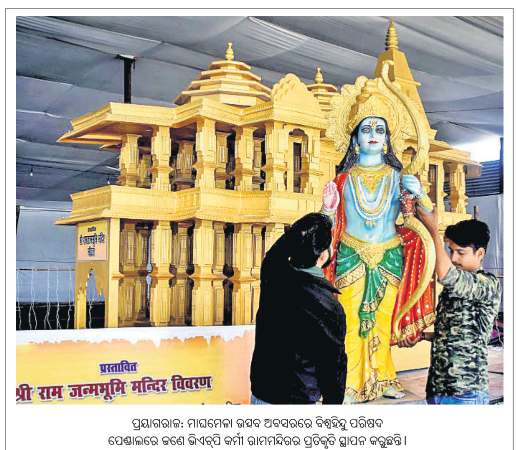
ପ୍ରୟାଗରାଜ: ମାଘମେଳା ଉତ୍ସବ ଅବସରରେ ବିଶ୍ୱହିନ୍ଦୁ ପରିଷଦ ପେଣ୍ଡାଲରେ ଜଣେ ଭିଏସପି କର୍ମୀ ରାମମନ୍ଦିରର ପ୍ରତିକୃତି ସ୍ଥାପନ କରୁଛନ୍ତି।