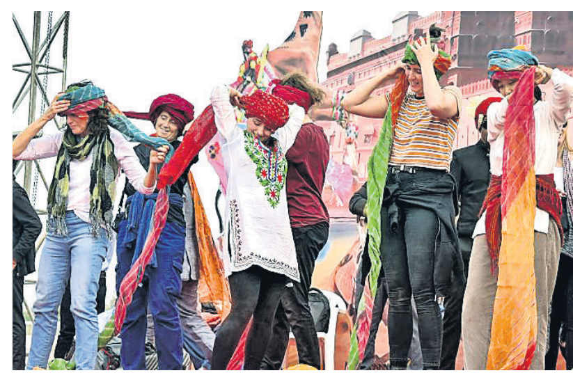
ବିକାନେରରେ ୨୭ତମ ଅନ୍ତର୍ଜାତୀୟ କ୍ୟାମେଲ ଫେଷ୍ଟିଭାଲରେ ପର୍ଯ୍ୟଟକମାନେ ପରଡ଼ି ବନ୍ଧା ପ୍ରତିଯୋଗିତାରେ ଭାଗ ନେଇଛନ୍ତି।