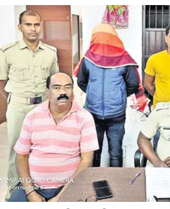
ଜବତ ଗଞ୍ଜେଇ ଓ ଗିରଫ ଅଭିଯୁକ୍ତ।