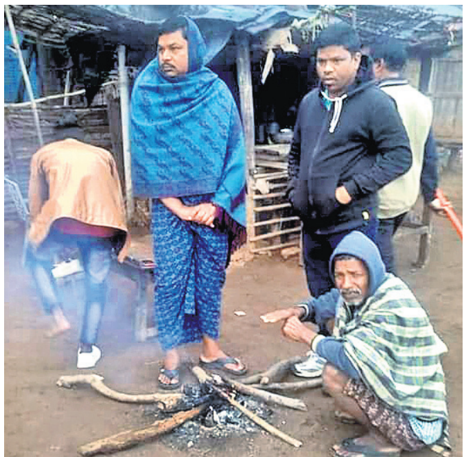
କନ୍ଧମାଳ ଜିଲ୍ଲା ବାଲିଗୁଡ଼ା ବସଷ୍ଟାଣ୍ଡ ଛକରେ ଲୋକେ ନିଆଁ ଜାଳି ବସିଛନ୍ତି।

ଭୁବନେଶ୍ଵର, ୧୨।୧ (ବୁଧବେ) - ରାଜ୍ୟରେ ପୁଣି ଲେଉଟିଲା ଶୀତ। ଅଦିନିଆ ବର୍ଷା ମାଟି ଭିଜାଇ ରାଜ୍ୟର ପରେ ଶୀତ ମାଟି ଆସିଛି। ଅସହ୍ୟ ଥଣ୍ଡାରେ ଅଧିକ ସଂଖ୍ୟାରେ ଡାକ୍ତରଖାନାରେ ୧୦ ଡିଗ୍ରୀ ତଳେ ରହିଥିଲାବେଳେ ସୋନପୁର ପୁଣିଥରେ ସବୁଠାରୁ ଥଣ୍ଡା ସହର ପାଲଟିଛି। ସୋନପୁରରେ ସର୍ବନିମ୍ନ ତାପମାତ୍ରା ୪.୮ ଡିଗ୍ରୀ ରେକର୍ଡ କରାଯାଇଛି। ସେହିପରି ପୁଲବାଣୀରେ ସର୍ବନିମ୍ନ ତାପମାତ୍ରା ୫ ଡିଗ୍ରୀ ରହିଥିବାବେଳେ ଅନୁଗୋଳରେ ୬, ଚିଟିଲାଗଡ଼ରେ ୬.୫, ଦାରିଙ୍ଗପାଡ଼ିରେ ୭.୨, ଝାରସୁଗୁଡ଼ାରେ ୮.୫, କେନ୍ଦୁଝରରେ ୮.୮, କୋରାପୁଟରେ, ବଲାଙ୍ଗୀର ଓ ସମଲପୁରରେ ୯, ଭବାନୀପାଟଣାରେ ୯.୩, ସୁନ୍ଦରଗଡ଼ରେ ୯.୫ ଓ ବାଲେଶ୍ଵରରେ ୯.୮ ରେକର୍ଡ କରାଯାଇଛି। ତେବେ କଟକରେ ସର୍ବାଧିକ ୧୦.୨ ଡିଗ୍ରୀ ଓ ଭୁବନେଶ୍ଵରରେ ୧୧.୩ ଡିଗ୍ରୀ ତାପମାତ୍ରା ରହିଥିଲା। ଆସନ୍ତା