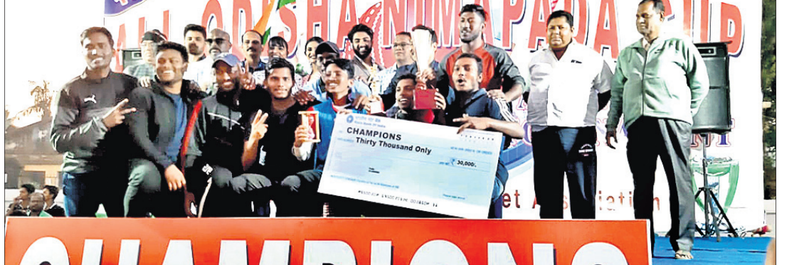
ଅତିଥିକଠାରୁ ପୁରସ୍କାର ଗ୍ରହଣ କରୁଛନ୍ତି ଚାମ୍ପିୟନ କ୍ରୀଡ଼ା ଖେଳାଳିମାନେ।