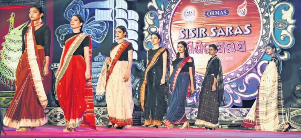
ଭୁବନେଶ୍ୱର ପ୍ରଦର୍ଶନୀ ପଡ଼ିଆରେ ଚାଲିଥିବା ଶିଶୁ ସରସ ମେଳାରେ ରବିବାର ଏନିଆଇଏସ୍ଟି ଛାତ୍ରାଳୟ ପକ୍ଷରୁ ଓଡ଼ିଆ ପାରମ୍ପରିକ କ୍ରାଫ୍ଟ ପ୍ୟାଶନ ଶୋ।