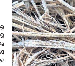
ଦାରିଙ୍ଗବାଡିରେ ହୋଇଥିବା ତୁଷାରପାତ

ଫୁଲବାଣୀ ଅପିଏ/ ଦାରିଙ୍ଗବାଡି, ୧୨।୧ (ଡି.ଏନ୍.ଏ.)