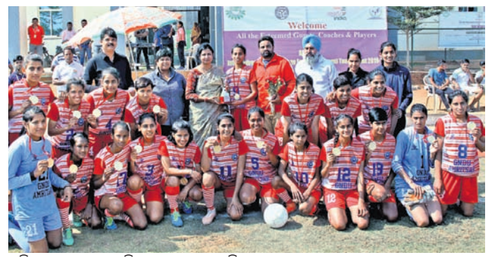
ଅତିଥିକ ଗହଣରେ ଚାମ୍ପିୟନ ଦଳର ଖେଳାଳିମାନେ।