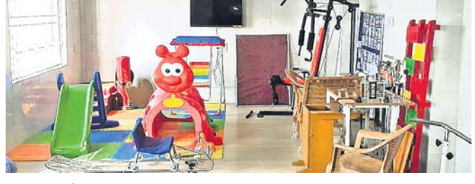
ପିଲାଙ୍କ ପାଇଁ ରଖାଯାଇଥିବା ଖେଳନା ।