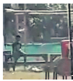
ବିଦ୍ୟାଳୟ ପରିସରରେ ଗ୍ରାହଣ ଉପରେ ପିଲାମାନେ ।

ମହାକାଳପଡ଼ା, ୧୪୧ (ଡି.ଏନ.ଏ.) : ମହାକାଳପଡ଼ା ବ୍ଲକ୍ ଅଧୀନ ବିଜୟନଗର ପଞ୍ଚାୟତର ବିଜୟନଗର ସରକାରୀ ନୋଡାଲ ଉଚ୍ଚ ବିଦ୍ୟାଳୟରେ କେତେକ ଛାତ୍ରଙ୍କୁ ମଙ୍ଗଳବାର ମାଟି ସମ୍ବଳ କରାଯିବା କାର୍ଯ୍ୟରେ ନିଯୋଜିତ କରାଯାଇଥିବା ଅଭିଯୋଗ ହୋଇଛି ।