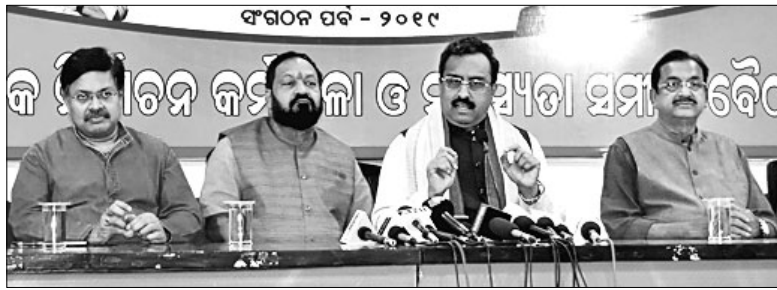
ଝରବତୀ ସମ୍ମିଳନୀରେ ଭାଜପା ରାଷ୍ଟ୍ରୀୟ ସାଧାରଣ ସମ୍ପାଦକ ରାମ ମାଧବ ଏବଂ ଅନ୍ୟମାନେ ।

ଆଧାରରେ ପ୍ରସାଦିତ ହୋଇ ଜୀବନ ବିଚାରପତ୍ରା କରାଯାଇ ବାହାରିଛି । ସେମାନଙ୍କର ଏହି ସ୍ଥାନ ଚକ୍ରାନ୍ତ ପାଇଁ ଭାରତ ବିଶ୍ୱରେ ବଦନାମ ହେଉଛି ବୋଲି ଭାଜପା ରାଷ୍ଟ୍ରୀୟ ସାଧାରଣ ସମ୍ପାଦକ ରାମ ମାଧବ ମଙ୍ଗଳବାର ଏହା କହିଛନ୍ତି ।