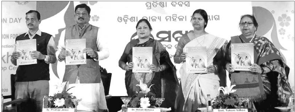
ପୁସ୍ତକ ପଢ଼ିବା ପାଇଁ ଓ ପରିବାର ଚିକିତ୍ସାକୁ ଅତିଥିମାନେ ଉଦ୍ଘୋଷଣା କରୁଛନ୍ତି।

ଭୁବନେଶ୍ୱର, ୧୪୧ (ଭୁବନେଶ୍ୱର) ମହିଳାଙ୍କୁ ପୁରୁଣା ଓ ସାମାଜିକ ନ୍ୟାୟ ପ୍ରଦାନ କ୍ଷେତ୍ରରେ ଓଡ଼ିଶା ଏକ ଅଗ୍ରଣୀ ରାଜ୍ୟ ଭାବେ ପରିଗଣିତ ହୋଇଛି।