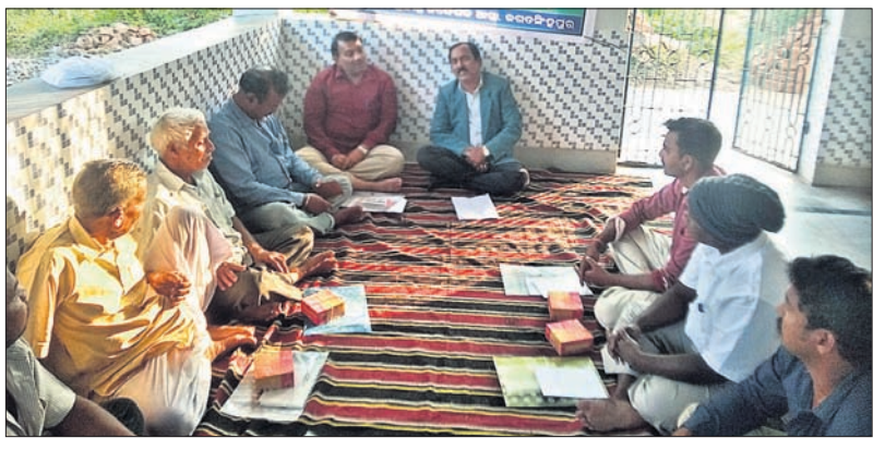
ତାଲିମ ଶିବିରରେ କୃଷି ଅଧିକାରୀ ଓ ଚାଷୀମାନେ।

ବାଲିଆ, ୧୪୧୧: ପ୍ରଗତିଶୀଳ, ଛେଦିକ ସାର ବ୍ୟବହାର, ପାଣି ସିଞ୍ଚନ ପ୍ରଣାଳୀ ସମ୍ପର୍କରେ ବିସ୍ତୃତ ଭାବେ ତାଲିମ ପ୍ରଦାନ କରିଥିଲେ।