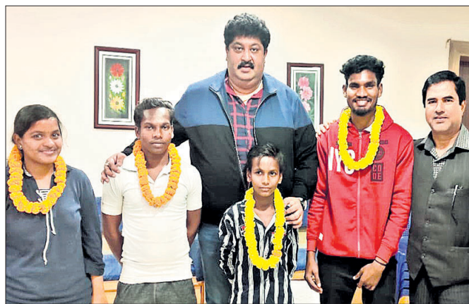
ଗୋଆ ଯାତ୍ରା କରିଥିବା ଛାତ୍ରାଛାତ୍ରୀଙ୍କ ସମ୍ବଳିତ କରାଯାଇଛି।

ପାରାଦୀପ, ୧୪୧୧(ସ.ପ୍ର.) ଓଡ଼ିଶାର ପାରାଦୀପ, କଟକ ଓ ଗୋପାଳପୁରରୁ ୬ଜଣ ଛାତ୍ରାଛାତ୍ରୀ ମଙ୍ଗଳବାର ଗୋଆ ଯାତ୍ରା କରିଛନ୍ତି।