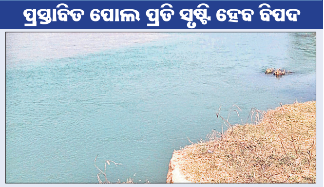
ମହାନଦୀ ପଠା। ■ ଖୁବ୍ ଶୀଘ୍ର ପଥର ପ୍ୟାକିଂ କରିବାକୁ ସାଧାରଣରେ ଦାବି ■ ଡିଭିଜନାଲ-ପୋଷଲ ଖରାଦିନିଆ ରାସ୍ତାରେ ହେବ ପୋଲ