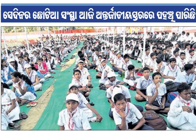
ସେବିନର ଛୋଟିଆ ସଂସ୍ଥା ଆଦି ଅର୍ଜୁନୀତାୟଣରେ ପହଞ୍ଚି ପାରିଛି