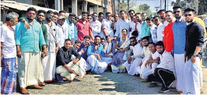
ମାଲକାନଗିରିରେ ମକର ସଂକ୍ରାନ୍ତିରେ ଏକାଠି ହୋଇଥିବା ତେଲୁଗୁ ସମ୍ପ୍ରଦାୟର ଲୋକେ ।