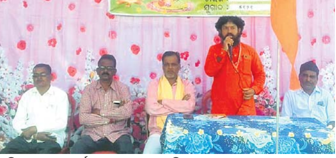
ପଢ଼ିଆରେ ମକର କାର୍ଯ୍ୟକ୍ରମରେ ମଞ୍ଚାସୀନ ଅତିଥିମାନେ ।