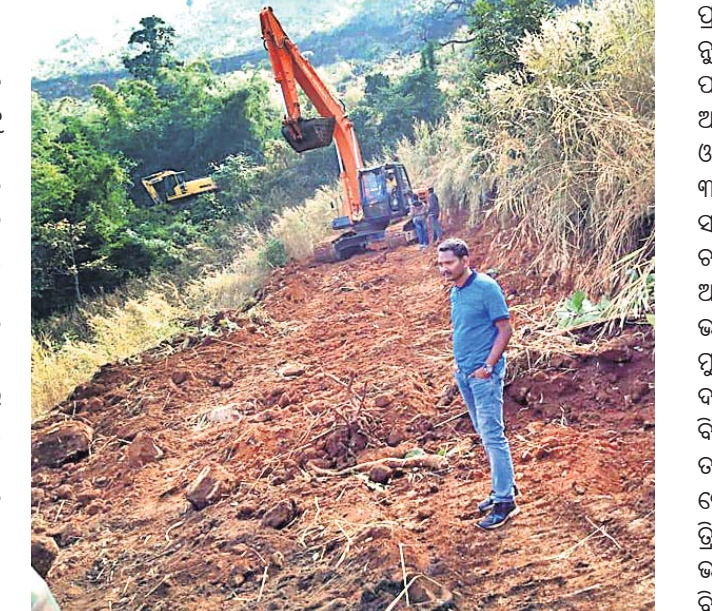
ଯୋଡ଼ାମକୁ ତିଆରି କରାଯାଉଥିବା ରାସ୍ତା ।