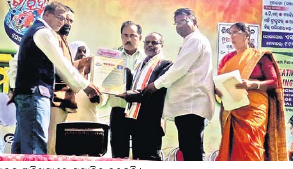
ପ୍ରଧାନଶିକ୍ଷକଙ୍କୁ ଅତିଥିମାନେ ସମ୍ମାନିତ କରୁଛନ୍ତି ।