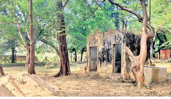
ଏମ୍‌ଜି-୭ଏ ପାର୍କର ପୁନରୁଦ୍ଧାର କାର୍ଯ୍ୟ ବାଲିଛି ।