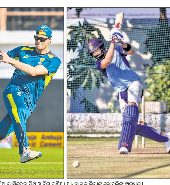
ରାଜକୋଟରେ ଚୁକ୍ତବାର ଅଷ୍ଟ୍ରେଲିଆର ଷ୍ଟେଭେ ସ୍ମିଥ୍ ଓ ଟିମ୍ ଇଣ୍ଡିଆ ଅଧିନାୟକ ବିରାଟ କୋହଲିଙ୍କ ଅଭ୍ୟାସ।

ରାଜକୋଟ, ୧୬୧ (ପି.ଟି.): ସ୍ଥାନୀୟ ସୌରାଷ୍ଟ୍ର କ୍ରିକେଟ୍ ଆସୋସିଏଶନ ଗ୍ରାଉଣ୍ଡରେ ଶୁକ୍ରବାର ଭାରତ ଓ ଭ୍ରମଣକାରୀ ଅଷ୍ଟ୍ରେଲିଆ ମଧ୍ୟରେ ଦ୍ୱିତୀୟ ଦିନିକିଆ ମ୍ୟାଚ୍ ଖେଳାଯିବ। ମୁ୍ୟାଲରେ ପ୍ରଥମ ଦିନିକିଆରେ ୧୦ ଉଇକେଟ୍ରେ ଲକ୍ଷ୍ୟକ୍ରମ ଭାବେ ପରାସ୍ତ ହୋଇଥିବା ଭାରତ ୩ ମ୍ୟାଚ୍ ବିଶିଷ୍ଟ ଏହି ସିରିଜରେ ୧-୦ରେ ପଛରେ ପଡ଼ିଛି। ଫଳରେ ଭାରତ ବିଜୟୀ ହେବା ଅପରିହାର୍ଯ୍ୟ ହୋଇପଡ଼ିଛି। ଅଧିନାୟକ ବିରାଟ କୋହଲି ପୂର୍ବପରି ୩ ନମ୍ବରରେ ବ୍ୟାଟିଂ କରିବାକୁ ଆସିବେ। ପ୍ରଥମ ମ୍ୟାଚ୍ରେ ସେ ନିଜର ବ୍ୟାଟିଂ ଜୁମ୍ ବଦଳାଇଥିଲେ। ତେବେ ଏହା ମହଙ୍ଗା ସାବ୍ୟସ୍ତ ହୋଇଥିଲା ଓ ଭାରତର ବ୍ୟାଟିଂ ଫୋର୍ମ୍ ମାରିଥିଲା। ବୁଲ୍ ଅଷ୍ଟ୍ରେଲିଆ ଓପନର ଡେଭିଡ୍ ଫ୍ଲିନର୍ ଓ ଆରୋନ ଫିଞ୍ଚ ଘରୋଇ ବୋଲରଙ୍କ ଭିତରୁ ମୁକାବିଲା କରିବା ସହ ଅପରାଜିତ ଶତକ ହାସଲ କରି ଦଳକୁ ଜିତାଇଥିଲେ।