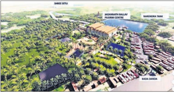
ଏହି ପାର୍କିଂସ୍ଥଳରେ ୫୦୦ କାର୍ ଓ ଏକ ବୁଲ୍‌ଡକ୍‌ସିଆ ଗାଡ଼ି ରହିପାରିବାର ଭଳି ସୁବିଧା କରାଯିବ । ଏଥିସହ ୩୫୦ ଭେଡିଂ ଆଉଟ୍‌ରୋଡ୍ ମଧ୍ୟ ରହିବ । ଏ ବାବଦରେ ୯୦ କୋଟି ୨୨ଲକ୍ଷ ଟଙ୍କା ଖର୍ଚ୍ଚ ହେବ ।

ମୁଖ୍ୟମନ୍ତ୍ରୀ ନବୀନ ପଟ୍ଟନାୟକ ଗୁରୁବାର ପୁରୀ ଗସ୍ତ ଅବସରରେ ସିଂହବାର ସମ୍ପୂର୍ଣ୍ଣ ବଡ଼ଦାଣ୍ଡର ଖୋଲା ଆକାଶ ତଳେ ବସି ଶ୍ରୀମନ୍ଦିର ହେରିଚେଳ କରିବାର ପ୍ରବେଶ ପଥ, ଲାଇବ୍ରେରୀ, କ୍ଲୋକଟୁମ୍, ପୁରୀର ଯାତ୍ରୀ ଓ ଧାଡ଼ି, ଧ୍ୟାନସ୍ଥଳ, ପ୍ରଦର୍ଶନୀ ଓ କଳା ପ୍ୟାରିଲିୟମ, ଭୂମି ଗାଧାର, ମିନି ପରେଷ୍ଟ ଏବଂ ବନାମାଳିକା ପାର୍କ, ଫୁଡ଼ସ୍ଥଳ, ବସବାସ ସ୍ଥଳ, ଶ୍ରୀକର୍ମ ସ୍ଥଳ, ପଦ୍ମ ପୋଷାଗାରୀ, ରଥ ନିର୍ମାଣ ଆଦି ରହିଛି । ସେହିପରି ମୁଖ୍ୟମନ୍ତ୍ରୀ ସୌନ୍ଦର୍ଯ୍ୟକରଣ କାମ ବିଶେଷକରି ନୂଆ ବ୍ୟାରିକେଡ଼, ସବୁଜ ବନ୍ଦୀ ଆଦି ବୁଲି ଦେଖିଥିଲେ ।