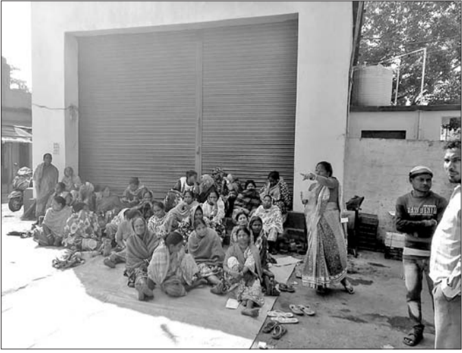
ହାରାକୁଦରେ ସଫେଇ କର୍ମଚାରୀମାନେ କାର୍ଯ୍ୟବନ୍ଦ ଆନ୍ଦୋଳନ କରି ଧାରଣାରେ ବସିଛନ୍ତି।