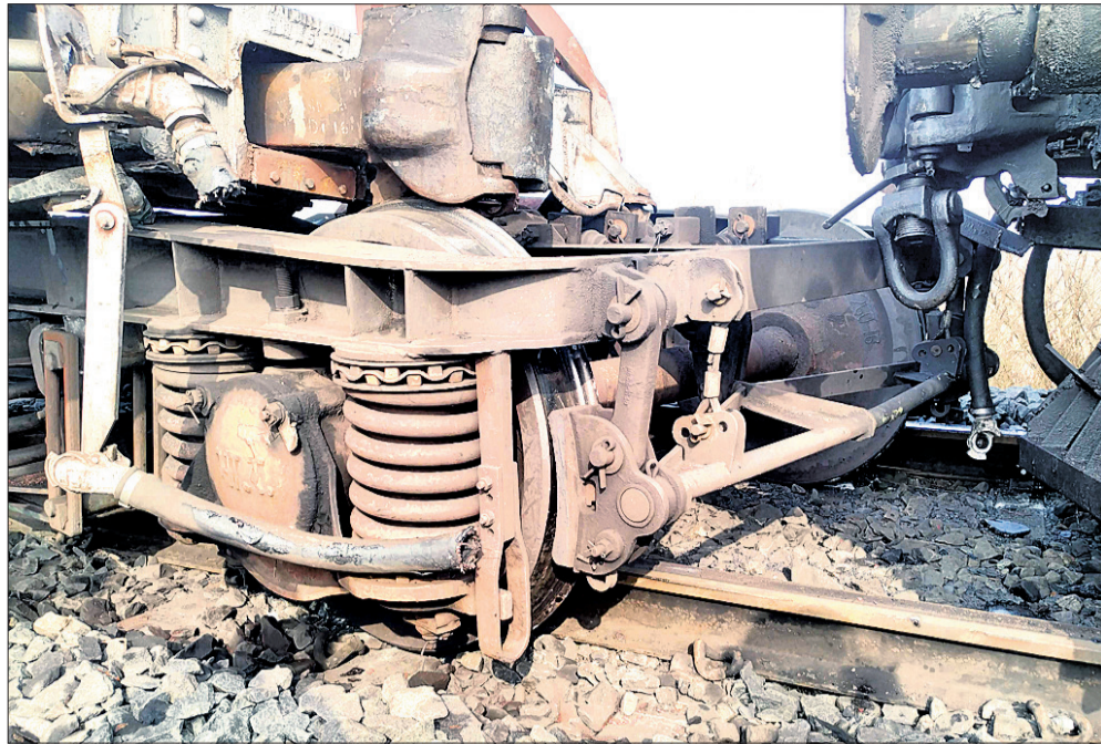
କଟକରେ ଟ୍ରେନ୍ ଦୁର୍ଘଟଣା: ଲାଇନ୍‌ସ୍ପ୍ଲଟ ହୋଇଥିବା ଲାଇନ୍।