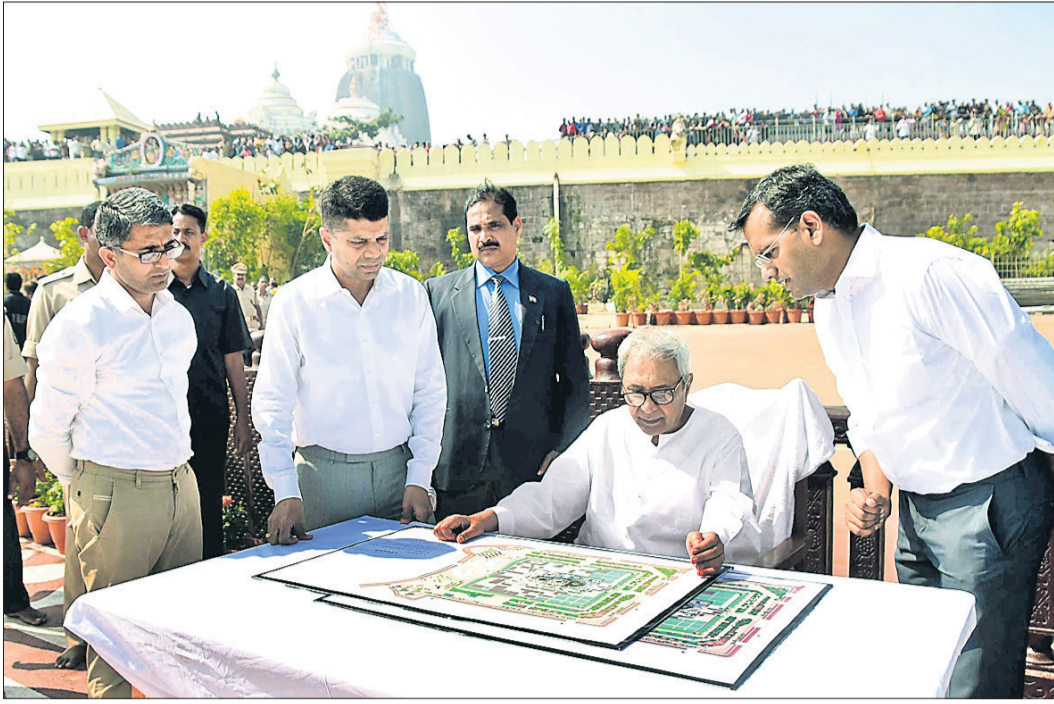
ବଡ଼ଦାଣ୍ଡରେ ମୁଖ୍ୟମନ୍ତ୍ରୀ ପ୍ରସ୍ତାବିତ ମଡେଲର ନକ୍ସା ଦେଖୁଛନ୍ତି । ନିକଟରେ ୫-ଟି ସରକାରୀ ଭାଗରେ ପୁରୀ ଜିଲ୍ଲାପାଳ ।