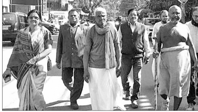
ଗୁରୁବାର ସମ୍ବଲପୁରରେ ରାଷ୍ଟ୍ରଧର୍ମ ବିଜୟ ପର୍ବଯାତ୍ରା।