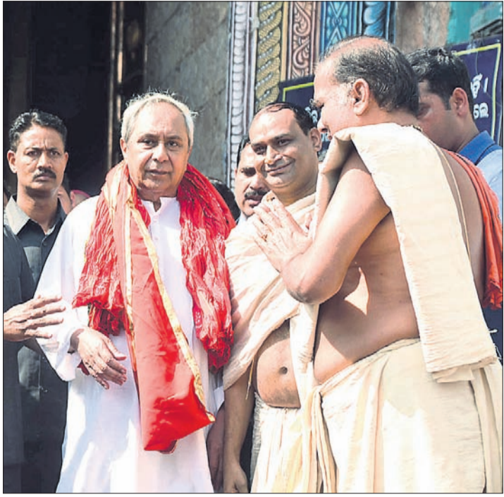
ମୁଖ୍ୟମନ୍ତ୍ରୀ ନବୀନ ପଟ୍ଟନାୟକ ମହାପ୍ରଭୁଙ୍କୁ ଦର୍ଶନ ସାରି ଶ୍ରୀମନ୍ଦିରକୁ ଯେଉଁଛନ୍ତି ।