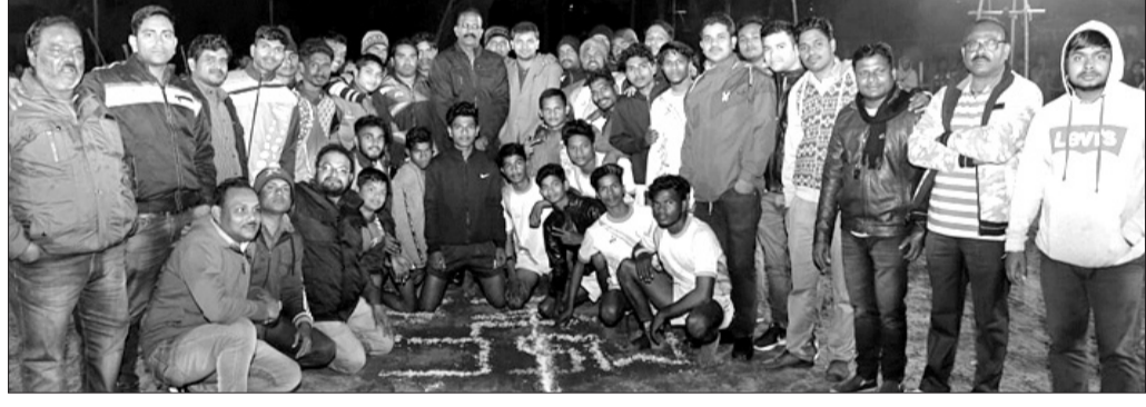
ସମ୍ବଲପୁର ବଡ଼ବଜାର କବାଡ଼ି ପଡ଼ିଆରେ ଅତିଥିଙ୍କ ସହ ଖେଳାକିମାମେ।

ଆକର୍ଷଣ ହୋଇଥିଲା। ରାଷ୍ଟ୍ରଧର୍ମ ବିଜୟ, ଜଳ, ଜଙ୍ଗଲ, ଜୀବଜନ୍ତୁ, ଗୋ ସୁରକ୍ଷା ଉଦ୍ଦେଶ୍ୟରେ ଏହି ପର୍ବଯାତ୍ରା ବାହାରିଛି। ପ୍ରତିଦିନ ସନ୍ଧ୍ୟାରେ ୨୭ କିଲୋମିଟର ଯାତ୍ରା କରୁଛନ୍ତି। ସମ୍ବଲପୁର ଡେକ୍ଟର୍ ଅନୁଷ୍ଠାନର ଆରତୀ ପଢ଼ାଇ ନେତୃତ୍ଵରେ ବିଜୟ ଯାତ୍ରାକୁ ସ୍ଵାଗତ ସମ୍ବର୍ଦ୍ଧନା କରାଯାଇଥିଲା।