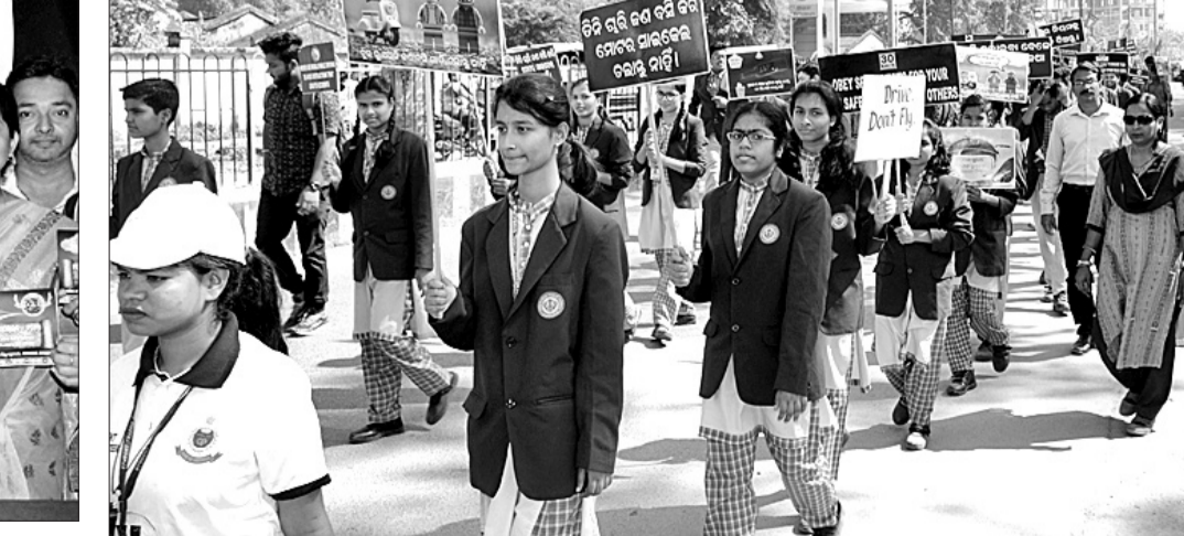
ଗୁରୁବାର ସମ୍ବଲପୁରରେ ସଡ଼କ ପୁରଣା ସଚେତନତା ଶୋଭାଯାତ୍ରା।