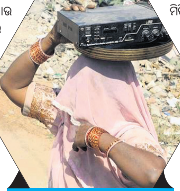
ଓଡ଼ିଶା ପୁକ୍ତ ଅଭିଯାନ

ଜୟପୁର(ରାଜସ୍ଥାନ): ମହିଳାମାନେ ଆଉ ଓଡ଼ିଶା/ପର୍ଯ୍ୟା ଚଳେ ରହିବେନି। ରାଜ୍ୟରେ ଲିଙ୍ଗଚର୍ଚ୍ଚା ବୈଷମ୍ୟକୁ ଦୂର କରି ମହିଳାଙ୍କୁ ସମ୍ମତ କରିବା ପାଇଁ ରାଜସ୍ଥାନରେ 'ଓଡ଼ିଶା ପୁକ୍ତ' ଅଭିଯାନ ଆରମ୍ଭ ହୋଇଛି। ମୁଖ୍ୟମନ୍ତ୍ରୀ ଅଶୋକ ଗେହଲଟ୍‌ଙ୍କ ଆହ୍ୱାନକ୍ରମେ ଜିଲାପାଳଙ୍କ ଦ୍ୱାରା ବିଭିନ୍ନ ଜିଲ୍ଲାରେ ଜିଲାପାଳଙ୍କ ମାଧ୍ୟମରେ ଏହି କାର୍ଯ୍ୟକ୍ରମ ଆରମ୍ଭ ହୋଇଛି। ପୁରୁଣା ପର୍ଯ୍ୟା ପ୍ରଥାକୁ ଲୋପ କରି ମହିଳାମାନେ ପୁରୁଷଙ୍କ ଭଳି ଯେପରି ଶିକ୍ଷିତ ଏବଂ ଆତ୍ମନିର୍ଭରଶୀଳ ହୋଇ ନିଜର ଅଧିକାର ସାଧ୍ୟ କରୁଥିବେ ସେଥିପାଇଁ ସଚେତନ କରାଯାଉଛି। ପୂର୍ବରୁ ବିକାଶରେ ଜିଲ୍ଲାରେ ଏହି ଅଭିଯାନ ଆରମ୍ଭ ହୋଇଥିବାବେଳେ ନିକଟରେ ଜୟପୁରରେ ମଧ୍ୟ ଏହାର ଶୁଭାରମ୍ଭ ହୋଇଛି। ଏହି ଅଭିଯାନ ମାଧ୍ୟମରେ ରାଜସ୍ଥାନରେ ହେବାକୁ ଥିବା ପଞ୍ଚାକ୍ଷର ନିର୍ବାଚନରେ ମଧ୍ୟ ମହିଳାମାନେ ବିନା ଓଡ଼ିଶାରେ ଆସି ଭୋଟ ଦେବାକୁ ଉତ୍ସାହିତ କରାଯିବ ବୋଲି ଜଣାପଡ଼ିଛି। ଶ୍ୱେତ୍‌ସ୍ୱାପ୍, ସୋସିଆଲ୍ ମିଡ଼ିଆ, ସ୍କୁଲରେ ଗାର୍ଲ୍ ଏବଂ ମାମା ମଞ୍ଚ, ଗାଁରେ ମହିଳା ଗ୍ରାମ ସଭା ମାଧ୍ୟମରେ ସଚେତନ କରାଯିବ। ସେହିପରି ସ୍କୁଲରେ ବାଲ୍‌ସଭା ମାଧ୍ୟମରେ ମା' ବାପା ଓ ଅଭିଭାବକଙ୍କୁ ଏ ନେଇ ସଚେତନ କରାଯିବ। ଏଥିପାଇଁ ମହିଳା ସରପଞ୍ଚମାନଙ୍କ ପାଇଁ ଏକ ଓରିଏଣ୍ଟେସନ୍ ପ୍ରୋଗ୍ରାମ ଆୟୋଜନ କରାଯିବ। ଯଦ୍ୱାରା ସରପଞ୍ଚମାନେ ଗ୍ରାମସଭା, ଉତ୍ସବ ଓ ବାଲ୍‌ସଭା ସମୟରେ ଅନ୍ୟ ମହିଳାଙ୍କୁ ସଚେତନ କରିପାରିବେ। ଏହି ଅଭିଯାନକୁ ସଫଳ କରିବା ପାଇଁ ଶିକ୍ଷା, ସ୍ୱାସ୍ଥ୍ୟ, ମହିଳା ଓ ଶିଶୁ ବିକାଶ ଆଦି ବିଭାଗକୁ ମଧ୍ୟ ସାମିଲ କରାଯିବ। ଅଭିଯାନର ସଫଳତା ବିଚାର ମହିଳାଙ୍କ ସହ ପୁରୁଷଙ୍କ ଭୂମିକା ମଧ୍ୟ ଗୁରୁତ୍ୱପୂର୍ଣ୍ଣ। ତେଣୁ ଉଭୟଙ୍କୁ ସଚେତନ କରିବା ପାଇଁ ନିଶ୍ଚିତ ନିଆଯାଇଛି।