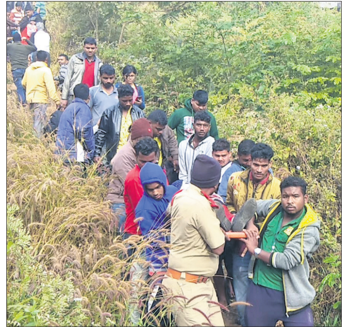
ଜଣେ ଆହତଙ୍କୁ ଉଦ୍ଧାର କରି ନିଆଯାଉଛି।

ଦୁର୍ଘଟଣା ପରେ ୫ ଟ୍ରେନ୍‌ର ଗତିପଥ ବଦଳିଲା। ଏହି ଦୁର୍ଘଟଣା ଯୋଗୁ ୫ଟି ଟ୍ରେନ୍‌ର ଗତିପଥରେ ପରିବର୍ତ୍ତନ କରାଯାଇଛି।