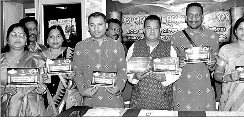
ସମ୍ବଲପୁର ବାରସୁରେନ୍ଦ୍ର ସାଏ ମାର୍ଗଶ୍ରବଣ ତ୍ରିବେଣୀ ସମ୍ମିଳନୀ କକ୍ଷରେ ଆୟୋଜିତ ଖବରଦାତା ସମ୍ମିଳନୀରେ ଗୁରୁବାର ପଣ୍ଡିମାଞ୍ଚଳ ବିକାଶ ମଞ୍ଚ କର୍ମକର୍ତ୍ତାମାନେ ଜାତୀୟ ସମ୍ବଲପୁରୀ ସମ୍ବେଦକ କାର୍ଯ୍ୟକ୍ରମ ପୁସ୍ତିକା ବେଞ୍ଚାଉଛନ୍ତି।