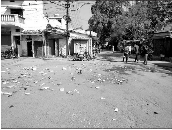
ହାରାକୁଦ ସହର ରାସ୍ତାରେ ପଡି ରହିଥିବା ଅଳିଆ।