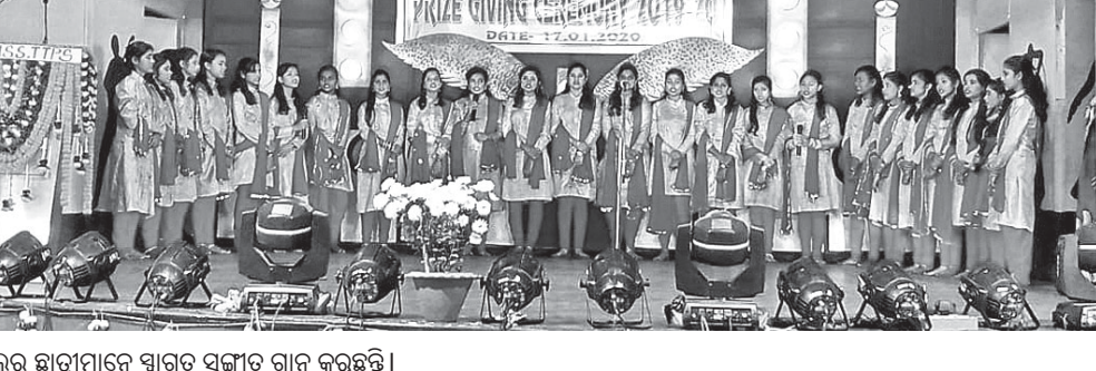
ସ୍କୁଲର ଛାତ୍ରୀମାନେ ସାଗର ସଙ୍ଗୀତ ଗାନ କରୁଛନ୍ତି।