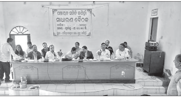
ବୈଠକରେ ଉପସ୍ଥିତ ଅତିଥିମାନେ।

ଲୋକ ପ୍ରତିନିଧି ଓ ବିଭାଗୀୟ ଅଧିକାରୀ ଉପସ୍ଥିତ ଥିଲେ। କାହିଁକି ଗ୍ରାମାଞ୍ଚଳ ଉନ୍ନୟନ ବିଭାଗ ଅଧିକାରୀ, ଉଦ୍ୟାନ ବିଭାଗ ସମେତ ଅନ୍ୟମାନେ ବୈଠକରେ ଯୋଗଦାନ କରୁନାହାନ୍ତି ସେ ନେଇ ସରପଞ୍ଚ ଓ ସମିତିସଭ୍ୟମାନେ ପ୍ରଶ୍ନ କରିଥିଲେ। ପରେ ରେକର୍ଡ଼ିଂ ନେଇ ଉକ୍ତ କର୍ତ୍ତୃପକ୍ଷଙ୍କ ସହିତ ରାଜ୍ୟ ସରକାରଙ୍କୁ ଅବଗତ ପାଇଁ ଦାବି କରାଯାଇଥିଲା। ଏ ସମ୍ପର୍କରେ ବିଡିଓ ଜେନା କହିଛନ୍ତି, ବୈଠକରେ ଉଦ୍‌ଦେଶ୍ୟ ପ୍ରକାଶ ପାଇଥିଲା। ସମାଧାନ ପାଇଁ ଚିଠି କରାଯାଇ କାର୍ଯ୍ୟାନୁଷ୍ଠାନ ନିଆଯିବ।