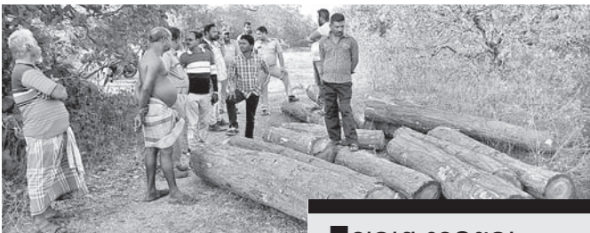
ଡେକାନାଲ ଅଧିକ, ୧୭।୧

ଡେକାନାଲ ସଦର ରେଞ୍ଜି ଡାକ୍ତରକୋଟ ଗ୍ରାମ ନିକଟ ଶାମୁକାତଳା ଶାଳ ଜଙ୍ଗଲରେ କାଠମାଫିଆ ସକ୍ରିୟ ହୋଇଉଠିଛି। ବନ ବିଭାଗ ଗୁଣ୍ଡ ପାଲଟିଥିବାବେଳେ ଏହାର ସୁଯୋଗରେ ଜଙ୍ଗଲରୁ ମୂଲ୍ୟବାନ କାଠ ଚାଲାଣ କରାଯାଇଛି। ଶୁକ୍ରବାର ଅପରାହ୍ନରେ ଗ୍ରାମନିକଟରେ ଶାଳ କାଠଗୁଡ଼ିକ ୫୫୦୦୦ ଟଙ୍କାର କାଠମାଫିଆ ସକ୍ରିୟ ହୋଇଉଠିଛି। ବନ ବିଭାଗ ଜିମା ଦେଇଛନ୍ତି। ଆଞ୍ଚଳିକ ବିଶିଷ୍ଟ ୮୦ ଘନଫୁଟର ୨୦ଖଣ୍ଡ ଲଗୁ ଜବତ କରାଯାଇଛି। ଗ୍ରାମବାସୀଙ୍କ କହିବା କଥା, ମାଫିଆମାନେ ଟ୍ରକ୍ ଯୋଗେ କାଠ ଚାଲାଣ କରୁଥିବା ସୂଚନା ପାଇ ବନ ବିଭାଗକୁ ଅବଗତ କରାଯାଇଥିଲା। ହେଲେ ଏହାକୁ କେହି ଗୁରୁତ୍ୱ ଦେଇ ନ ଥିଲେ। ଫଳରେ ସେମାନେ ବାଧ୍ୟ ହୋଇ ଘଟଣାସ୍ଥଳକୁ ଯାଇଥିଲେ।