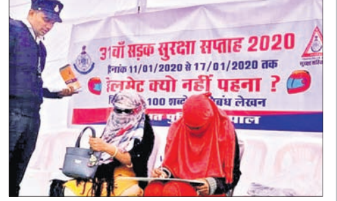
କୌତୁହଳ ଜାତ ହୋଇଥିବାବେଳେ ଲୋକଙ୍କୁ ସଚେତନ କରାଇବା ଲାଗି ଏହା ଉଦ୍ଦିଷ୍ଟ ବୋଲି ପୋଲିସ୍ କହିଛି।

ଭୋପାଳ: ନ୍ୟାଶନାଲ୍ ହାଇଡ୍ରୋ ଅଥରିଟି ଅଫ୍ ଇଣ୍ଡିଆ(ଏନ୍‌ଏଚ୍‌ଏଆଇ) ଦ୍ୱାରା ପାଳନ କରାଯାଉଛି ସବୁଜ ପୁରସ୍କା ସମ୍ବନ୍ଧରେ ଏହି ଅବସରରେ ମଧ୍ୟପ୍ରଦେଶ ଭୋପାଳ ପୋଲିସ୍ ଦ୍ୱାରା ଏକ ଅଭିନବ ଉପାୟ ପାଳନ କରିବାର ପ୍ରୟାସ କରାଯାଇଛି। ବୁକ୍‌ଚିଟିଆ ଯାନରେ ଯାଉଥିବା ଲୋକେ ଯଦି ହେଲ୍‌ମେଟ୍ ନ ପିନ୍ଧିଥିବେ ଏବେ ସେମାନଙ୍କୁ ୧୦୦ ଶହ ମଧ୍ୟରେ ରତନା ଲେଖିବାକୁ ପଡ଼ିବ ବୋଲି ଭୋପାଳ ପୋଲିସ୍ କହିଛି। ଏହି ରତନାରେ ସେମାନେ କାର୍ତ୍ତିକ ମୋଟର ଯାନ ନିୟମ ଉଲ୍ଲଙ୍ଘନ କରିଛନ୍ତି ଆଉ ହେଲ୍‌ମେଟ୍ ନ ପିନ୍ଧି ଗାଡ଼ି ଚଳାଇଛନ୍ତି ତାହା ବର୍ଣ୍ଣନା କରିବେ ବୋଲି ପୋଲିସ୍ କହିଛି। ଏଭଳି ପ୍ରୟାସକୁ ନେଇ