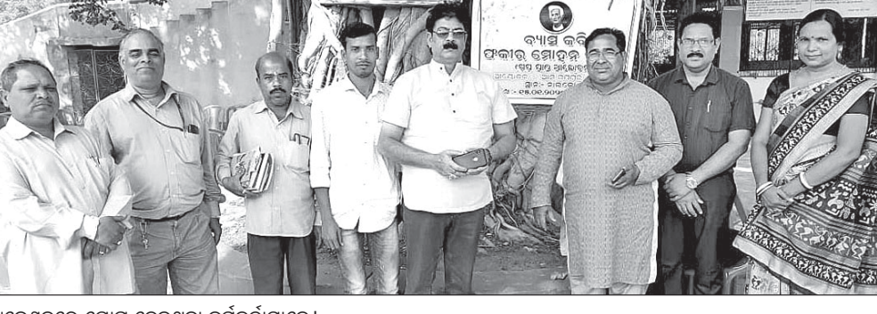
ଅଧିବେଶନରେ ଯୋଗ ଦେଇଥିବା କର୍ମକର୍ତ୍ତାମାନେ।