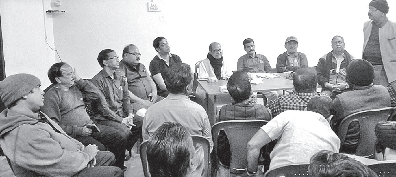
ବୈଠକରେ ବିଦ୍ୟୁତ୍ ଉପଭୋକ୍ତା ସୁରକ୍ଷା ମଞ୍ଚର କର୍ମକର୍ମୀମାନେ।