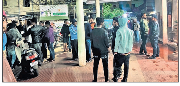
ଅନୁଗୋଳ ଅଫିସ, ୧୭।୧

ଅନୁଗୋଳ ଜିଲା ମୁଖ୍ୟ ଚିକିତ୍ସାଳୟ ପୁଣି ବିବାଦକୁ ଠେଲି ହୋଇଯାଇଛି। ଗୁରୁତର ବିକଳିତ ରାତିରେ ସତ୍ତୁକ ବୁଝିତଗଣରେ ପ୍ରାଣ ହରାଇଥିବା ଜଣେ ବ୍ୟକ୍ତିଙ୍କ ମୃତଦେହ ବ୍ୟବଚ୍ଛେଦ ପାଇଁ ରଖାଯିବା ବେଳେ ଶବରୁହ ଚାରି ନ ମିଲିବାକୁ ପ୍ରାୟ ଦେଢ଼ ଘଣ୍ଟାକାଳ ତାଙ୍କ ସମ୍ପର୍କୀୟଙ୍କୁ ଅପେକ୍ଷା କରିବାକୁ ପଡ଼ିଥିଲା। ଏହାକୁ ନେଇ ସମ୍ପର୍କୀୟମାନଙ୍କ ମଧ୍ୟରେ ଚାପା ଉତ୍ତେଜନା ବେଖୁବାକୁ ମିଳିଥିଲା। ଖବରପାଇ ପୋଲିସ ପହଞ୍ଚି ବୁଝାଶୁଝା କରିବା ସହ ତାଙ୍କ ଭଙ୍ଗାଯାଇ ମୃତଦେହ ରଖାଯିବା ପରେ ଲୋକମାନେ ଶାନ୍ତ ପଡ଼ିଥିଲେ। ତେବେ ଯାଅ ବେଳେ ସୁଇପର ଚାରି ନେଇ ଚାଲିଯାଇଥିବା ଜଣାପଡ଼ିଥିବାବେଳେ ବିରୋଧରେ କାର୍ଯ୍ୟାନୁଷ୍ଠାନ ଗ୍ରହଣ କରାଯିବ ବୋଲି ଏଡିଏମ୍ ଟେଡିକାଲ