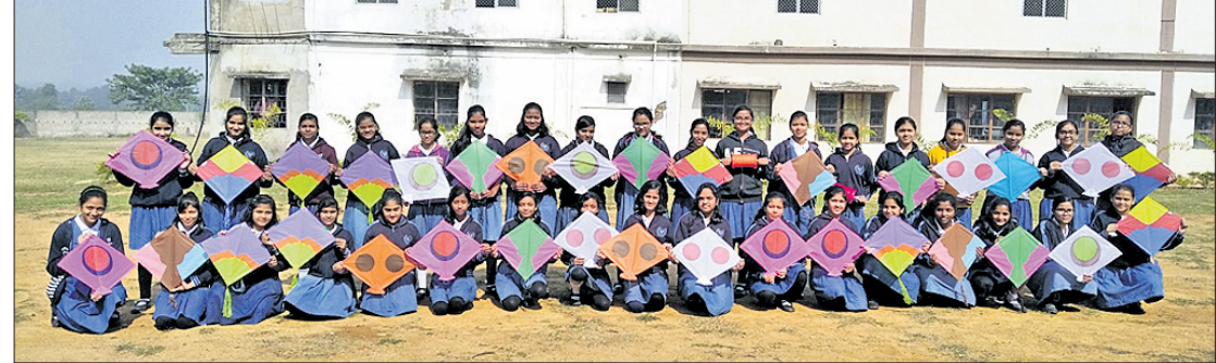
ଲିଟିଲହାର୍ଟ୍ରେ ଗୁଡ଼ିଉଡା କାର୍ଯ୍ୟକ୍ରମ ଅବସରରେ ଛାତ୍ରୀମାନେ।

ଅନୁଗୋଳ ଅଫିସ, ୧୭।୧: ଅନୁଗୋଳସ୍ଥିତ କୁଲୁଠ ଠାରେ ଲିଟିଲହାର୍ଟ୍ ଟଡଲରସ୍ ଏକାଡେମୀରେ ମକରପର୍ବ ପାଳିତ ହୋଇଯାଇଛି। ଏହି ଅବସରରେ ସ୍କୁଲ ଶିକ୍ଷୟିତ୍ରୀ, ଶିକ୍ଷକମାନେ