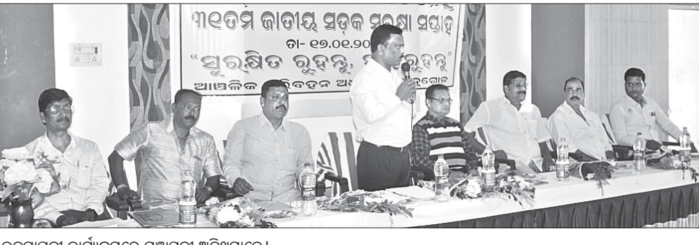
ଉଦ୍‌ଘାଟନା କାର୍ଯ୍ୟକ୍ରମରେ ମଞ୍ଚାସନା ଅତିଥିମାନେ।

ରାଷ୍ଟ୍ର ଦୁର୍ଦ୍ଦଶାର ନିରାକରଣ ସମ୍ପର୍କରେ ସଚେତନତା ସୃଷ୍ଟି କରି ଲୋକମାନଙ୍କ ଧନଜୀବନ ସୁରକ୍ଷିତ କରିବା ଉଦ୍ଦେଶ୍ୟରେ ଶୁକ୍ରବାର ଟ୍ରକ ମାଲିକ ସଂଘ ସଭାଗୃହଠାରେ ୩୧ ତମ ଜାତୀୟ ସଡ଼କ ସୁରକ୍ଷା ସପ୍ତାହ ପାଳିତ ହୋଇଯାଇଛି। ଚଳିତମାସ ୧୧ ତାରିଖରୁ ଆଞ୍ଚଳିକ ପରିବହନ କାର୍ଯ୍ୟାଳୟ ଦ୍ୱାରା