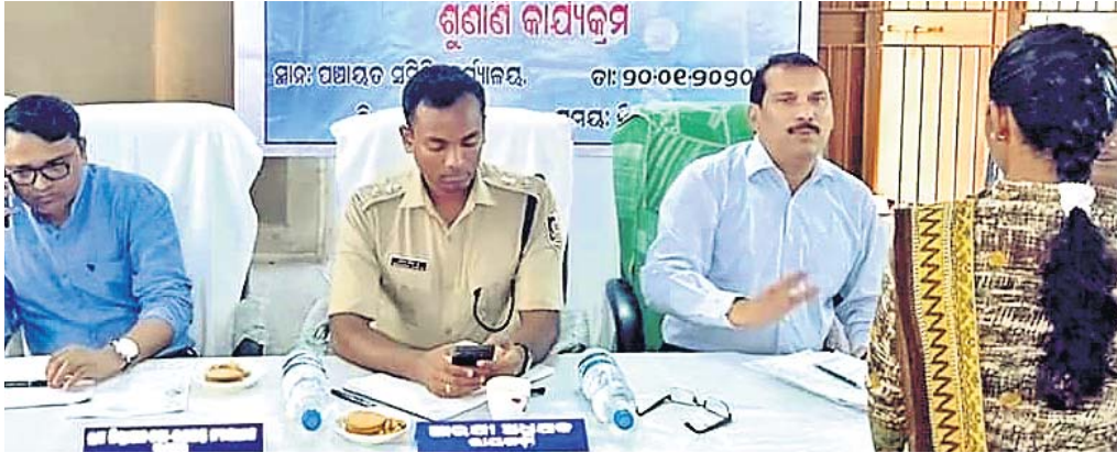
ଜଣେ ମହିଳାଙ୍କଠାରୁ ଜିଲାପାଳ ଅଭିଯୋଗ ଶୁଣୁଛନ୍ତି ।