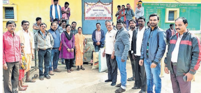
ମାଣ୍ଡିଆ ମଣ୍ଡି ଉଦ୍‌ଘାଟନା କାର୍ଯ୍ୟକ୍ରମରେ ଉପସ୍ଥିତ ଅତିଥିମାନେ।

ମାଣ୍ଡିଆ ଗଣ ଓ ଗଣାଙ୍କୁ ପ୍ରୋତ୍ସାହନ ଦେବାକୁ ରାଜ୍ୟ ସରକାର ଗୁରୁତ୍ୱାହୀନ ପ୍ରାଥମିକ ଶିକ୍ଷା ପ୍ରଦାନ ପାଇଁ ଖୋଲିଲା ମାଣ୍ଡିଆ ମଣ୍ଡି କୁଇଣ୍ଟାଲକୁ ୩ ହଜାର ୧୫୦ ଟଙ୍କା ପ୍ରଦାନ କରିଛନ୍ତି।