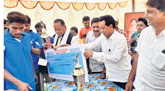
ମନ୍ତ୍ରୀ ଓ ବିଧାୟକ ବିଜୟୀ ଦଳକୁ ପୁରସ୍କୃତ କରୁଛନ୍ତି ।