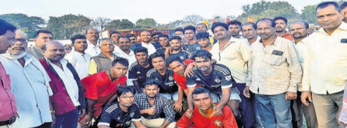
ଅତିଥିଙ୍କ ସହ ଖେଳାଳିମାନେ।

ଗୋଲ କରି ପାରି ନ ଥିବାରୁ ପେନାଲ୍ଟି ସ୍ତର ଆଉଟ୍ କରାଯାଇଥିଲା।