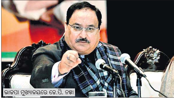
ଭାଜପା ପୁଞ୍ଜାମଳରେ ଜେ.ପି. ନନ୍ଦା

ନୂଆଦିଲ୍ଲୀସ୍ଥିତ ଭାଜପା ପୁଞ୍ଜାମଳରେ ସୋମବାର ଅପରାହ୍ଣ ୨ଟା ୩୦ରେ ଜେ.ପି. ନନ୍ଦାଙ୍କୁ ଦଳର ନୂଆ ରାଷ୍ଟ୍ରାଧ୍ୟକ୍ଷ ଅଧ୍ୟକ୍ଷ ଭାବେ ଘୋଷଣା କରାଯାଇଛି। ଏହାସହ ଦଳରେ ବିବାୟା ରାଷ୍ଟ୍ରାଧ୍ୟକ୍ଷ ଅଧ୍ୟକ୍ଷ ଅଧିକାରୀ ଅଧ୍ୟକ୍ଷ ନନ୍ଦା ନିର୍ଦ୍ଦେଶରେ ଦଳର ପୁଞ୍ଜାମଳ ଭାବେ ଦାୟିତ୍ୱ ଗ୍ରହଣ କରିବା ପରେ ଭାଜପା ପୁଞ୍ଜାମଳର ବାହାରେ ଉତ୍ତର ମାହୋଲ ଦେଖିବାକୁ ମିଳିଥିଲା। ପରେ ପ୍ରଧାନମନ୍ତ୍ରୀ ନରେନ୍ଦ୍ର ମୋଦି ଦଳାଧ୍ୟକ୍ଷ ପୁଞ୍ଜାମଳରେ ତାଙ୍କୁ ଅଭିନନ୍ଦନ ଜଣାଇବା ସହ ସମର୍ଥନ କରିଥିଲେ। ଏହି ଅବସରରେ ପ୍ରଧାନମନ୍ତ୍ରୀ କହିଥିଲେ, ନନ୍ଦାଙ୍କ ନେତୃତ୍ୱରେ ଭାଜପା ସଫଳତାର ନୂଆ ଶୀର୍ଷକୁ ଖର୍ଚ୍ଚ କରିବ। ସେହିପରି ବିବାୟା ଅଧ୍ୟକ୍ଷ ତଥା ସ୍ୱରାଷ୍ଟ୍ରମନ୍ତ୍ରୀ ଅଧିକାରୀ ମଧ୍ୟ ତାଙ୍କୁ ସ୍ୱାଗତ କରିଥିଲେ। ଶାହା କହିଥିଲେ, ନନ୍ଦାଙ୍କ ନେତୃତ୍ୱରେ ଦଳ ଅଧିକ ଶକ୍ତିଶାଳୀ ଓ ସଜ୍ଜିତ ହେବ। ଏହି ଅବସରରେ