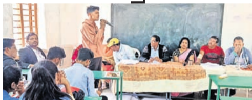
କଣ୍ଠେ ହାତ୍ର ଗୀତ ଗାଉଛନ୍ତି।

ଉପଖଣ୍ଡପ୍ରଧାନ ସାଧାରଣ ତନ୍ତ୍ର ଦିବସ ପାଳନ ଅବସରରେ ଉତ୍ତରକୋଟ ସରକାରୀ ବାଳିକା ବିଦ୍ୟାଳୟରେ ସଙ୍ଗୀତ ପ୍ରତିଯୋଗିତା ଅନୁଷ୍ଠିତ ହୋଇଛି।