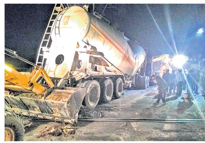
ରେଳ ଧାରଣାରୁ ଟ୍ୟାକ୍ଟରକୁ ହଟାଇବାକୁ ଚେଷ୍ଟା କରାଯାଉଛି ।

ରାୟଗଡ଼ା ଜିଲା ମୁନିଗୁଡ଼ା ନିକଟସ୍ଥ ବାଧାପ୍ରାପ୍ତ ରେଳଫାଟକକୁ ଏକ ଆଲୁମିନିୟମ ବୋହେଇ ଟ୍ୟାକ୍ଟର (ଓଡ଼ିଏ ୫୫୫୪୪୪) ଧକ୍କା ଦେଇଛି । ଫଳରେ ବିଶାଖାପାଟଣା-ରାୟପୁର ଅପଲାଇନରେ ଟ୍ରେନ ଚଳାଚଳ ବାଧାପ୍ରାପ୍ତ ହୋଇଛି । ଏଥିରେ କେହି ମୃତ୍ୟୁ ହେଉ ନାହିଁ । ଦୁର୍ଘଟଣା ପରେ ଟ୍ୟାକ୍ଟର ଟ୍ରାକ୍‌ଭର ଫେରାର ହୋଇଯାଇଛି । ଲାଞ୍ଜିନୀ ବୋହେଇ ଟ୍ରାକ୍ ଟ୍ୟାକ୍ଟର ବିଶାଖାପାଟଣା ଅଭିଯୁକ୍ତ ଯାଉଥିଲା । ଖାମରଗୁଡ଼ା ନିକଟରେ ଭାରସାମ୍ୟ