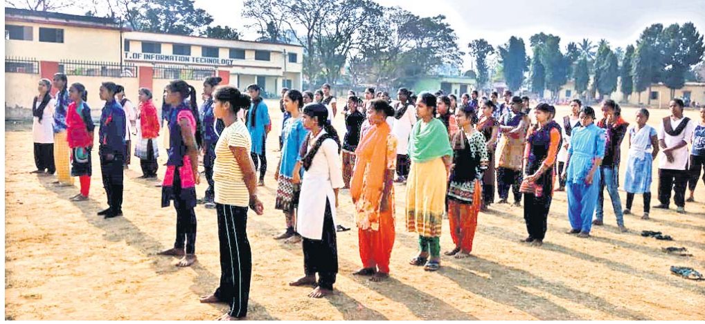
ଶିବିରରେ ସାମିଲ ହୋଇଥିବା ଛାତ୍ରମାନେ ।

ଜଙ୍ଗଲ ଜମିକୁ ସମ୍ପୂର୍ଣ୍ଣ ବିନିଯୋଗ କିଭଳି କରାଯିବ ତା' ଉପରେ ଏକ ଦାବିପତ୍ର ତହସିଲଦାରଙ୍କୁ ଆଗାମୀ ବୈଠକରେ ପ୍ରଦାନ କରାଯିବ ବୋଲି ବୈଠକରେ ପରିଷଦ ତରଫରୁ ନିଷ୍ପତ୍ତି ନିଆଯାଇଛି ।