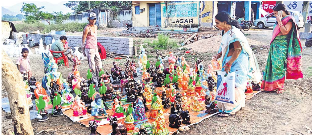
ରାସ୍ତା କଡ଼ରେ ବିକ୍ରି କରାଯାଉଛି ମୂର୍ତ୍ତି।

ରାଜ୍ୟ ବାହାର କୁସାରଙ୍କ ରାୟଗଡ଼ାରେ ବେଶ୍ ଚାହିଦା । ରାୟଗଡ଼ାରେ ପ୍ରତି ବର୍ଷ ପୂଜା ପାର୍ବଣ ସମୟରେ ସେମାନଙ୍କୁ ଦେଖିବାକୁ ମିଳିଥାଏ । ସେମାନେ ପୂଜାର କିଛିମାସ ପୂର୍ବରୁ ଆସି ଏଠାରେ ବ୍ୟବସାୟ କରି ବେଶ୍ ଲାଭବାନ୍ ହୋଇଥାନ୍ତି । ଏଇ ଆଖିା ନେଇ ରାଜସ୍ଥାନର ଏକ କୁସାର ପରିବାର ଏବଂ ତାଙ୍କ ସମ୍ପର୍କୀୟ ପ୍ରତିବର୍ଷ ପରି ଚଳିତ ବର୍ଷ ମଧ୍ୟ ରାୟଗଡ଼ା ଆସି ବ୍ୟବସାୟ କରୁଛନ୍ତି । ରାୟଗଡ଼ାରେ ଅନେକ କୁସାର ଥିଲେ ମଧ୍ୟ ସେମାନଙ୍କ କାରୁକାର୍ଯ୍ୟ ଅତି ନିଆରା । ଏଠାରେ କୁସାରମାନେ ପ୍ଲାଷ୍ଟର ଅଫ ପ୍ୟାରିସ ବ୍ୟବହାର କରନ୍ତି, ମାଟି ବ୍ୟବହାର କରନ୍ତି ନାହିଁ । ଏହା ପରିବେଶକୁ ପ୍ରଦୂଷଣ କରେ ନାହିଁ । ବିଭିନ୍ନ ଦେବଦେବୀଙ୍କ ମୂର୍ତ୍ତିଠାରୁ ଆରମ୍ଭ କରି ଘରସଜା ସାମଗ୍ରୀ କଳସ , ମୟୂର , କୁର୍ମି , ଶୁଆ , ଲାଫିଙ୍ଗ ବୃକ ବିକ୍ରି କରିଥାନ୍ତି । ସେମାନଙ୍କର ସବୁଠାରୁ ବେଶ୍ ଆକର୍ଷଣ ହେଉଛି ପାଳରେ ନିର୍ମିତ ଘୋଡ଼ା । ଏହା ବେଶ୍ ଚାହିଦା ଥିବାରୁ