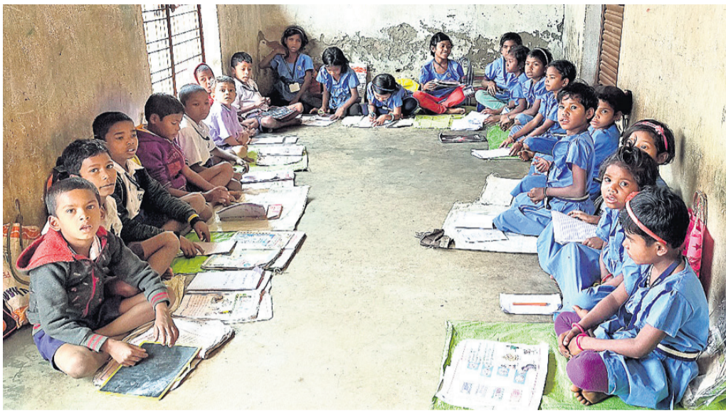
ବାରଣସୀରେ ପିଲାଙ୍କ ପାଠ ପଢ଼ା ଚାଲିଛି।

ଗ୍ରାମାଞ୍ଚଳରେ ରୁଣ୍ଡାମୂଳ ଶିକ୍ଷା ଦିବାଳୀ ପାଇଁ ରାଜ୍ୟ ସରକାର ବିଭିନ୍ନ ଯୋଜନା କାର୍ଯ୍ୟକାରୀ କରୁଛନ୍ତି। କିନ୍ତୁ ଏହାର ସଫଳ ରୂପାୟନ ହୋଇପାରୁନି କେଉଁଠି ପିଲାଙ୍କ ଚୁକ୍ତିନାମରେ ଆବଶ୍ୟକ ସଂଖ୍ୟକ ଶିକ୍ଷକ ନାହାନ୍ତି।