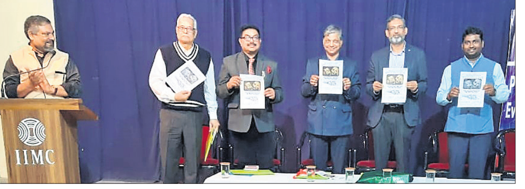
ଅତିଥିମାନେ ପୋଷ୍ଟର ଉନ୍ମୋଚନ କରୁଛନ୍ତି।

ଆଲୋଚନାଚକ୍ରରେ ବକ୍ତା ଭାବେ ଯୋଗଦେଇ ସେ ଏହା କହିଛନ୍ତି। ଭାରତୀୟ ଲୋକସମ୍ପର୍କ ସମାଜ ସହଯୋଗରେ ଆୟୋଜିତ ଏହି କାର୍ଯ୍ୟକ୍ରମରେ ଅନ୍ୟତମ ବକ୍ତା ଭାବେ