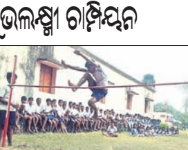
କାମାକ୍ଷାନଗର, ୨୨।୧(ଡି.ଏନ.ଏ.): କାମାକ୍ଷାନଗର ବ୍ଲକ୍ ବାଲିଗୋରଡ଼ଗୁଡ଼ି ମୁଖ୍ୟ ମଲ୍ଲିକ ହାଲସ୍କୁଲର ବାର୍ଷିକ କ୍ରୀଡ଼ା ପ୍ରତିଯୋଗିତା ମଙ୍ଗଳବାର ଉଦ୍‌ଘାଟିତ ହୋଇଯାଇଛି।