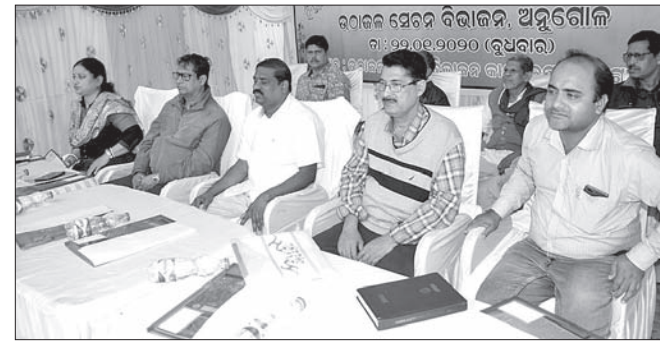
କାର୍ଯ୍ୟକ୍ରମରେ ମଞ୍ଚାସନ ବିଧାନ ସଭା ସଦସ୍ୟମାନେ।