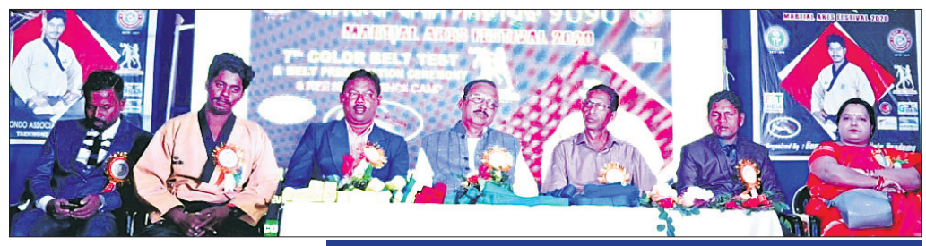
ସାମରିକ କଳା ମହୋତ୍ସବ।