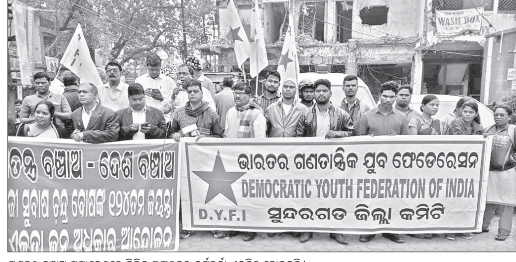
ଗଣତନ୍ତ୍ର ବଞ୍ଚାଅ ସମାବେଶରେ ବିଭିନ୍ନ ସଙ୍ଗଠନର କର୍ମକର୍ମୀ ଏକତ୍ର ହୋଇଛନ୍ତି।

ଦେଶର ୭୨ଶ ସଙ୍ଗଠନ ଶ୍ରମିକ, କୃଷକ, କ୍ଷେତ ମଜଦୁର, ଯୁବ ଛାତ୍ର ଓ ମହିଳାଙ୍କୁ ନେଇ ଗଠନ କରାଯାଇ ଥିବା ଜନଏକତା ଓ ଅଧିକାର ଆନ୍ଦୋଳନ ପକ୍ଷରୁ ଗୁରୁବାର ନେତାଙ୍କ ୧୨୪ ତମ ଜନ୍ମଜୟନ୍ତୀ ଅବସରରେ ଗଣତନ୍ତ୍ର ବଞ୍ଚାଅ ଦେଶ ବଞ୍ଚାଅ ଦାବୀ ଦିଆ ଯାଇଛି। ଏହି ଅବସରରେ ଦିଆ ଯାଇଛି, ଓଡ଼ିଶା କୃଷକ ସଭା, ଭାରତର ଗଣତାନ୍ତ୍ରିକ ଯୁବ ଫେଡେରେସନ(ଡିଏଫଏଫଆଇ) ଅଞ୍ଚଳ ଭାରତ ଗଣତାନ୍ତ୍ରିକ ମହିଳା ସମିତି (ଏଆଇଡିଟିଏସ), ଅଲ ଇଣ୍ଡିଆ ଲୟର୍ସ ୟୁନିୟନ(ଏଆଇଏଲ) ଭାରତର ଛାତ୍ର ଫେଡେରେସନ(ଏସଏଫଆଇ) ଅଲ ଇଣ୍ଡିଆ କ୍ଷେତ ମଜଦୁର ୟୁନିୟନ, ଅଲ ଇଣ୍ଡିଆ ଆଦିବାସୀ ମହାସଭାକୁ ନେଇ ଗଠିତ ଜନ ଏକତା, ଜନ ଅଧିକାର ମଞ୍ଚ ପକ୍ଷରୁ ରାଉରକେଲା ବ୍ୟାକ୍ଟି ଷ୍ଟାଣ୍ଡ ଠାରେ ନେତାଙ୍କ ପ୍ରତିଗୃହିରେ ମାଲ୍ୟାର୍ପଣ କରାଯାଇ ଥିଲା। ଏଠାରେ ଗଣତନ୍ତ୍ର ଓ ଦେଶ ବଞ୍ଚାଅ ଦାବିରେ