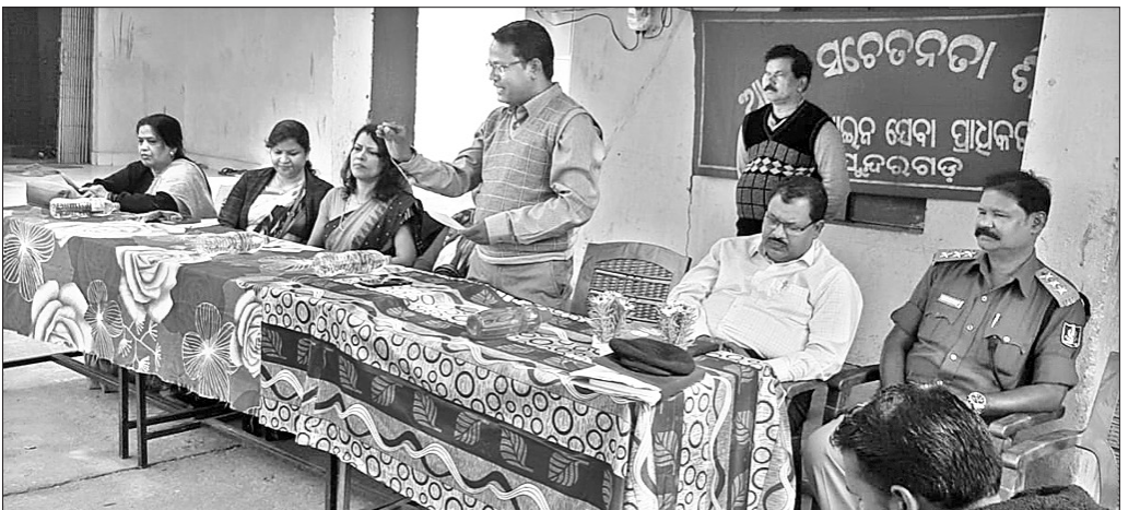
ବର୍ଷବସୁ ପରିଚାଳନା ସମ୍ପର୍କିତ ସଚେତନତା ଶିବିରରେ ମଞ୍ଚାଧୀନ ଅଧିକାରୀମାନେ ।