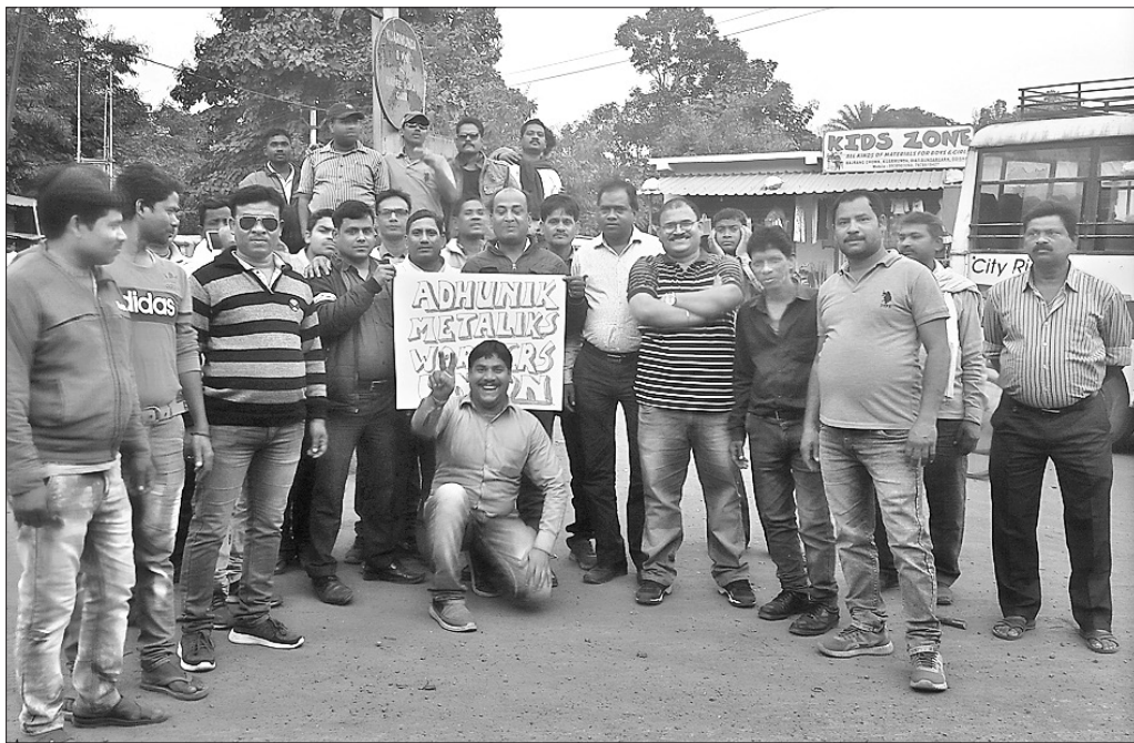
ଆଧୁନିକ କାରଖାନାକୁ ଲିବର୍ଟି ହାଉସ୍ ଅଧିଗ୍ରହଣ କରିବା ନେଇ ଶ୍ରମିକ, କର୍ମଚାରୀ ଶୋଭାଯାତ୍ରାରେ ବାହାରିଛନ୍ତି ।

ଆନ୍ଦୋଳନ ହୋଇଥିଲା । ନିକଟରେ ଉକ୍ତ କାରଖାନାକୁ ଅଧିଗ୍ରହଣ କରିବା ପାଇଁ ଲିବର୍ଟି ହାଉସ୍ ଘୋଷଣା କରିଥିଲା । କାରଖାନାର ବିଭିନ୍ନ ସମସ୍ୟା ନେଇ ଏନିଏସ୍‌ଏଲଏସ୍‌ରେ କେନ୍ଦ୍ର ଚାଲିଥିଲା । ଶେଷରେ ରୁଧିରୀ ଏନିଏସ୍‌ଏଲଏସ୍ (ନ୍ୟାସନାଲ କମ୍ପାନୀ ଲି) ଆପିଲେଟ୍ ଟ୍ରିଭ୍ୟୁନାଲ)ର ଏକ ଖଣ୍ଡପାଠ ଲିବର୍ଟି ହାଉସ୍‌କୁ ୪୨୦ କୋଟି ଟଙ୍କା ଜମା କରି ଉକ୍ତ କାରଖାନାକୁ ଗ୍ରହଣ କରିବା ପାଇଁ ନିର୍ଦ୍ଦେଶ ଦେଇଛନ୍ତି । ଅନୁରୂପ ଭାବେ ଲିବର୍ଟି ପକ୍ଷରୁ ପ୍ରାରମ୍ଭିକ ପର୍ଯ୍ୟାୟରେ