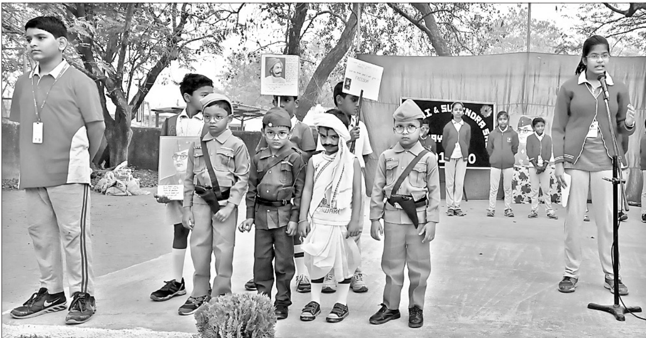
ସିନିୟର ବିଭାଗ ସ୍କୁଲରେ ଛାତ୍ରମାନେ ନେତାଜୀ, ସୁରେନ୍ଦ୍ର ସାଏ ବେଶଭୂଷାରେ ସଜିତ ହୋଇଛନ୍ତି।

ବରଗଡ଼ ଅପିଏ.୨୩୧: ଓଡ଼ିଶା କ୍ରିକେଟ ଆସୋସିଏସନ୍ ଆନୁକୁଲ୍ୟରେ ଭିଜନ ୨୦୨୨ର ଲିଗା ଆକ୍ଟିଭ୍ କ୍ଲବ୍ ସିନିୟର ପ୍ରତିଯୋଗିତା ପାଇଁ ଖେଳାଳି ପଞ୍ଜୀକରଣ ୨୪ତାରିଖ ଶୁକ୍ରବାରଠାରୁ ଆରମ୍ଭ ହେବ। ଏଥିରେ ଭାଗନେବା ପାଇଁ ଉତ୍ସୁକ କ୍ଲବ୍, ଅନୁଷ୍ଠାନ ଦଳ ଖେଳାଳିଙ୍କ ସମ୍ବନ୍ଧ ପ୍ରମାଣପତ୍ର, ହାତସ୍ଥଳ ପାସପୋର୍ଟ କେନ୍ଦ୍ର, ଆଧାର କାର୍ଡ, ଫଟୋ ସହିତ ପଞ୍ଜୀକରଣ କରାଯିବ।