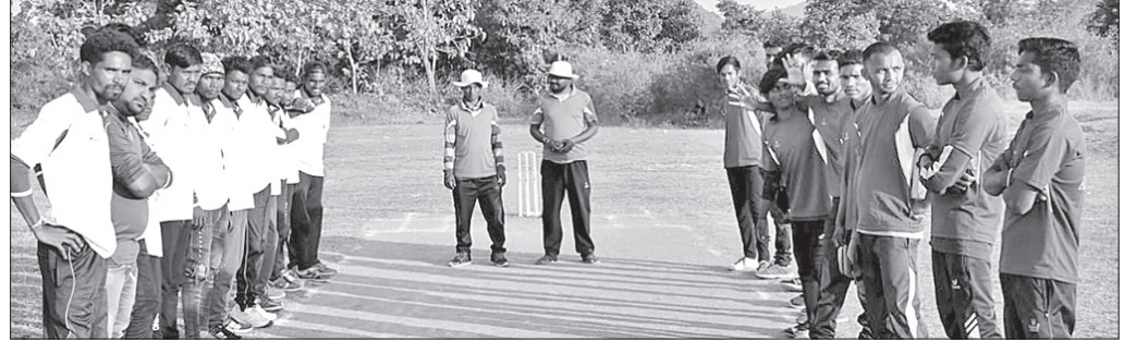
ଫାଇନାଲ ଖେଳରେ ଉପସ୍ଥିତ ଉଭୟ ଦଳର ଖେଳାଳି ।