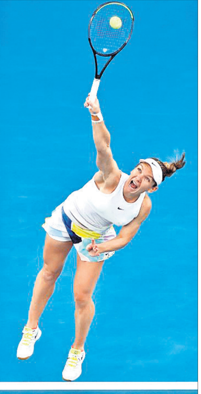
ସିଡିଏ ଅଧିକାରରେ ସିମୋନା ହାଲେପ।