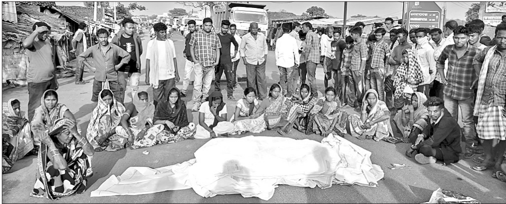
ମୋଟେରଠାରେ କ୍ଷତିପୂରଣ ଦାବିରେ ଗ୍ଲାନାୟ ଲୋକଙ୍କ ରାସ୍ତା ଅବରୋଧ।