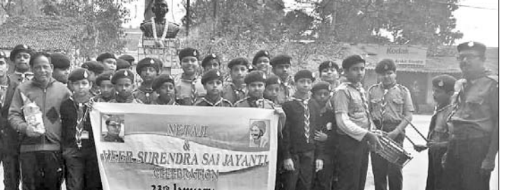
ଭାଉଟ ଛାତ୍ରାଛାତ୍ର ଶୋଭାଯାତ୍ରାରେ ଯାଉଛନ୍ତି ।