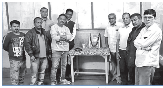
ନେତାଙ୍କ ଜୟନ୍ତୀ ଅବସରରେ ଉପସ୍ଥିତ କଂଗ୍ରେସ କର୍ମକର୍ମୀ।