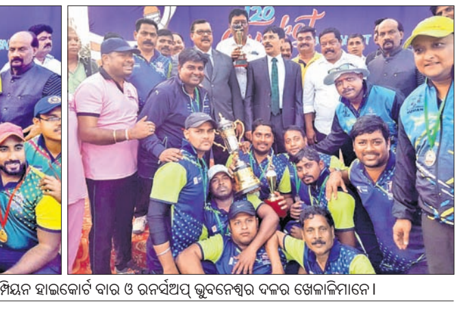
ଟ୍ରଫି ସହ ଅତିଥିକ ଗହଣରେ ଚାମ୍ପିୟନ ହାଇକୋର୍ଟ ବାର୍ ଓ ରନସ୍‌ଅପ୍ ଭୁବନେଶ୍ୱର ଦଳର ଖେଳାଳିମାନେ।