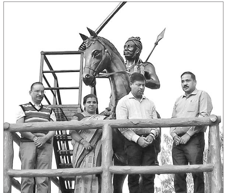
ବରଗଡ଼ ଜିଲାପାଳ ଓ ଅନ୍ୟ ଅଧିକାରୀ ବୀର ସୁରେନ୍ଦ୍ର ସାଏଙ୍କ ପ୍ରତିମୂର୍ତ୍ତିରେ ମାଲ୍ୟାର୍ପଣ କରୁଛନ୍ତି।