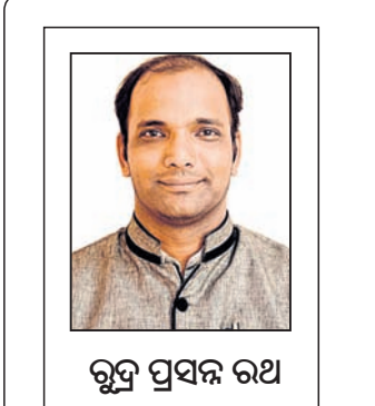
ଚୁକ୍ତି ପ୍ରସ୍ତର ରଥ

ଭାରତରେ ଏବେ ଖେଳାଯାଉଥିବା ଟେଷ୍ଟ ମ୍ୟାଚକୁ ୫ଟି ଷ୍ଟାଡ଼ିୟମରେ ଆୟୋଜନ କରିବା ପାଇଁ ଭାରତୀୟ କ୍ରିକେଟ୍ କଣ୍ଟ୍ରୋଲ ବୋର୍ଡ (ବିସିଆଇ) ଚିନ୍ତାକରିବା ଆବଶ୍ୟକ ବୋଲି ଭାରତୀୟ ଅଧିନାୟକ ବିରାଟ କୋହଲି ଏବେ ମତ ଦେଇ ଏକ ନୂଆ ବିଚାର ଆରମ୍ଭ କରିଛନ୍ତି। କୋହଲିଙ୍କ ମତରେ ଛୋଟ ଛୋଟ ଷ୍ଟାଡ଼ିୟମ ଯଥା ରାଷ୍ଟ୍ରୀ, ଧର୍ମଶାଳା ପରି ଷ୍ଟାଡ଼ିୟମରେ ଖେଳାଯାଉଥିବା ଟେଷ୍ଟ ମ୍ୟାଚରେ ଦର୍ଶକ ସଂଖ୍ୟା କମ୍ ରହୁଥିବାରୁ ଏଠାରେ ମ୍ୟାଚ ଆୟୋଜନ କରିବାର କିଛି ଅର୍ଥ ନାହିଁ। ଏଣୁ ଭାରତରେ ବଡ଼ ଷ୍ଟାଡ଼ିୟମରେ ଯେଉଁଠାରେ ଅଧିକ ଧନୀ ଅଧିକ ଆୟୋଜନ କରାଯିବ ଆବଶ୍ୟକ। ମାତ୍ର କୋହଲିଙ୍କର ଏହି ମତବ୍ୟକ୍ତି ବିଭିନ୍ନ କାରଣରୁ ବିରୋଧ କରାଯାଉଛି।