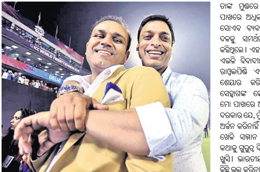
ବୀରେନ୍ଦ୍ର ସେହାରା ଓ ସୋଧ୍ୟବ ଅଖତର। କରାଚୀ, ୨୩।୧

ପାକିସ୍ତାନର ପୂର୍ବତନ ଯୋଧ୍ୟବ ଅଖତର ପୂର୍ବତନ ଭାରତୀୟ ଓପନର ବୀରେନ୍ଦ୍ର ସେହାରାଙ୍କୁ କଟାକ କରି କହିଛନ୍ତି, ତାଙ୍କ ମୁଣ୍ଡରେ ଥିବା କୁଟିଠାରୁ ମୋ ପାଖରେ ଅଧିକ ଧନ ଅଛି। ନିକଟରେ ସୋଧ୍ୟବ ବ୍ୟବସାୟ ପାଇଁ ଭାରତୀୟ ଦଳକୁ ସମର୍ଥନ କରୁଥିବା ସେହାରା କହିଥିଲେ। ଏହାର ଗୋଟିଏ ଦିନ ପରେ ଏଭଳି ବିବାଦୀୟ ପ୍ରତିକ୍ରିୟା ଦେଖିଛନ୍ତି ରାଫ୍‌ଲପିଟି ଏକ୍ସପ୍ରେସ୍। ଏକ ଭିଡିଓ ଖୋଲା କରି ଅଖତର କହିଛନ୍ତି, ସେହାରାଙ୍କ କେଶଠାରୁ ଅଧିକ ଧନ ମୋ ପାଖରେ ଅଛି। ସେହାରାଙ୍କୁ କୁଟିବା ଦରକାର ଯେ, ପୂର୍ବତନ ଯୋଧ୍ୟବ ସେହାରାଙ୍କୁ ପ୍ରତି ଅର୍ଜନ କରିନାହିଁ। ୧୫ ବର୍ଷ ଧରି କ୍ରିକେଟ୍ ଖେଳି ସମ୍ମାନ ହାସଲ କରିଛି। ମୋ କଥାକୁ ଗୁରୁତ୍ୱ ଦିଆଯାଉଥିବାରୁ ପୂର୍ବତନ ଯୋଧ୍ୟବ କୁଟିବା ଉଚିତ୍। ଭାରତୀୟ ଦଳକୁ ସମର୍ଥନ କରି କିଛି ଭୁଲ କରିନାହିଁ। ଭାରତ ବିଶ୍ୱର ନୟର ଓପନ ଟିମ୍ ଓ ବିରାଟ କୋହଲି ନୟର ଓପନ ବ୍ୟାଟ୍‌ମ୍ୟାନ। ଏଥିରେ ପୂର୍ବତନ ସେମାନଙ୍କୁ ପ୍ରଶଂସା କରିବା କ'ଣ ମୋର ଭୁଲ୍ ବୋଲି ସେ ପ୍ରଶ୍ନ କରିଛନ୍ତି।