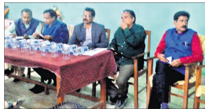
ବୈଠକରେ ଯୋଗଦେଇଥିବା ଓକିଲ ସଂଘ କର୍ମକର୍ତ୍ତାମାନେ।

ତାରିଖରେ ସମଗ୍ର ପଶ୍ଚିମ ଓଡ଼ିଶା ବନ୍ଦ କରାଯିବ ବୋଲି ସଂଘର କର୍ମକର୍ତ୍ତାମାନେ କହିଛନ୍ତି। ଏହି ପରିପ୍ରେକ୍ଷାରେ ବାର କାର୍ଯ୍ୟକ୍ରମ ଅଫ୍ ଇଣ୍ଡିଆର ମନପ୍ରସ୍ତା କାରବାର ଓ ଅରଣ୍ୟାନ୍ତର ନିଷ୍ପତ୍ତି ବିରୋଧରେ ଆସକ୍ତ ଫେବୃୟାରୀ ୫ ତାରିଖ ଦିନ ୧୨୦୫ଟି ପଶ୍ଚିମ ଓଡ଼ିଶା ବନ୍ଦ ତାକରା ଦିଆଯିବା ପାଇଁ ସର୍ବସମ୍ମତକ୍ରମେ ପ୍ରସ୍ତାବ ଗୃହୀତ ହୋଇଛି। ସେହିପରି ସମଗ୍ର ପଶ୍ଚିମ ଓଡ଼ିଶାରେ ସମସ୍ତ ବୋକାଳ, ବକାର, ସ୍କୁଲ, କଲେଜ, ସରକାରୀ କାର୍ଯ୍ୟାଳୟ, ବ୍ୟାଙ୍କ ଓ ବାମା ପ୍ରତିଷ୍ଠାନଗୁଡ଼ିକ ବନ୍ଦ କରାଯିବାକୁ ନିଷ୍ପତ୍ତି ହୋଇଛି। ଖୁବଶୀଘ୍ର ପଶ୍ଚିମ ଓଡ଼ିଶାର ଓକିଲମାନଙ୍କ ଏକ ପ୍ରତିନିଧି ଦଳ ରାଜ୍ୟ ସରକାରଙ୍କ ଗୃହ ସଚିବ ଓ ଆଇନ ସଚିବଙ୍କୁ ସାକ୍ଷାତ କରି ସେମାନଙ୍କ ସ୍ୱାର୍ଥରକ୍ଷା ପୂର୍ଣ୍ଣ-୪