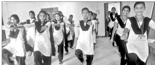
ଛାତ୍ରୀମାନେ ଆନୁସୂରକା ତାଲିମ ନେଉଛନ୍ତି।