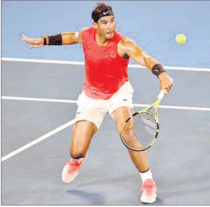
ବ୍ରୁକଲିନ୍, ନ୍ୟୁୟାର୍କରେ ନାଡାଲ ଏକ ରିଟର୍ଣ୍ଣ ଶର୍ଟ ଖେଳୁଛନ୍ତି।