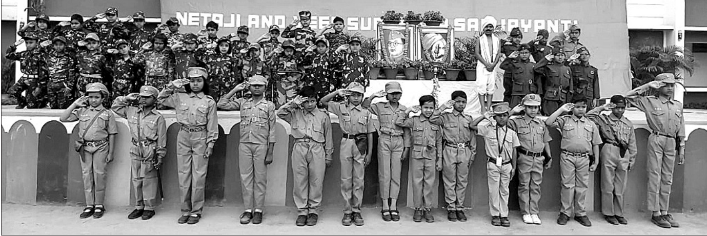
ଝାରପୁରୁଡ଼ା ଡିଏସ୍ ସ୍କୁଲର ଛାତ୍ରଛାତ୍ରୀମାନେ ଦେଶପ୍ରେମ ଭିତ୍ତିକ ସାଂସ୍କୃତିକ କାର୍ଯ୍ୟକ୍ରମ ପରିବେଷଣ କରୁଛନ୍ତି।

ଝାରପୁରୁଡ଼ା ଜିଲାର ସ୍କୁଲ, କଲେଜ, ସରକାରୀ ଓ ବେସରକାରୀ ଅନୁଷ୍ଠାନଗୁଡ଼ିକରେ ନେତାଜୀ ସୁଭାଷ ଚନ୍ଦ୍ର ବୋଷ ଏବଂ ବୀରପୁରେନ୍ଦ୍ର ସାଏଙ୍କ ଜୟନ୍ତୀ ଉତ୍ସବ ପାଳିତ ହୋଇଯାଇଛି। ଏହି ଅବସରରେ ଦୁଇ ମହାପୁରୁଷଙ୍କ ପ୍ରତିମୂର୍ତ୍ତି ଏବଂ ଫଟୋ ଚିତ୍ରରେ ନେତା, ସାମାଜିକ କର୍ମୀ, ବରିଷ୍ଠ ନାଗରିକ ଓ ବିଭିନ୍ନ ଅନୁଷ୍ଠାନର କର୍ମକର୍ତ୍ତା ପୁଷ୍ପମାଲ୍ୟ ଦେଇ ଶ୍ରଦ୍ଧାସୁମନ ଜଣାଇଥିଲେ। ଏହି ଅବସରରେ ଜିଲାର ବିଭିନ୍ନ ସ୍ଥାନରେ ସ୍ମୃତି ସଭା ଆୟୋଜିତ ହୋଇଥିଲା। ଏପରିକି ସ୍କୁଲ, କଲେଜ, କୁବ ଆଦି ସ୍ଥଳାସ୍ଥଳୀରେ ଅନୁଷ୍ଠାନରେ ଚିତ୍ରକଳା, ବଜ୍ରତା, ଚର୍ଚ୍ଚା, ପ୍ରବନ୍ଧ, ଖେଳକ୍ରୀଡ଼ା ଆଦି ପ୍ରତିଯୋଗିତା ହୋଇଥିଲା। ଜିଲା ପ୍ରଶାସନ ପକ୍ଷରୁ ଡିଏମ୍‌ଏମ୍ ସମ୍ମିଳନୀ କକ୍ଷରେ