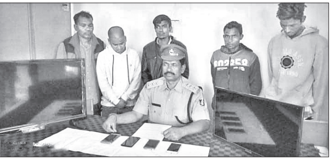
ବନ୍ଧୁପୁଣ୍ୟ ପୋଲିସ ବ୍ଲକ୍ ରିପର୍ଟ ଓ ଜବତ ସାମଗ୍ରୀ।