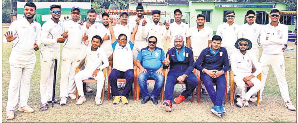
ବିଜୟ ହାସଲ ପରେ ସପୋର୍ଟ ସ୍କ୍ୱାଡ୍‌ଙ୍କ ସହ ଓଡ଼ିଶା ଦଳ।