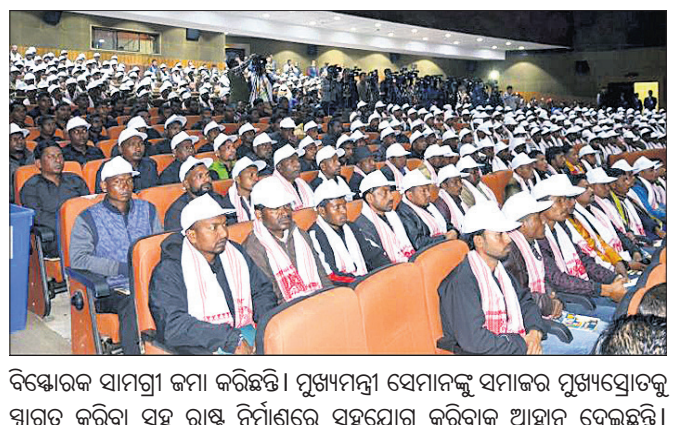
ବିଶ୍ୱାସୀ ଉଗ୍ରପକ୍ଷୀମାନେ ଆତ୍ମସମର୍ପଣ କରିବା ପାଇଁ ସମର୍ଥନ ଦେଇଛନ୍ତି। ମୁଖ୍ୟମନ୍ତ୍ରୀ ସେମାନଙ୍କୁ ସମାଜର ମୁଖ୍ୟସ୍ରୋତକୁ ସ୍ୱାଗତ କରିବା ସହ ରାଷ୍ଟ୍ର ନିର୍ମାଣରେ ସହଯୋଗ କରିବାକୁ ଆହ୍ୱାନ ଦେଇଛନ୍ତି।

ଉଗ୍ରପକ୍ଷୀ ଆତ୍ମସମର୍ପଣ କରିବା ଏହା ପ୍ରଥମ ଘଟଣା ହୋଇଥିବାବେଳେ ପୋଲିସ୍ ତିଳି ଭାଷ୍ଟରଭେଂସି ମହନ୍ତ ଏହାକୁ ଏକ ବିଶେଷ ଦିନ ବୋଲି କହିଛନ୍ତି। ଉଲ୍‌ଫା (ସାଧାନ)ରୁ ୫୦ ଜଣ, ଏନ୍‌ଡିଏଫ୍‌ସି ୮, ଆଦିବାସୀ ଡ୍ରାଗନ ଫାଇଟର (ଏଡିଏଫ୍)ରୁ ୧୨୮ ଜଣ ଆତ୍ମସମର୍ପଣ କରିଛନ୍ତି। ଉଗ୍ରପକ୍ଷୀମାନେ ସରକାରଙ୍କ ପାଖରେ ୧୭୭ଟି ବନ୍ଧୁକ, ବିପୁଳ ପରିମାଣର ବୁଲିଗୋଲା ଓ