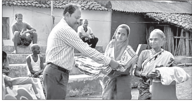
ଗାଡ଼ାରାଣୀ ଖଣି ପକ୍ଷରୁ କମ୍ପଳ ବନ୍ଧନ କରାଯାଇଛି।