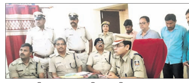
ଖବରଦାତା ସମ୍ମିଳନୀରେ ଅଧିକାରୀଙ୍କ ନିକଟରେ ଅଭିଯୁକ୍ତମାନେ।

ନୂଆପଡା ଅପିସ, ୨୩।୧: ଓଡ଼ିଶା-ଛତିଶଗଡ଼ ସୀମାନ୍ତ ଅଞ୍ଚଳରେ କର୍ପ୍ ସିରପ୍ କାରବାର ବନ୍ଦିକାଳିଥିବାବେଳେ ବର୍ତ୍ତମାନ ନୂଆପଡା ପୋଲିସ୍ ଏହା ଉପରେ ରୋକ ଲଗାଇବାକୁ ପ୍ରୟାସ ଆରମ୍ଭ କରିଛି।