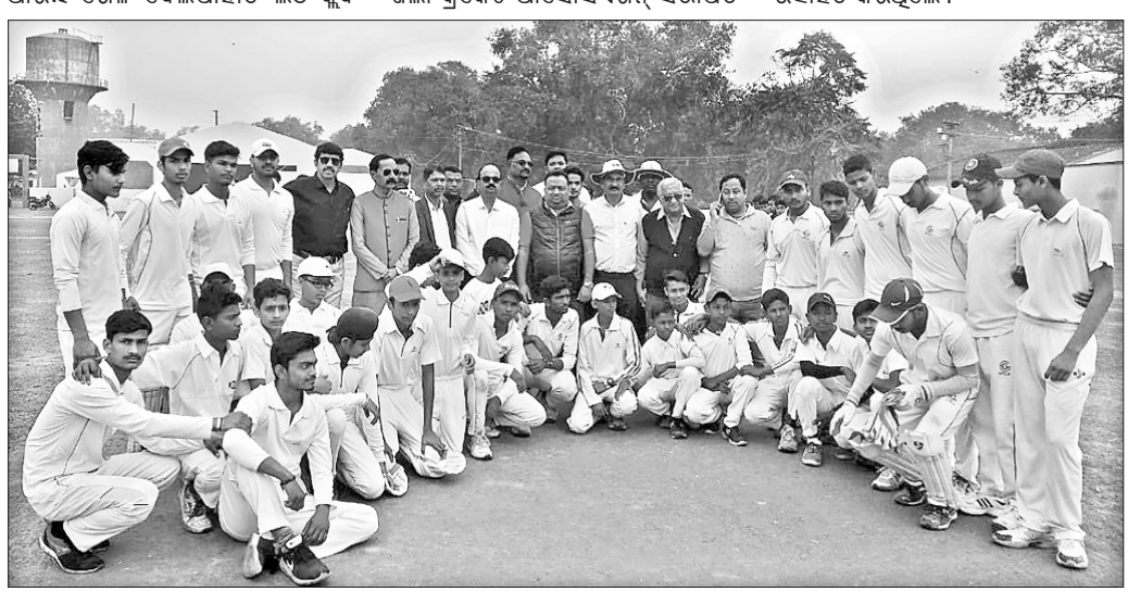
ଅତିଥି ସହ ଖେଳାଳିମାନେ।