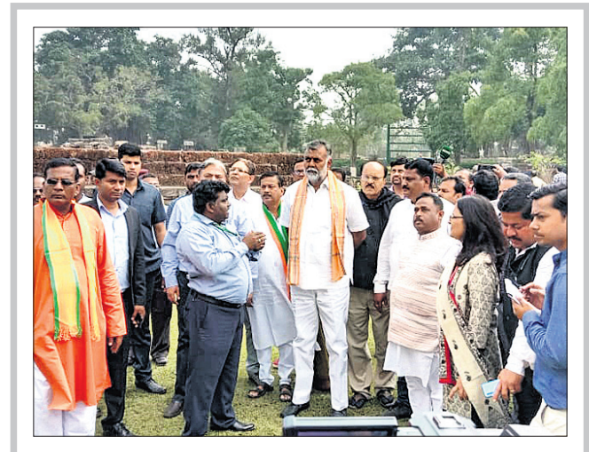
କେନ୍ଦ୍ର ପର୍ଯ୍ୟଟନ ମନ୍ତ୍ରୀ ପ୍ରହଲ୍ଲାଦ ସିଂ ପଟ୍ଟନାୟକ ଓ ଅନ୍ୟ ଅଧିକାରୀମାନେ ଶୁକ୍ରବାର କୋଣାର୍କ ସୂର୍ଯ୍ୟମନ୍ଦିର ବୁଲି ଦେଖୁଛନ୍ତି।