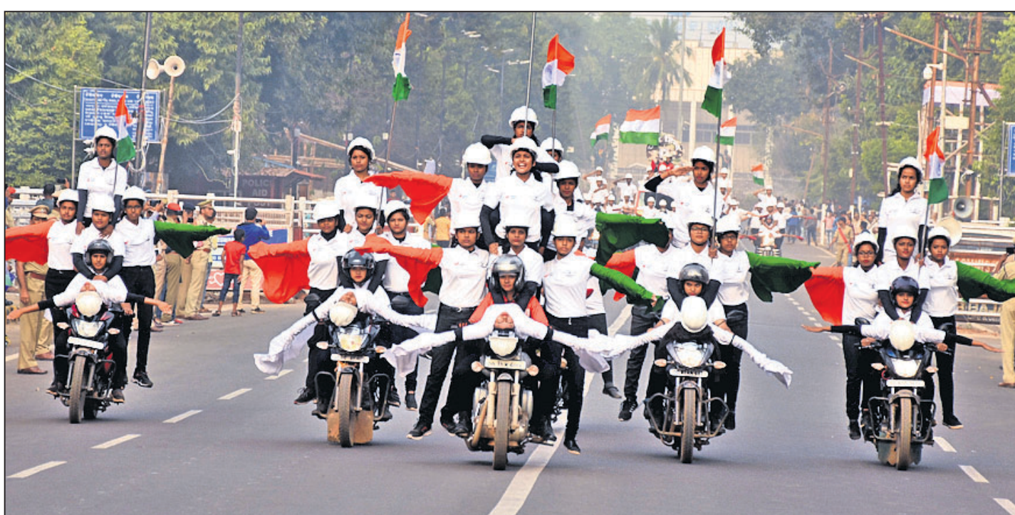
ସାଧାରଣତନ୍ତ୍ର ଦିବସ ରାଜ୍ୟସ୍ତରୀୟ ପରେ ନିମନ୍ତେ ଭୁବନେଶ୍ୱର ଶାନ୍ତୀମାର୍ଗରେ ଶୁକ୍ରବାର ମହର୍ଷି ତେଜୀ ଚେତିଲ୍ଲ ଗୁପ୍ତ ପକ୍ଷରୁ ଅଭ୍ୟାସ କରାଯାଇଛି।