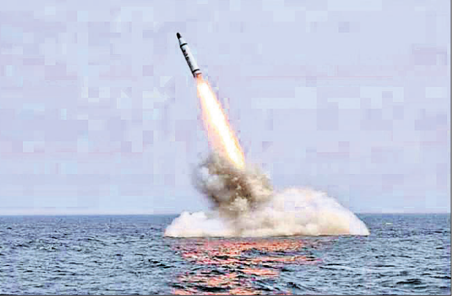
ନୂଆଦିଲ୍ଲୀ, ୨୫୧ (ପି.ଟି.):

ଭାରତ ଶୁକ୍ରବାର ସଫଳତାର ସହ କେ-୪ ବାଲିଷ୍ଟିକ କ୍ଷେପଣାସ୍ତ୍ର ପରୀକ୍ଷା କରିଛି। ୨୦୦୦ କିଲୋଗ୍ରାମ ଆଣବିକ କିମ୍ବା ପାରମ୍ପରିକ ଅସ୍ତ୍ର ବନ୍ଧନ କରି ୩୫୦୦ କିଲୋମିଟର ଲକ୍ଷ୍ୟଭେଦ କରିପାରୁଥିବା ଏହି କ୍ଷେପଣାସ୍ତ୍ରକୁ ବିଶାଖାପାଟଣା ଉପକୂଳରୁ ପରୀକ୍ଷା କରାଯାଇଛି। ତିଆରିତ ଓ ଦ୍ଵାରା ବିକଶିତ ଏହି କ୍ଷେପଣାସ୍ତ୍ରକୁ ବୃତ୍ତାକାହାଳରୁ ନିକ୍ଷେପ