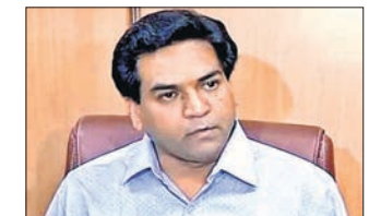
ନୂଆଦିଲ୍ଲୀର ଶାନ୍ତିନଗରରେ ନାଗରିକଙ୍କୁ ସଂଶୋଧନ ଆଇନ (ସିଏଏ)କୁ ବିରୋଧ କରି ମାସାଧିକ କାଳ ହେବ ବିରୋଧ ରାଜିଛି। ଫେବୃୟାରୀ ୮ରେ ଦିଲ୍ଲୀରେ ବିଧାନସଭା ନିର୍ବାଚନ ହେବାକୁ ଥିବାରୁ ରାଜନୈତିକ ପାଣିପାଗ ସରଗରମ ରହିଛି। ଏଭଳି ସମୟରେ ଏହାକୁ ଚାଲୁ କରି ଭାଜପା ପ୍ରାର୍ଥୀ କପିଳ ମିଶ୍ରା ରୁଚ୍ଛୁକୁ ନେଇ କଠୋର ହୋଇଛନ୍ତି, ଆଇନକୁ ପାଳନ କରାଯାଇ ନ ଥିବା ଗୁରୁତ୍ଵ ଦେଇ ବିନି ଦାୟିତ୍ଵ।

ଦିଲ୍ଲୀର ଭାଜପା ନେତା କପିଳ ମିଶ୍ରାଙ୍କ ସାମ୍ପ୍ରଦାୟିକ ରୁଚ୍ଛୁକୁ ନେଇ କଠୋର ହୋଇଛନ୍ତି ନିର୍ବାଚନ କମିଶନ (ଇସି)। ତାଙ୍କ ବିରୋଧରେ ମାମଲା ରୁଚ୍ଛୁ କରିବା ପାଇଁ ଜାଣିଶୁଣି ଦିଲ୍ଲୀ ପୋଲିସକୁ ନିର୍ଦ୍ଦେଶ ଦେଇଛନ୍ତି।