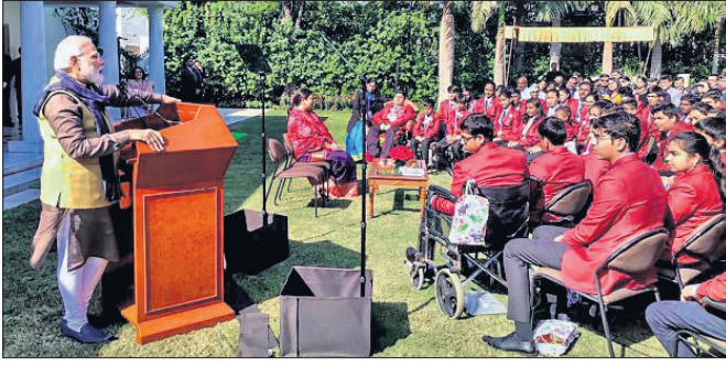
ନୂଆଦିଲ୍ଲୀ, ୨୫୧ (ପି.ଟି.)

ବେଶ ପାଇଁ କର୍ତ୍ତବ୍ୟ କରି ଉଦାହରଣ ସୃଷ୍ଟି କରିବା ସହ ନୂଆ ଭାରତ ନିର୍ମାଣ କାର୍ଯ୍ୟକୁ ଆଗେଇ ନେବାରେ ସହାୟକ ହେବାକୁ ପ୍ରଧାନମନ୍ତ୍ରୀ ନରେନ୍ଦ୍ର ମୋଦି ଶୁକ୍ରବାର ମୁଁବିଦ୍ଧିକୁ ପରାମର୍ଶ ଦେଇଛନ୍ତି। ସାଧାରଣତନ୍ତ୍ର ଦିବସ ପରେଭେଳେ ଭାରତବାସୀଙ୍କୁ ଥିବା ପିଲାମାନଙ୍କୁ ଉଦ୍‌ବୋଧନ ଦେଇ ପ୍ରଧାନମନ୍ତ୍ରୀ କହିଥିଲେ, ଭୌଗୋଳିକ ଓ ସାମାଜିକ ବିଭିନ୍ନତା ଭାରତୀୟ ମହାନତାରେ ବିଶେଷତ୍ଵ। ତେଣୁ ଦେଶର କୌଣସି ବ୍ୟକ୍ତି ଓ ଅଞ୍ଚଳ ଯେପରି ପଛରେ ପଡ଼ି ନ ଯାଏ, ତାହା ଆମକୁ ସୁନିଶ୍ଚିତ କରିବାକୁ ହେବ। ଏହା ହେଉଛି ସାଧାରଣତନ୍ତ୍ର ଦିବସ ପରେଭେଳେ ଉଦ୍‌ଦେଶ୍ୟ। ବିଭିନ୍ନ ବିଭାଗୀୟ ଓ ମୂଲ୍ୟବୋଧକୁ ନେଇ ଭାରତ ଏକ ଜୀବନଶକ୍ତି ବୋଲି ମୋଦି କହିଥିଲେ। ରାଷ୍ଟ୍ରୀୟ ବାଲ ପୁରସ୍କାର ପାଇଥିବା ପିଲାମାନଙ୍କ ସହ ମୋଦି ଭାବ ବିନିମୟ କରିଥିଲେ। ସେ ପିଲାମାନଙ୍କ କାର୍ଯ୍ୟରେ ଅନୁପ୍ରାଣିତ ବୋଲି ମତ ରଖିଥିଲେ। ପିଲାମାନଙ୍କ ସାହାଯ୍ୟକ କାର୍ଯ୍ୟର ଉଚ୍ଚ ପ୍ରଶଂସା କରିବା ସହିତ ଶାରୀରିକ ଭାବେ ସକ୍ରିୟ ରହିବା ଲାଗି ପରାମର୍ଶ ଦେଇଥିଲେ ପ୍ରଧାନମନ୍ତ୍ରୀ। ନବପ୍ରବର୍ତ୍ତନ, ସାମାଜିକ ସେବା, ଶିକ୍ଷା, କ୍ରୀଡ଼ା, କଳା ଓ ସଂସ୍କୃତି ଏବଂ ସାହାଯ୍ୟକ ଶ୍ରେଣୀରେ ଯେପରି ପଛରେ ପଡ଼ି ନ ଯାଏ, ତାହା ଆମକୁ ସୁନିଶ୍ଚିତ କରିବାକୁ ହେବ। ଏହା ହେଉଛି ସାଧାରଣତନ୍ତ୍ର ଦିବସ ପରେଭେଳେ ଉଦ୍‌ଦେଶ୍ୟ। ବିଭିନ୍ନ ବିଭାଗୀୟ