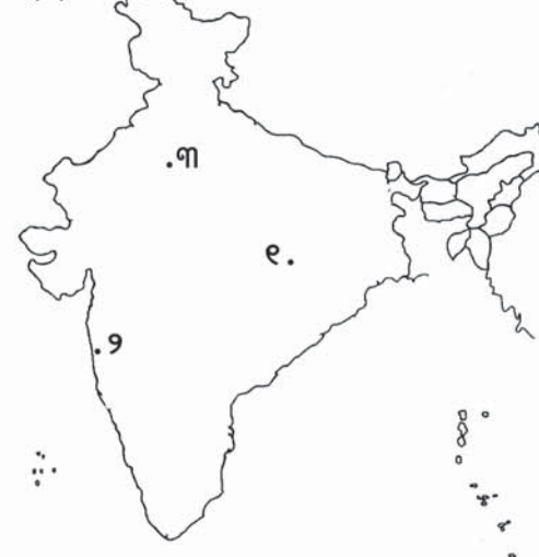
(ଖ) ୧. ଝାଡ଼ଖଣ୍ଡ ୨. ପ୍ରଭୁ ବେକାରୀ