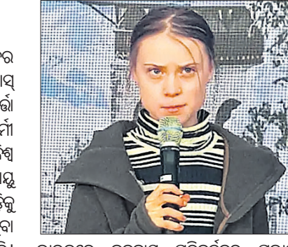
ଭାରତରେ ଜଳବାୟୁ ପରିବର୍ତ୍ତନର ପ୍ରଭାବ ଭୟାବହ ହେଲାଣି। ବିଶ୍ଵର ଅନ୍ୟ ଦେଶଗୁଡ଼ିକରେ ମଧ୍ୟ ସମାନ ଅବସ୍ଥା ସୃଷ୍ଟି ହୋଇଥିବାରୁ ଜୀବଜନ୍ତୁ ଚଳନକୁ ରୁଦ୍ଧ ପୂର୍ଣ୍ଣପ୍ରତ୍ୟାହାର ପାଇଁ ସେ କର୍ପୋରେଟ ସେକ୍ଟରକୁ ଅନୁରୋଧ କରିଥିଲେ।

'ବିଜ୍ଞାନକୁ ଶୁଣ'। ଜଳବାୟୁ ପରିବର୍ତ୍ତନର ଭୟାବହତାକୁ ପୂର୍ଣ୍ଣପାଲକ ପାଇଁ ତାତ୍ତ୍ଵୋ ମଞ୍ଚରୁ ଶୁକ୍ରବାର ଭାରତକୁ ଏହି ବାର୍ତ୍ତା ଦେଇଛନ୍ତି ସ୍ଵଚ୍ଛବୟା ପରିବେଶ କର୍ମୀ ଗ୍ରେଗା ଅନ୍‌ବର୍ଗ। ଅନ୍ୟପକ୍ଷରେ ବିଶ୍ଵ ଅର୍ଥନୈତିକ ମଞ୍ଚ (ଡବ୍ଲ୍ୟୁଇଏଫ୍)ରେ ଜଳବାୟୁ ପରିବର୍ତ୍ତନର ପୂର୍ଣ୍ଣପାଲକ ପାଇଁ ଉଦ୍ଦେଶ୍ୟ ଦାବିଗୁଡ଼ିକୁ ସମ୍ପୂର୍ଣ୍ଣ ରୂପେ ଅଣଦେଖା କରାଯାଇଥିବା ଦର୍ଶାଇ ସେ ଯୋଗଦେଇ କହିଛନ୍ତି। ତାତ୍ତ୍ଵୋରେ ଚାଲିଥିବା ଡବ୍ଲ୍ୟୁଇଏଫ୍ ସମ୍ମିଳନୀର ଶେଷଦିନରେ ପୂର୍ଣ୍ଣ କି ରିପର୍ଟରେ ଏକ ଖବରଦାତା ସମ୍ମିଳନୀକୁ ସମୋଧିତ କରି ୧୭ ବର୍ଷୀୟ ପରିବେଶବିତ୍ ଗ୍ରେଗା କହିଛନ୍ତି,