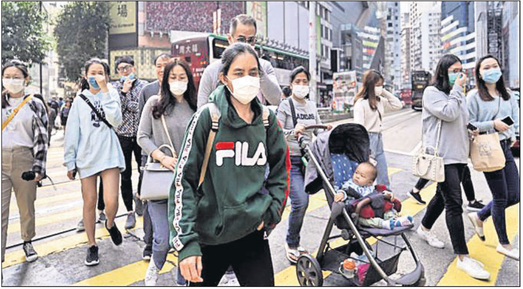
ନୂଆ ଦାନ୍ତବର୍ଷ ପାଳନବେଳେ ହଂକଂରେ ସଂକ୍ରମଣ ଭୟରେ ମାସ୍କ ପିନ୍ଧି ରାସ୍ତାକୁ ଓହ୍ଲାଇଛନ୍ତି ଲୋକେ।

କରୋନା ଭୂତାଣୁ ସଂକ୍ରମଣକୁ ନିୟନ୍ତ୍ରଣ କରିବା ଲାଗି ଚାଇନା ସରକାର ଗୋଟିଏ ପରେ ଗୋଟିଏ ପଦକ୍ଷେପ ଗ୍ରହଣ କରୁଛନ୍ତି। ଏହି ମାରାତ୍ମକ ଭୂତାଣୁର କେନ୍ଦ୍ରସ୍ଥଳ କୁହାଯାଇଥିବା ୟୁହାନ ସମେତ ୧୩ଟି ସହରକୁ ଗମନାଗମନ ବନ୍ଦ କରିଦିଆଯିବା ସହ ଏହି ସହରଗୁଡ଼ିକୁ ବାହ୍ୟଜଗତରୁ ଏକପ୍ରକାର ବିଚ୍ଛିନ୍ନ କରିଦିଆଯାଇଛି। ଫଳରେ ୪୧ ନିୟୁତ ଲୋକ ପ୍ରଭାବିତ ହୋଇଛନ୍ତି। ୟୁହାନକୁ କେହି ନ ଯିବା ପାଇଁ ପୂର୍ବରୁ ସରକାର ଆତତାଳକରି ଲାଗି କରିଥିଲେ। କେନ୍ଦ୍ରୀୟ ସ୍ତରରେ ପ୍ରଦେଶର ଜିଆନିଆଙ୍ଗ, ଜିଆଓଗାନ, ଜାନ୍‌ଶି, ଝିଜିଆଙ୍ଗ ସହରକୁ ବନ୍ଦ ଓ ଟ୍ରେନ୍ ଚଳାଚଳ ସମେତ ସାଧାରଣ ପରିବହନ ସେବା ବନ୍ଦ କରିଦିଆଯାଇଛି। ଏହି ଭାଇରସ୍‌ରେ ଆକ୍ରାନ୍ତ ହୋଇ ବର୍ତ୍ତମାନ ୟୁକ୍ସା ଚାଇନାରେ ୨୬ ଜଣଙ୍କ ମୃତ୍ୟୁ ହୋଇଛି। ସାର୍ବ (ସିଏଚ୍‌ଏସ୍) ଆୟୁର୍ ରେଭିରୋଗୋରି ସିଣ୍ଡ୍ରୋମ୍ ସହ ଏହି ଭାଇରସ୍‌ର ସାମାଜିକ ରହିଥିବାରୁ ଏହାକୁ ନେଇ ଆତଙ୍କ ଖେଳିଯାଇଛି। ୨୦୦୨-୦୩ରେ ସାର୍ବ ସଂକ୍ରମଣ ଯୋଗୁ ଚାଇନା ଓ ହଂକଂରେ ୬୫୦