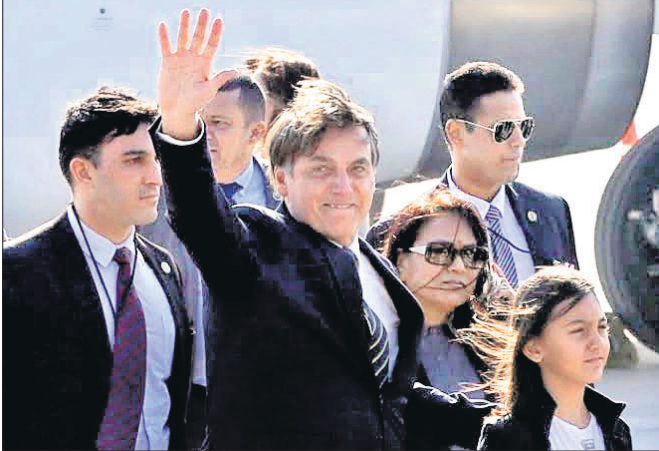
ନୂଆଦିଲ୍ଲୀ, ୨୫୧ (ପି.ଟି.)

ବ୍ରାଜିଲ ରାଷ୍ଟ୍ରପତି ଜେରୌ ବୋଲସୋନାରୋ ୪ଦିନିଆ ଭାରତ ଗସ୍ତରେ ଆସି ଶୁକ୍ରବାର ନୂଆଦିଲ୍ଲୀରେ ପହଞ୍ଚିଛନ୍ତି। ତାଙ୍କର ଏହି ଗସ୍ତ ଦୁଇଦିନ ମଧ୍ୟରେ ସାମାଜିକ ସହଯୋଗ ବୃଦ୍ଧିରେ ସହାୟକ ହେବ ବୋଲି କୁହାଯାଇଛି। ଭାରତର ୭୧ତମ ସାଧାରଣତନ୍ତ୍ର ଦିବସରେ ବୋଲସୋନାରୋ ପୁଷ୍ୟ ଅତିଥି ହେବେ। ଏଥିସହିତ ସେ ପ୍ରଧାନମନ୍ତ୍ରୀ ନରେନ୍ଦ୍ର ମୋଦି ଓ ରାଷ୍ଟ୍ରପତି ରାମନାଥ କୋବିନ୍ଦଙ୍କ ସହ ଆଲୋଚନା କରିବେ। ବୋଲସୋନାରୋଙ୍କ ସହ ୮ ମନ୍ତ୍ରୀ, ୪ ପାର୍ଲିମେଣ୍ଟ ସଦସ୍ୟ, ବରିଷ୍ଠ ଅଧିକାରୀ ଓ ବ୍ୟବସାୟ ପ୍ରତିନିଧି ଆସିଛନ୍ତି।