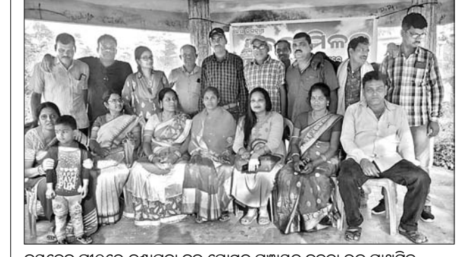
ଜୟଦେବ ପାଠରେ କଣ୍ଠପଢ଼ା ବୃଦ୍ଧ ଗୋଷ୍ଠୀର ସଭାପତି ଶ୍ରୀ ଶ୍ରୀ

ଛିଡିକି ପଡ଼ିଥିଲା। ଆଲୋକଙ୍କ ମୃତ୍ୟୁ ଓ ଶରୀରରେ ଏକାଧିକ ଷଡ଼ ଫୁଟି ହୋଇ ପ୍ରଭୁର ଉଦ୍ଧାର ହୋଇଥିଲା। ସେ ଘଟଣାସ୍ଥଳରେ ନିଶ୍ଚଳ ହୋଇ ପଡ଼ିରହିଥିଲେ। ଅମରୋହର ଶରୀରରେ ଏକାଧିକ ଷଡ଼ ହୋଇଥିଲେ ମଧ୍ୟ ସଂଜ୍ଞା ହରାଇ ନ ଥିଲେ। ସ୍ଥାନୀୟ ଲୋକେ ସେମାନଙ୍କୁ ଉଦ୍ଧାର କରି ଆଠଗଡ଼ ଉପଖଣ୍ଡ ଡାକ୍ତରଖାନାକୁ ନେଇଥିଲେ। ସେଠାରେ ତାଙ୍କୁ ଆଲୋକଙ୍କୁ ମୃତ ଘୋଷଣା କରିଥିଲେ। ଅମରୋହର ଅବସ୍ଥା ସଙ୍କଟାପନ୍ନ ଥିବାରୁ ତାଙ୍କୁ କଟକ ବଡ଼ ମେଡିକାଲକୁ ସ୍ଥାନାନ୍ତର ପାଇଁ ଡାକ୍ତର ପରାମର୍ଶ ଦେଇଥିଲେ। ଏନେଇ ଅଭିଯୋଗ ହେବାପରେ ଆଠଗଡ଼ ଥାନା ପୋଲିସ୍ ଏକ ମାମଲା ନଂ-୨୯/୨୦୨୦ ରୁ କ୍ରିତ ଚଳିତ ଆରମ୍ଭ କରିଛନ୍ତି। ଖୁବ୍ ଶୀଘ୍ର ଦୁର୍ଘଟଣା ଘଟାଇଥିବା କାରୁକୁ ଜବତ କରାଯିବ ବୋଲି ଥାନା ପକ୍ଷରୁ କୁହାଯାଇଛି।