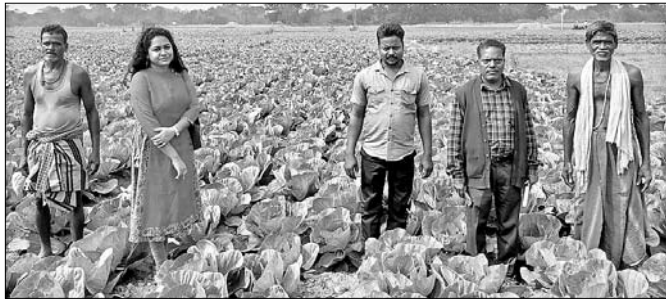
କୃଷି ବିଭାଗ ଅଧିକାରୀ ଚାଷୀ କରିଥିବା ଫସଲକୁ ବୁଲି ଦେଖୁଛନ୍ତି।

ସରକାରଙ୍କ ପକ୍ଷରୁ ଚାଷ ଓ ଚାଷୀମାନଙ୍କର ଉନ୍ନତ ପାଇଁ ବିଭିନ୍ନ ଯୋଜନା କାର୍ଯ୍ୟକାରୀ କରାଯାଇଛି। ହେଲେ ବାସ୍ତବ ସ୍ତରରେ ତାହା କେତେପୂର ଚାଷୀଙ୍କ ହିତରେ ଲାଗୁଛି ତାହାର ତଦାରଖ କରାଯାଇନାହିଁ। ଖୋର୍ଦ୍ଧା ଜିଲ୍ଲା ବେଗୁନିଆ ବ୍ଲକ୍ ଅଞ୍ଚଳରେ ପ୍ରାୟ ୮୦ ପ୍ରତିଶତ ଲୋକ ଚାଷ କାର୍ଯ୍ୟ କରି ପରିବାର ପ୍ରତିପୋଷଣ କରୁଛନ୍ତି। ଚାଷୀମାନେ ସର୍ବଦା ଖତିଫରେ ଧାନ, ଉଦି ଉତୁରେ ମୂଗ, ଚଣା ଆଦି ଫସଲ ଉତ୍ପାଦନ କରୁଥିଲେ। ହେଲେ ଜଳସେଚନର ସୁବ୍ୟବସ୍ଥା କରାଯାଇ ନ ଥିବାରୁ ଚାଷୀଙ୍କ ଚାଷ କାର୍ଯ୍ୟରେ ଉନ୍ନତ ହୋଇପାଉନାହିଁ। ମାତ୍ର ଏବେ ଚାଷୀମାନେ ଅର୍ଥକ୍ରମୀ ଫସଲ ଉତ୍ପାଦନ କରି ଟଙ୍କା ରୋଜଗାର କରିବାକୁ ଚେଷ୍ଟା ଚଳାଇଛନ୍ତି। ଚଳିତବର୍ଷରେ ଉତ୍ପାଦନ ଓ କୃଷି ବିଭାଗ ପକ୍ଷରୁ ବିଭିନ୍ନ ଗାଁରେ ଚାଷୀମାନଙ୍କୁ ଭଲିକ ଭଲିକ କିସମର ବିହନ କିଫ୍ ଯୋଗାଇ ଦିଆଯାଇଥିଲା। ସେମାନେ ପରିବା ଫସଲ କରିଛନ୍ତି। ହେଲେ ଚାଷ ଜମିକୁ ପାଣି ଯାଉ ନ ଥିବାରୁ ପରିବା ଫସଲ ଉତ୍ପତ୍ତି ଯିବା ତିଭାବେ ଚାଷୀମାନେ ପଡିଛନ୍ତି। କ୍ଷୁଦ୍ର ସିକୋ, ହଳ, ଶଗଡ଼ାଭଙ୍ଗା, ଦେଉଳି, ବୋବିଲପୁର, ସାତୁଆ,