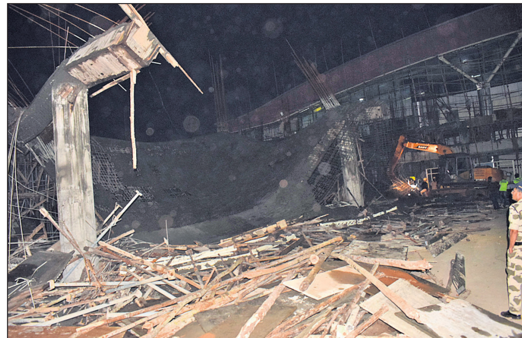
ଭୁବନେଶ୍ୱର ବିକ୍ର ପଟ୍ଟନାୟକ ଅର୍ଦ୍ଧଶତକୀୟ ବିମାନବନ୍ଦରରେ ଶୁକ୍ରବାର ରାତିରେ ଭୁଗୁଡ଼ି ପଡ଼ିଥିବା ନିର୍ମାଣାଧୀନ ଲିଫ୍ଟ ବିଲ୍ଟ୍ କ୍ଷାତ।