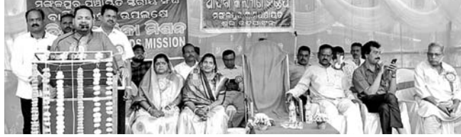
କାର୍ଯ୍ୟକ୍ରମରେ ବିଧାୟକ ପ୍ରଦୀପ ମହାବୀରୀ ଉଦ୍‌ବୋଧନ ଦେଉଛନ୍ତି।