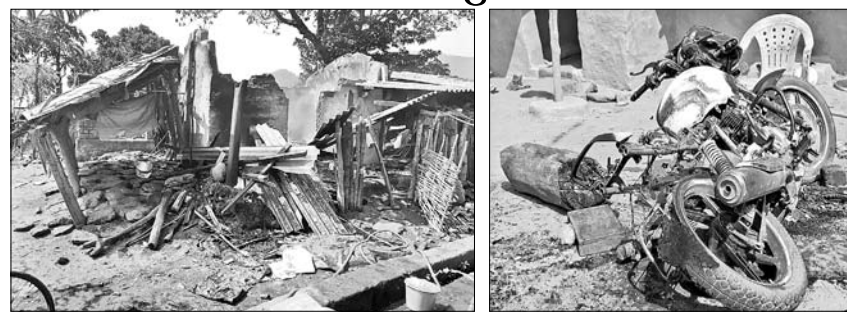
ମାଓବାଦୀମାନେ ପୋଡ଼ିଦେଇଥିବା ଘର ଏବଂ ଗାଡ଼ି ।

ମାଲକାନଗିରି/ଚିତ୍ରକୋଣ୍ଡା, ୨୭.୧.୧୯.ଏ.ଏ. ପ୍ରାୟ ୨୫ ବର୍ଷରୁ ଉର୍ଦ୍ଧ୍ୱ ହେବ ଲାଲବାହିନୀ ମାଲକାନଗିରି ଜିଲ୍ଲାରେ ରାଜ ସୂକ୍ଷ୍ମ କରି ଚାଲିଥିଲା ।