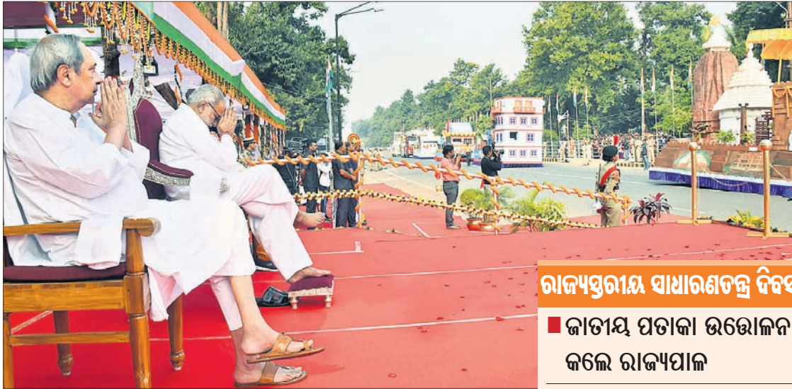
ରାଜ୍ୟସ୍ତରୀୟ ସାଧାରଣତନ୍ତ୍ର ଦିବସ ଜାତୀୟ ପତାକା ଉତ୍ତୋଳନ କଲେ ରାଜ୍ୟପାଳ ମୁଖ୍ୟମନ୍ତ୍ରୀ ହେଲେ ଅତିଥି