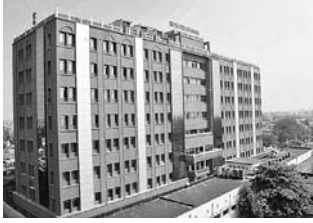
କଟକ ଅଫିସ, ୨୭