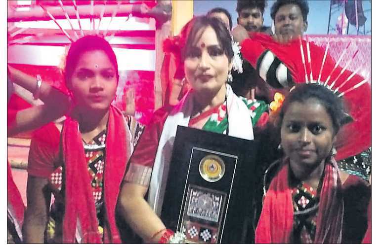
'ସତରଂ-୨୦୨୦' ଅବସରରେ ବିଭିନ୍ନ ଅଞ୍ଚଳର କଳାକାରମାନଙ୍କ ଲୋକନୃତ୍ୟ ପରିବେଶ ଓ କଳାକାରଙ୍କୁ ସମର୍ଥନ।