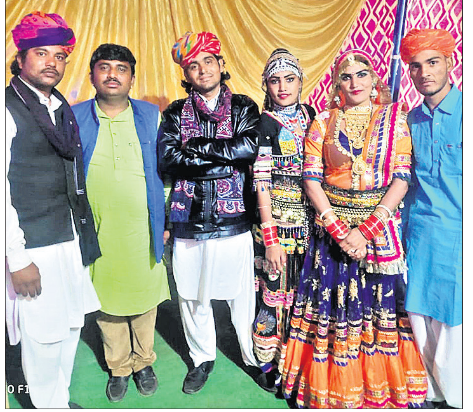
'ସତରଂ' କୁ ରାଜ୍ୟ ବାହାରୁ ଆସିଥିବା କଳାକାର ଦଳ।