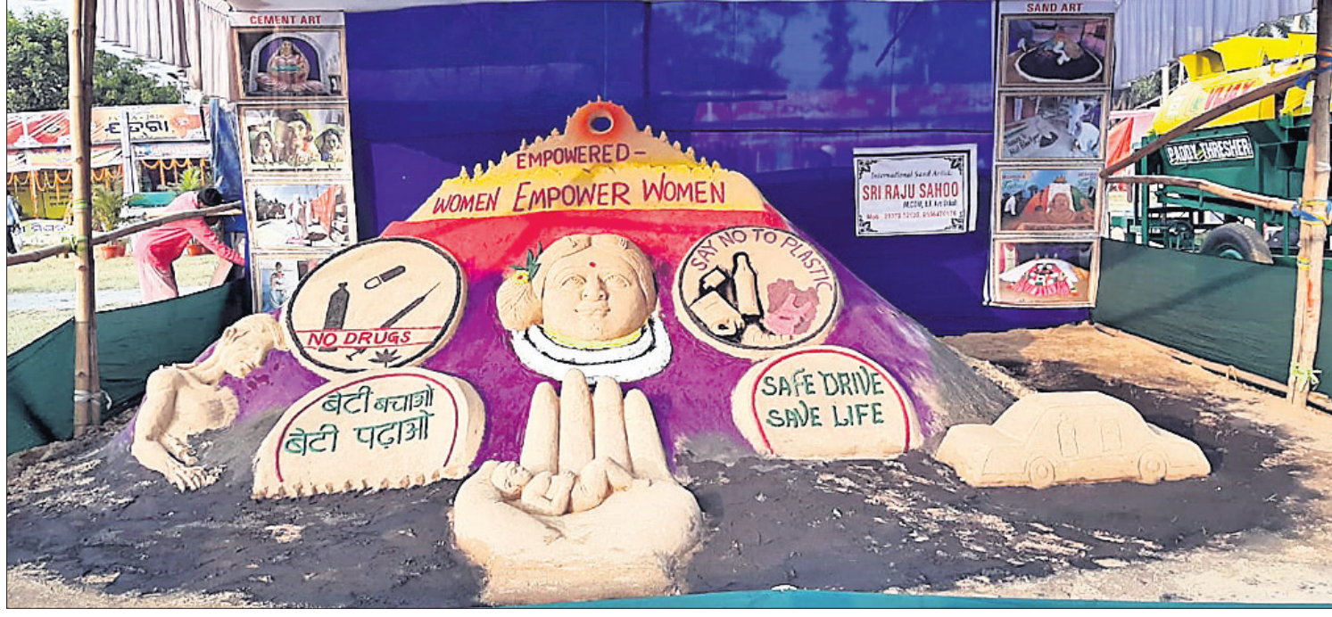
'ସତରଂ' ଅବସରରେ ବାଲୁକାଶିଳ୍ପ ମାଧ୍ୟମରେ ସଚେତନତା ବାଢ଼ା।