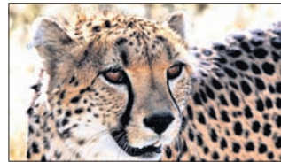
ରୁଧିର, ୨୮ (ପି.ଟି.)

ନାମିଆଲୁ ଆଫ୍ରିକାୟ ଚିତାଦଳୁ ଭାରତ ଅଣାଯିବ । ଚାନ୍ଦୁ ପରାମ୍ପାଜନକ ଭାବେ ଭାରତ ପାଣିପାନ୍ଦରେ ଖାଦ୍ୟପ୍ରାଣୀ ଚିତା ପାଇଁ ବ୍ୟବସ୍ଥା କରାଯିବ । ଏ ନେଇ ଯୁକ୍ତିମୋକ୍ଷ ଗ୍ରହଣ କରାଯିବ । ଏ ନେଇ ଯୁକ୍ତିମୋକ୍ଷ ଗ୍ରହଣ କରାଯିବ ।