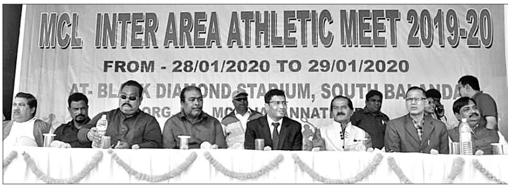
ଏମ୍ସିଏଲ୍ ଆନ୍ତର୍-କ୍ଷେତ୍ର କ୍ରୀଡ଼ା ପ୍ରତିଯୋଗିତାରେ ଉଦ୍‌ଘାଟନା ଉତ୍ସବରେ ମଞ୍ଚାଧୀନ ଅତିଥିମାନେ ।

ନାମିଆଲୁ ଆଫ୍ରିକାୟ ଚିତାଦଳୁ ଭାରତ ଅଣାଯିବ । ଚାନ୍ଦୁ ପରାମ୍ପାଜନକ ଭାବେ ଭାରତ ପାଣିପାନ୍ଦରେ ଖାଦ୍ୟପ୍ରାଣୀ ଚିତା ପାଇଁ ବ୍ୟବସ୍ଥା କରାଯିବ । ଏ ନେଇ ଯୁକ୍ତିମୋକ୍ଷ ଗ୍ରହଣ କରାଯିବ । ଏ ନେଇ ଯୁକ୍ତିମୋକ୍ଷ ଗ୍ରହଣ କରାଯିବ ।