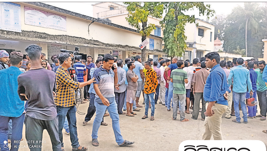
ଦିଗପହଣ୍ଡି ତାଳୁରଖାନାରେ ମୃତାହତଙ୍କ ସମ୍ପର୍କୀୟ ଓ ସ୍ଥାନୀୟ ଲୋକେ ।