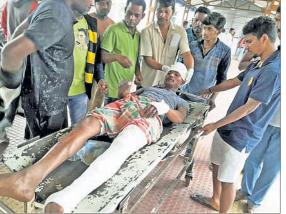
ବ୍ରହ୍ମପୁର ବଡ଼ ମେଡିକାଲରେ ଜଣେ ଆହତ ।