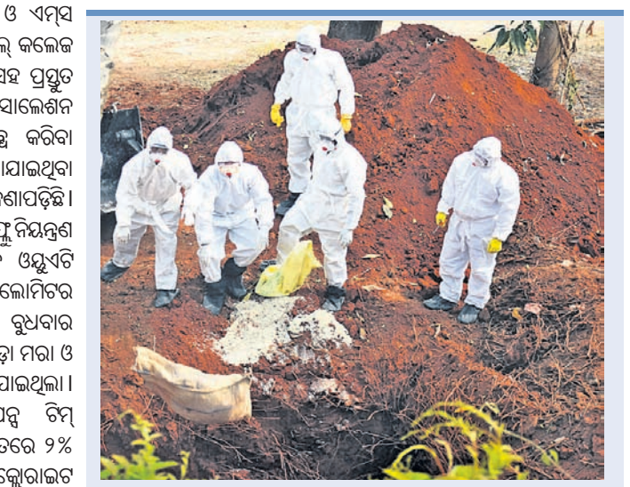
■ ସଂକ୍ରମଣ ରୋଗିଙ୍କୁ ପାଇଁ ସ୍ୱାସ୍ଥ୍ୟ ବିଭାଗର ପ୍ରସ୍ତୁତି ବୈଠକ ■ କାରି ରହିଛି କୁଳଦଳ ମାତା ଅଭିଯାନ ଓ ବିଶୋଧନ ପ୍ରକ୍ରିୟା

ହସ୍ପିଟାଲର ନିର୍ଦ୍ଦେଶକ ଓ ଏମସ୍ ସମେତ ସମସ୍ତ ମେଡିକାଲ କଲେଜ କର୍ମଚାରୀଙ୍କୁ ସଚେତନ ସହ ପ୍ରସ୍ତୁତ ରହିବା ଏବଂ ଆଇସୋଲେଶନ ଖର୍ଚ୍ଚର ସୁବିଧା ଉପଲବ୍ଧ କରିବା ପାଇଁ ନିର୍ଦ୍ଦେଶ ଦିଆଯାଇଥିବା ବୈଠକରୁ ଜଣାପଡ଼ିଛି। ଅନ୍ୟପକ୍ଷରେ ବାର୍ଡ ଫୁ ନିୟନ୍ତ୍ରଣ ନିମନ୍ତେ ସଂକ୍ରମିତ ସ୍ଥାନ ଓୟୁଏଟି କୁଳଦଳ ଫାମି ଏକ କିଲୋମିଟର ବ୍ୟାସାର୍ଦ୍ଧ ଅଞ୍ଚଳରେ ରୁଧିରୀ ବିହାର ଦିନରେ ମଧ୍ୟ କୁଳଦଳ ମାତା ଓ ବିଶୋଧନ କାର୍ଯ୍ୟ କରାଯାଇଥିଲା। ୨ଟି ରାପିଡ୍ ରେସ୍‌ପନ୍ସ ଟିମ୍ ଓୟୁଏଟି କୁଳଦଳ ଫାମି ଭିତରେ ୨% ସୋଡିଅମ୍ ହାଇପୋକ୍ଲୋରାଇଟ୍ ଓ ୪% ଫର୍ମାଲିନ୍ ଦ୍ରବଣ ସିଞ୍ଚନ କରି ସଂକ୍ରମିତ ସ୍ଥାନକୁ ବିଶୋଧନ କରିଥିଲା। ଏଥିସହ କାର୍ଯ୍ୟଗତ ଅନ୍ୟ ୫ ରାପିଡ୍ ରେସ୍‌ପନ୍ସ ଟିମ୍ ବୋକାଳା ଓ ଚାଖାଳା ୮୦ କୁଳଦଳ ଏବଂ ବଡ଼କଳ୍ପ ମାରି ଗଭୀର ଗାଡ଼ରେ ପୋଡ଼ିଥିବା ଜଣାପଡ଼ିଛି। ଏଥିମଧ୍ୟରେ ୩୮ ଲେୟାର ଟିଆଁ, ୩୮ ଲେୟାର କୁଳଦଳ, ୪ ବଡ଼କ ରହିଛି। ଏଥିସହ ୧୦୫୯ ଅଣ୍ଡା ଓ ୧୦ କିଗ୍ରା କୁଳଦଳ ଖାଦ୍ୟ ଗଭୀର ଗାଡ଼ରେ ପୋଡ଼ାଯାଇଛି। ପୋଡ଼ିବା ସମୟରେ ଗାଡ଼ରେ ବିଶୋଧକ ଭାବେ ବୁଟ୍ ପାଇଡର ପ୍ରୟୋଗ