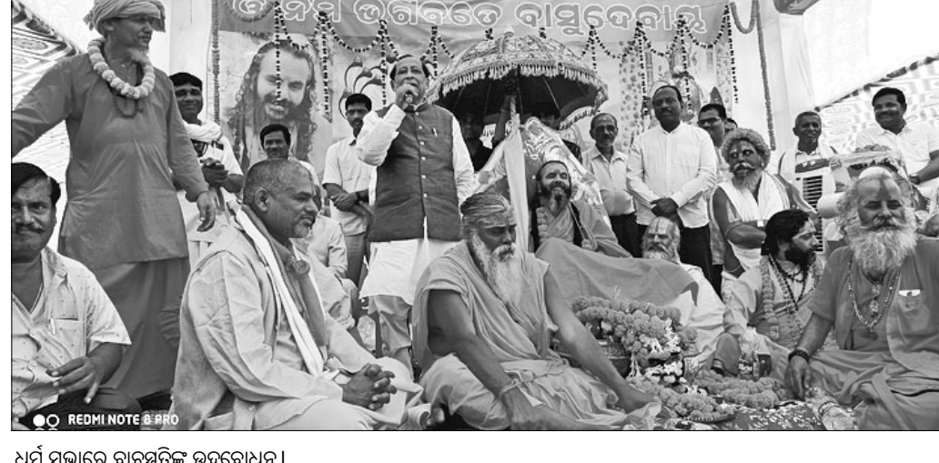
ଧର୍ମ ସଭାରେ ବାଚସ୍ପତିକ ଉଦ୍‌ବୋଧନ।

ଦିଗପହଣ୍ଡି ସହର ଉପକଣ୍ଠ ଗାଳୁଡିଦେଇ ପାହାଡ଼ରେ ଥିବା ମା' ଚାପୁଡେଶ୍ୱରୀ ପାଠରେ ଗତ ରୁପବାର ଠାରୁ ଗୋଟିଏ ଦିନ ଭାଗବତ ଧର୍ମ ପ୍ରଚାର ସମିତି ଆନୁକୂଲ୍ୟରେ ତଥା ଦିଗପହଣ୍ଡି ଆଦର୍ଶ ଭାଗବତ ଆଶ୍ରମ ଦ୍ୱାରା ଚାଲିଥିବା ଭାଗବତ ମଣ୍ଡଳୀ ମହାମିଳନ ଓ ପଞ୍ଚମହାପଞ୍ଚମ ମଙ୍ଗଳବାର ପୂର୍ଣ୍ଣଚୂଡ଼ି ହୋଇଛି। ସାମାଜିକ ତୀର୍ଥ