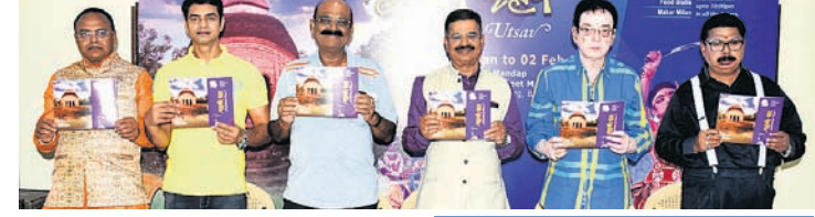
ଭୁବନେଶ୍ୱର, ୨୯୧୧ (ବୁଧବେଳ)

ଆସନ୍ତା ଜାନୁୟାରୀ ୩୧ରୁ ଫେବୃଆରୀ ୨ ପର୍ଯ୍ୟନ୍ତ ଉତ୍କଳ ମଞ୍ଚରେ ଆୟୋଜିତ ହେବ ମୟୂରଭଞ୍ଜ ଉତ୍ସବ। ରାଜଧାନୀ ଭୁବନେଶ୍ୱରରେ ମୟୂରଭଞ୍ଜର ପୂରାତନ କଳା ସଂସ୍କୃତି ସାଜକୁ ପ୍ରଦର୍ଶନ କରାଯାଉଛି।