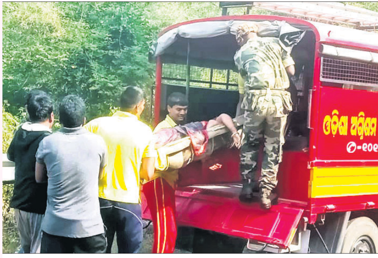
ଜଣେ ଆହତଙ୍କୁ ଚିକିତ୍ସା ପାଇଁ ଅଗ୍ନିଶମ ବିଭାଗ ଗାଡ଼ିରେ ପଠାଯାଇଛି ।

ଦିଗପହଣ୍ଡି, (ଡି.ଏନ.ଏ.)/ବ୍ରହ୍ମପୁର ଅଫିସ/ ରାୟଗଡ଼ା ଅଫିସ, ୨୯୧୧ ଗଞ୍ଜାମ-ଗଜପତି ଜିଲ୍ଲା ସୀମାନ୍ତ ଉପଯୋଗୀ ଘାଟିରେ ମଙ୍ଗଳବାର ବିଳମ୍ବିତ ରାତିରେ ମାତୃତା ନାମକ ଏକ ଘରୋଇ ବସ୍ ନିୟନ୍ତ୍ରଣ ହରାଇ ଓଲଟି ପଡ଼ିଥିଲା । ଏଥିରେ ଚାଲିଗଲା ୮ ଯାତ୍ରୀଙ୍କ ଜୀବନ । ୩୭ରୁ ଉର୍ଦ୍ଧ୍ୱ ଆହତ ହେଲେ । ସେମାନଙ୍କ ପାଇଁ କାଳ ହେଲା କୁହୁଡ଼ି । ପ୍ରବଳ କୁହୁଡ଼ି ଯୋଗୁ ଗାୟା ଭଲଭାବେ ଜଣାପଡ଼ୁ ନ ଥିଲା । ଚାଳକ ଭାରସାମ୍ୟ ହରାଇବାରୁ ବସଟି ପ୍ରଥମେ ରାସ୍ତାକଡ଼ ଏକ ଗଛକୁ ଧକ୍କା ଦେଇ ପରେ ଘାଟିର ୨୦ ଫୁଟ ଚଳୁଥିବା ପଡ଼ିଥିବା କୁହାଯାଉଛି ।