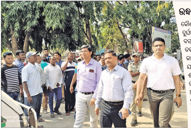
ଦିଗପହଣ୍ଡି ତାଳୁରଖାନା ପରିସରରେ ଗଞ୍ଜାମ ଜିଲ୍ଲାପାଳ, ଗଞ୍ଜାମ ଏସ୍ପି ଓ ବ୍ରହ୍ମପୁର ଉପଜିଲ୍ଲାପାଳ ।