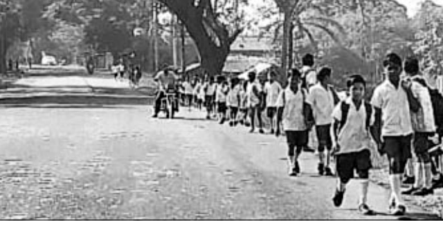
ହଷ୍ଟେଲ ଛାତ୍ରମାନେ ରାଜପଥ ଦେଇ ବିଦ୍ୟାଳୟକୁ ଯାତାୟତ କରୁଛନ୍ତି।

ଦାରିଙ୍ଗବାଡ଼ି ବ୍ଲକ କିରିକୁଟି ଉନ୍ନତ ଉଚ୍ଚ ବିଦ୍ୟାଳୟରେ ଦିନକୁ ଦିନ ସମସ୍ୟା ବହୁଛି। କିରିକୁଟି ଗ୍ରାମ ମଧ୍ୟରେ ଥିବା ଏହି ବିଦ୍ୟାଳୟରେ ପ୍ରଥମରୁ ଅଷ୍ଟମ ପର୍ଯ୍ୟନ୍ତ ଛାତ୍ରାଛାତ୍ରୀଙ୍କ ପାଇଁ ଶ୍ରେଣୀଗୁହ ଅଭାବ ରହିଛି। ନବମ ଓ ଦଶମ ଶ୍ରେଣୀ ପିଲାଙ୍କ ନିମନ୍ତେ କିରିକୁଟିଠାରୁ ପ୍ରାୟ ଦେଢ଼ କି.ମି. ଦୂର ଏକ ଜଙ୍ଗଲ ନିକଟରେ କୋଠା ନିର୍ମାଣ ହୋଇଛି। ସେଠାରେ ଶିକ୍ଷକ ଅଭାବ ରହିଛି। ଏଭଳି ସ୍ଥିତିରେ ପ୍ରଥମରୁ ଅଷ୍ଟମ ଶ୍ରେଣୀର ପିଲାମାନଙ୍କୁ ସେଠାକୁ ନିଆଯାଇ ପାଠ ପଢ଼ାଯାଇଛି; ଯଦ୍ୱାରା ପ୍ରାଥମିକ ଶିକ୍ଷାଦାନ କରୁଥିବା ଶିକ୍ଷକମାନଙ୍କୁ ପ୍ରଥମରୁ ଦଶମ ଶ୍ରେଣୀ ପର୍ଯ୍ୟନ୍ତ ପିଲାମାନଙ୍କୁ ପଢ଼ାଇବାକୁ ପଡ଼ୁଛି। ଅନ୍ୟପକ୍ଷରେ ହଷ୍ଟେଲରେ ରହୁଥିବା ପ୍ରଥମରୁ ଅଷ୍ଟମ ଶ୍ରେଣୀର ୪୦ ଛାତ୍ର ୫୯ ନଂ ଜାତୀୟ