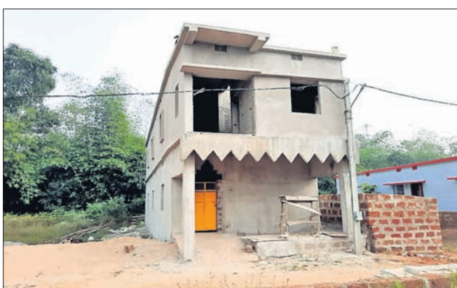
ଆବାସ ଯୋଜନାରେ ୯ ନମ୍ବର ଓଡ଼ିରେ ଏକ ଗୃହକୁ ଦୁଇ ମହଲା କରାଯାଇଛି।

ଅଭିଯୋଗ ଅନୁସାରେ ୨୦୧୮-୧୯ ଆର୍ଥିକବର୍ଷରେ ୪୩୯.୩୯ ଖର୍ଚ୍ଚ ହୋଇ ୩୯୫ ବର୍ଗ ଫୁଟ କାର୍ଯ୍ୟାଦେଶ ପାଇ ଘର କରିଛନ୍ତି। ୭୩୯.୩୯ ଖର୍ଚ୍ଚରେ ପୁରୁଣା ଘର ଛାତ ପତନ ହୋଇ ରହିଥିଲା। ଅନ୍ୟ ଗ୍ଲାନର ନିଅଁ ଖୋଳା