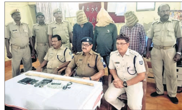
ଗିରଫ ଅଭିଯୁକ୍ତ ସହ ପୋଲିସ୍ ଅଧିକାରୀମାନେ ।