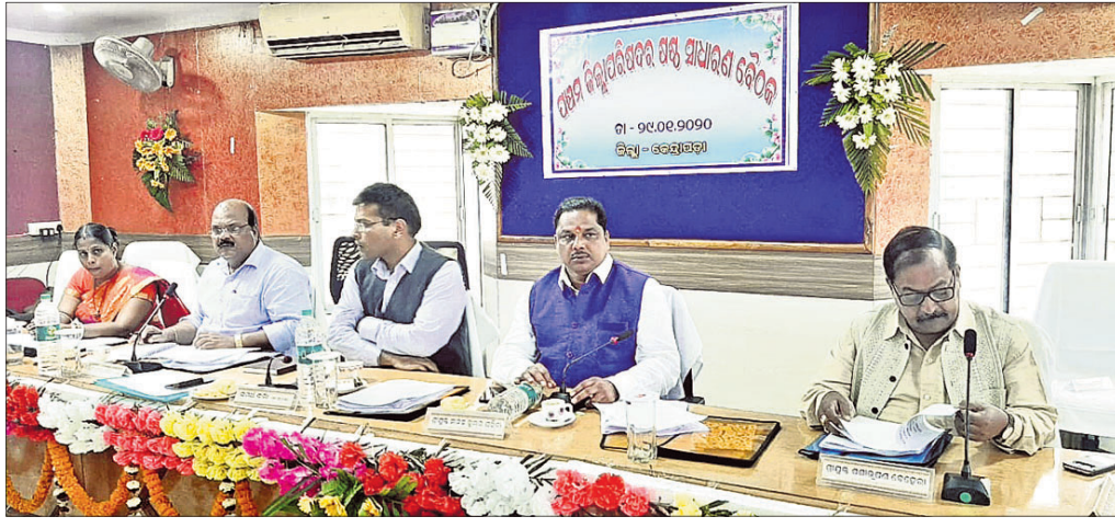
ବୈଠକରେ ଉପସ୍ଥିତ ପ୍ରଶାସନିକ ଅଧିକାରୀମାନେ ।