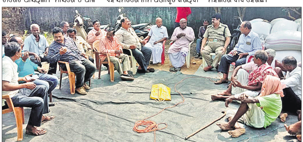
ଧାରଣାରେ ବସିଥିବା ଚାଷୀ ଓ ଅନ୍ୟମାନେ।

ବୋଲଗଡ଼ ସେବା ସମବାୟ ସମିତିରେ ଧାନ ବିକ୍ରି ପାଇଁ ୨୮୭୭ଟା ଚାଷୀ ନାମ ପଞ୍ଜୀକରଣ କରିଥିଲେ। ପଞ୍ଜୀକୃତ ହୋଇଥିବା ଚାଷୀମାନଙ୍କଠାରୁ ୧୬ ହଜାର କୁଇଣ୍ଟାଲ ଧାନ କ୍ରୟ କରାଯିବା ପାଇଁ ବିକ୍ରି ପକ୍ଷରୁ ଧାର୍ଯ୍ୟ କରାଯାଇଥିଲା। ତେବେ ଏହି ମଣ୍ଡିରୁ ଜାନୁଆରୀରେ ୫ ହଜାର କୁଇଣ୍ଟାଲ ଧାନ କ୍ରୟ କରାଯିବାକୁ ପାରିନାହାନ୍ତି। ମାସରେ ୪ ପାଲି