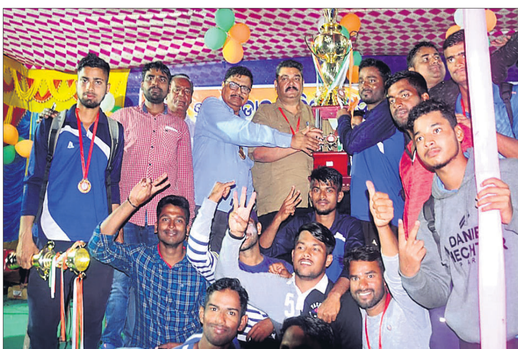
ତ୍ରୈପି ସହ ବିଜେତା ଦଳ ।