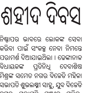
ହିରୋଲ, ୩୦୧ (ଡି.ଏନ.ଏ.)

ଡେକାନାଲ ଜିଲ୍ଲା ବିଜେଡି ପକ୍ଷରୁ ଶହାଦ ଦିବସ ପାଳିତ ହୋଇଯାଇଛି। ପ୍ରାୟ ୨୦୦ରୁ ଊର୍ଦ୍ଧ୍ୱ ପ୍ରତିଯୋଗୀ ଅଂଶଗ୍ରହଣ କରିଥିଲେ। ଉଦ୍ୟାନ ବିଭାଗ ତରଫରୁ ଏହି ପ୍ରଦର୍ଶନୀ