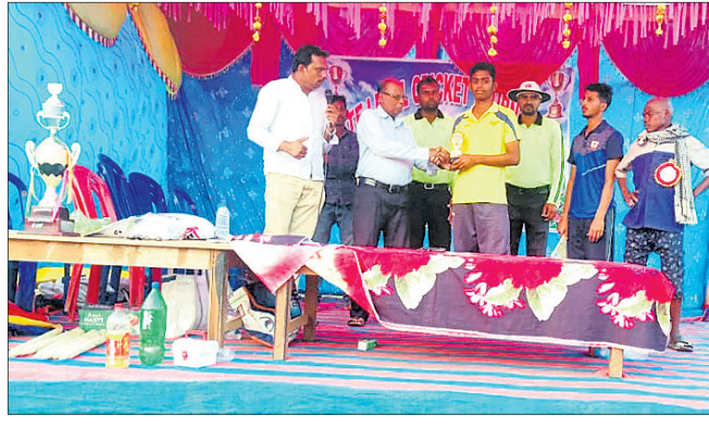
ଅତିଥିମାନେ ଜଣେ କୃତୀ ଖେଳାଳିଙ୍କୁ ପୁରସ୍କୃତ କରୁଛନ୍ତି।