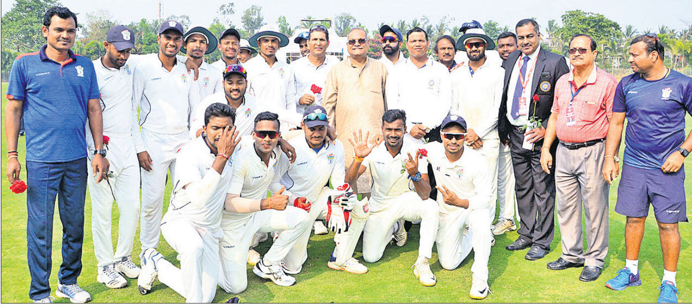
ଆସୀମ ବିପକ୍ଷରେ ରଣଜୀ ତ୍ରୁପ୍ତି ମ୍ୟାଚ୍ ବିଜୟୀ ଓଡ଼ିଶା ଦଳ ଅଟେ ।