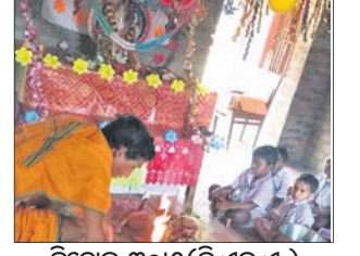
ହିରୋଲ, ୩୦୧ (ଡି.ଏନ.ଏ.)

ହିରୋଲ କୁଳ କଳାମଣି-ରାଜିଶିଂପୋଖରୀ ଅଞ୍ଚଳରେ ଗୁରୁବାର ବିଭିନ୍ନ ଅନୁଷ୍ଠାନ ପକ୍ଷରୁ ସରସ୍ୱତୀ ପୂଜା ଅନୁଷ୍ଠିତ ହୋଇଯାଇଛି। ତିହସାହି ପ୍ରାଥମିକ, ଉଚ୍ଚ ପ୍ରାଥମିକ ଓ ଅଜନଶକ୍ତି ପକ୍ଷରୁ ମିଳିତ ପୂଜା ମଣ୍ଡପରେ ଦେବୀ ସରସ୍ୱତୀଙ୍କ ପୂଜା ଅନୁଷ୍ଠିତ ହୋଇଥିଲା। ସେହିପରି ବୁଧାକୋଟ ଓଡ଼ିଶା ଶିଶୁ ମନ୍ଦିର, ବରପାଳ, କର୍ମପୁର, ଖଜୁରିଆପୁଣ୍ଡା ମହାନ୍ତି ଧନ୍ୟବାଦ ପ୍ରଦାନ କରିଥିଲେ।