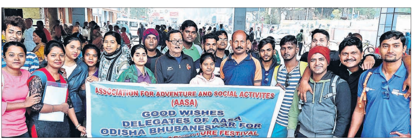
ନ୍ୟାଶନାଲ ଆଡ଼ଭେଞ୍ଚର ଫେଷ୍ଟିଭାଲରେ ଭାଗ ନେବାକୁ ଯିବା ପୂର୍ବରୁ ଅତିଥିକ ସହ ଆସାର ୪୧ ଜଣିଆ ପ୍ରତିନିଧି ଦଳ ।