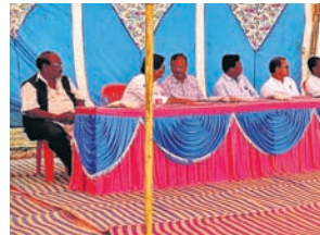
ଉଦ୍ଘାଟନା କାର୍ଯ୍ୟକ୍ରମରେ ଯୋଗ ଦେଇଥିବା ଅତିଥିମାନେ ।