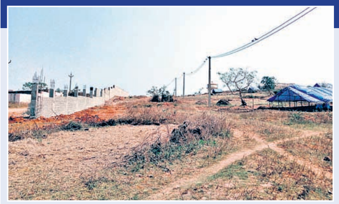
ବିକ୍ରମପୁରଠାରେ ପ୍ଲାନେଟାରିୟମ ନିର୍ମାଣ ପାଇଁ ଚିହ୍ନଟ କରାଯାଇଛି ।

ଏଥିପାଇଁ ୨୦୧୮ ଜାନୁଆରୀରେ ବିକ୍ରମପୁରଠାରେ ୧୦ ଏକର ଜମିରେ ପ୍ଲାନେଟାରିୟମ ନିର୍ମାଣ କାର୍ଯ୍ୟକୁ ଶୁଭ କରାଯାଇଥିଲା । ଏହାର ନିର୍ମାଣ କାର୍ଯ୍ୟ ଲାଗୁ ହେବା ପରେ ପ୍ଲାନେଟାରିୟମ ପାଟେରି ନିର୍ମାଣ ପାଇଁ ୨୦୧୮ ଏପ୍ରିଲରେ ରାଜ୍ୟ ସରକାରଙ୍କ ବିଜ୍ଞାନ ଓ ପ୍ରଯୁକ୍ତି ବିଦ୍ୟା ବିଭାଗ ୪୯ ଲକ୍ଷ ଟଙ୍କା ଲଠକାକୁ ହସ୍ତାନ୍ତର କରିଥିଲା ।