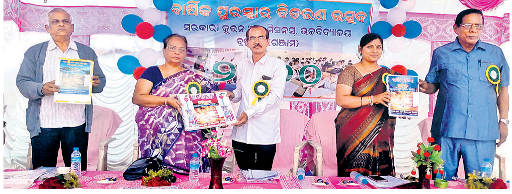
ଅତିଥିମାନେ ମୁଖ୍ୟମନ୍ତ୍ରୀଙ୍କୁ ଉଦ୍ଘୋଷଣା କରୁଛନ୍ତି ।