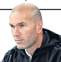
-ଜିନେଡିନ ଜିଡାନ, ଫୁଟବଲ କୋଚ୍

ଗ୍ୟାରେଥ ବାଲେ ରିଅଲ ମାଡ୍ରିଡ଼ ସହିତ ଅଛନ୍ତି, ସେ ଦଳ ଛାଡ଼ିଛନ୍ତି ବୋଲି ଯାହା ଶୁଣିବାକୁ ମିଳିଛି ତା' ଉପରେ ଯୁକ୍ତମତ ଦେବାକୁ ଚାହେଁନା ।