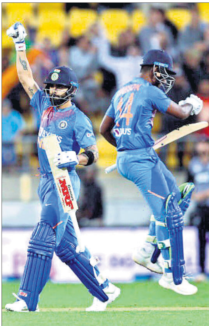
ଭାରତକୁ ଜିତାଇବା ପରେ ବିରାଟ କୋହଲି ଓ ସଖୁ ସାମସର ଖୁସି ମନାଉଛନ୍ତି ।