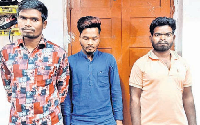
ଗିରଫ ୩ ଅଭିଯୁକ୍ତ ।

କନ୍ଧପୁର, ୩୧୧୧ (ଡି.ଏନ୍.ଏ./ନି.ପ୍ର.) ଗଞ୍ଜେଇ ବିକ୍ରି ପରେ ସେହି ଟଙ୍କା ଶୁକ୍ରବାର ଭୋରରେ ନବରଙ୍ଗପୁର ମାଲକାନଗିରି ଚାଲାଣ ହେଉଥିବା ବେଳେ ଚଢ଼ାଇ କରି ଜବତର ସଦରଥାନା । ଏଥିରେ ୫ ଲକ୍ଷରୁ ଅଧିକ ଟଙ୍କା ପିକ୍‌ଅପ୍ ଭାବେ, ବାଲକ୍ ଜବତ ହୋଇଛି।