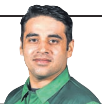
-ଆବିଦ ଅଲ୍ଲା, ପାକିସ୍ତାନ ଓପନିଂ ବ୍ୟାଟ୍‌ସମ୍ୟାନ

ଭାରତର ମହାନ ବ୍ୟାଟ୍‌ମ୍ୟାନ ସଚିନ ଚେନ୍ନାଇକରଙ୍କ ଖେଳିବା ଝାଲରେ ଯୁଦ୍ଧଶୈଳୀ ଭାବେ ପ୍ରଭାବିତ ।