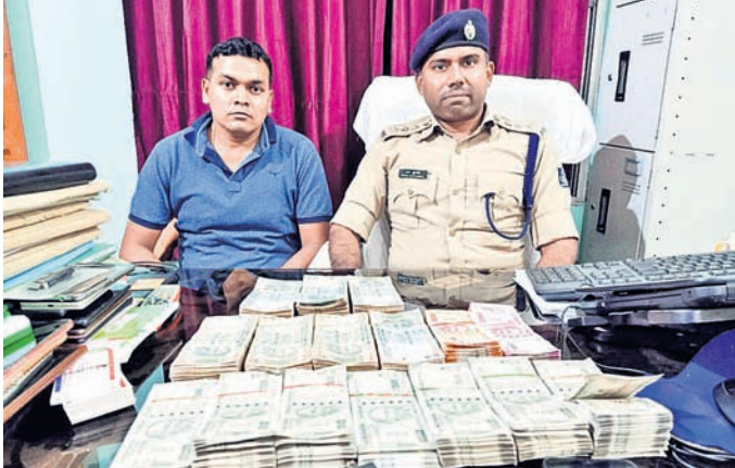
ଜବତ ହୋଇଥିବା ଟଙ୍କା ।

କନ୍ଧପୁର, ୩୧୧୧ (ଡି.ଏନ୍.ଏ./ନି.ପ୍ର.) ଗଞ୍ଜେଇ ବିକ୍ରି ପରେ ସେହି ଟଙ୍କା ଶୁକ୍ରବାର ଭୋରରେ ନବରଙ୍ଗପୁର ମାଲକାନଗିରି ଚାଲାଣ ହେଉଥିବା ବେଳେ ଚଢ଼ାଇ କରି ଜବତର ସଦରଥାନା । ଏଥିରେ ୫ ଲକ୍ଷରୁ ଅଧିକ ଟଙ୍କା ପିକ୍‌ଅପ୍ ଭାବେ, ବାଲକ୍ ଜବତ ହୋଇଛି।