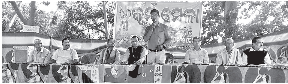
କୁର୍ମନାରାୟଣ ବାର୍ଷିକ ପୂଜା ଉତ୍ସବ ଅବସରରେ ଉପସ୍ଥିତ ଅତିଥିମାନେ ।