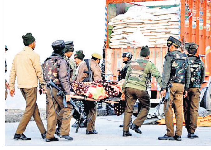
ଆତଙ୍କବାଦୀଙ୍କ ମୃତଦେହକୁ ସୁରକ୍ଷାକର୍ମୀମାନେ ବୋହି ନେଉଛନ୍ତି ।