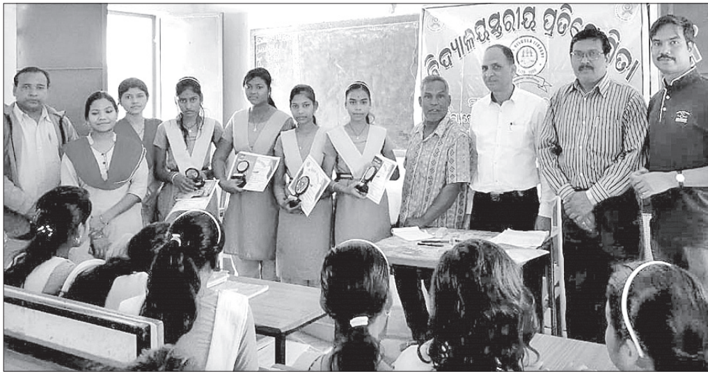
ଅତିଥିଙ୍କ ସହ କୃତୀ ପ୍ରତିଯୋଗୀମାନେ।