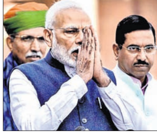
ଏନ୍‌ଡିଏ ନେତାଙ୍କୁ ମୋତିଙ୍କ ପରାମର୍ଶ

ନାଗରିକତ୍ୱ ସଂଶୋଧନ ଆଇନ (ସିଏଏ)କୁ ନେଇ ତାଙ୍କ ସରକାର ଉନ୍ନତ ଅନୁଭବ କରିବାର କୌଣସି କାରଣ ନାହିଁ ବୋଲି ପ୍ରଧାନମନ୍ତ୍ରୀ ନରେନ୍ଦ୍ର ମୋଦି ଏନ୍‌ଡିଏ ବୈଠକରେ କହିଛନ୍ତି । ପାର୍ଲିମେଣ୍ଟରେ ସିଏଏକୁ ଦୃଢ଼ ସମର୍ଥନ କରିବା ଲାଗି ସେ ଏନ୍‌ଡିଏ ନେତାମାନଙ୍କୁ ଅନୁରୋଧ କରିଛନ୍ତି । ବଜେଟ ଅଧିବେଶନରେ ଏନ୍‌ଡିଏର ଉପକ୍ରମଣ କର୍ମ ଶୁଭ ଚାହାଁ ଉପରେ ଆଲୋଚନା ପାଇଁ ଭାଜପା ଓ ସହଯୋଗୀ ଦଳର ନେତାମାନଙ୍କ ବୈଠକ ଡକାଯାଇଥିଲା । ସିଏଏରେ ପ୍ରସଙ୍ଗରେ ପ୍ରତି ପକ୍ଷପାତ କରାଯାଇଥିବା ବିରୋଧୀ ଅଭିଯୋଗ କରୁଛି । ସରକାର ନାଗରିକତ୍ୱ ଆଇନରେ ସଂଶୋଧନ ଆଣି କିଛି ଭୁଲ୍ କରିନାହାନ୍ତି । ଏନ୍‌ଡିଏ ତେଣୁ ବିରୋଧୀଙ୍କୁ ଆକ୍ରମଣାତ୍ମକ