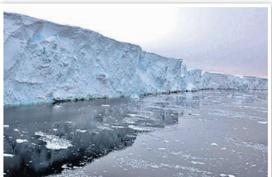
ପାଣି ଯୋଗୁଁ ଏହା ଶୀଘ୍ର ତରଳିପାରେ ବୋଲି ଅନୁମାନ କରାଯାଇଛି। ଆୟତ୍ତ ଗ୍ଲୋସିଅର ଉପରେ ଗବେଷଣା କରି ବୈଜ୍ଞାନିକମାନେ ଏହି

ଓଷ୍ଟ୍ରିଆର ପୃଥିବୀ ଉପରେ ବିପଦ ମାଡ଼ି ଆସୁଛି। ଫ୍ଲୋରିଡାରେ ଶେତ୍ର ଭଳି ହିମପାହାଡ଼ ତରଳିବାରେ ଲାଗିଛି ବୋଲି ସମ୍ପୃକ୍ତି ଏକ ଗବେଷଣାକୁ ଜଣାପଡ଼ିଛି। ଜଳବାୟୁ ପରିବର୍ତ୍ତନ ଏବଂ ଗ୍ଲୋବାଲ୍ ଓଷ୍ଟ୍ରିଆ ଯୋଗୁ ପ୍ରଥମଥର ପାଇଁ ଆଣ୍ଟାର୍କଟିକାରେ ଗରମ ପାଣି ଯୋଗୁ ବରଫ ତରଳି ସମୁଦ୍ର ଜଳସ୍ତର ବୃଦ୍ଧି ଘଟିଥିବା ବୈଜ୍ଞାନିକମାନେ କହିଛନ୍ତି। ଗବେଷଣାକୁ ଜଣାପଡ଼ିଛି ଯେ, ବରଫ ତଳେ ପାଣିର ଡାପମାତ୍ରା ୨୭ ଟ୍ରାୟା ସେଲ୍ସିୟସ୍ ଉପରେ କିମ୍ବା ୩୧ ଟ୍ରାୟା ଫାରେନହାଇଟ୍ସ୍ କମ୍ ରହୁଛି, ଯାହା ସାଧାରଣ ଫ୍ରୀଜ୍ ପଏଣ୍ଟଠାରୁ ଉପରେ ବୋଲି କୁହାଯାଇଛି। ବିଶେଷକରି ଏହା ଗ୍ଲୋସିଅରର ତଳଭାଗର ଡାପମାତ୍ରା ବୋଲି ବୈଜ୍ଞାନିକମାନେ କହିଛନ୍ତି। ତେବେ ଗ୍ଲୋସିଅର କେଉଁ ଅନୁପାତରେ ତରଳୁଛି ତାହା ସ୍ପଷ୍ଟ କରାଯାଇନାହିଁ। କିନ୍ତୁ ବୈଜ୍ଞାନିକଙ୍କ ରିପୋର୍ଟ ଅନୁଯାୟୀ ଅନୁମାନ କରାଯାଇଛି, ହୁଏତ ଏହା କିଛି ଦଶନ୍ଧି ମଧ୍ୟରେ ସମ୍ପୂର୍ଣ୍ଣ ଭାବେ ତରଳିଯାଇପାରେ। କାରଣ ବରଫ ତଳେ ଥିବା ଗରମ