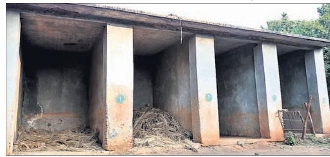
ଦେଶାନ୍ତର ଅଧିକ, ୩୧୧୧

ଗତିବିଧି ଅନୁଧ୍ୟାନ କରି ଅତିରିକ୍ତ ପିସିସିଏଫ୍ ସୂଚନା ଦେଇଛନ୍ତି ଯେ, ଉକ୍ତ ହାତୀର ସ୍ୱାସ୍ଥ୍ୟାବସ୍ଥା ଭଲ ଅଛି। ସେ ଶାନ୍ତ ଅଛି। ଜନବସତିରେ ଲୋକଙ୍କ ପ୍ରତି ବିପଦ ସୃଷ୍ଟି କରୁଥିବା ପ୍ରାଣୀକୁ ଧରିବା ନିୟମ ରହିଛି। ହାତୀଟି ଜନବସତି ଲାଗି ବିପଦ ସୃଷ୍ଟି କରିଥିଲା। ସ୍ୱଭାବରେ ପରିବର୍ତ୍ତନ ଲାଗି ତାକୁ ଆଣି ରେସ୍କ୍ୟୁ ସେଣ୍ଟରରେ ରଖାଯାଇଛି। ରାଜ୍ୟରେ ୨୦୦୦ ହାତୀ ଅଛନ୍ତି। ସେଥିରୁ ମାତ୍ର ୨ଟି ଏପରି ହିଁସୁ ଆଚରଣ କରୁଥିବା ନଜରକୁ ଆସିଛି। ରେସ୍କ୍ୟୁ ସେଣ୍ଟରକୁ ଉନ୍ନତୀକରଣ କରାଗଲେ ସମସ୍ୟା ରହିବ ନାହିଁ। ଚିଡ଼ିଆଖାନାରେ ଆନୁଷ୍ଠାନିକ ବ୍ୟବସ୍ଥା କରିବାକୁ ଡେଇଁବାକୁ ପଡ଼ିବ। ଏହାକୁ ନିୟନ୍ତ୍ରଣ କରିବା ପାଇଁ ପିସିସିଏଫ୍, ଅନୁଗୋଳ ଆରବିସିଏଫ୍ ଆଚରଣ କରୁଥିବା ନଜରକୁ ଆସିଛି। ହାତୀମୃତ୍ୟୁ ଘଟଣାର ସମୀକ୍ଷା କରିବାକୁ ଦେଶାନ୍ତର ଆସିଥିବାବେଳେ ପିସିସିଏଫ୍, ଅନୁଗୋଳ ଆରବିସିଏଫ୍ ପରିବର୍ତ୍ତନ କରିଛନ୍ତି। ଏହି ଅବସରରେ ଅଧିକାରୀମାନେ କେନ୍ଦ୍ର ଏବଂ ହାତୀ ରେସ୍କ୍ୟୁ ସେଣ୍ଟର ରୁଲ୍ ଦେଖୁଥିଲେ। ରେସ୍କ୍ୟୁ ସେଣ୍ଟରରେ ରଖାଯାଇଥିବା ନରହତ୍ୟା ଦନ୍ତାର