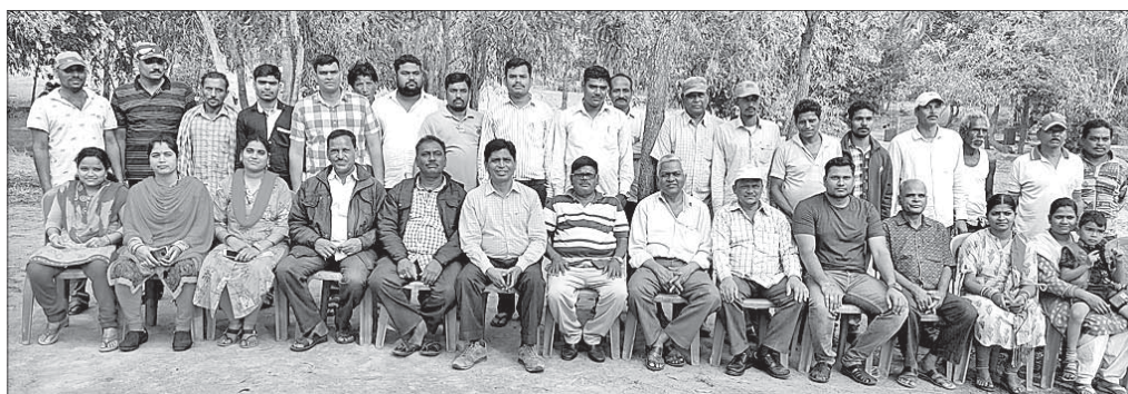
ଜଙ୍ଗଲ ସୁରକ୍ଷା ସଚେତନତା ଶିବିରରେ ବନ କର୍ମଚାରୀଙ୍କ ସମେତ ଗ୍ରାମବାସୀ।