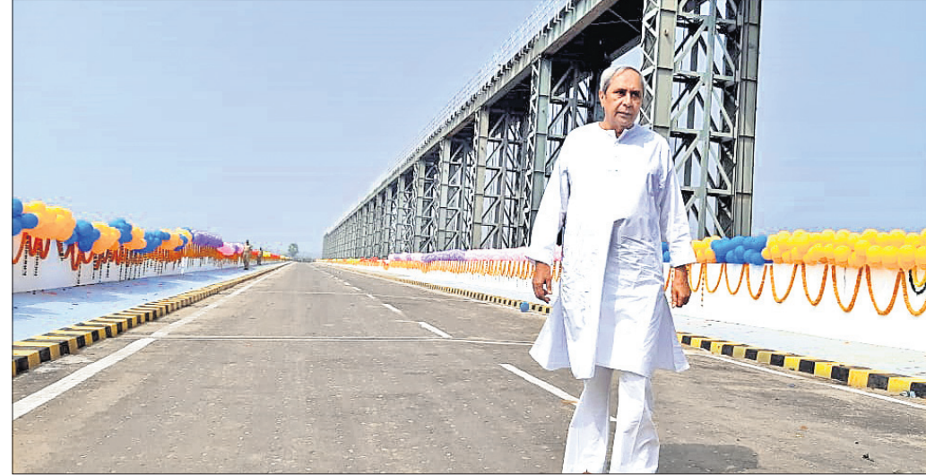
ଆନନ୍ଦପୁର ବ୍ୟାରେଜ୍‌କୁ ଶୁକ୍ରବାର ମୁଖ୍ୟମନ୍ତ୍ରୀ ନବୀନ ପଟ୍ଟନାୟକ ଲୋକାର୍ପଣ କରିବା ପରେ ବୁଲି ଦେଖୁଛନ୍ତି।