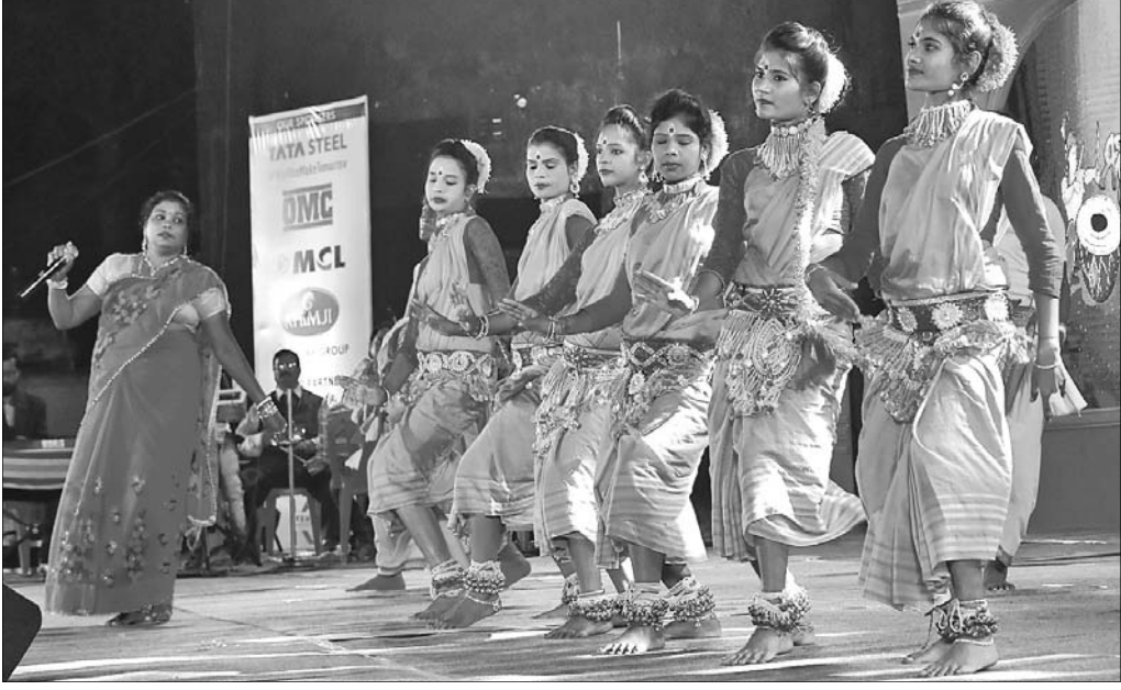
ଉତ୍କଳ ମଣ୍ଡପରେ ଆୟୋଜିତ ନବମ ମୟୂରଭଞ୍ଜ ଉତ୍ସବରେ ସ୍ଥାନୀୟ ଶିଳ୍ପୀମାନେ ନୃତ୍ୟ ପରିବେଷଣ କରୁଛନ୍ତି।