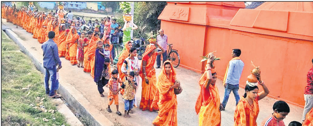
ନମିକାମାନେ କଳସ ଯାତ୍ରାରେ ଯାଉଛନ୍ତି।

କଣିହାଁ, ୩୧।୧ (ବି.ଏନ.ଏ.) କଣିହାଁ ବ୍ଲକ ବିଜିରୋଳ ଗ୍ରାମରେ ବିଶ୍ୱ କଲ୍ୟାଣ ଅଷ୍ଟପ୍ରହର ନାମୟଜ୍ଞ ଶୁକ୍ରବାର ଆରମ୍ଭ ହୋଇଛି। ଗ୍ରାମର ମହିଳାମାନେ