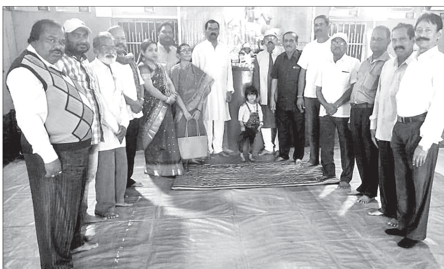
ଡେକାନାଲ ଜିଲା କଂଗ୍ରେସ ପକ୍ଷରୁ ଗାନ୍ଧୀମନ୍ଦିର ପରିସରରେ ମହାତ୍ମା ଗାନ୍ଧୀଙ୍କ ୭୨ତମ ତିରୋଧାନ ଦିବସ ପାଳନ ଅବସରରେ ଉପସ୍ଥିତ କର୍ମକର୍ତ୍ତାମାନେ।