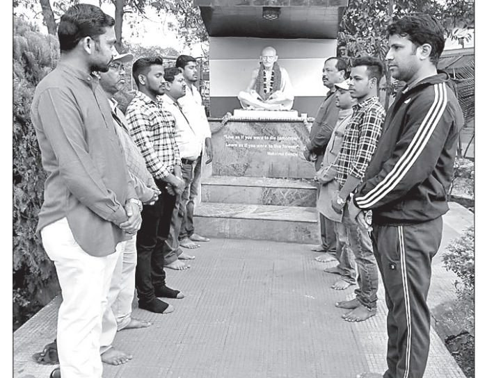
ଗାନ୍ଧୀଙ୍କ ବଳିଦାନ ଦିବସ ପାଳିତ।