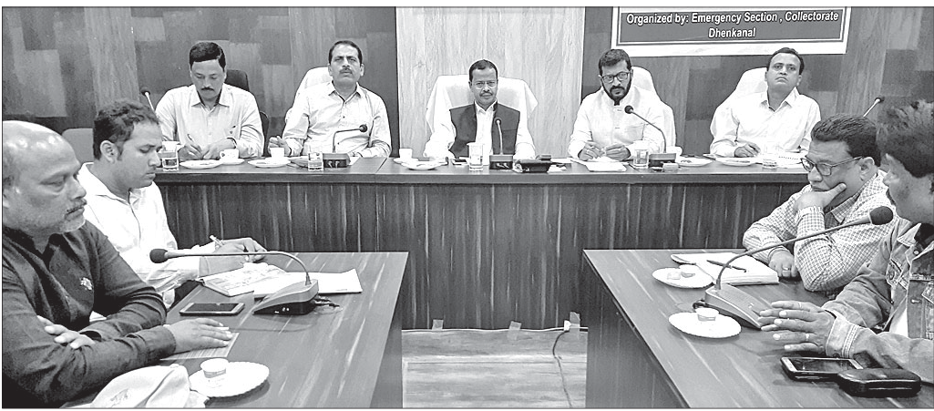
ବୈଠକରେ ଜିଲାପାଳଙ୍କ ସମେତ ଅନ୍ୟମାନେ।