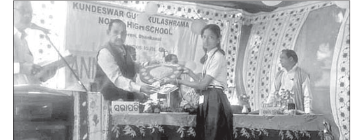
ଅତିଥି ଜଣେ କୃତୀ ଛାତ୍ରୀଙ୍କୁ ପୁରସ୍କୃତ କରୁଛନ୍ତି।