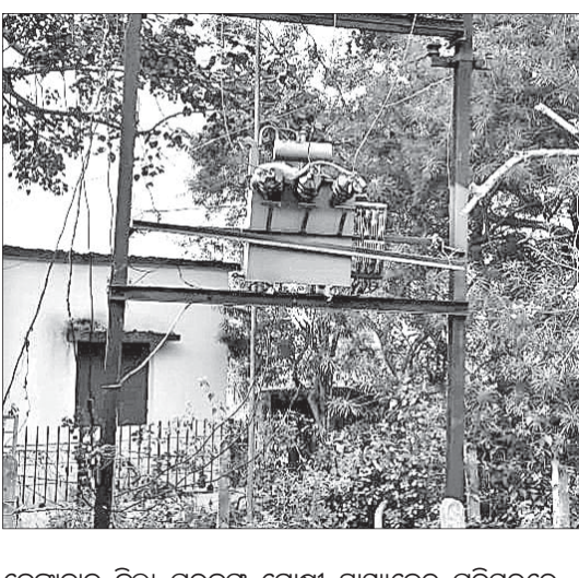
ଡେକାନାଲ ଜିଲା ପରଜଙ୍ଗ ଗୋଷ୍ଠୀ ସ୍ୱାସ୍ଥ୍ୟକେନ୍ଦ୍ର ପରିସରରେ ଥିବା ବିଦ୍ୟୁତ୍ ଗ୍ରାହ୍ୟତ୍ୱପର୍ଯ୍ୟନ୍ତେ ଲାଗି ଶୁକ୍ରବାର ଏକ ମାଙ୍କଡ଼ର ମୃତ୍ୟୁ ଘଟିଛି। ମୃତ ମାଙ୍କଡ଼କୁ ବାହାର କରାଯାଇ ନ ଥିବାରୁ ଏହାକୁ ନେଇ ଅସନ୍ତୋଷ ପ୍ରକାଶ ପାଇଛି।