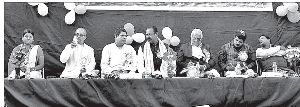
କାର୍ଯ୍ୟକ୍ରମରେ ମଞ୍ଚାସୀନ ଅତିଥିମାନେ।