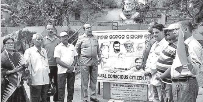
ଗାନ୍ଧିଜୀଙ୍କ ପ୍ରତିମୂର୍ତ୍ତିରେ ପୁଷ୍ପମାଳ୍ୟ ଅର୍ପଣ ଅବସରରେ ଫୋରମ୍‌ର କର୍ମକର୍ତ୍ତାମାନେ।