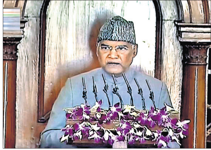
ପାର୍ଲିମେଣ୍ଟରେ କୋବିଦଙ୍କ ଅଭିଭାଷଣ

ପାର୍ଲିମେଣ୍ଟର ବଜେଟ ଅଧିବେଶନ ଶୁକ୍ରବାର ଆରମ୍ଭ ହୋଇଛି । ପ୍ରାରମ୍ଭରେ ରାଷ୍ଟ୍ରପତି ରାମନାଥ କୋବିନ୍ଦ ସଂସଦର କେନ୍ଦ୍ରୀୟ ହଲରେ ଭବ୍ୟ ଗୃହ ନିମିତ୍ତ ଅଧିବେଶନକୁ ସମୟାଧିକ କରିବା ଅବସରରେ ନାଗରିକତ୍ୱ ସଂଶୋଧନ ଆଇନ (ସିଏଏ)କୁ ଐତିହାସିକ ବୋଲି କହିଛନ୍ତି । ଏହା ମହାତ୍ମା ଗାନ୍ଧୀଙ୍କ ସ୍ୱପ୍ନକୁ ପୂରଣ କରିଥିବା ସେ ମତ ଦେଇଛନ୍ତି । କାରଣ ଦେଶ ବିଭାଜନ ପରେ ପାକିସ୍ତାନରେ ରହିବାକୁ ଚାହୁଁ ନ ଥିବା ହିନ୍ଦୁ ଓ ଶିଖ୍ମାନେ ଯଦି ଭାରତ ପଳାଇଥାନ୍ତେ, ତେବେ ସେମାନଙ୍କୁ ସାଧାରଣ ଜୀବନଯାପନର ସୁବିଧା ଯୋଗାଇଦେବା ଭାରତ ସରକାରଙ୍କ କର୍ତ୍ତବ୍ୟ ବୋଲି ଗାନ୍ଧୀଜୀ କହିଥିଲେ । ଯେକୌଣସି ପ୍ରସଙ୍ଗ ଉପରେ ବିତର୍କ ଓ ଆଲୋଚନା ହାତୀ ରାଶତନ୍ତ୍ର ସୁଦ୍ଧା ହୋଇଥାଏ । ଅନ୍ୟପକ୍ଷରେ ଆୟୋଜନ ବେଳେ ହିଂସାକାଣ୍ଡ ଗଣତନ୍ତ୍ରକୁ ଦୁର୍ବଳ କରିଦେଇଥାଏ ବୋଲି ରାଷ୍ଟ୍ରପତି କହିଥିଲେ । ରାଷ୍ଟ୍ରପତିଙ୍କ ଏଭଳି ମନ୍ତବ୍ୟକୁ କେତେକ ବିପକ୍ଷ ଦଳ ସଦସ୍ୟ ବିରୋଧ କରିଥିଲେ । ସେମାନେ ବ୍ୟାନର ପ୍ରଦର୍ଶନ କରିବା ସହ 'ଲଜ୍ଜା, ଲଜ୍ଜା' ଘୋରାନ ଦେଇଥିଲେ ।