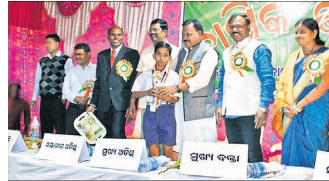
କୃତୀ ଛାତ୍ରଙ୍କୁ ମୁଖ୍ୟ ଅତିଥି ମାନପତ୍ର ପ୍ରଦାନ କରୁଛନ୍ତି।