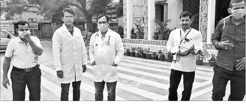
ଭୁବନେଶ୍ୱର, ୩୧।୧ (ବୁଧବେଳା)