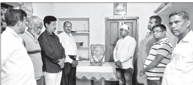
ଭାଜପା କାର୍ଯ୍ୟକ୍ରମରେ ଗାନ୍ଧୀଙ୍କ ତିରୋଧାନ ଦିବସ ପାଳନ କରାଯାଇଛି।