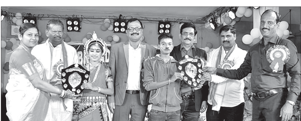
କୃତୀ ପ୍ରତିଯୋଗୀଙ୍କୁ ପୁରସ୍କୃତ କରାଯାଇଛି।