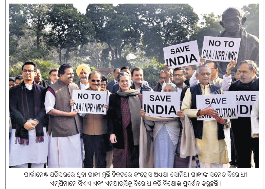
ପାର୍ଲିମେଣ୍ଟ ପରିସରରେ ଥିବା ଗାନ୍ଧୀ ମୂର୍ତ୍ତି ନିକଟରେ କଂଗ୍ରେସ ଅଧ୍ୟକ୍ଷା ସୋନିଆ ଗାନ୍ଧୀଙ୍କ ସମେତ ବିରୋଧୀ ଏନ୍‌ପିଆରେ ସିଏଏ ଏବଂ ଏନ୍‌ଆର୍‌ସିକୁ ବିରୋଧ କରି ବିରୋଧୀ ପ୍ରଦର୍ଶନ କରୁଛନ୍ତି ।