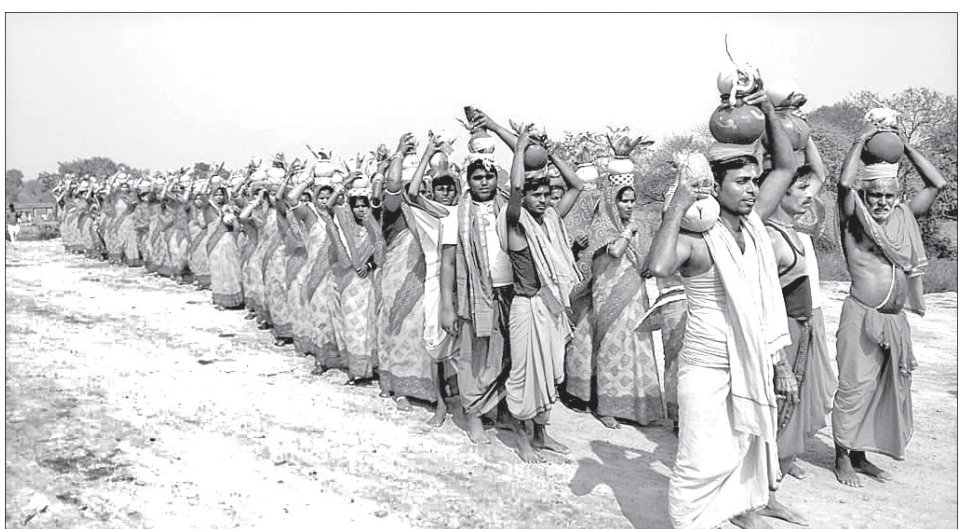
ଡେକାନାଲ ହିନ୍ଦୋଳ ଉପଖଣ୍ଡ ଗାଲପଡ଼ାଠାରୁ ବାବା ସିଦ୍ଧେଶ୍ୱରଙ୍କ ପୀଠରେ ବିଶ୍ୱଶାନ୍ତି ମହାବିଷ୍ଣୁ ଯଜ୍ଞ ଉପଲକ୍ଷେ ଲିଙ୍ଗରା କୋରରୁ କଳସ ଶୋଭାଯାତ୍ରାରେ ପାଣି ଅଣାଯାଉଛି।