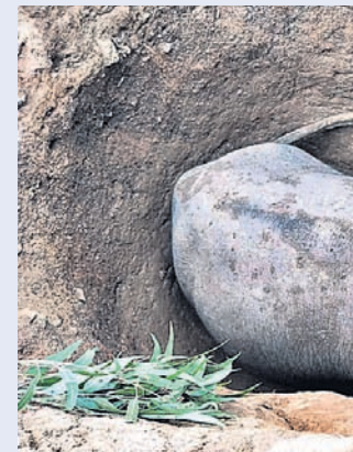
ଖାତରେ ଖସିପଡ଼ିଥିବା ହାତୀ ।