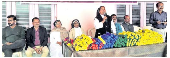
ଉତ୍ସବରେ ଉପସ୍ଥିତ ଅତିଥି ।

ଭଦ୍ରକ ଅତିଥି, ୨୧: ଟାଏଲୋକ୍ଷୋ ଆସୋସିଏଶନ ଅଫ୍ ଭଦ୍ରକ ପକ୍ଷରୁ କଲରବେଲୁ ଟେଷ୍ଟ ଓ ପ୍ରମାଣପତ୍ର ପ୍ରଦାନ ଉତ୍ସବ ରବିବାର ଅନୁଷ୍ଠିତ ହୋଇଯାଇଛି ।