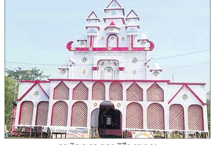
କନ୍ୟା କିଷାନ କୁଳ ପକ୍ଷରୁ ନିର୍ମିତ ତୋରଣ ।

ସରସ୍ଵତୀ ପୂଜା ପାଇଁ ପ୍ରସିଦ୍ଧିଲାଭ କରିଥିବା ଭଦ୍ରକ ଜିଲାର ବନ୍ଦ ବୁକ ଅନ୍ତର୍ଗତ ସରମରା ଗ୍ରାମ ଉତ୍ସବମୁଖର ହୋଇଛି ।