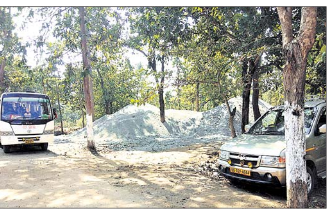
ଭାମକୁଣ୍ଡ ପର୍ଯ୍ୟଟନ କେନ୍ଦ୍ରର ପାର୍କ ନିକଟରେ ପଥରଗୁଣ୍ଠ ଗଠା ହୋଇଛି ।

କେନ୍ଦୁଝର ଜିଲାର ଗୁରୁତ୍ଵପୂର୍ଣ୍ଣ ଭାମକୁଣ୍ଡ ପର୍ଯ୍ୟଟନ କେନ୍ଦ୍ରର ବିକାଶ ପାଇଁ ପ୍ରଶ୍ଵାସନ ପକ୍ଷରୁ ବ୍ୟାପକ ପଦକ୍ଷେପ ନିଆଯାଇଛି । ଫଳରେ ପର୍ଯ୍ୟଟକଙ୍କ ଆଗ୍ରହ ବଢ଼ିଛି । ଏଥିପାଇଁ ଏହି କେନ୍ଦ୍ରର ରକ୍ଷଣାବେକ୍ଷଣ ପାଇଁ ପଦକ୍ଷେପ ନେବା ସହ ଏଣୁ ଫି ବ୍ୟବସ୍ଥା ଆରମ୍ଭ ହୋଇଛି । ଏହି ଏଣୁ ଫି ଆଦାୟକୁ ଏକ ସଂଗ୍ରାହଣ ଠିକାରେ ଦିଆଯାଇଛି । ଏଥିପାଇଁ ସ୍ଥାନୀୟ ଯୁବକ ସଂଘ ଲକ୍ଷ୍ମୀଧର ଚକା ଦେଇ ଏହି କାମ ନେଇଛି । ତେବେ ଏହି କେନ୍ଦ୍ରର ଚାରିପାଖରେ ଥିବା ଜଙ୍ଗଲର ସୁରକ୍ଷା କରାଯାଉ ନ ଥିବା, ରାସ୍ତା ନାମରେ ଜଙ୍ଗଲ କାଟି ସଫା କରାଯିବା ସହ ଜଙ୍ଗଲ ମଧ୍ୟରେ ବାଲି, ପଥର ଜମା କରାଯାଉଥିବାରୁ ପରିବେଶ ପ୍ରଦୂଷିତ ହେବା ସହ ବହୁମାତ୍ରାରେ ନଷ୍ଟ ହେଉଥିବାରୁ ପର୍ଯ୍ୟଟକମାନେ ଅସନ୍ତୋଷ ବ୍ୟକ୍ତ କରୁଛନ୍ତି । ଏଠାରୁ ଜିଲା