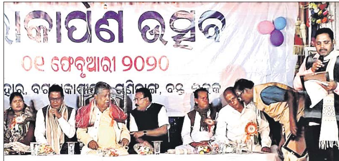
ଲୋକାର୍ପଣ ଉତ୍ସବରେ ଉପସ୍ଥିତ ଅତିଥିମାନେ ।

ବନ୍ଦ ବୁକ ଗଣିତାଳ ପଞ୍ଚାୟତ ବରଦା କାଶିପୁର ଛକସ୍ଥିତ ଲକ୍ଷ୍ମୀନାରାୟଣ ମନ୍ଦିର ଲୋକାର୍ପଣ ଉତ୍ସବ ଅନୁଷ୍ଠିତ ହୋଇଯାଇଛି ।