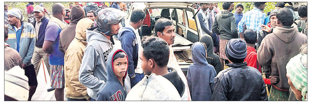
ମୃତଦେହ ଉଦ୍ଧାର ହୋଇଥିବା ସ୍ଥାନରେ ଲୋକେ ଜମା ହୋଇଛନ୍ତି।