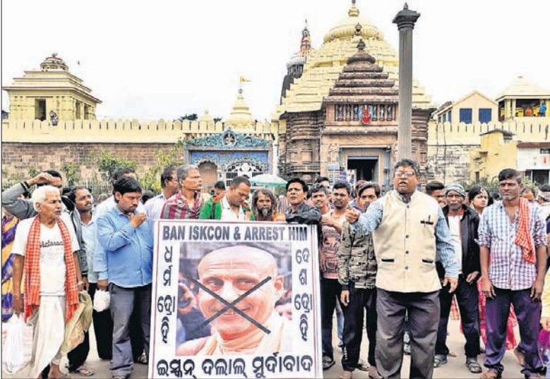
ସିଂହଦ୍ୱାର ସମ୍ମୁଖରେ ଶ୍ରୀଜଗନ୍ନାଥ ସେନା ପକ୍ଷରୁ ବିରୋଧ ପ୍ରଦର୍ଶନ କରାଯାଇଛି ।

ପୁରୀ ଅଧିକ, ୨୧୨ ଇନ୍ଦନ ପକ୍ଷରୁ ପୂର୍ଣ୍ଣାଙ୍ଗରେ ଗତ ଗୁରୁବାର ଅତିଥିଆ ରଥଯାତ୍ରା ଆରମ୍ଭ ହୋଇଥିଲା । ଏହା ଶ୍ରୀଜଗନ୍ନାଥ ସଂସ୍କୃତି ଓ ମହାପ୍ରଭୁଙ୍କ ପ୍ରତି ଅପମାନ ବୋଲି ଦର୍ଶାଯାଇ ଏତଲି ରଥଯାତ୍ରାକୁ ଓଡ଼ିଶାରେ ବିଶେଷକରି ଚତୁର୍ଦ୍ଧାବିଗ୍ରହଙ୍କ