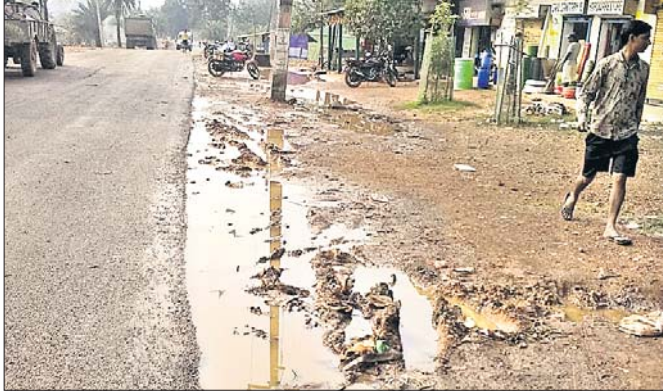
ଡ୍ରେନ ନ ଥିବାରୁ ବର୍ଷା ହେଲେ ପାଣି ଜମି ରହୁଛି ।