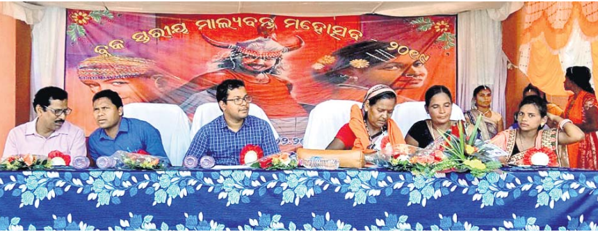
ଖଇରପୁଟରେ ବୁକସ୍ତରୀୟ ମାଲ୍ୟବନ୍ତ ଉତ୍ସବରେ ମଞ୍ଚାସନ ଅତିଥି।