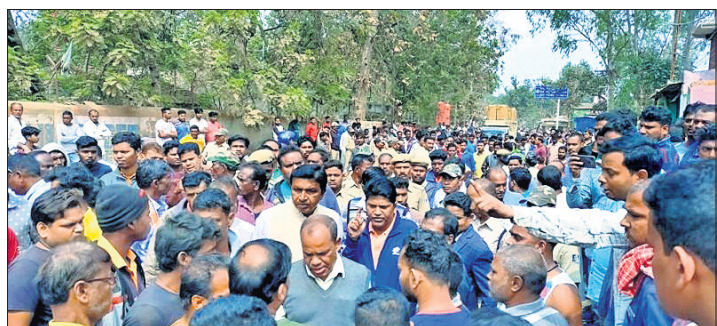
ଉଚ୍ଛେଦ ବେଳେ ଉପକଳାପାଳଙ୍କୁ ଲୋକମାନେ ଘେରାଇ କରିଛନ୍ତି ।