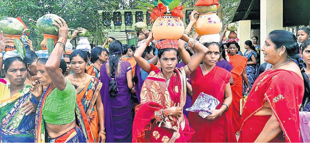
କଳସ ଶୋଭାଯାତ୍ରାରେ ସାମିଲ ହୋଇଥିବା ମହିଳାମାନେ।