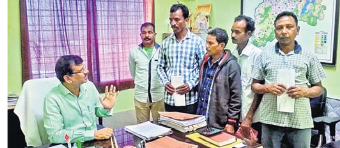
ରୋଷେୟାମାନେ ଜିଲା ମଙ୍ଗଳ ଅଧିକାରୀଙ୍କ ସହ ଆଲୋଚନା କରୁଛନ୍ତି।

ଜଣେ ଆହତ ହୋଇଥିଲେ । ଏହି କାର୍ଯ୍ୟରେ ଜଡିତ ବ୍ୟକ୍ତିମାନଙ୍କୁ ପୋଲିସ କେତେଦିନ ସୁରକ୍ଷା ଦେବ ବୋଲି ସେମାନେ ପ୍ରଶ୍ନ ଉଠାଇଛନ୍ତି । ଯୋଡ଼ାମ ଓ ଜାନ୍ତୁରାଳ ଗ୍ରାମରେ ଘଟିଥିବା ଘଟଣା ପାଇଁ ପୋଲିସ ସମ୍ପୂର୍ଣ୍ଣ ଦାୟୀ । ପୋଲିସ କମ୍ପାନୀ ପ୍ରତିଷ୍ଠାରେ ବିଚ୍ଛିନ୍ନାଞ୍ଚଳର ବିକାଶ ହେବନାହିଁ । ରାସ୍ତା ନିର୍ମାଣରେ ବିକାଶ ହୁଏନି ବୋଲି ପୋଷ୍ଟରରେ ଉଲ୍ଲେଖ କରାଯାଇଛି ।