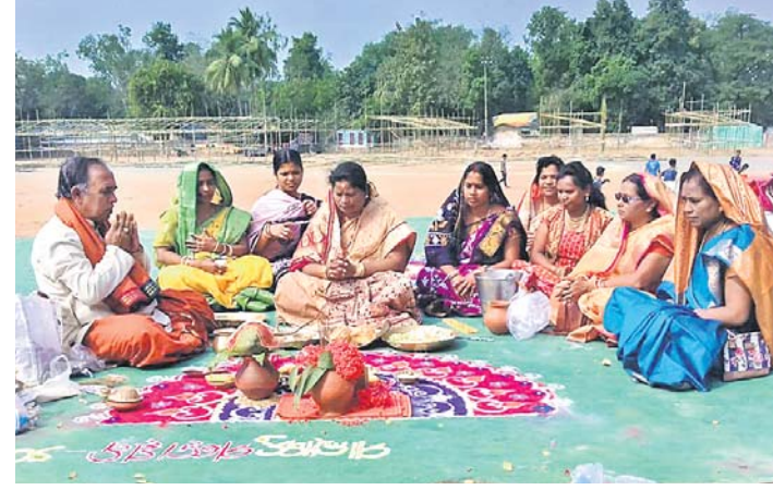
ମହିଳାମାନେ ମାଲ୍ୟବନ୍ତ ମଞ୍ଚପରେ ଭୂମି ପୂଜା କରୁଛନ୍ତି।