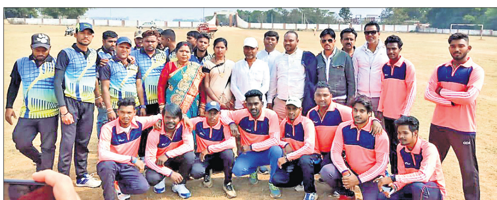
ଉଦ୍ଘାଟନ ଅବସରରେ ବିଧାୟକ, ଅତିଥି ଓ ଖେଳାଳିମାନେ ।