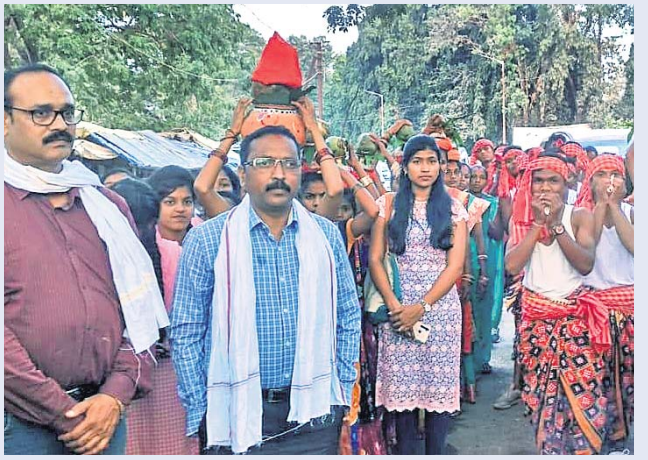
କଳସ ଶୋଭାଯାତ୍ରାକୁ ଶଙ୍ଖ ପୁଲ୍ ସାଗର କରାଯାଉଛି।

ମାଲକାନଗିରି ଜିଲାର ବହୁ ପ୍ରତୀକ୍ଷିତ ଗଣପର୍ବ ରବିବାର ଶୁଭାରମ୍ଭ ହୋଇଛି । ଓଡ଼ିଶାର ଶେଷ ସାମାଜିକ ତଥା ଛତିଶଗଡ଼ ଏବଂ ଆନ୍ଧ୍ରକୁ ଲାଗି ରହିଥିବା ସାବେରୀ, ସିଲେରୁ ଏବଂ ଗୋଦାବରୀ ନଦୀର ତ୍ରିବେଣୀ ସଙ୍ଗମ ଗୋଦାବରୀ ନଦୀରୁ ପବିତ୍ର ଜଳ ସଂଗ୍ରହ କରାଯାଇଛି । ପୂର୍ବି ପବଂରୁ ୧ ହଜାରରୁ ଊର୍ଦ୍ଧ୍ୱ ନୂତନ କଳସରେ କଳ ସଂଗ୍ରହ କରାଯାଇଛି । ତ୍ରିବେଣୀ ସଙ୍ଗମଠାରୁ ଏକ ଶୋଭାଯାତ୍ରାରେ ଆଦିବାସୀଙ୍କ ପାରମ୍ପରିକ ଲୋକ ନୃତ୍ୟ ଡେମ୍‌ସା, ଯାହା ବାଦ୍ୟ, ସିଙ୍ଗ ନାଚରେ ଗ୍ଲାମାୟ ଅଞ୍ଚଳ ପ୍ରକାଶିତ ହୋଇଥିଲା । ଏଥିରେ ପଡ଼ୋଶୀ ଛତିଶଗଡ଼ ଏବଂ ଆନ୍ଧ୍ରର ବହୁସଂଖ୍ୟାରେ ଗ୍ରାମବାସୀ ଅଂଗ୍ରହଣ କରିଥିଲେ । ବୁକସ୍ତରୀୟ ଓ ପବିତ୍ର ଶଙ୍ଖଧ୍ୱନିରେ ଶୋଭାଯାତ୍ରାରେ କଳସ