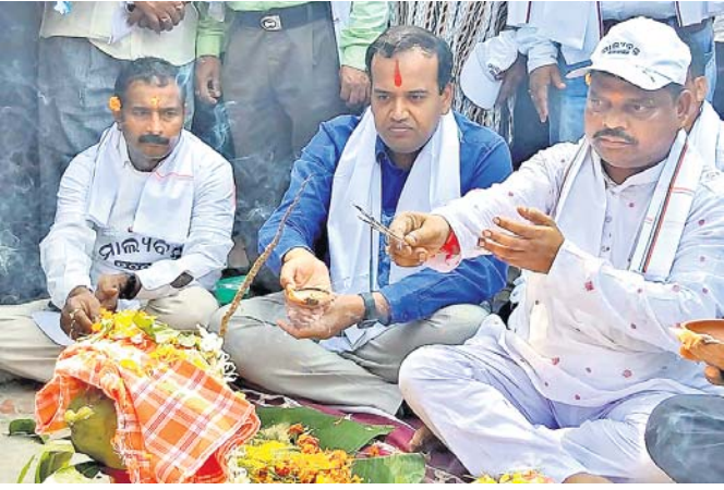
ମାଲ୍ୟବନ୍ତ ମହୋତ୍ସବ ଉଦ୍‌ଘାଟନ ଅବସରରେ ଜିଲାପାଳ ପୂଜାର୍ଚ୍ଚନା କରୁଛନ୍ତି।