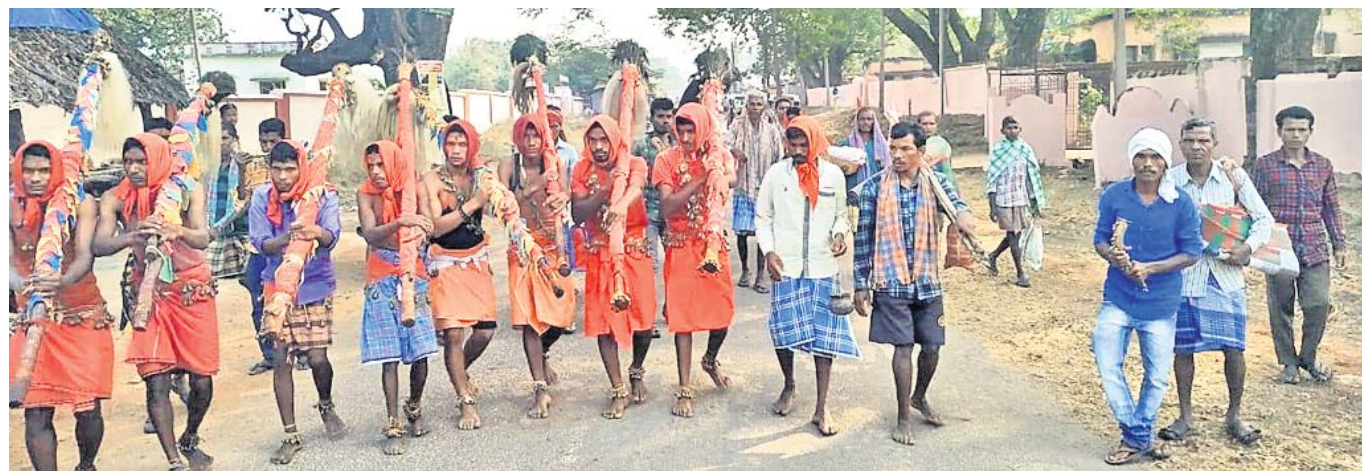
ମୋରୁ ପୁର୍ବି ପବଂରୁ ଲାଠିକୁ ଶୋଭାଯାତ୍ରାରେ ଧରି ଜଗନ୍ନାଥ ମନ୍ଦିରକୁ ନିଆଯାଉଛି।