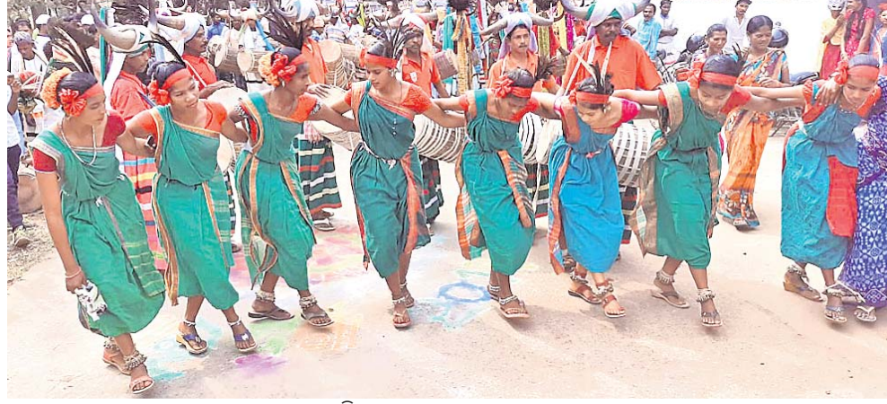
ଆଦିବାସୀ ମୁବତାକ ଡେମ୍‌ସା ନୃତ୍ୟ।