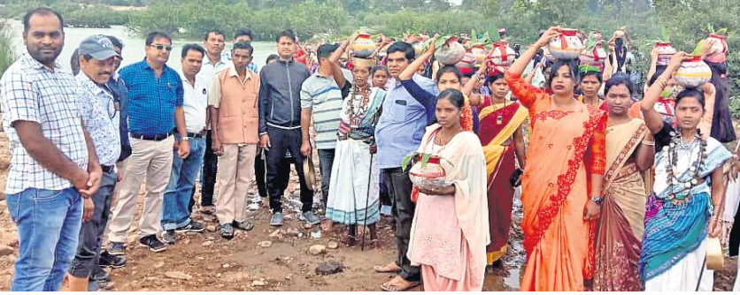
ପତିଆରେ ବାହାରିଥିବା କଳସ ଶୋଭାଯାତ୍ରା।