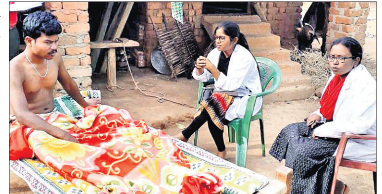
ଡାକ୍ତରୀ ଦଳ ରୋଗୀଙ୍କ ସାହାଯ୍ୟ ପ୍ରଦାନ କରୁଛନ୍ତି ।

ଅଧିକା ହେବ ଭାବି ନ ଖାଉଥିବାରୁ ସମସ୍ତଙ୍କୁ ଔଷଧ ଖୁଆଇ ଥିଲେ । ଲୋକଙ୍କୁ ଭୟଭିତ ନ ହେବା ପାଇଁ ପରାମର୍ଶ ଦେଇଥିଲେ । ଏଥିସହ ଲୋକଙ୍କୁ ସଚେତନ କରାଇଥିଲେ । ବର୍ତ୍ତମାନ ସ୍ଥିତି ନିୟନ୍ତ୍ରଣାଧୀନ ଥିବା ଡାକ୍ତରୀ ଦଳ କହିଛନ୍ତି । ଡାକ୍ତରୀ ଦଳ ସହ ସ୍ଥାନୀୟ ଆଶା, ସାମ୍ବଲକର୍ମୀମାନେ ଉପସ୍ଥିତ ଥିଲେ । ପ୍ରକାଶ ଆଉ କି ୨ ମାସ ତଳେ ଗାଦବା କଡ଼ରା ଗ୍ରାମରେ ମିଳି ମିଳା ଆରମ୍ଭ ହୋଇଥିଲା । ଲୋକେ ଧାନ ନ ଦେବା ଯୋଗୁଁ ତାହା ଆସ୍ତେ ଆସ୍ତେ ବ୍ୟାପିବାରେ ଲାଗିଛି ।