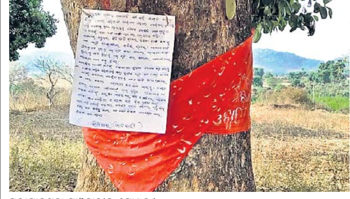
ମରାଯାଇଥିବା ମାଓବାଦୀଙ୍କ ପୋଷ୍ଟର।