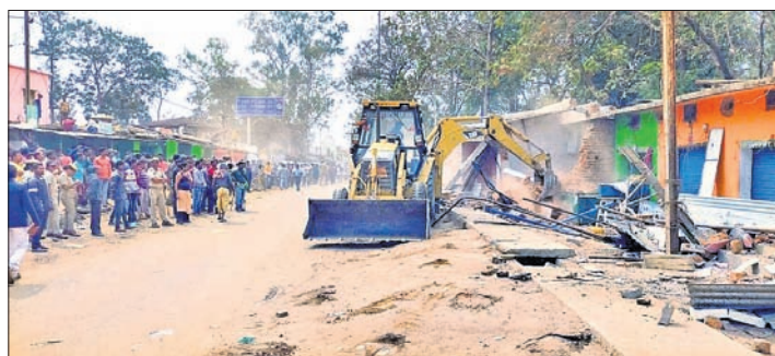
ଉଚ୍ଛେଦ କରାଯାଉଛି ।