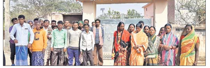
ପରିଚାଳନା କମିଟି ସଦସ୍ୟ ବିଦ୍ୟାଳୟ ଫାଟକରେ ତାଲା ପକାଇ ପ୍ରତିବାଦ କରୁଛନ୍ତି।

ଆନନ୍ଦପୁର, ୩।୨ (ସ୍ୱ.ପ୍ର.)- ଉପପୂର୍ଣ୍ଣା ଲୁକ୍ ଚମାରପଣ୍ଡିତ ଗୋପିନାଥପୁର ଆଶ୍ରମ ବିଦ୍ୟାଳୟରେ ସୋମବାର ପରିଚାଳନା କମିଟି ସଦସ୍ୟମାନେ ତାଲା ପକାଇ ପ୍ରତିବାଦ ଜଣାଇଥିଲେ। ବିଦ୍ୟାଳୟ ଆରମ୍ଭ ହେବାର ଯଥେଷ୍ଟ ବିଳମ୍ବରେ ତିନି ଜଣ ଶିକ୍ଷକଙ୍କୁ ବିଦ୍ୟାଳୟକୁ ଆସିବାକୁ ପରିଚାଳନା କମିଟିର ସଦସ୍ୟମାନେ ବିଦ୍ୟାଳୟ ଗେଟରେ ତାଲା ପକାଇଦେଇଥିଲେ। ଫଳରେ ବହୁ ସମୟ ଧରି ଧରି ଶିକ୍ଷକମାନଙ୍କୁ ବାହାରେ ସଂସାଧନ ପଡ଼ିଥିଲା। ଘଟଣାର ଖବର ପାଇ ଗଣମାଧ୍ୟମ ପ୍ରତିନିଧିମାନେ ଆଶ୍ରମ ବିଦ୍ୟାଳୟ ନିକଟରେ ପହଞ୍ଚିବା ପରେ ପରିଚାଳନା କମିଟି ସଦସ୍ୟମାନେ ଆଶ୍ରମ ବିଦ୍ୟାଳୟରେ ହେଉଥିବା ବହୁ ଅନିୟମିତତା ସମ୍ପର୍କରେ ସୂଚନା ଦେଇଥିଲେ। ବିଦ୍ୟାଳୟର ନୂତନ ପରିଚାଳନା କମିଟି ଦୀର୍ଘ ୫ ମାସ ହେବ କରାଯାଇଥିଲେ ମଧ୍ୟ ଏହାକୁ କାର୍ଯ୍ୟକାରୀ କରାଯାଇ ନ ଥିବା, ବିଦ୍ୟାଳୟର ଉନ୍ନୟନ ପାଇଁ ପରିଚାଳନା କମିଟିର ପରାମର୍ଶ ନିଆ ନ ଯିବା, ଛାତ୍ରା ନିବାସ ଦାୟିତ୍ୱରେ ଜଣେ