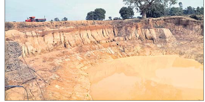
ତାଳଭରସନ ରାସ୍ତା ପାର୍ଶ୍ୱରେ ବିରାଟ ଗାତ ।

ଝୁମୁରା ଲୁକ୍ ଅନ୍ତର୍ଗତ ଝୁମୁରା-ଉଖୁଣ୍ଡା ରାସ୍ତାର ଝୁମୁରା ଲୁକ୍ ଓ ତହସିଲ କାର୍ଯ୍ୟାଳୟର ଅନତି ଦୂରରେ ପୂର୍ବ ବିଭାଗ ଦ୍ୱାରା ପୋଲ ନିର୍ମାଣ ପାଇଁ ବିରାଟ ଗାତ ଖୋଳାଯାଇଛି । ତେବେ ଫାଇଣେଣ୍ଡ ଗାତ ଖୋଳାଯିବାର ୧୨ବର୍ଷ ଅତିକ୍ରମ ହୋଇଥିଲେ ହେଁ ପୂର୍ବ ବିଭାଗ ପୋଲ ନିର୍ମାଣ କରିବା ପାଇଁ ଧ୍ୟାନ ଦେଉନାହିଁ । ପୋଲ ପାର୍ଶ୍ୱକୁ ନିର୍ମିତ ହୋଇଥିବା ତାଳଭରସନ ମଧ୍ୟ ବିପଦସଙ୍କୁଳ । ମାଟି, ମୋରମରେ ତାଳଭରସନ ନିର୍ମିତ ହୋଇଥିବାରୁ ଖରାବେଳେ ପ୍ରବଳ ଧୂଳି, ବର୍ଷା ହେଲେ କାଦୁଅ ପୁଣି ତାଳଭରସନ ରାସ୍ତାର ସବୁ କାମରେ ଖାଲି ପୋଲ ନିର୍ମାଣ ପାଇଁ କରାଯାଇଥିବା ଗାତ ପାର୍ଶ୍ୱରେ ସୁରକ୍ଷା ବାଡ଼ି ନାହିଁ । ସାଧାରଣ ପଥଚାରୀ ଏବଂ ବାଇକ୍ ଆରୋହୀଙ୍କ ପାଇଁ ତାଳଭରସନ ରାସ୍ତାର ୨ ପାର୍ଶ୍ୱ ମୃତ ଗାତ ସଦୃଶ । ଏଥିପାଇଁ ପ୍ରତ୍ୟହ ଦୁର୍ଘଟଣା ଘଟୁଛି । ସୂଚନା ଅନୁଯାୟୀ, ଚେଣ୍ଡରଧାରୀ ଏହି ରାସ୍ତାର ୨ପାର୍ଶ୍ୱ ସୁରକ୍ଷା ବାଡ଼ି ଦେବା ସହିତ ରାସ୍ତା ପିଚୁ କରିବା