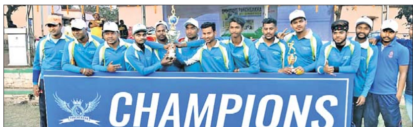
ପଞ୍ଚସଖା କ୍ରିକେଟ୍ ଚୁନାମେଣ୍ଟରେ ବିଜେତା ବିରିକଳା ଦଳ ।

କେନ୍ଦୁଝର ଜିଲା ଯୋଡ଼ା ବୁଲ୍ ଅନ୍ତର୍ଗତ ବିଲେଇପଦାଠାରେ ଚାଟାଝିଲ ଲଙ୍ଗ ପ୍ରତିଯୋଗିତା ଆୟୋଜିତ ପଞ୍ଚସଖା କ୍ରିକେଟ୍ ଚୁନାମେଣ୍ଟ ଯୋଗଦାନରେ ଉଦ୍‌ଯାପିତ ହୋଇଯାଇଛି । ଏହି ଚୁନାମେଣ୍ଟରେ ଯୋଡ଼ା ବୁଲ୍ ଅଧିକାରୀ, ବିରିକଳା, ଚମ୍ପୁଆ, ଦେଓଝର ଏବଂ କଣ୍ଠା ପଞ୍ଚାୟତର ଖେଳାଳିମାନଙ୍କୁ ନେଇ ଗଠନ କରାଯାଇଥିବା ଦଳ ଚୁଡ଼ିକ ମଧ୍ୟରେ କ୍ରିକେଟ୍ ମ୍ୟାଚ୍ ପ୍ରତିଯୋଗିତା ଅନୁଷ୍ଠିତ ହୋଇଥିଲା । ପାଇନାଲ ମ୍ୟାଚ୍‌ରେ ବିରିକଳା ପଞ୍ଚାୟତ ପ୍ରଥମେ ବ୍ୟାଟିଂ କରି ୧୫ ଓଭରରେ ୨୦୨ ରନ୍ ସଂଗ୍ରହ କରି ପାଇନାଲରେ ବିଜୟୀ ହୋଇଥିଲା । ଜବାବରେ ଦେଓଝର ପଞ୍ଚାୟତ ଦଳ ୧୫ ଓଭରରେ ୧୬୨