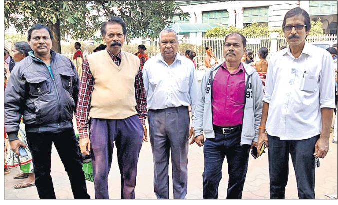
ଜିଲାପାଳଙ୍କୁ ଅଭିଯୋଗ ଜଣାଇବାକୁ ଆସିଥିବା ସ୍ଥାନୀୟ ବାସିନ୍ଦା ।

କେନ୍ଦୁଝର ଜିଲାର ଅବହେଳିତ ଚମ୍ପୁଆ ଉପଖଣ୍ଡରେ ପ୍ରସ୍ତାବିତ କେନ୍ଦ୍ରୀୟ ବିଦ୍ୟାଳୟ ସ୍ଥାପନାରେ ବିଳମ୍ବ ଘଟୁଥିବାରୁ ଅସନ୍ତୋଷ ଦେଖାଦେଇଛି । ସ୍ଥାନ ନିରୁପଣ ଓ ଜମି ଚିହ୍ନଟରେ ବିଳମ୍ବ ଘଟୁଥିବାରୁ ଏହାର ସ୍ଥାପନାରେ ବିଳମ୍ବ ଘଟୁଛି । ଏଣୁ ତୁରନ୍ତ ଜମି ଚିହ୍ନଟ କରି ବିଦ୍ୟାଳୟ ନିର୍ମାଣ କରିବା ଏବଂ ସେ ପର୍ଯ୍ୟନ୍ତ ଅସ୍ଥାୟୀ ଭାବେ ଏହି ବିଦ୍ୟାଳୟ ଅନ୍ୟ ସ୍ଥାନରେ ଖୋଲି ପାଠପଢ଼ା ଆରମ୍ଭ କରିବାକୁ ସ୍ଥାନୀୟ ଅଞ୍ଚଳବାସୀ ବାରମ୍ବାର ଦାବି କରିଆସୁଥିଲେ ହେଁ କାର୍ଯ୍ୟକାରୀ ହୋଇପାରୁନଥିବାରୁ ଅସନ୍ତୋଷ ବୃଦ୍ଧି ପାଇବାରେ ଲାଗୁଛି । ଏଣୁ ଏନେଇ ପୂର୍ବରୁ ଜିଲାପାଳଙ୍କ ଅଭିଯୋଗ ପ୍ରକୋଷ୍ଠରେ ଲିଖିତ ଜଣାଯାଇଥିଲେ ମଧ୍ୟ ସାମାଜିକ ସୁଖି ଅଧିକ ସ୍ଥାନୀୟ ଲୋକ ଲିଖିତ ଭାବେ ଜଣାଇଛନ୍ତି । ବିଦ୍ୟାଳୟ ତୁରନ୍ତ ନ ଖୋଲିଲେ ଏହି