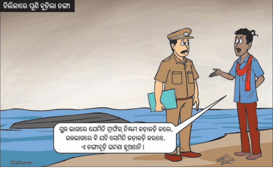
ସ୍ଥଳ ଭାଗରେ ଯେମିତି ଟ୍ରାଫିକ୍ ନିୟମ କଡ଼ାକଡ଼ି କଲେ, ଜଳଭାଗରେ ବି ଯଦି ସେମିତି କଡ଼ାକଡ଼ି କରାଗେ, ଏ ଡଙ୍ଗାବୁଡ଼ି ଘଟଣା ହୁଅନ୍ତାନ୍ତି ।