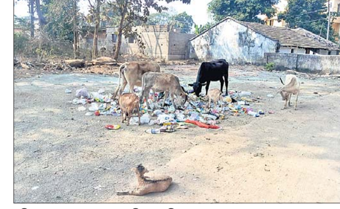
ଅଧିକା ଗବାରେ ଖାଦ୍ୟ ଖୋଜୁଛନ୍ତି ଗୁହପାଳିତ ପ୍ରାଣୀ।