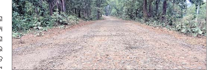
ଛାମୁଖୁଆ ସିରିଆବାହାଳ ରାସ୍ତା ଶୋଚନୀୟ ।

ତେଲକୋଇ ଅଞ୍ଚଳରେ ବହୁ ରାସ୍ତା ନିର୍ମାଣ ହେଉଛି । ତେବେ ନିମ୍ନ ମାନର କାର୍ଯ୍ୟ ସାଙ୍ଗକୁ ଉଚ୍ଚ ରାସ୍ତାର ରକ୍ଷଣା ବେକ୍ଷଣ ଅଭାବ ଯୋଗୁ ଯାତାୟାତରେ ଗୁରୁତର ବାଧା ସୃଷ୍ଟି ହେଉଛି । ଛାମୁଖୁଆ ପଞ୍ଚାୟତ ପୁଞ୍ଜ୍ୟାଳୟଠାରୁ ସିରିଆବାହାଳ ଦେଇ ୪୯ ନଂ ଜାତୀୟ ସଂଯୋଗ ପାଇଁ ଶି.ନି. ରାସ୍ତା ରହିଛି । ଏହି ରାସ୍ତା ପ୍ରଧାନ ମନ୍ତ୍ରୀ ସତକ ଯୋଜନାରେ ନିର୍ମାଣ କରାଯାଇଥିଲା । ତେବେ ରାସ୍ତାକୁ ପିଚୁ ଉଠି ମେଟାଲ ରାସ୍ତା ସାଧା ବିଛାଇ ପଡ଼ିଥିବା ଯୋଗୁ ଯାତାୟାତ କରିହେଉନାହିଁ । ଏହି ରାସ୍ତା ଉପରେ ଛାମୁଖୁଆ ପଞ୍ଚାୟତ ସମେତ ବୋଇଲାପାଳ