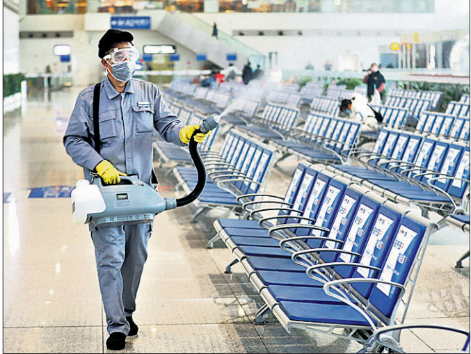
ଚାଲନା ବିଆଣ୍ଟିସୁ ପ୍ରଦେଶ ଅନ୍ତର୍ଗତ ନାନିଆଳ ରେଳ ଷ୍ଟେସନ ପ୍ରତୀକ୍ଷାକର୍ମକୁ ବିଶେଷଣ କରାଯାଇଛି।

ପ୍ରାଣୀଠାରୁ ସୃଷ୍ଟି ମାତାମତ୍ କରୋନା ଭୂତାଣୁକୁ ନେଇ ସାରା ବିଶ୍ଵରେ ଆତଙ୍କ ଖେଳିଯାଇଛି। ଏହାର କେନ୍ଦ୍ରସ୍ଥଳ କୁହାଯାଉଥିବା ଚାଲନା ଉତ୍ତର ସହରକୁ ନେଇ ଏବେ ଏକ ନୂଆ ତଥ୍ୟ ପ୍ରକାଶ ପାଇଛି। ଯେଉଁଠାରୁ ଏହି ଭୂତାଣୁ ଜୈବିକ ମୁଦ୍ରାସ୍ରୁ କାର୍ଯ୍ୟକ୍ରମ ଚଳାଇଥିଲା। ସେହି ଗବେଷଣାଗାରରୁ ଉକ୍ତ ଭୂତାଣୁ ବାହାରି ଆସିଥିବା ସନ୍ଦେହ କରାଯାଇଛି। ଇସ୍ରାଏଲର ଜଣେ ଜୈବଅଣୁ ବିଶେଷଜ୍ଞଙ୍କ ସୂଚନାକୁ ଆଧାର କରି ଏକ ବୈଦେଶିକ ଗଣମାଧ୍ୟମ ଏହା ପ୍ରକାଶ କରିଛି। ଉକ୍ତ ରିପୋର୍ଟ ଅନୁଯାୟୀ, ରେଡିଓ ଫ୍ରି ଏସିଆ ଗତ ସପ୍ତାହରେ ଉତ୍ତର ଚେଲିଜିଜନର ୨୦୧୫ ରିପୋର୍ଟକୁ ପୁନଃପ୍ରସାରଣ କରିଥିଲା। ଚାଲନାର ଅତ୍ୟାଧୁନିକ ଭୂତାଣୁ ଗବେଷଣା ଲାବରେଟୋରୀ 'ଉତ୍ତର ଇନ୍ଡିୟାନ୍ ଅଫ୍ ଭାଇରୋଲୋଜି' ଏଥିରେ ପ୍ରଦର୍ଶିତ ହୋଇଥିଲା। ଚାଲନାରେ ମାତାମତ୍ ଭୂତାଣୁ ଉପରେ କାର୍ଯ୍ୟ କରିବା ପାଇଁ ଏହା ଏକମାତ୍ର ସକ୍ଷମ ଗବେଷଣାଗାର ଘୋଷିତ ହୋଇଛି। ସେଠାର ଜୈବିକ