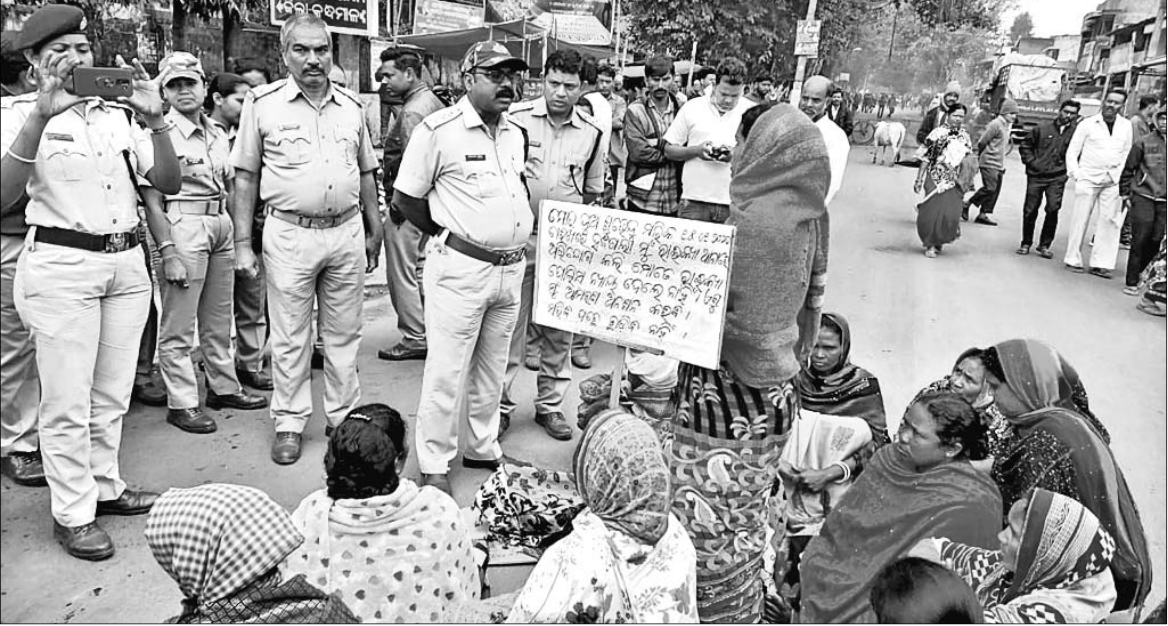
ଉତ୍ତମ ଲୋକଙ୍କୁ ପୋଲିସ୍ ବୁଝାଶୁଣା କରୁଛି ।