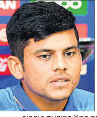
ଭାରତୀୟ ଅଧିନାୟକ ପ୍ରସିଦ୍ଧ ଗର୍ଲ୍ସ

ହାଇଭୋଲ୍ଟରେ ପୂଜାବିଳାରେ ଡିଫେଣ୍ଡିଂ ଚାମ୍ପିୟନ ଭାରତୀୟ ଦଳ ଚିରପ୍ରତିଦ୍ୱନ୍ଦ୍ୱୀ ପାକିସ୍ତାନକୁ ଭେଟିବ। ବର୍ତ୍ତମାନ ଦୁଇ ଚୁନାମେଣ୍ଟରେ ଅପରାଜେୟ ରହିଥିବା ପ୍ରସିଦ୍ଧ ଗର୍ଲ୍ସ ନେତୃତ୍ୱାଧୀନ ଭାରତୀୟ ଦଳ ମଙ୍ଗଳବାର ମ୍ୟାଚରେ ପାକିସ୍ତାନକୁ ହରାଇ ଲଗାତର ୩ୟଥର ଲାଗି ଫାଇନାଲ ଖେଳିବା ଲକ୍ଷ୍ୟରେ ରହିଛି। ଅପରପକ୍ଷେ ପାକିସ୍ତାନ ମଧ୍ୟ ଭାରତକୁ ହରାଇ ଏହାର ଅପରାଜେୟ ଧାରାକୁ ବଜାୟ ରଖିବାକୁ ଲକ୍ଷ୍ୟ ରଖିଛି।