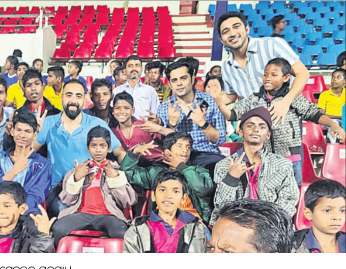
ପୁରୁବଲ୍ ମ୍ୟାର ଦେଖୁଥିବା ପିଲାଙ୍କ ସହ ରାଉତ୍ସେଟୁଲର ସଦସ୍ୟ।

ଭୁବନେଶ୍ୱର, ୪୧୨ (ବୁଧବାର) ରାଉତ୍ସେଟୁଲ ଇଣ୍ଡିଆ (ଆର୍ଟିଆଇ)ର ଭୁବନେଶ୍ୱର ସରକାରୀ ରାଉତ୍ସେଟୁଲ ୫୩୨ର ସଦସ୍ୟ ତଥା ଗାଦିଲମାନେ ୩୦୦ ଆର୍ଥିକ ଅନୁଗ୍ରହ ପିଲାଙ୍କୁ କଳିଙ୍ଗ ଷ୍ଟାଡ଼ିୟମରେ ଆୟୋଜିତ ଇଣ୍ଡିଆନ୍ ପୁରୁବଲ୍ (ଆଇଏସ୍ଏଲ୍) ମ୍ୟାର ଦେଖାଇଛନ୍ତି। ଓଡ଼ିଶା ପୁରୁବଲ୍ କ୍ଲବ୍ ଏବଂ ଗୋଆ ପୁରୁବଲ୍ କ୍ଲବ୍ ମଧ୍ୟରେ ହୋଇଥିବା ଏହି ମ୍ୟାରକୁ ପିଲାମାନେ ଭେଣ୍ଟି ଆଗ୍ରହର ସହ ଦେଖୁଥିଲେ। କମ୍ପାନିର ସରକାରୀ କାର୍ଯ୍ୟକ୍ରମର ଅଂଶବିଶେଷ ଭାବେ ଆର୍ଟିଆଇ ପକ୍ଷରୁ ଏହି କାର୍ଯ୍ୟକ୍ରମ ଆୟୋଜନ କରାଯାଇଥିଲା। ଭାରତର ୧୧୯ ସହରରେ ରାଉତ୍ସେଟୁଲ ଇଣ୍ଡିଆର ପ୍ରାୟ ୩୨୫ ଟେବୁଲ୍ ରହିଥିବାବେଳେ ଏଥିରେ ବ୍ୟବସାୟୀ, ଉଦ୍ୟୋଗୀ, ଚେନ୍ନୋଗ୍ରାଡ଼ ଏବଂ ଅନ୍ୟାନ୍ୟ ପେସାଦାରମାନେ ସଦସ୍ୟଭାବେ ରହିଛନ୍ତି। ରାଉତ୍ସେଟୁଲ ଇଣ୍ଡିଆ ୧୭ ଅଞ୍ଚଳରେ ବିଭକ୍ତ ଏବଂ ଏହାର ପ୍ରତି ଅଞ୍ଚଳର ନିଜସ୍ୱ ବୋର୍ଡ ରହିଛି। ଏହାର ସଦସ୍ୟମାନେ ସମାଜର ମଙ୍ଗଳ ଦିଗରେ ସେବା ପ୍ରଦାନ କରିଥାନ୍ତି।