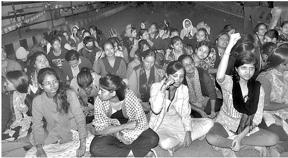
କାର୍ଯ୍ୟାନୁଷ୍ଠାନ ଦାବିରେ ଛାତ୍ରମାନେ ରାସ୍ତା ଅବରୋଧ କରିଛନ୍ତି।

ମୋବାଇଲ ଫୋନ୍ ଲୁଚାଇବା ବେଳେ ପ୍ରତିରୋଧ କରୁଥିବା ଡାକ୍ତରୀ ଛାତ୍ରମାନେ ଡାକ୍ତରୀ ଛାତ୍ରମାନଙ୍କୁ ଆହତ କରିଛନ୍ତି।