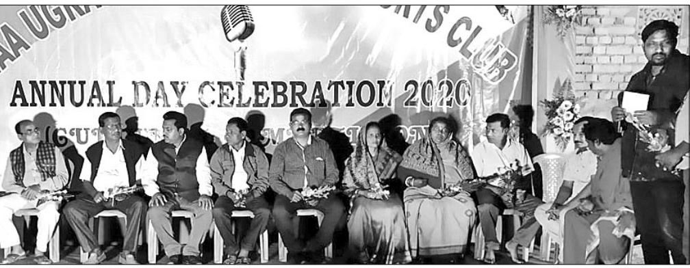
ବାର୍ଷିକୋତ୍ସବରେ ଯୋଗଦେଇଥିବା ଅତିଥି ଓ ଅନ୍ୟମାନେ।