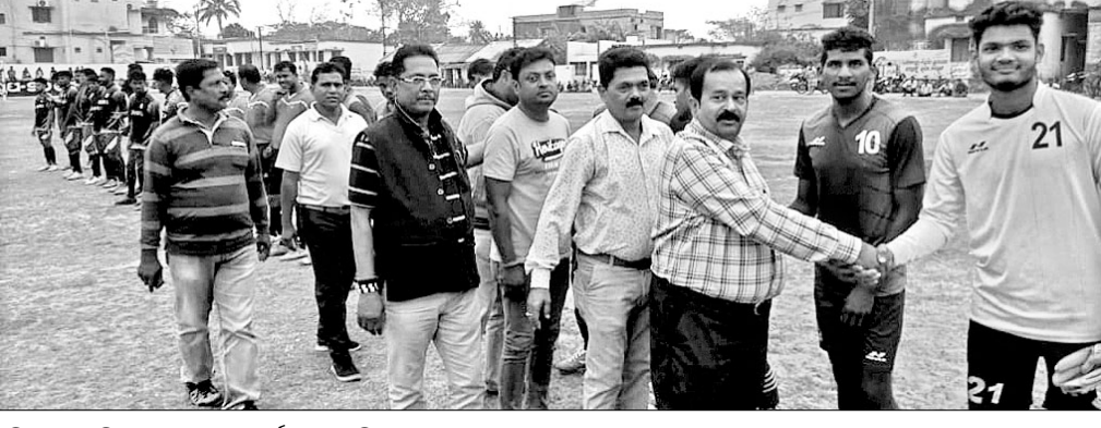
ଅତିଥି ଖେଳାଳିମାନଙ୍କ ସହ କରମର୍ଦ୍ଦନ କରୁଛନ୍ତି।