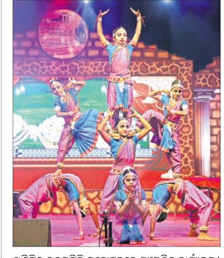
ଖଣ୍ଡଗିରି ଉଦୟଗିରି ମହୋତ୍ସବରେ ସାଂସ୍କୃତିକ କାର୍ଯ୍ୟକ୍ରମ।

ଭୁବନେଶ୍ୱର, ୪୧୨ (ବୁଧବାର) ରାଜ୍ୟ ଏବଂ ରାଜ୍ୟ ବାହାରୁ ଆସିଥିବା ସାଧୁସଭାମାନେ ଆସି ପହଞ୍ଚିଛନ୍ତି ଖଣ୍ଡଗିରି ମାଘ ମେଳାରେ। ଜଗତର ମଙ୍ଗଳ ପାଇଁ ଏହି ସଭାମାନେ ଖଣ୍ଡଗିରି ଉଦୟଗିରି ଗୁମ୍ଫାରେ ତପସ୍ୟା କରୁଥିବାବେଳେ ସେମାନଙ୍କ ଦର୍ଶନ କରି ପୁଣ୍ୟ ଅର୍ଜନ କରିବାକୁ ଭିଡ଼ ଜମାଉଛନ୍ତି ସାଧାରଣ ଲୋକେ। ମଙ୍ଗଳବାର ମେଳାର ୪ର୍ଥ ଦିନରେ ହୋମଯଜ୍ଞ ସହ ପୂଜାର୍ଚ୍ଚନା ଆରମ୍ଭ ହୋଇଛି। ପୂର୍ବପୁରୁଷରୁ ଚାଲି ଆସୁଥିବା ପ୍ରଥାକୁ ବଜାୟ ରଖି ଲୋକେ ହୋମଯଜ୍ଞ କରିବା ସହ ଅନନ୍ତପ୍ର ମାଧ୍ୟମରେ ମାଗଣାରେ ଖାଦ୍ୟ ବନ୍ଧନ କରୁଛନ୍ତି। ଏହା ଆସନ୍ତା ଅଗାଧା ପୂର୍ଣ୍ଣିମା ପର୍ଯ୍ୟନ୍ତ ଚାଲିବାକୁ ଥିବାବେଳେ