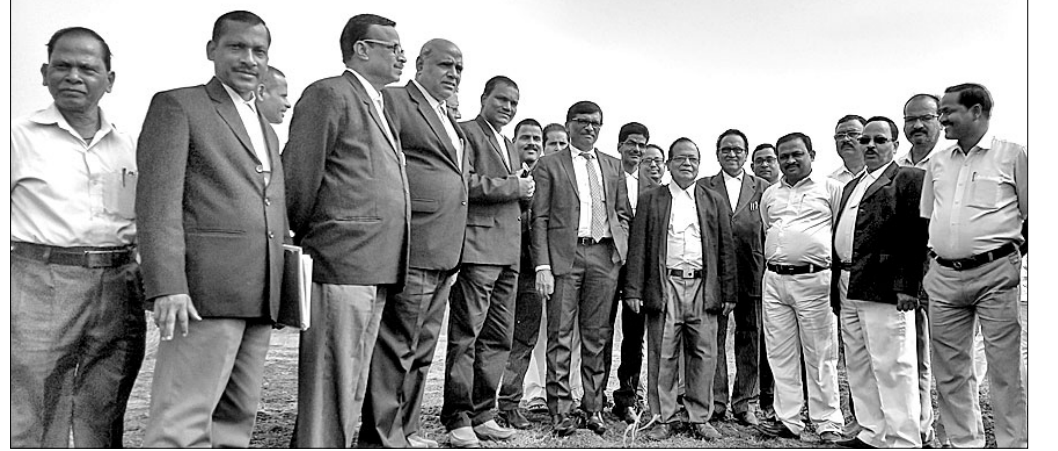
ଜିଲ୍ଲା ଦୌରାଜକ୍ଷଙ୍କ ସହ ଆଠଗଡ଼ ଆଇନଜୀବୀ ଓ ଅନ୍ୟମାନେ।