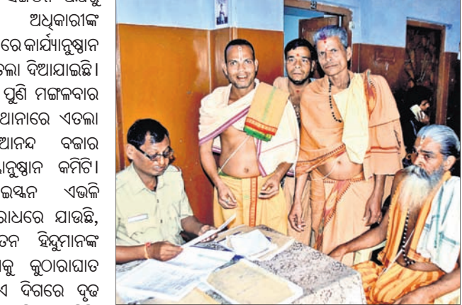
ଆନନ୍ଦ ବଜାର ବ୍ରାହ୍ମଣ କ୍ରିୟାନୁଷ୍ଠାନ କମିଟିର କର୍ମକର୍ତ୍ତା ଏତଲା ଦେଉଛନ୍ତି।

ପୁରୀ ଅଫିସ, ୪୧୨: ଲକ୍ଷ୍ମଣ ପକ୍ଷରୁ ଅତିଥିରେ ମୁମ୍ବାଇରେ ଅନୁଷ୍ଠିତ ରଥଯାତ୍ରାକୁ ନେଇ ପ୍ରତିବାଦ ତୀବ୍ର ହେବାରେ ଲାଗିଛି। ବିଶେଷକରି ପୁରୀରେ ଏହାକୁ ଘୋର ବିରୋଧ କରାଯାଇଛି। ବାରମ୍ବାର ଲକ୍ଷ୍ମଣ ବିଧି ପରମ୍ପରାକୁ ବେଶ୍ ଚିତ୍ତ କରୁଥିବା ଶ୍ରୀମନ୍ଦିର ସେବାୟତ, ଭକ୍ତ, ବୁଦ୍ଧିଜୀବୀ, ଗବେଷକଙ୍କ ସମେତ ବିଭିନ୍ନ ସଙ୍ଗଠନ ଦୃଢ଼ ନିନ୍ଦା କରୁଛନ୍ତି। ବିଭିନ୍ନ ସଙ୍ଗଠନ ପକ୍ଷରୁ ଲକ୍ଷ୍ମଣ ଅଧିକାରୀଙ୍କ ବିରୋଧରେ କାର୍ଯ୍ୟାନୁଷ୍ଠାନ ପାଇଁ ଏତଲା ଦିଆଯାଇଛି। ଏ ନେଇ ପୁଣି ମଙ୍ଗଳବାର ସିଂହଦ୍ୱାର ଆନରେ ଏତଲା ଦେଇଛି ଆନନ୍ଦ ବଜାର ବ୍ରାହ୍ମଣ କ୍ରିୟାନୁଷ୍ଠାନ କମିଟି। ବାରମ୍ବାର ଲକ୍ଷ୍ମଣ ଏଭଳି ପରମ୍ପରା ବିରୋଧରେ ଯାଉଛି, ଯାହାକି ସନାତନ ହିନ୍ଦୁମାନଙ୍କ ଧାର୍ମିକ ଭାବନାକୁ କ୍ରୋଧାଗାତ କରୁଛି। ତେଣୁ ଏ ଦିଗରେ ଦୃଢ଼ କାର୍ଯ୍ୟାନୁଷ୍ଠାନ ଗ୍ରହଣ କରିବାକୁ କମିଟି ପକ୍ଷରୁ ଏତଲାରେ ଦର୍ଶାଯାଇଛି।