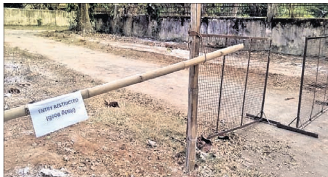
ସିଲ୍ କରାଯାଇଥିବା ଓୟୁଏଟି କୁକୁଡ଼ା ଫାର୍ମ।