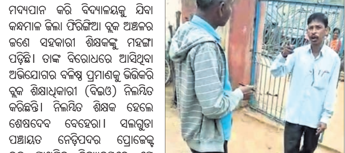
ସିଆରସିଏସିଏ ସହ ସହକାରୀ ଶିକ୍ଷକ ନିଲମ୍ବିତ କୁକୁଡ଼ା ଫାର୍ମରେ।

ସରକାରଙ୍କ ପକ୍ଷରୁ ୧୨ ଡିଗ୍ରୀ କାର୍ଯ୍ୟକାରୀ ବଳ (ରାପିଡ୍ ରେସପନ୍ସିଭ୍) ନିୟୁତ ହୋଇଥିଲା। ଡିଗ୍ରୀ ୧ ବଳ କୁକୁଡ଼ାମାନେ କାର୍ଯ୍ୟରେ ନିୟୋଜିତ ଥିବାବେଳେ ଅନ୍ୟ ୫ ବଳ ନିରୀକ୍ଷଣ ଅଞ୍ଚଳରେ ରୋଗ ନିୟନ୍ତ୍ରଣ କାର୍ଯ୍ୟରେ ନିୟୋଜିତ ଥିଲେ।