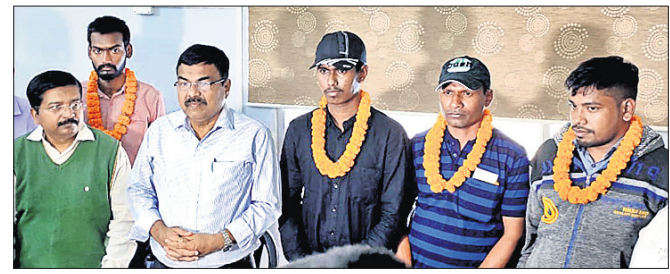
ଭୁବନେଶ୍ୱର, ୪୧୨ (ବୁଧବାର) ପଚନାୟକଙ୍କୁ ଧନ୍ୟବାଦ ଜଣାଇଛନ୍ତି

ଦୁବାଇରେ ପଞ୍ଚିଥିବା ଓଡ଼ିଆ ମୁରକମାନଙ୍କୁ ଉଦ୍ଧାର କରିବା ପାଇଁ ଦୁବାଇରୁ ଉଦ୍ଧାର ହୋଇଥିବା ଏହି ୪ ମୁରକ ମନୁଷ୍ୟମାନଙ୍କୁ ଭୁବନେଶ୍ୱରରେ ପହଞ୍ଚିବା ପରେ ତାଙ୍କୁ ଗୌରବ ସହ ପଞ୍ଚନାୟକଙ୍କୁ ଧନ୍ୟବାଦ ଜଣାଇଛନ୍ତି।