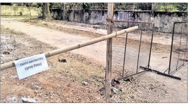
ସିଲ୍ କରାଯାଇଥିବା ଓୟୁଏଚି କୁକୁଡ଼ା ଫାର୍ମ ।